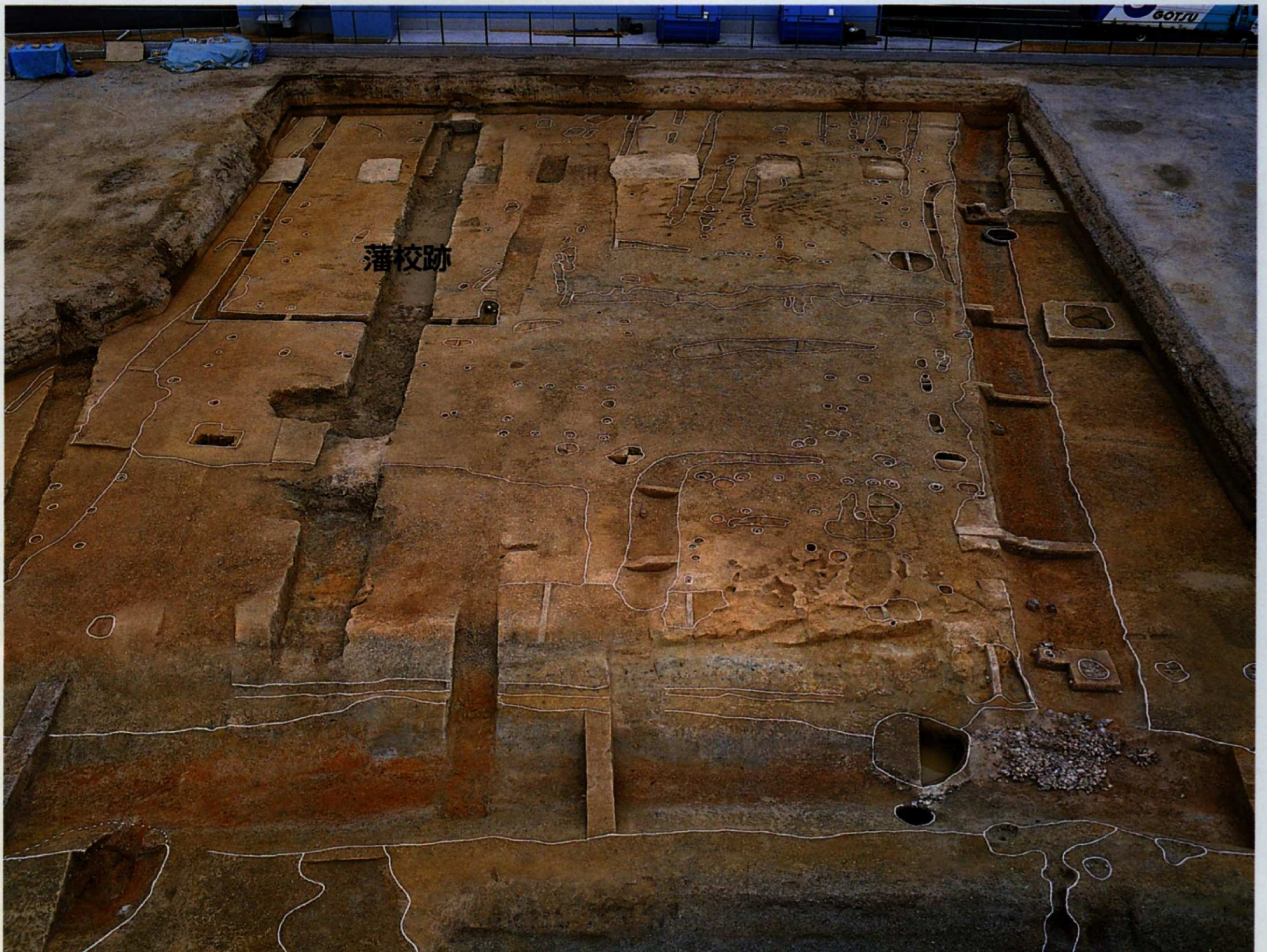
▲発掘調査地区全景