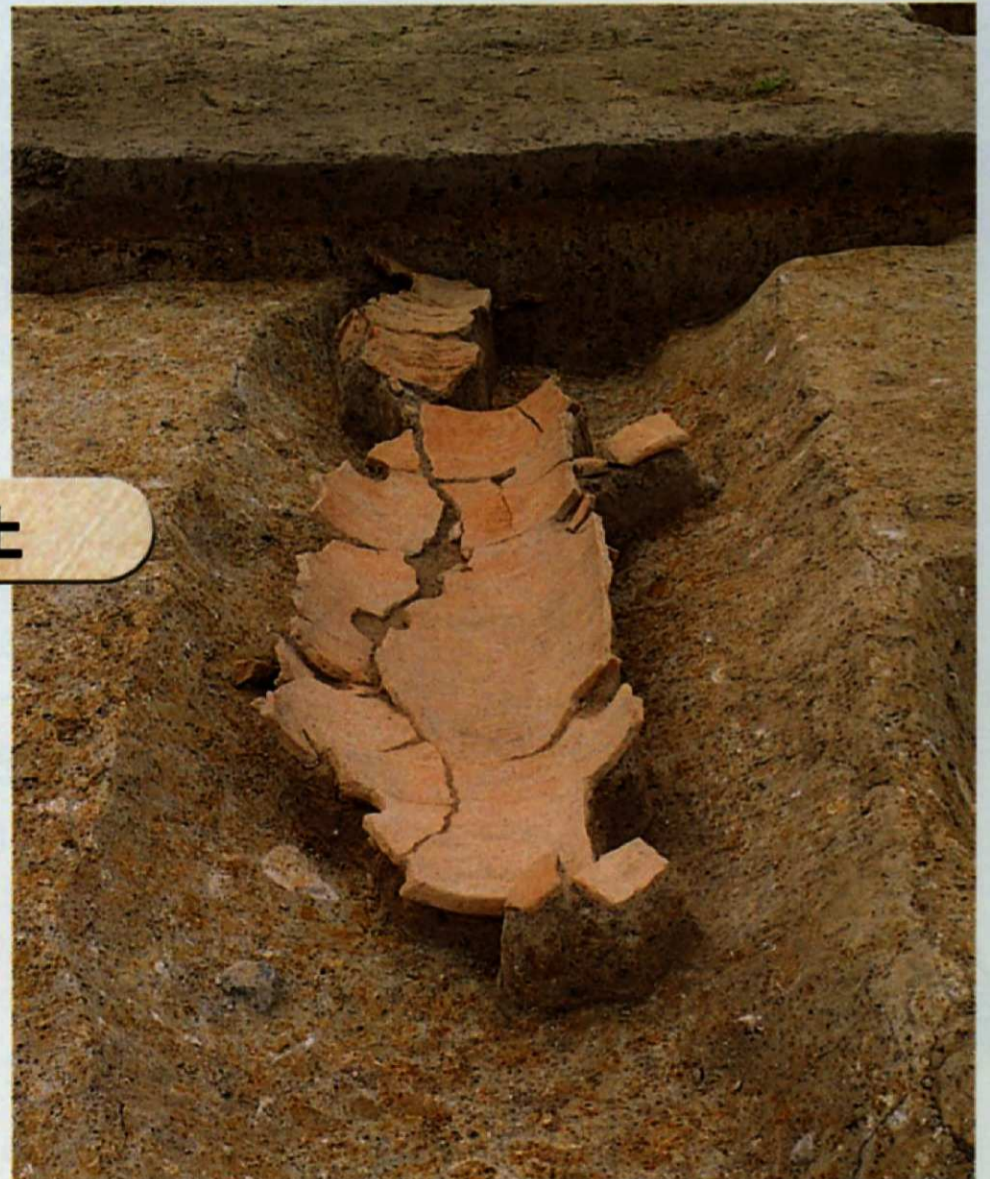
▲古道跡から出土した円筒埴輪