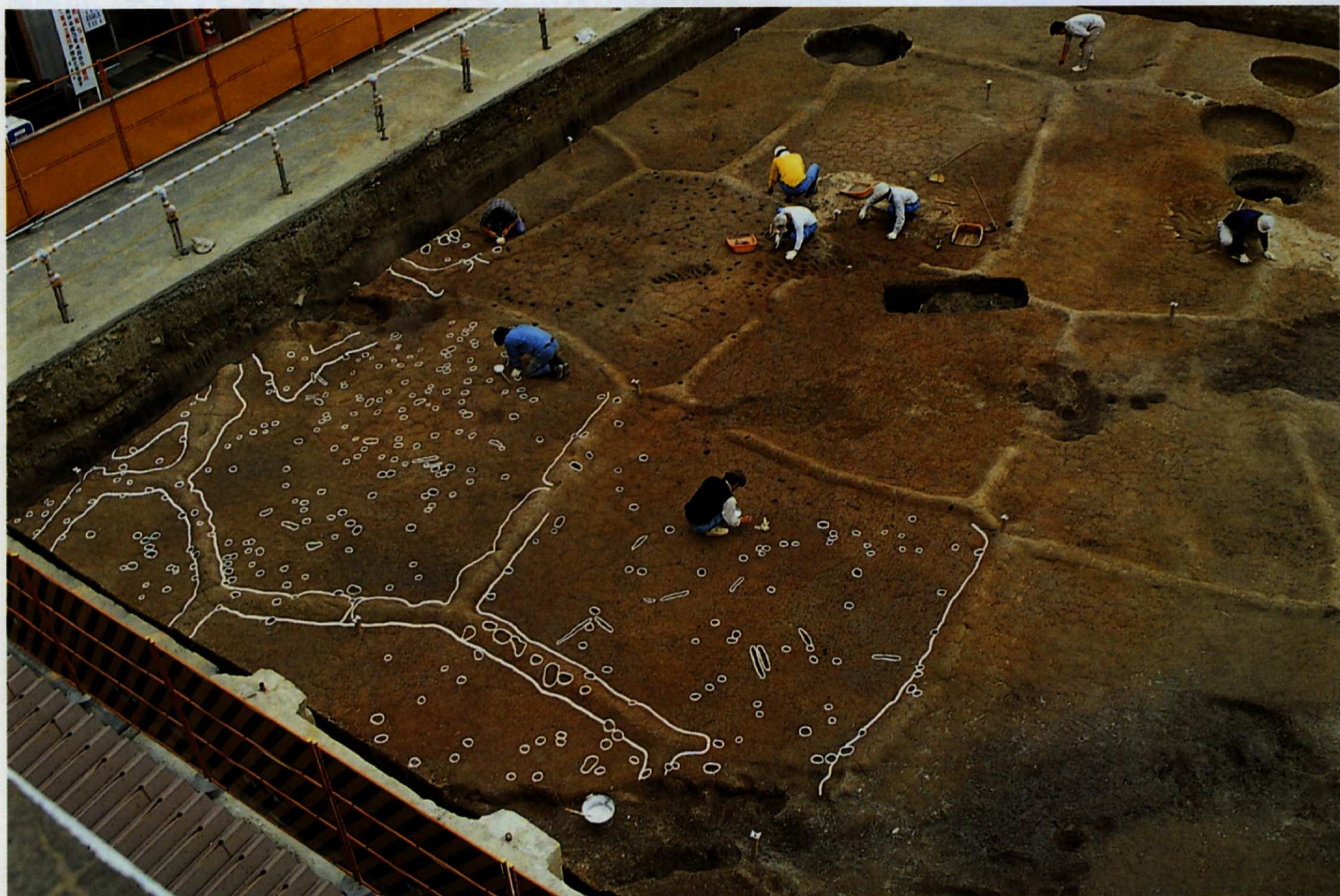
▲上田町遺跡で見つかった弥生時代後期の水田跡（約1800年前）