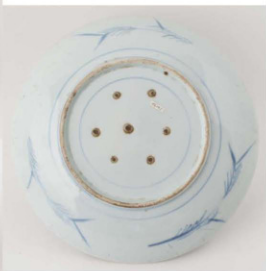
26. 白山文中皿 径22.8cm 器高3.3cm 器厚0.55cm

平縁に口紅を付けた皿で、主文は背景の白富士を大きくデフォルメし、手前の丘と松は単純化して描いている。裏面には三方笠模様を入れている。高台内にも圈線を入れ、目跡が目立つ。