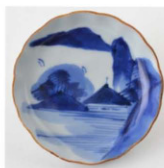
60. 山水文 小皿 1 径9.9cm 器高2.3cm

この小皿は7枚で組になるかは分からないが、ほぼ同じ大きさ、絵柄の小皿が7枚ある。轆轤整形後、返して高台を削り出し、立ち上がりをはう当てして輪花にし、縁を口紅にしている。絵柄は手描きで、少しずつ異なる。