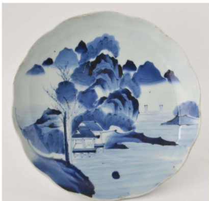
15. 山水文皿 径33.0cm 器高5.3cm 器厚0.55cm

縁を型押ししか、篋当てで輪花にした皿で、縁は内湾する。主文は内面全体に山水文を描いている。絵付は明瞭にかつ丁寧に描かれている。裏底に目跡が8箇所あるが、底が落ちて、高台より出ている。