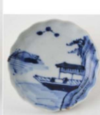
71. 山水船出文 小皿 径8.5cm 器高2.0cm