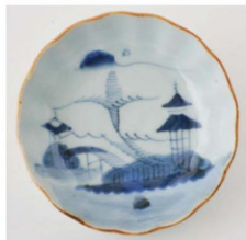
56. 山水文なます皿2 径14.8cm 器高4.5cm