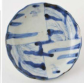
72. 水草 文小皿 径10.2cm 器高2.6cm