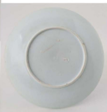
24. 富士松帆掛船文皿

平縁の皿で、主文に富士を海の彼方の背景に、手前に丘の上に生える松を描いた絵柄で、志田窯製品の一つパターン化されたものである。この皿は色が鮮やかで、コバルトを使っていると思われる。