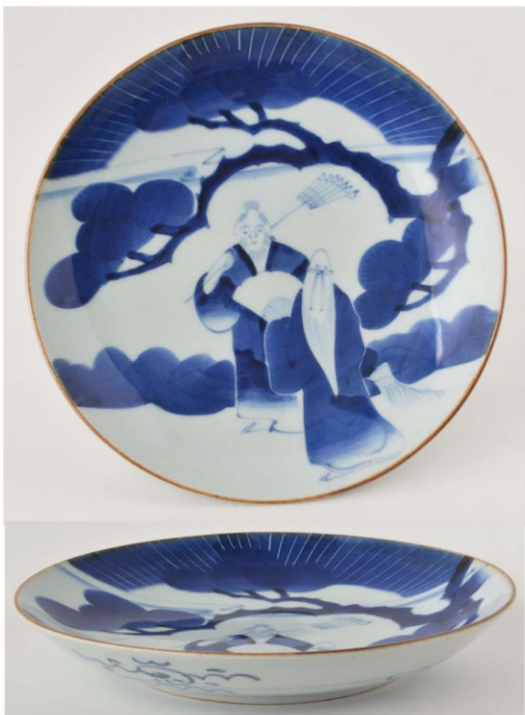
53. 日の出松下翁姫文皿 径28.9cm 器高4.7cm 器厚0.53cm

平縁に口紅を付けた皿で、主文に朝日と松を背に、掃除をする翁・姫を描いている。裏面には簡略唐草文と圈線を施している。絵付けは濃いめで、丁寧にすっきりと描かれている。高台に少し砂が付く。