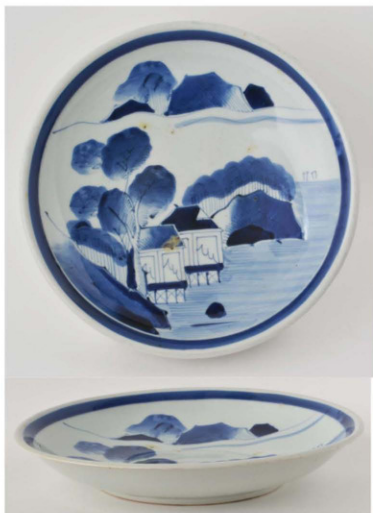
27. 山水文皿 径32.2cm 器高5.7cm 器厚0.55cm

少し縁が反る平縁に、太い圈線を入れ、主文は16と同じ構図の山水図を描いているが、だいぶ単純化された絵柄である。絵付けも少しぼけていて、あまりいい方ではない。