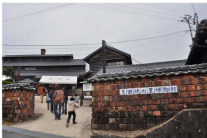
志田陶磁器株式会社の跡に開設した志田焼の里博物館