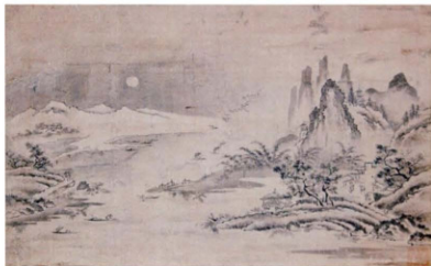
啓書記筆 水墨月雁雪四季山水図