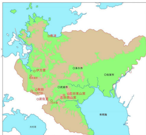
肥前主要窯跡分布図

志田窯が含まれる肥前には、江戸初期から有田を中心とする大きな陶磁器産地が形成され、積出港の名を取って伊万里のブランドで、国内はもとより海外にも輸出され、世界的にも知られた。その中には高級な鍋島・柿右衛門様式から、庶民用の波佐見焼など様々であり、それぞれの需要を満たしていた。その中で江戸後期の志田焼は染付皿のみの、高級品と庶民用との中間的な製品を作り、文化・文政期の社会的な需要に応じて発展したものと思われる。しかし、明治以降の社会変化と規制の解除によって、染付皿の需要が減ると急速に衰退して行っただろう。