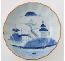
55. 山水文 なます皿1 径15.0cm 器高4.5cm

5枚組のなます皿で、型押しの輪花に口紅を入れ、主文に橋渡しし楼閣山水図を描いている。径が15cm前後で、同じ型で作ったものであろう。高台内側は蛇の目釉剥ぎである。