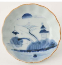
58. 山水文なます皿4 径15.1cm 器高4.5cm