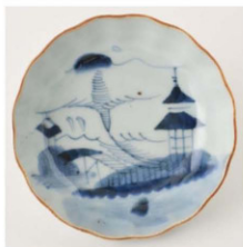
57. 山水文なます皿3 径14.5cm 器高4.3cm