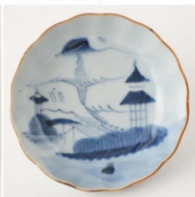
59. 山水文なます皿5 径14.9cm 器高4.5cm