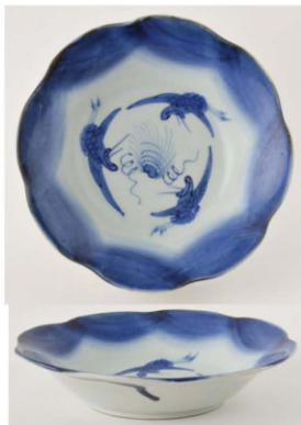
44. 海老蔵重菱文中皿

朝顔状に開く器形の、少し深い皿である。輪花の縁に、濃淡を付けた広い帯状文を入れ、中央に翼を広げた三鶴を輪状に描いている。全体に貫入が入る。