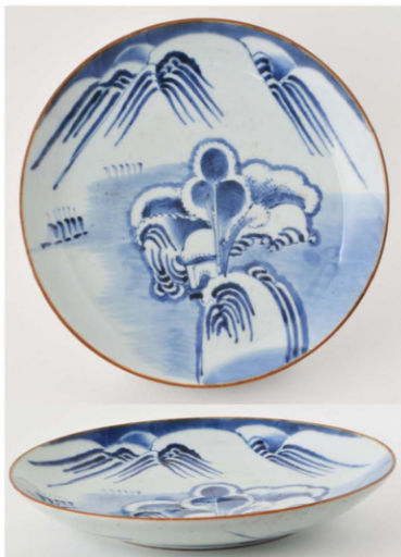
25. 白富士松帆掛船文皿 径31.5cm 器高5.0cm 器厚0.52cm

平縁に口紅を付けた皿で、主文は背景の白富士を大きくデフォルメし、手前の丘と松は単純化して描いている。裏面には三方笠模様を入れている。高台内にも圈線を入れ、目跡が目立つ。