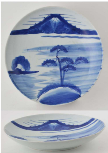
23. 富士松帆掛船文皿 径28.3cm 器高4.4cm