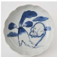
54. 大根鼠文なます皿