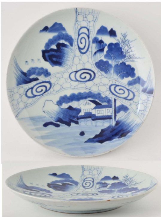
21. 氷裂渦卷三分山水文皿 径38.3cm 器高5.5cm 器厚0.85cm

今回展示品中最大の皿で、平縁に氷裂文が放射状に三方に広がり、山水文を上重ねで分割している。氷裂文の上には馬の目状の渦巻きが描かれ、図柄のアクセントとなっている。絵付けの描画は明瞭で、丁寧に描かれている。裏面には簡略唐草文が描かれ、高台内側にも圈線が入る。