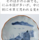
67. 山水文小皿 径10.4cm 器高2.5cm