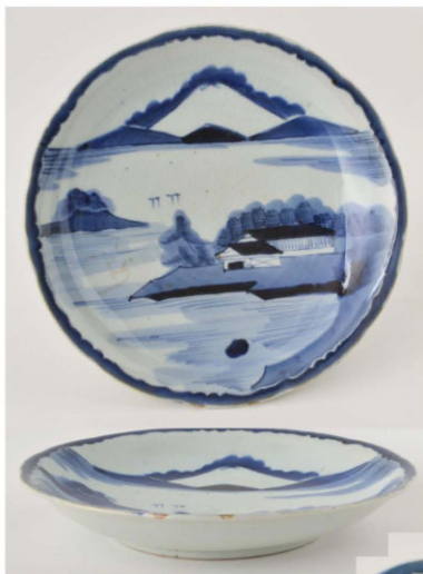
4. 白富士山水文皿 径28.6cm 器高5.0cm 器厚0.7cm

少し反って弱い輪花に、 帯状文を付けた、やや深め の皿である。絵柄は海のも うこうに白富士を描き、手前 に家屋と樹木のある陸地を 配し、下の点は磯の岩礁を 表したのか。絵付けは少 しにじみ、全体に青みを帯 び、釉に貫入が入る。裏面 に珍しく目跡がない。