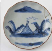
70. 漁網芭蕉文小皿 径10.5cm 器高2.2cm