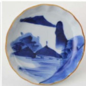
64. 山水文小皿 5 径9.9cm 器高2.4cm