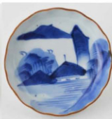
63. 山水文小皿 4 径10.0cm 器高2.5cm