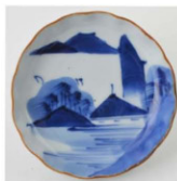
65. 山水文小皿 6 径9.9cm 器高2.5cm