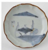
69. 山水文小皿 径9.8cm 器高2.4cm

そのほかの小皿でも、輪花に口紅、主文に山水図が多いが、中には72の様に、4分割に水草と思われる変わった図柄もある。