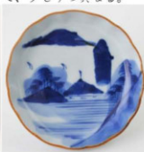
62. 山水文小皿 3 径10.1cm 器高2.5cm