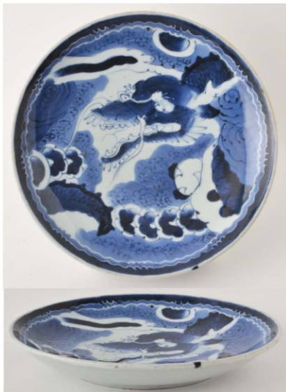
33. 雲竜文皿 径28.9cm 器高4.5cm 器厚0.52cm

縁が少し立ち上がって段を有し、弱い輪花に二重帯状文を廻して、主文に雲竜文を描いた皿である。雲竜文の描き方は豪快であるが、少し粗く、竜の輪郭が不鮮明で、図柄が分かりにくくなっている。