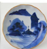
66. 山水文小皿 7 径10.0cm 器高2.4cm