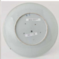
34. 牡丹唐獅子文中皿 径22.4cm 器高2.9cm 器厚0.4cm

縁が少し立ち上がって段を有し、弱い輪花に二重帯状文を廻して、主文に雲竜文を描いた皿である。雲竜文の描き方は豪快であるが、少し粗く、竜の輪郭が不鮮明で、図柄が分かりにくくなっている。