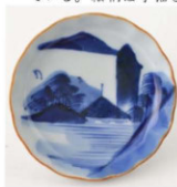
61. 山水文小皿 2 径10.6cm 器高2.3cm