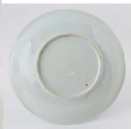
5. 白富士山水文皿 径29.6cm 器高4.1cm 器厚0.7cm

少し反って弱い輪花に、 帯状文を付けた、やや深め の皿である。絵柄は海のも うこうに白富士を描き、手前 に家屋と樹木のある陸地を 配し、下の点は磯の岩礁を 表したのか。絵付けは少 しにじみ、全体に青みを帯 び、釉に貫入が入る。裏面 に珍しく目跡がない。