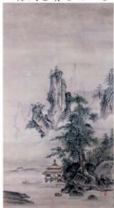
渡辺包夫筆 初期狩野派山水図模写