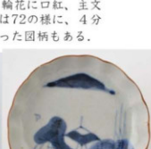
68. 山水文小皿 径10.1cm 器高2.4cm

そのほかの小皿でも、輪花に口紅、主文に山水図が多いが、中には72の様に、4分割に水草と思われる変わった図柄もある。