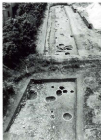
調査区全景（北から）

第5期 濁褐色混泥弱粘質土を埋土とする遺構で、第1調査区南東部の落ち込み3がこれに当たります。段丘崖に向かって傾斜する浅い落ち込みで、最も深い所で約0.2mあります。遺物には瓦器椀（図2-7）がありますが、口縁に段を持つ瓦質羽釜を含むことから14世紀代の遺構です。この埋土は礫を多く含むことから、整地層の一部であ