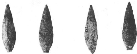
(2) 柳葉形，有舌尖頭器