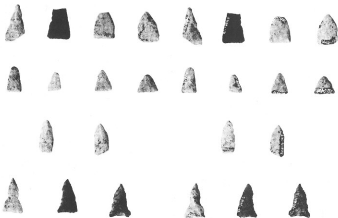
(1) 石 鏃