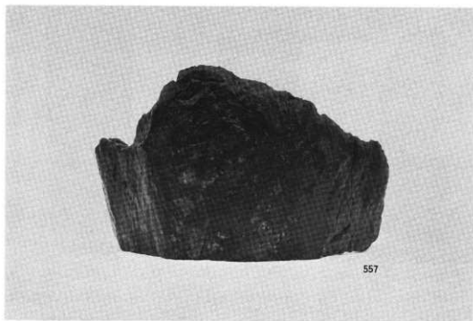
SE 3 井筒