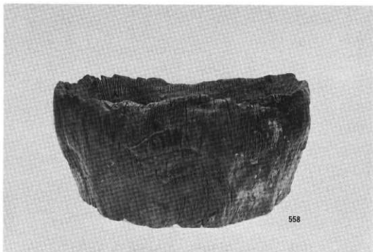
SE 1 井筒