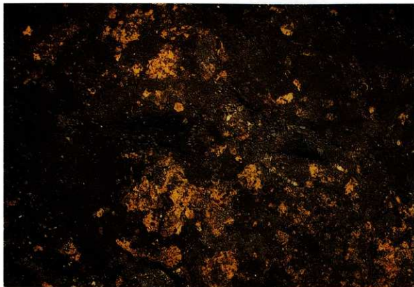
SA 0 2 木炭検出状況