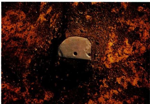
SA 0 3 石包丁出土状況