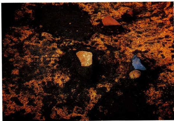
SA 01 遺物出土状況 (部分)