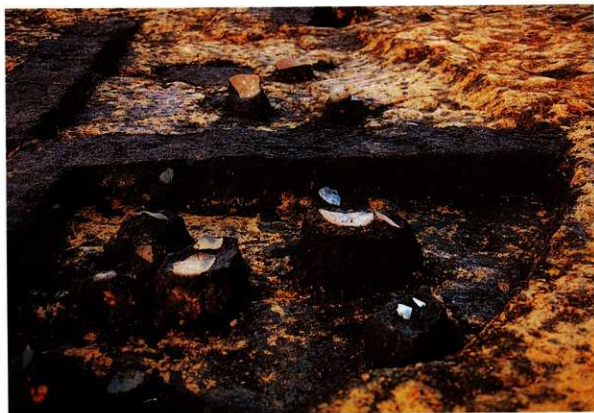
SA 01 遺物出土状況 (部分)