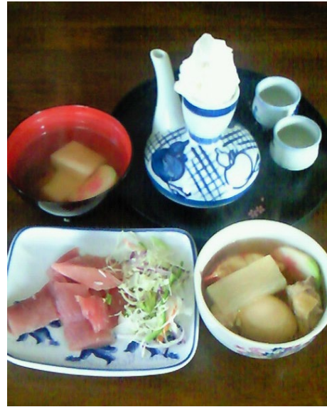
左奥（吸物1） 左（刺身） 右（吸物2）