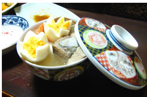
実家（古志集落）で使用する 蓋付陶磁器碗（シンカン）