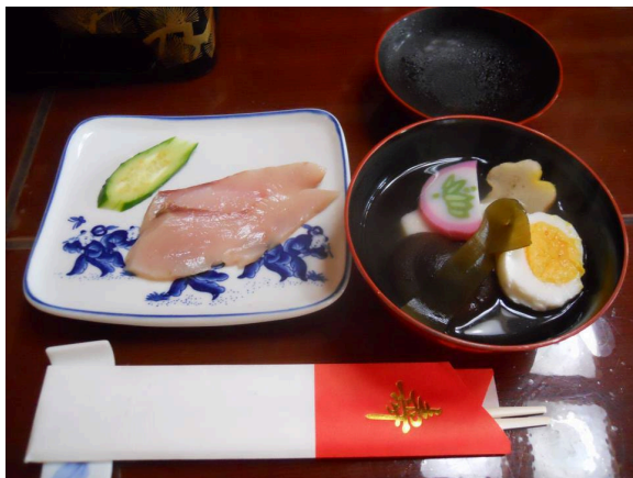
左（刺身） 右（吸物 1）