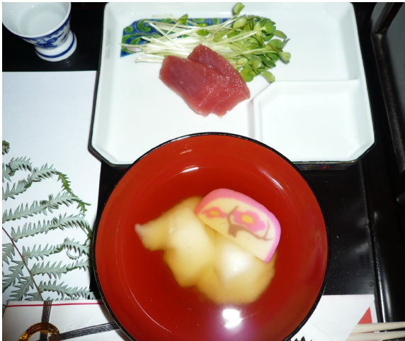
前 (吸物1) 奥 (刺身)