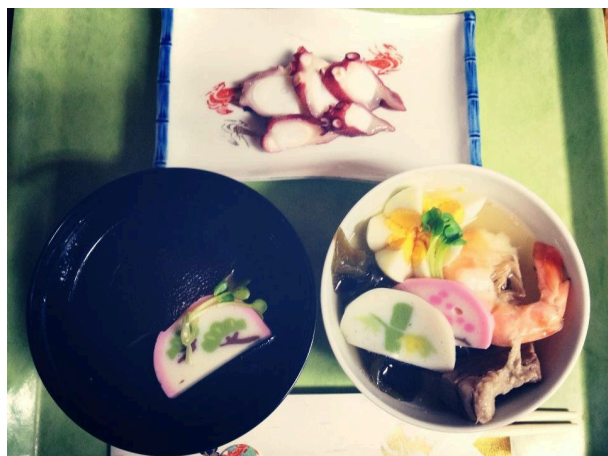
奥（刺身） 左（吸物1） 右（吸物2）