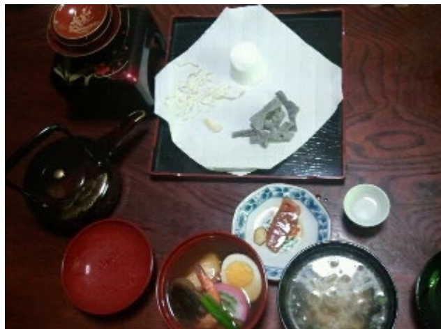
左（吸物1） 奥（シュームリ） 右（吸物2）