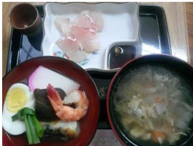
左（吸物1） 奥（刺身） 右（吸物2）