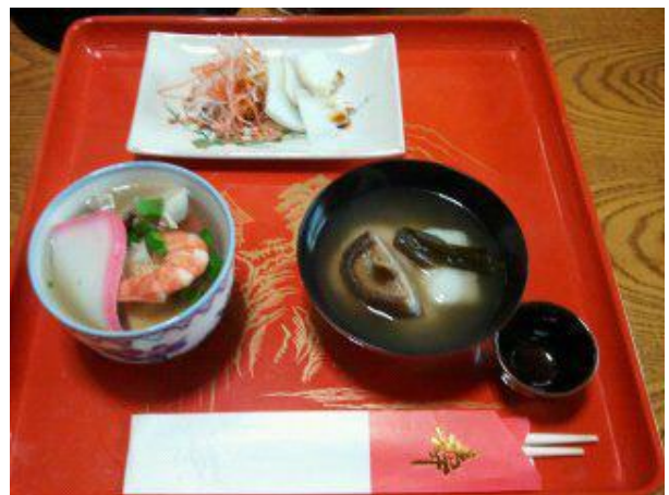
左（吸物2） 奥（刺身） 右（吸物1）