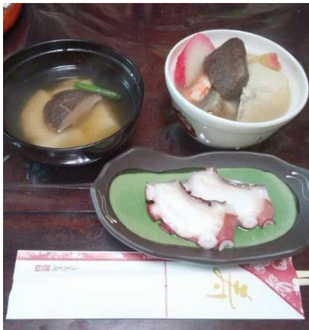
左奥（吸物 1） 手前（刺身） 右奥（吸物 2）