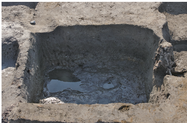
1 第 280 号土坑