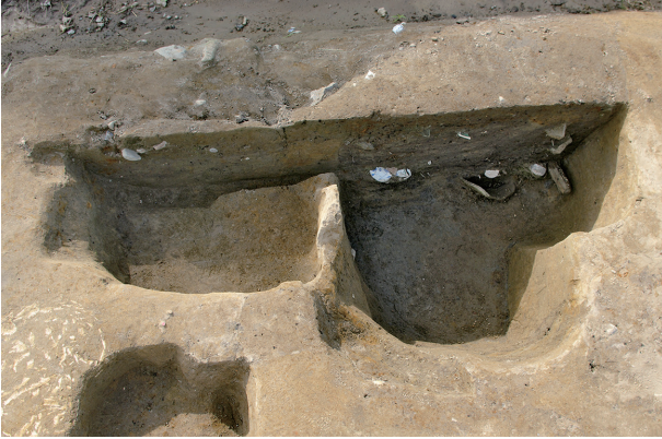
1 第 103·104 号土壤