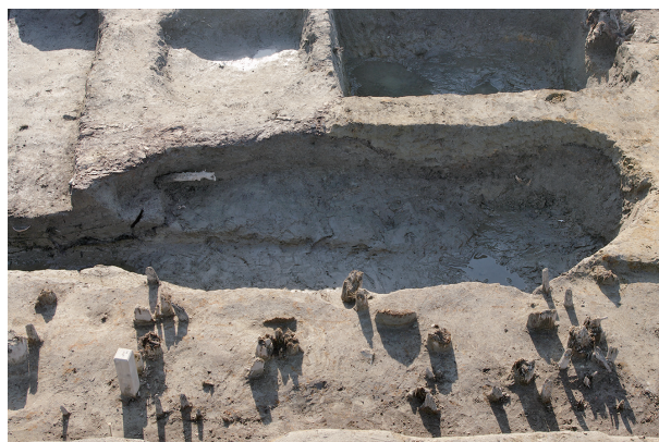
4 第 288 号土坑