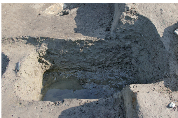
7 第 293 号土坑