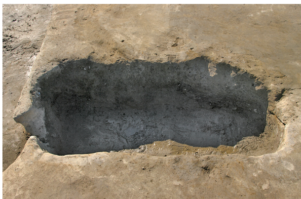
3 第 115 号土壤