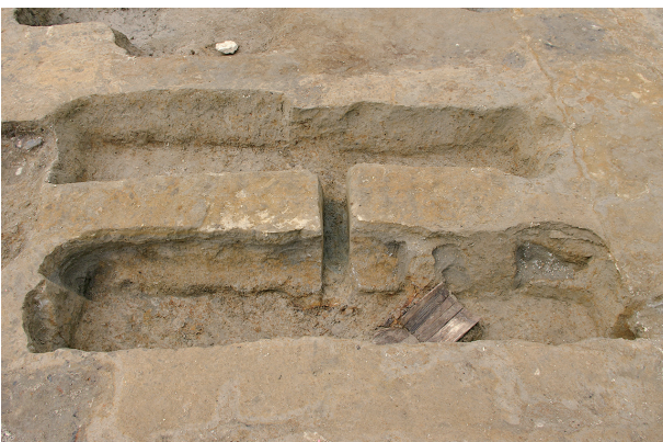
7 第 93・94 号土壤