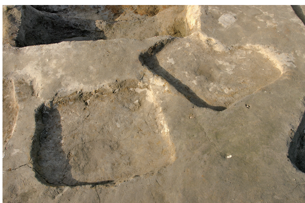
7 第 149 · 175 号土壤