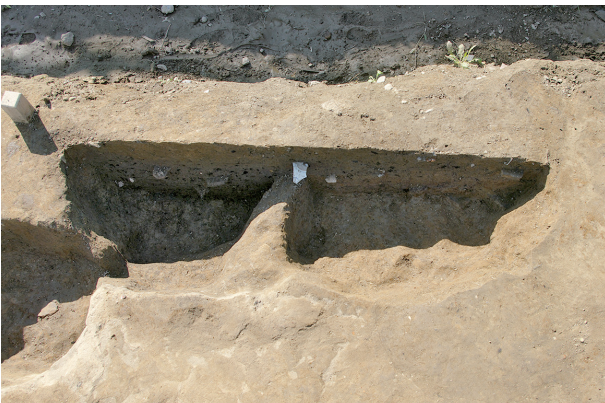
7 第 272 号土壤