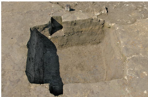
1 第 95 号土壤