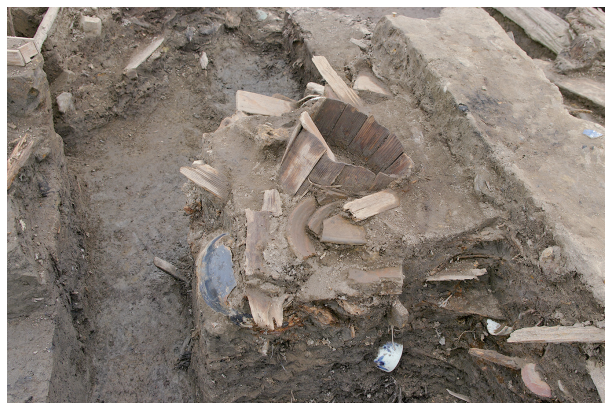
8 第 119 号土壤遺物出土状况 (2)