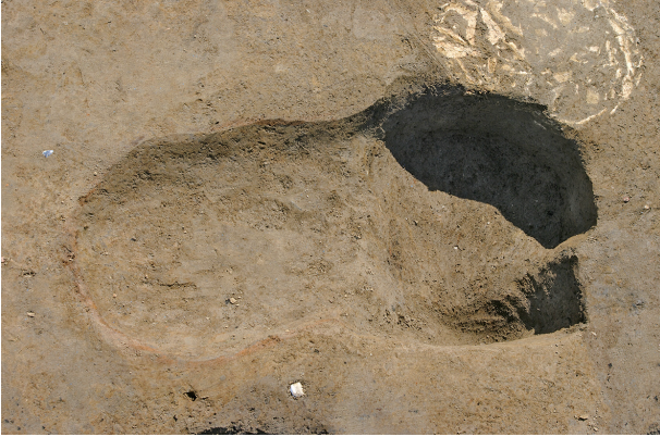
1 第 123·124 号土壤