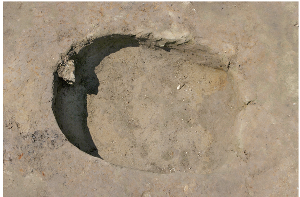
4 第 32 号土坑