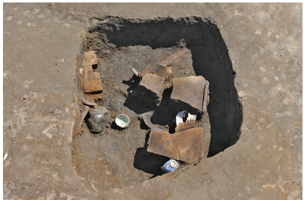
8 第 38 号土坑遺物出土狀況