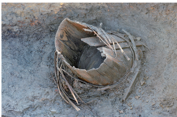
5 第 288 号土坑遺物出土狀況 (桶)