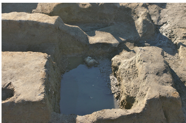
5 第 99 号土壤