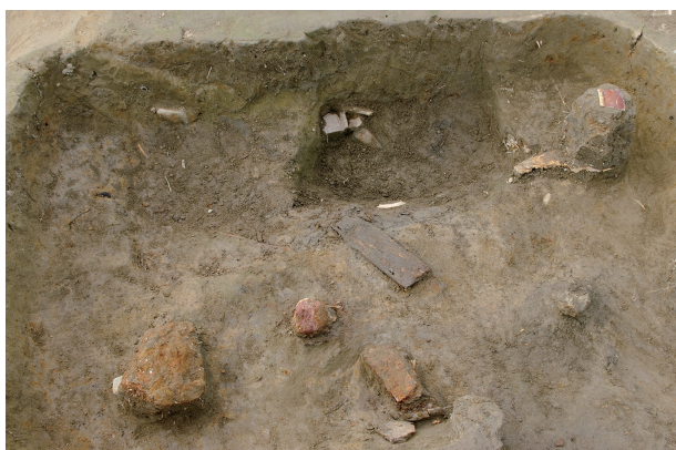
5 第 48 号土壇遺物出土状況