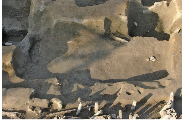
2 第 256・257 号土壤