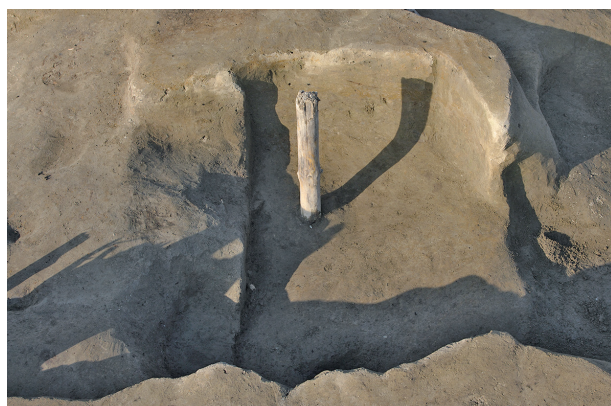
5 第 248 号土坑