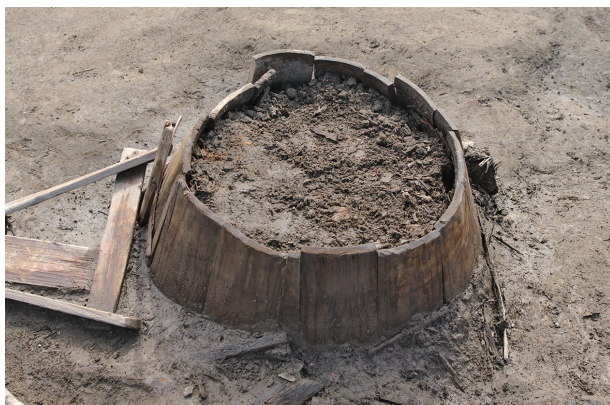
7 第 52 号土壇遺物出土状況 (桶)