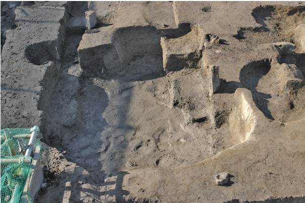
5 第 194·264 号土壤