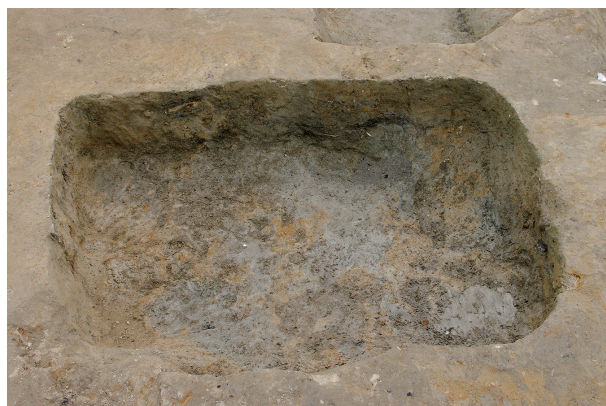
4 第 98 号土壤