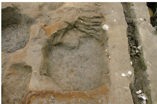
3 第 70 号土坑