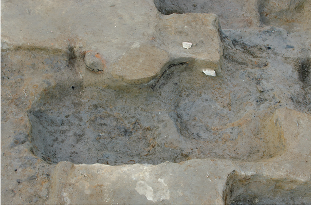
1 第 84・85 号土壤