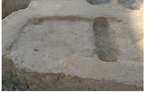
2 第 154·155 号土壤