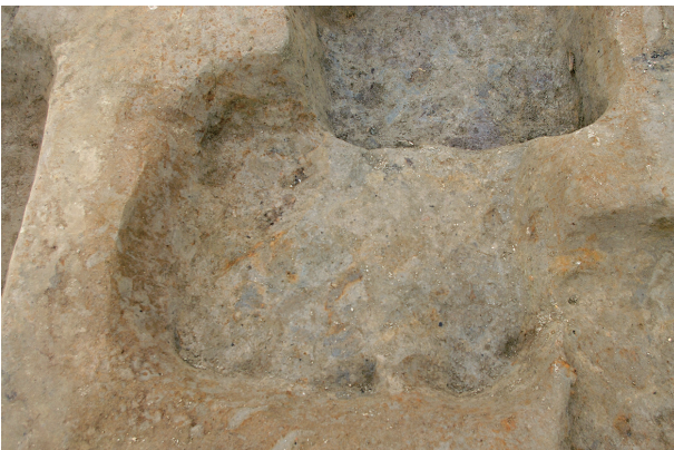
5 第 88 号土壤