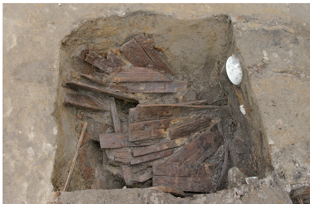
1 第 113 号土壤遺物出土状况