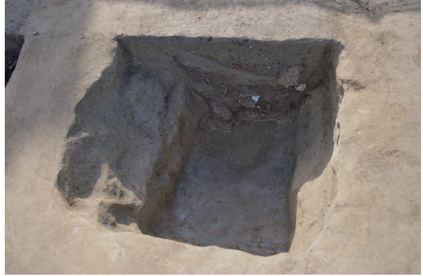
2 第 105 号土壤