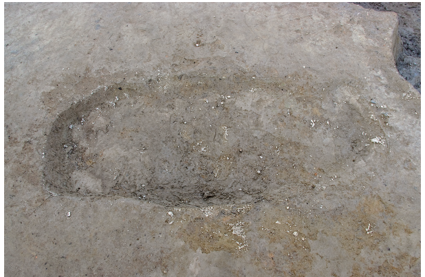
8 第 139 号土壤