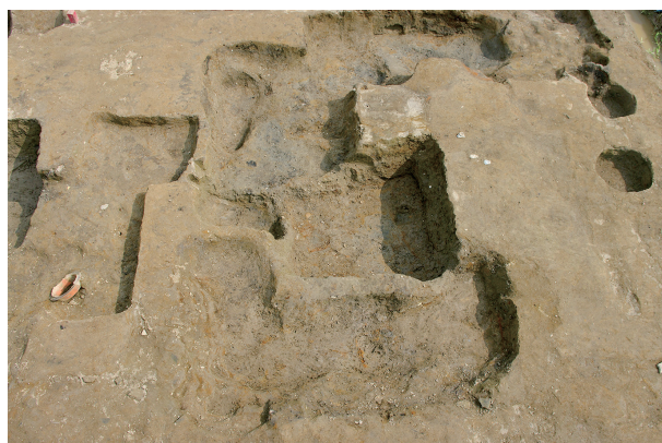
6 第 80 号土坑