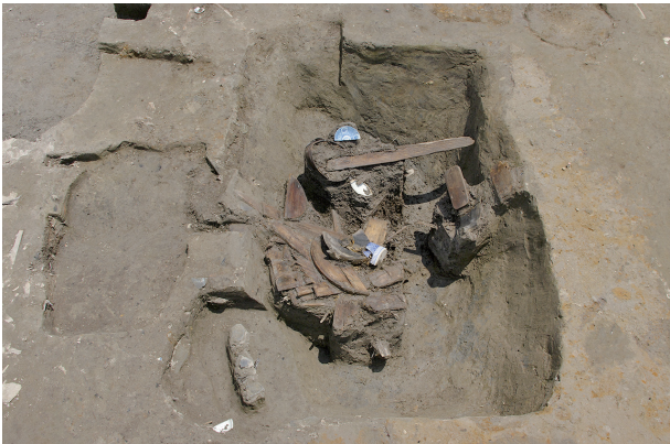
3 第58号土壤遺物出土状况