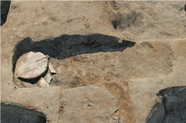
3 第 129 号土壤