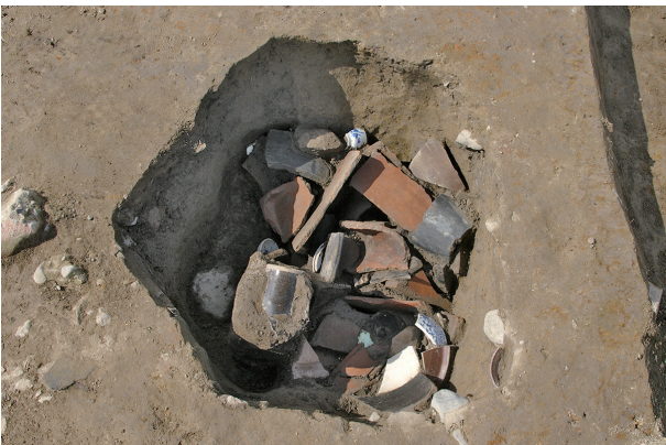
5 第 260 号土壤遺物出土狀況