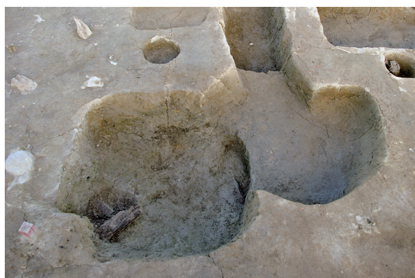
8 第 152 · 253 号土壤