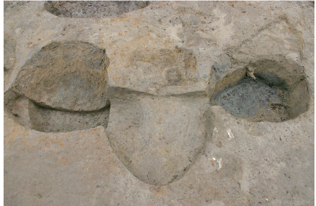
4 第 306 · 310 · 311 号土壤