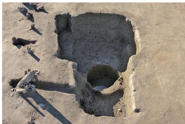
4 第 146 号土壤