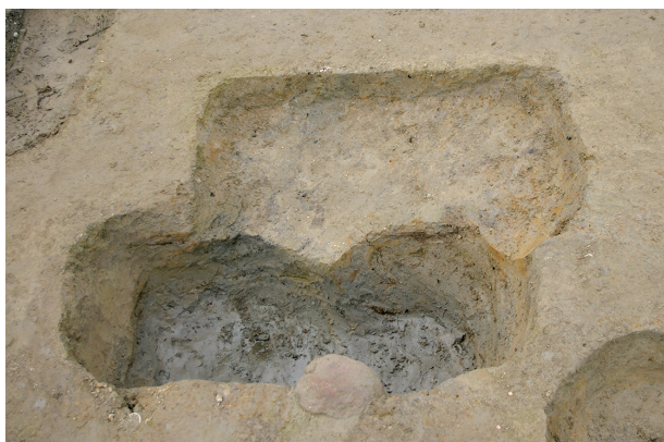
3 第 144 · 145 号土壤