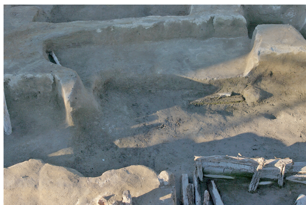
6 第 119 号土壤