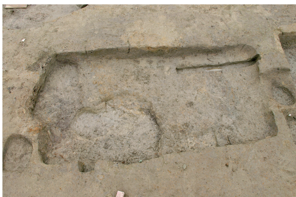
5 第 72·73·75 号土坑