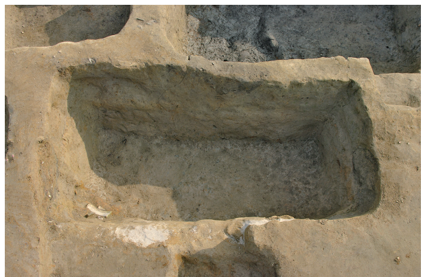
8 第 113 号土壤