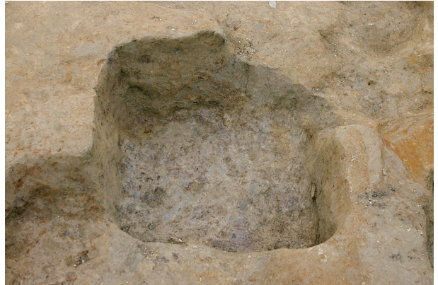
4 第 87 号土壤