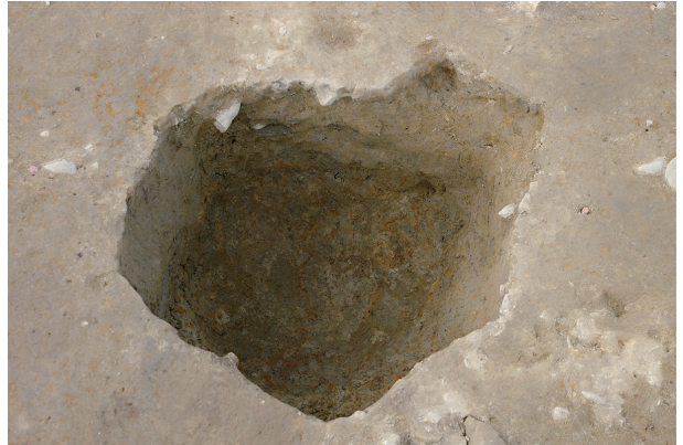
4 第 260 号土壤