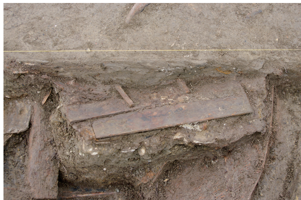
2 第 281 号土坑遺物出土狀況