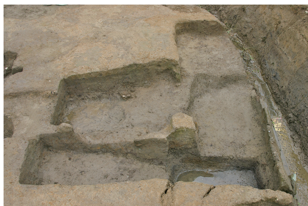
6 第 100·180~182 号土壤