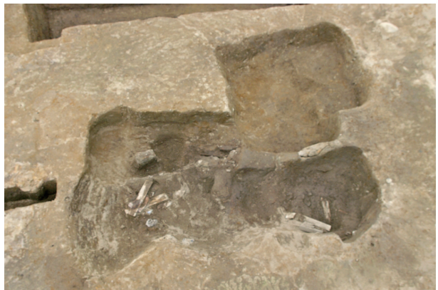
6 第 36·42·43 号土坑