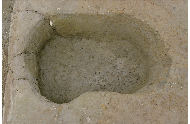
4 第 133 号土壤