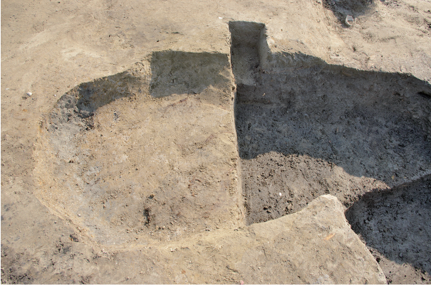
1 第 300 号土壤