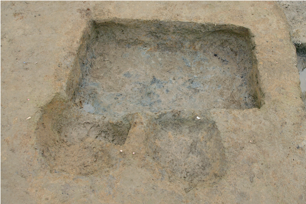
3 第 156·157·171 号土壤