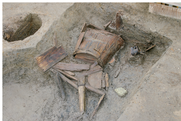
2 第 244 号土坑遺物出土狀況