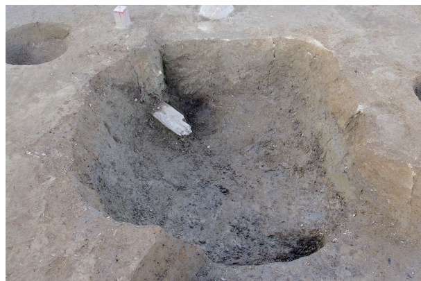
8 第 253 号土坑