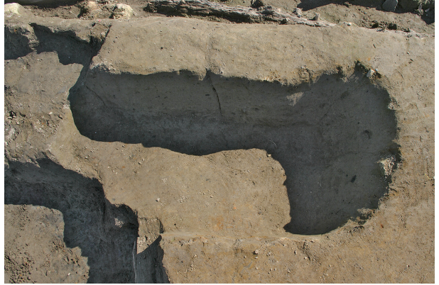
2 第 125 号土壤