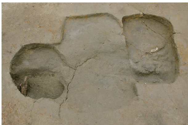
3 第 45 ~ 47 号土壇