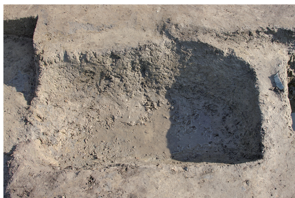
6 第 292 号土坑