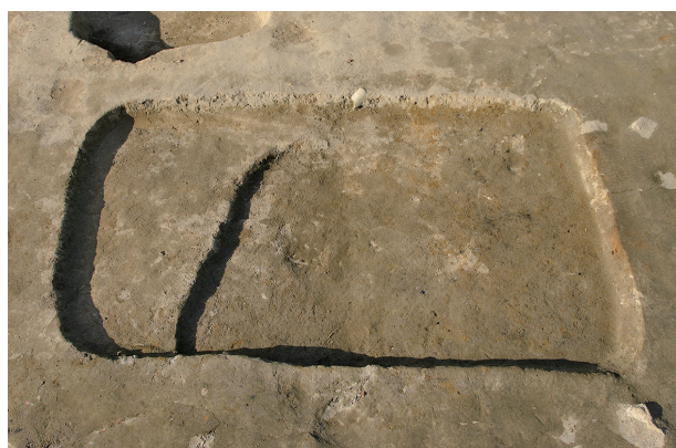
3 第 245 号土坑