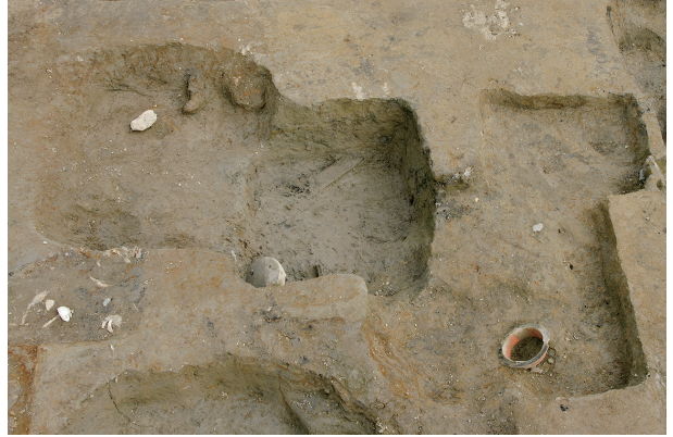
2 第 86～88 号土壤