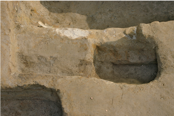
5 第 134 号土壤