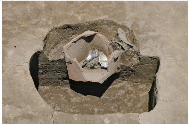
2 第 32 号土坑遺物出土狀況