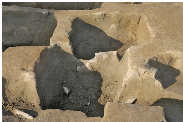
8 第 102·108 号土壤