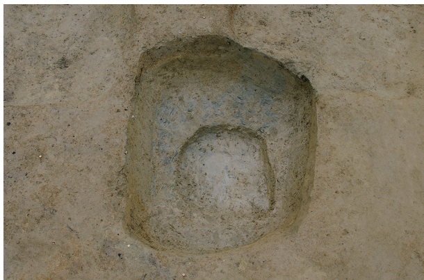
1 第 140 号土壤