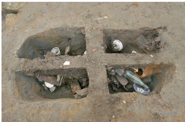
1 第 66 号土坑