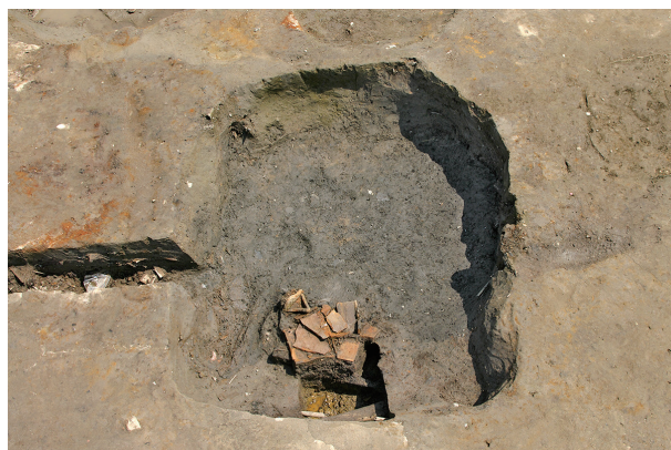
4 第 71 号土坑