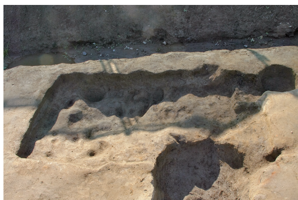
8 第 83 号土坑