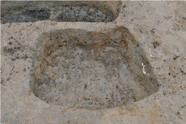
3 第 305 号土壤