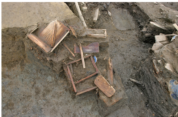
7 第 119 号土壤遺物出土状况 (1)