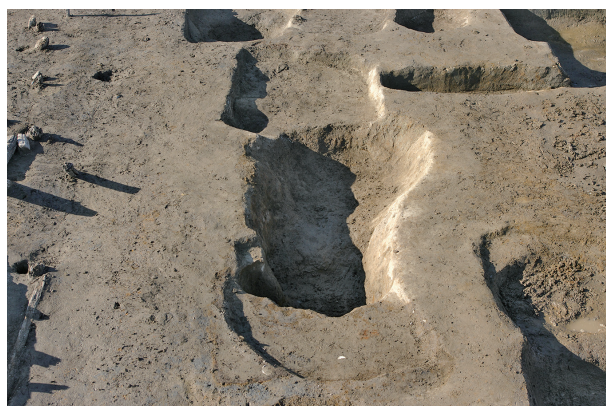
6 第 148 · 213 · 282 号土壤