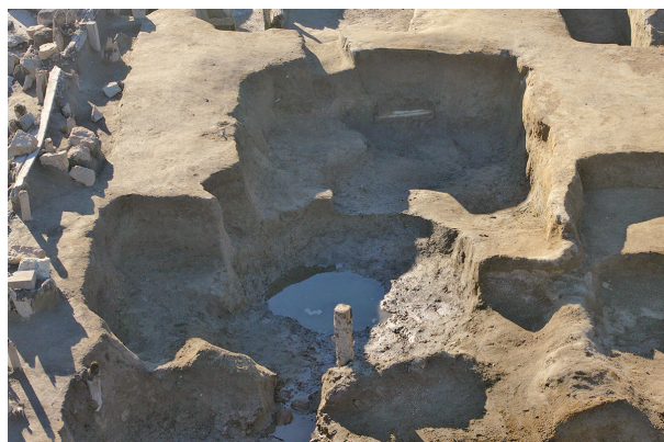
4 第 116・135・302・303 号土壤