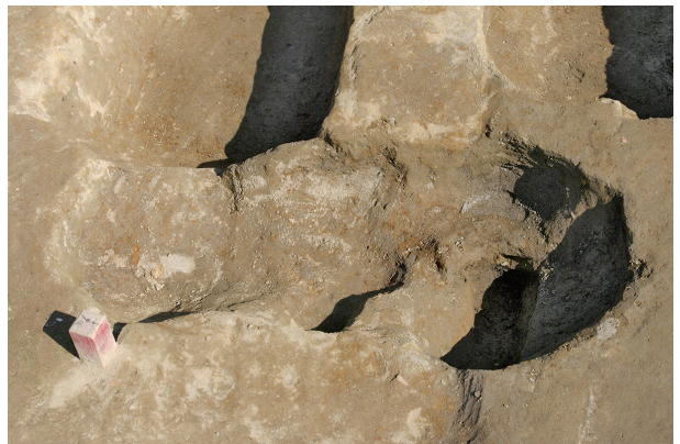
6 第 92 号土壤