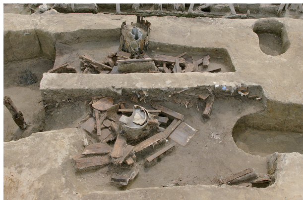
7 第 249 号土坑遺物出土狀況