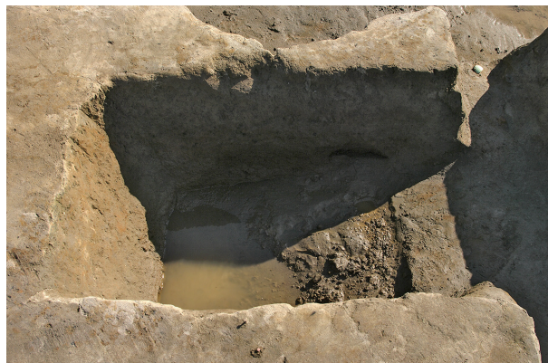
2 第 114 号土壤