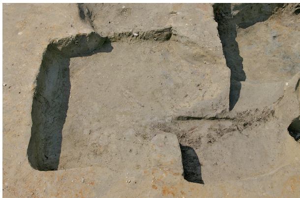
1 第 39 号土壇