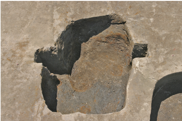
3 第 32 号土坑