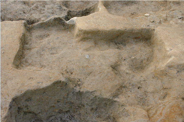
3 第 86 号土壤