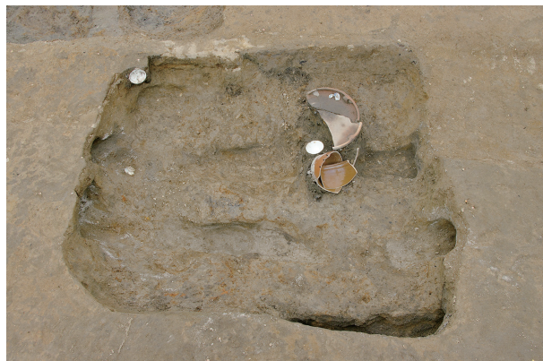
2 第 96 号土壤