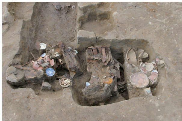
2 第 44 号土壇