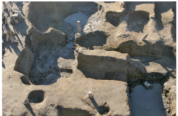
6 第 265～269 号土壤