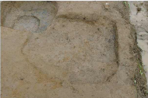
7 第 138 号土壤