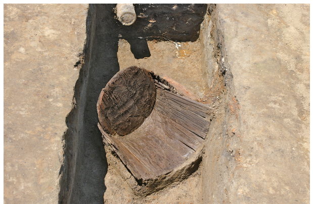
8 第 94 号土壤遺物出土狀況 (桶)