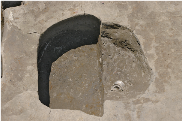
1 第 31 号土坑