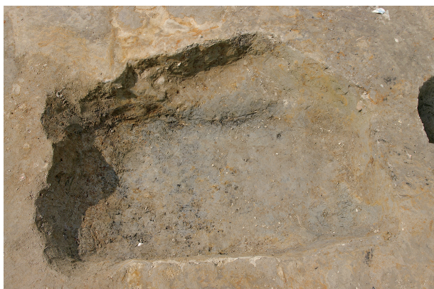
3 第 97 号土壤