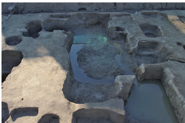
3 第 285 号土坑