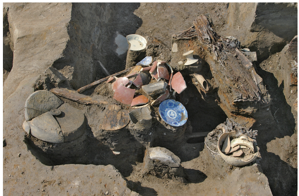
8 第65号土壤遺物出土状况