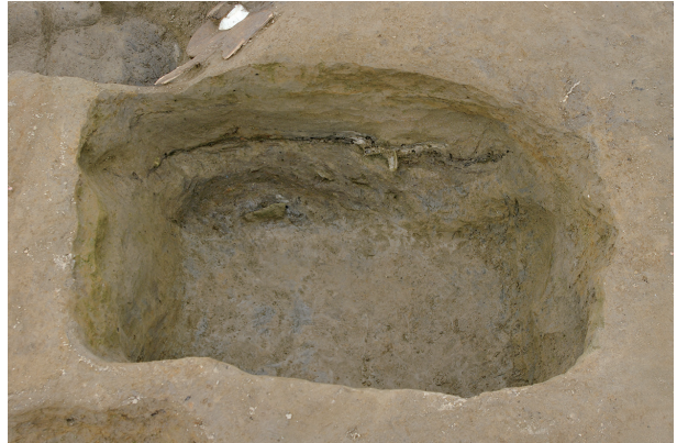
4 第 107 号土壤