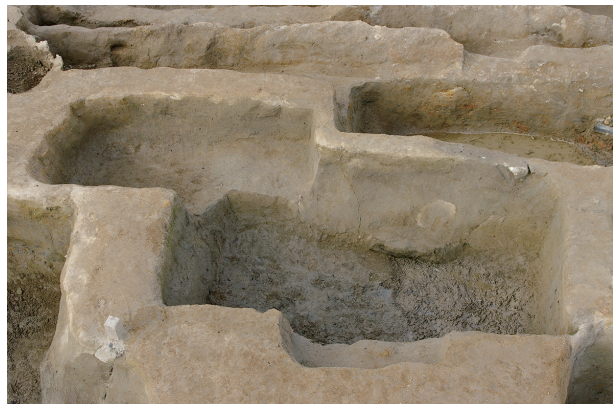
6 第 109·110 号土壤