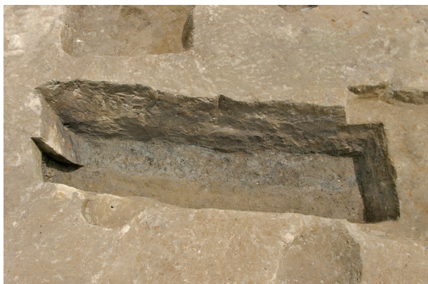
7 第 101 号土壤