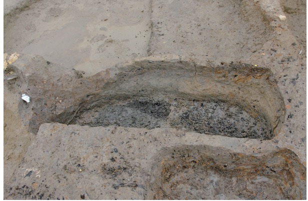
2 第 304 号土壤