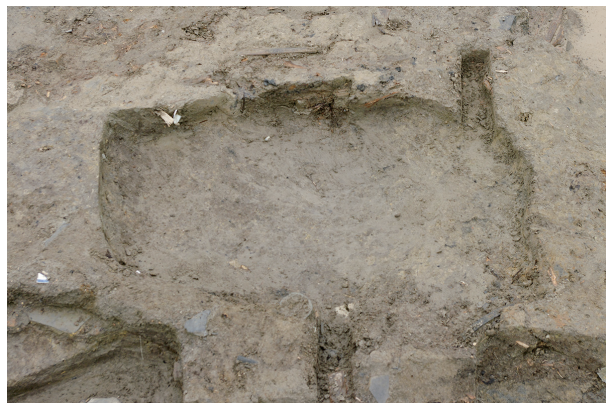
2 第 69 号土坑