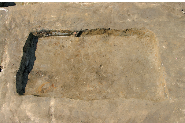
7 第 112 号土壤