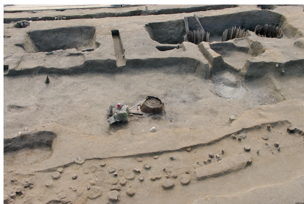
6 第 52 号土壇