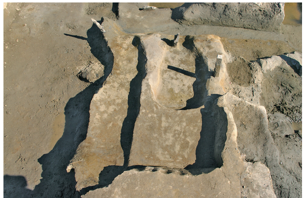
8 第 278・295・296 号土壤