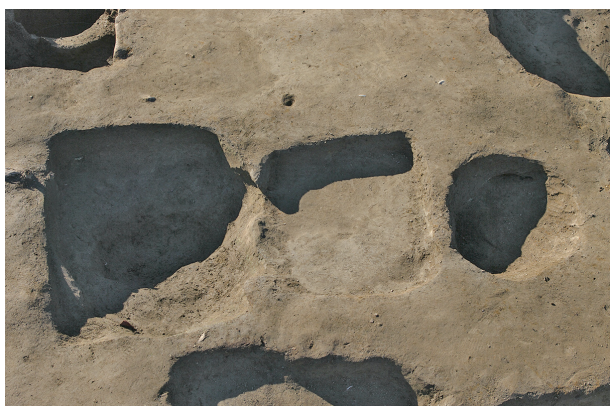
5 第 147 · 158 · 159 号土壤