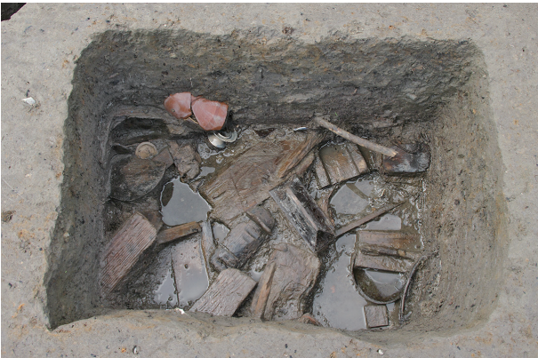
7 第 203 号土壤遺物出土狀況