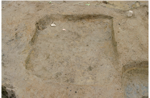
6 第 137 号土壤