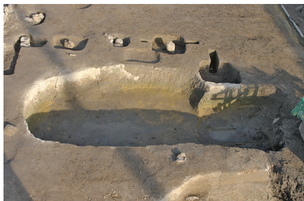
1 第 243・244・254 号土坑