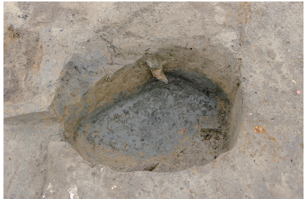
8 第 310 号土壤