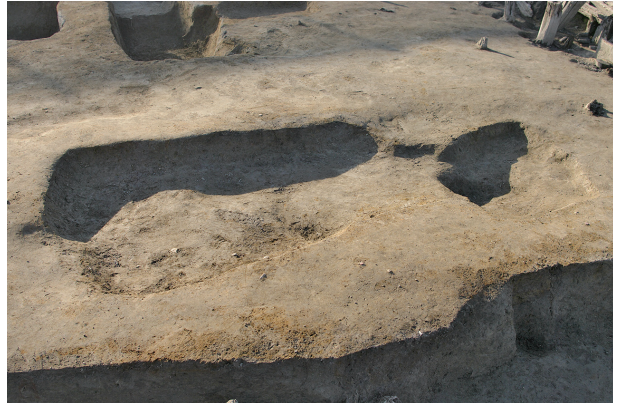
4 第 161·252 号土壤