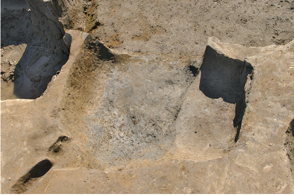
1 第 255・283 号土壤