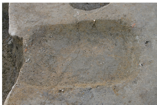
4 第 246 号土坑