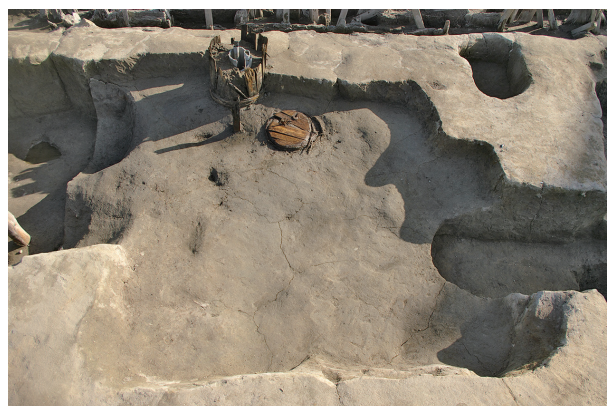
6 第 249 号土坑