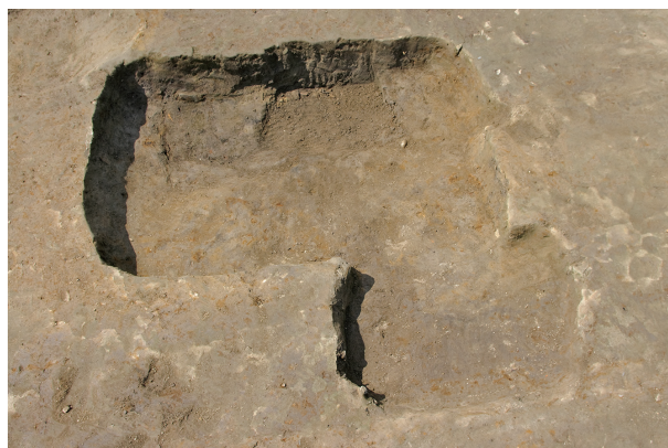
4 第 48・49 号土壇