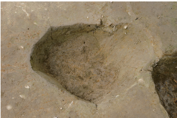
5 第 34 号土坑