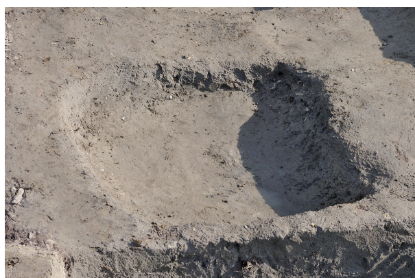
8 第 294 号土坑