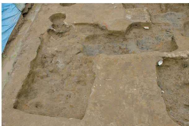
7 第 83~85 号土坑