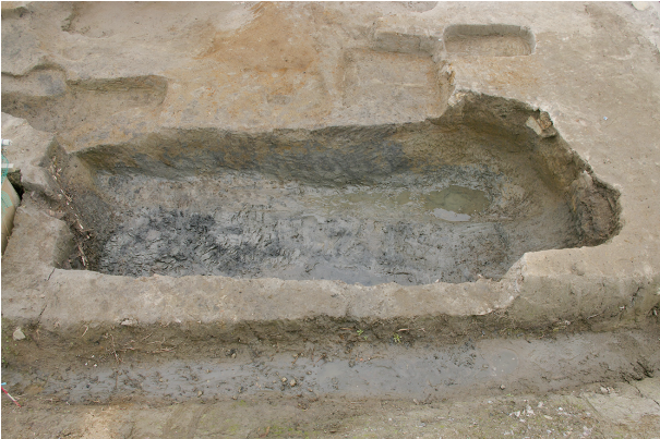
3 第 259 号土壤