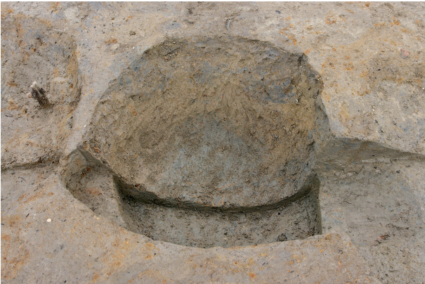
5 第 306 号土壤