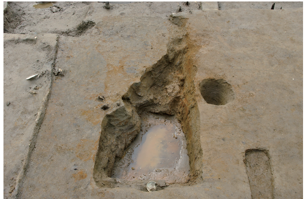
8 第 233 号土壤