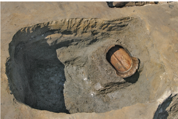
5 第 107 号土壤遺物出土狀況