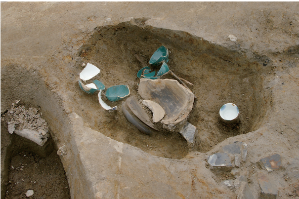
7 第 307 号土壤遺物出土狀況