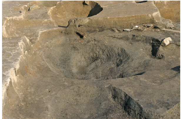
6 第 203 号土壤