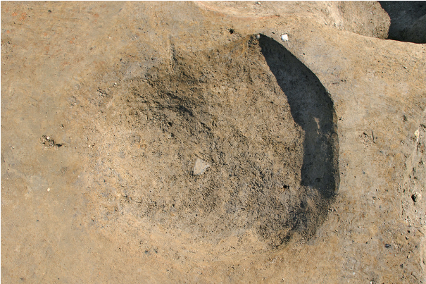
3 第 106 号土壤