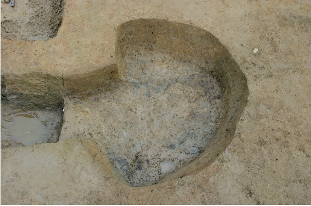
1 第 152 号土壤