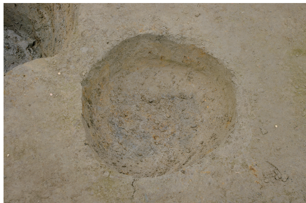
2 第 141 号土壤