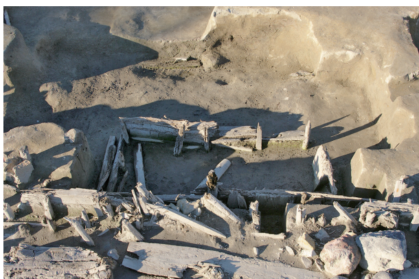
5 第 117・329 号土壤