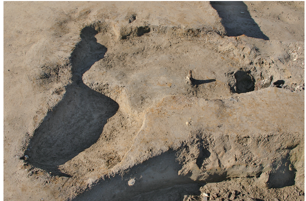
6 第 307 · 308 号土壤