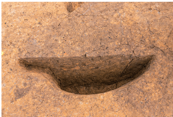
第7号竖穴建物跡(新)Pit02 土層断面 西から