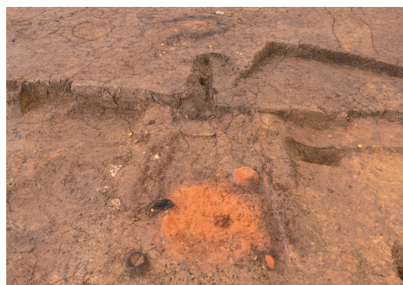
第7号竪穴建物跡(新)カマド 完掘 北西から