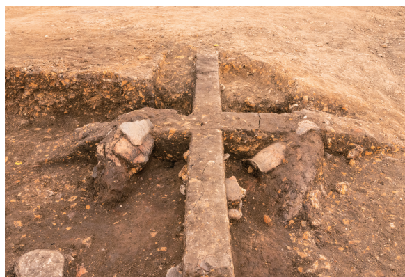
第10号竖穴建物跡カマド上部 土層断面 北から