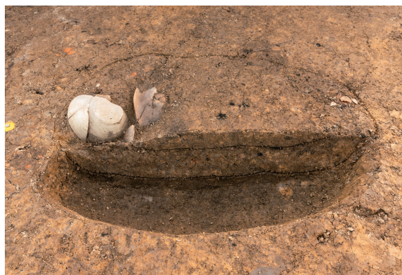
第7号竖穴建物跡(新)SK01 土層断面 北から