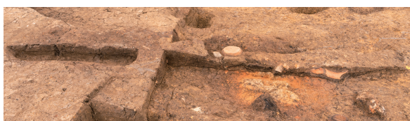
第7号竪穴建物跡(新)カマド 土層断面 北東から