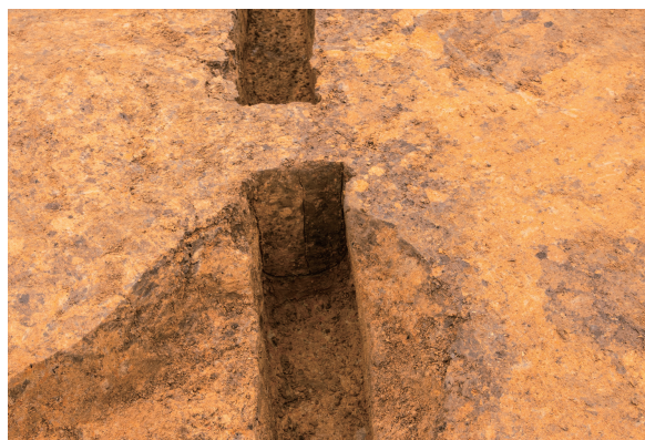
第5号竖穴建物跡壁溝 土層断面 北西から