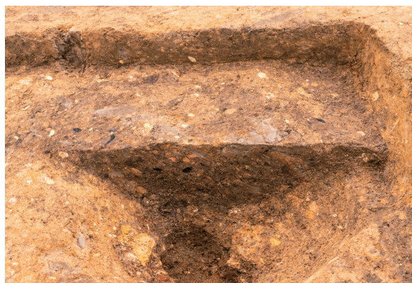
第8号竪穴建物跡 SK01 土層断面 西から