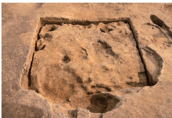
第8号竪穴建物跡掘方 完掘 北西から