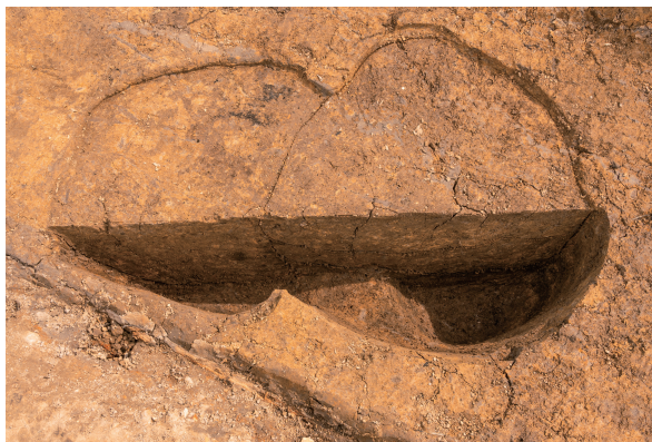
第7号竖穴建物跡Pit07(右)・Pit08(左)土層断面 西から