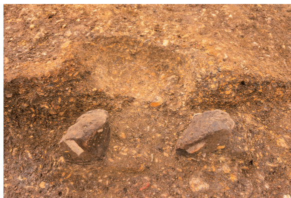
第10号竖穴建物跡カマド掘方 完掘 北から