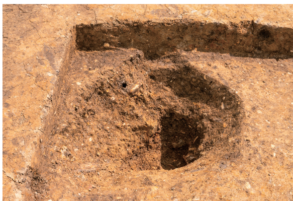
第8号竪穴建物跡 SK01 完掘 北から