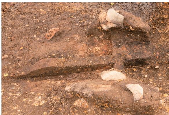
第10号竖穴建物跡カマド下部 土層断面 西から