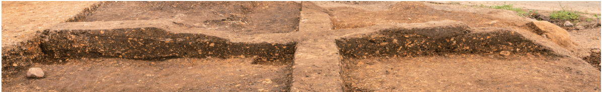
第10号竖穴建物跡 土層断面 東から