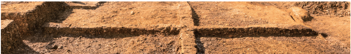
第10号竖穴建物跡掘方 土層断面 東から