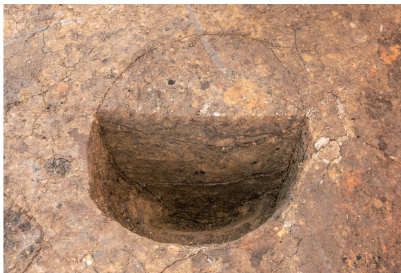
第7号竖穴建物跡(新)Pit04 土層断面 北から