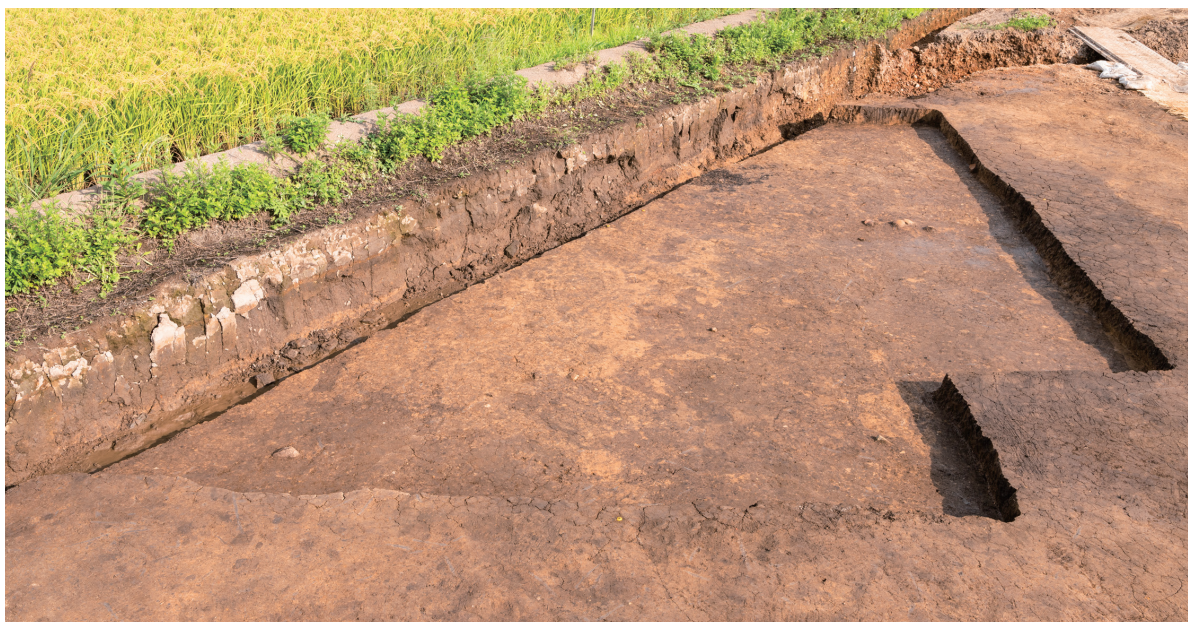
第4号・第5号竖穴建物跡 完掘 北から