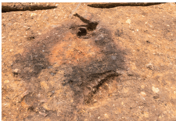
第8号竖穴建物跡カマド火床面 検出 北から