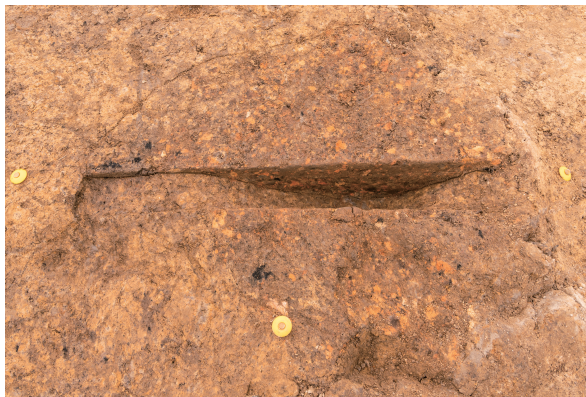
第7号竖穴建物跡(新)カマド煙道 土層断面 東から