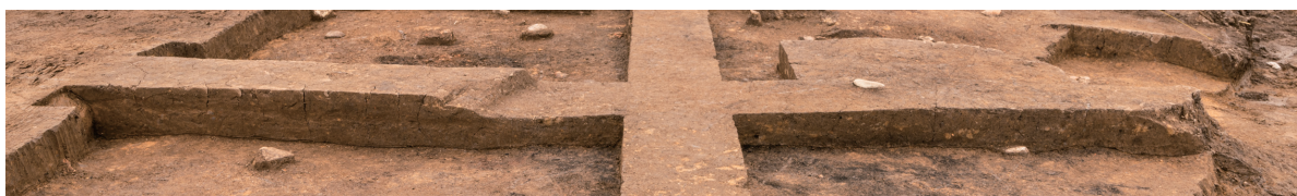
第7号竪穴建物跡 土層断面 北西から