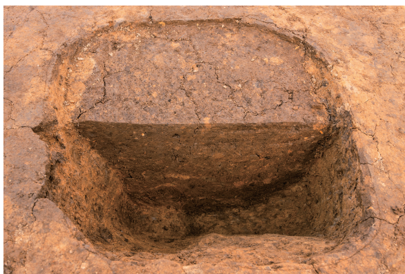
第4号竖穴建物跡 Pit01 土層断面 南西から