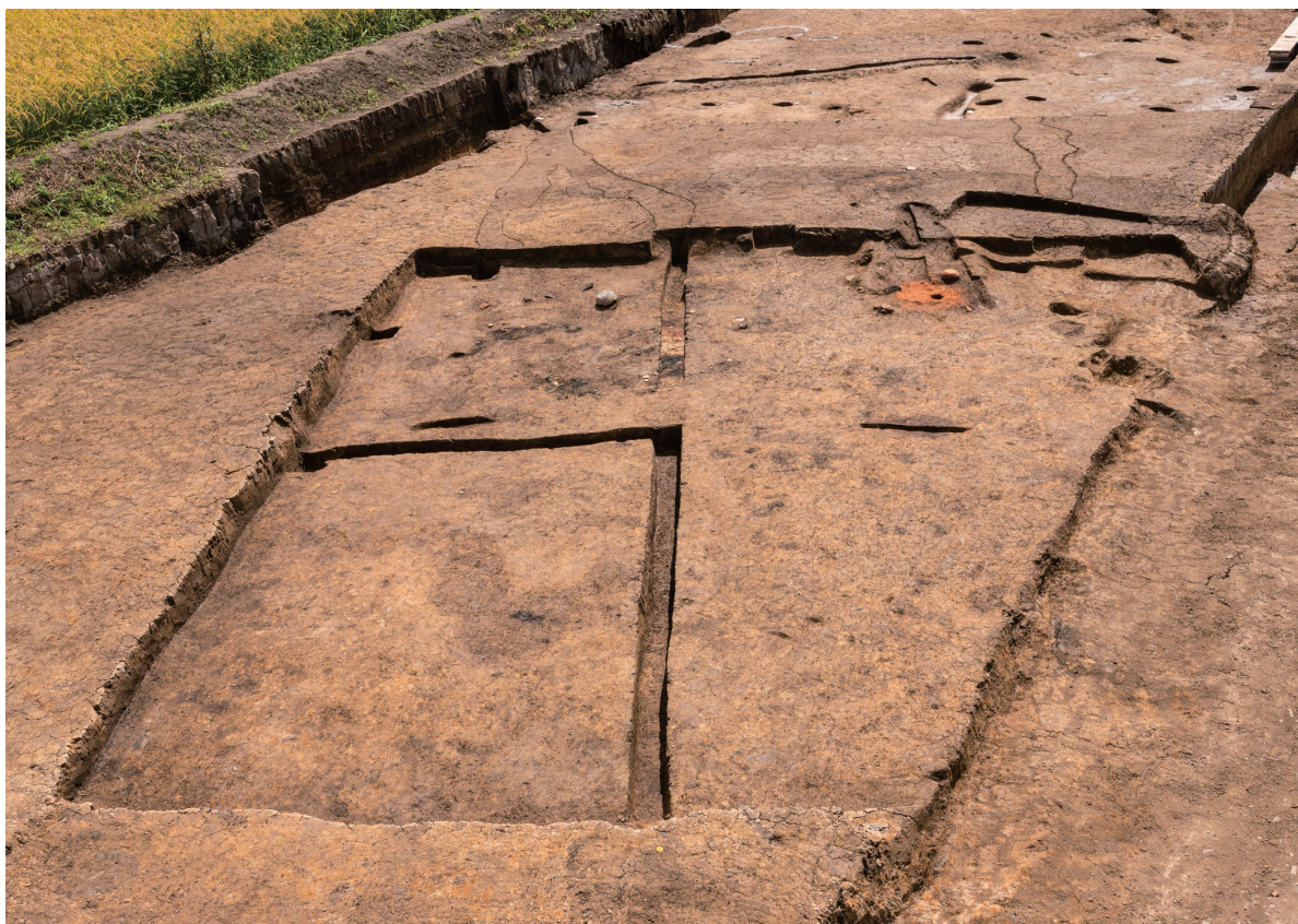
第7号竪穴建物跡 完掘 北西から