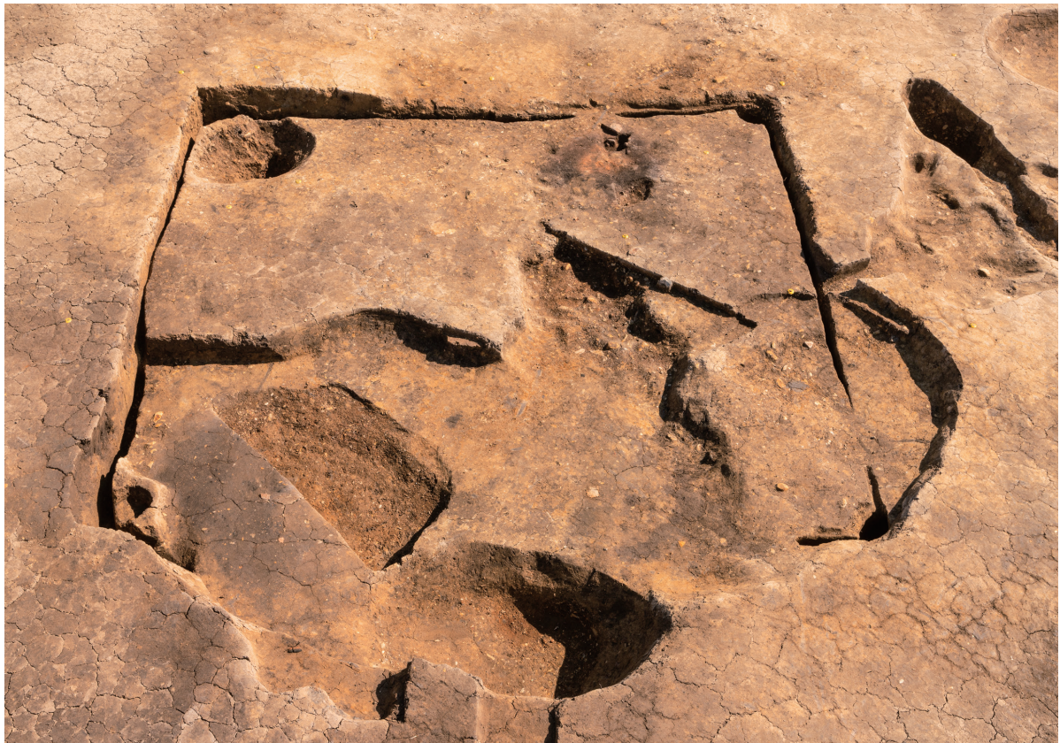
第8号竖穴建物跡 完掘 北から