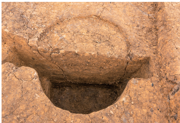
第7号竖穴建物跡(新)Pit09 土層断面 西から