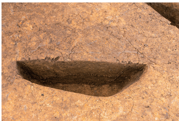
第7号竖穴建物跡(旧)Pit03 土層断面 北から