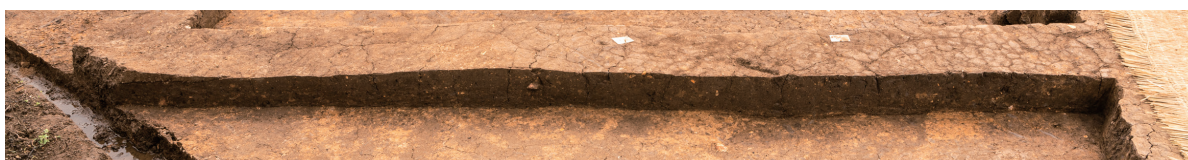
第4号・第5号竖穴建物跡 土層断面 東から