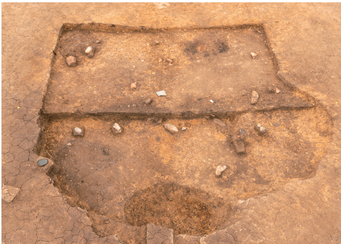
第8号竪穴建物跡 遺物出土 北から