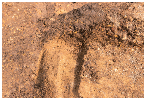
第10号竖穴建物跡壁溝 土層断面 南西から