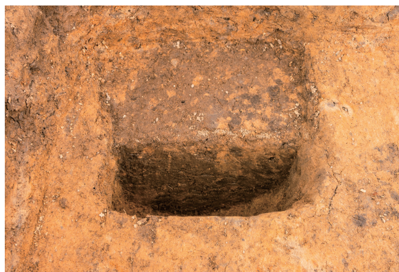
第4号竖穴建物跡 Pit06 土層断面 南東から