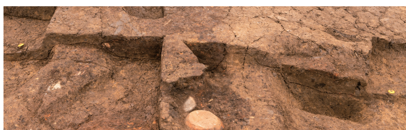
第7号竪穴建物跡(新)カマド 土層断面 北西から