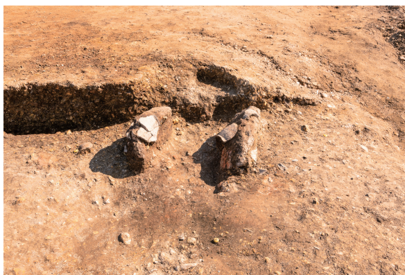
第10号竖穴建物跡カマド 完掘 北から