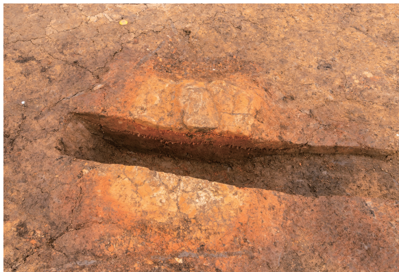
第7号竖穴建物跡(旧)カマド火床 土層断面 東から