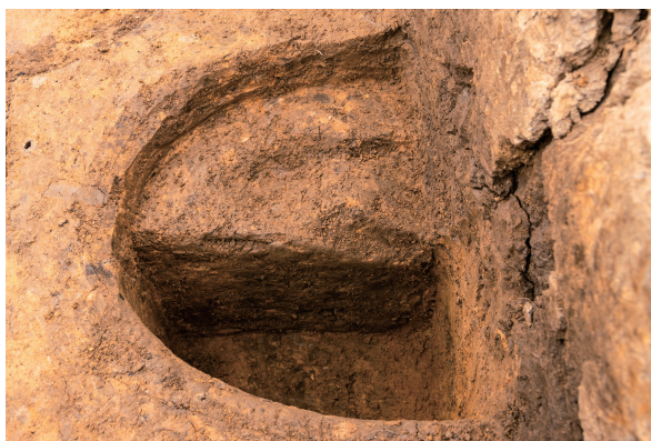
第5号竖穴建物跡 Pit11 土層断面 北西から