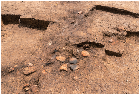
第7号竖穴建物跡(新)カマド 遺物出土 北西から