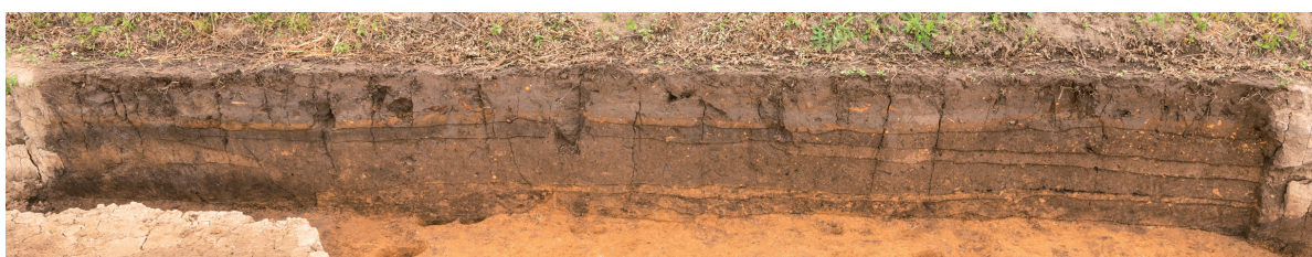
第4号・第5号竖穴建物跡 土層断面 西から