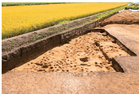
第4号・第5号竖穴建物跡 掘方完掘 北から