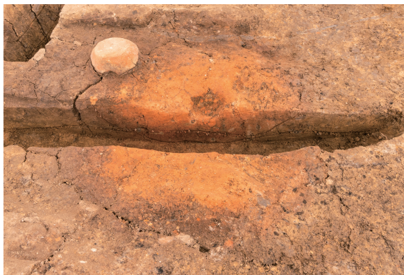
第7号竖穴建物跡(新)カマド火床 土層断面 東から