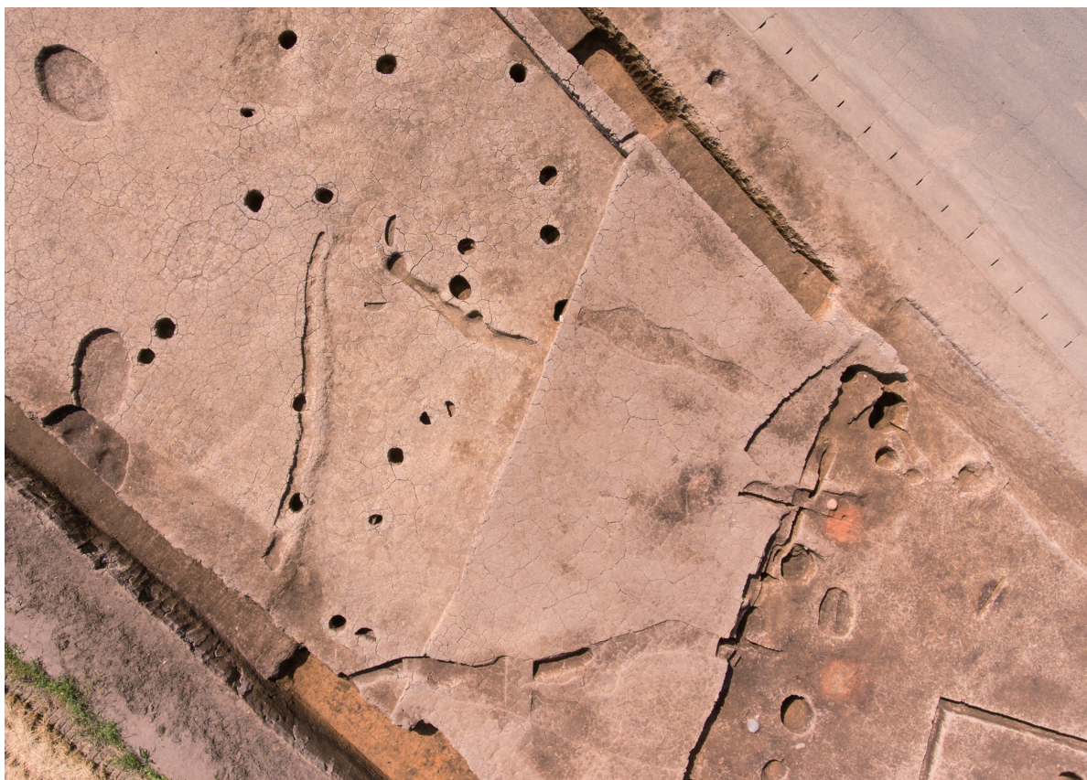
第7号竖穴建物跡(新)掘立柱建物部分 空中写真撮影 画面上が南西