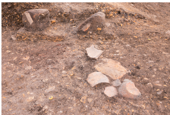
第10号竖穴建物跡 遺物出土 北西から