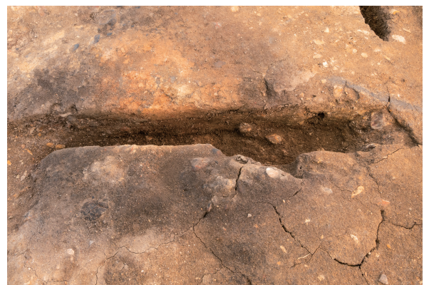
第8号竖穴建物跡カマド火床面 土層断面 西から