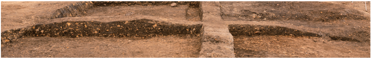
第10号竖穴建物跡 土層断面 北から