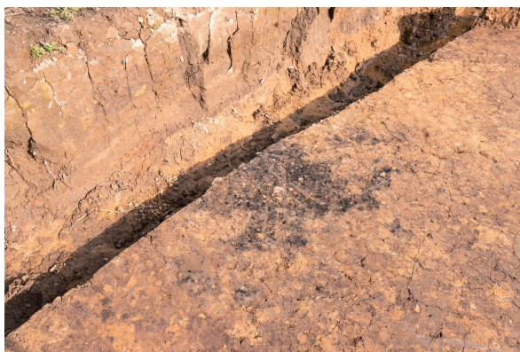
第4号竖穴建物跡 床面炭化物検出 西から