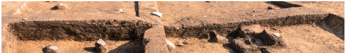
第8号竖穴建物跡 土層断面 北から