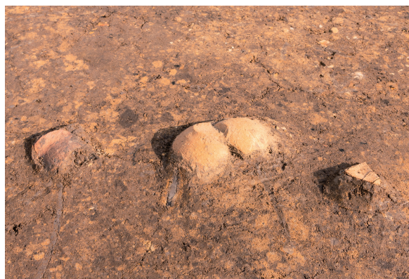
第4号竖穴建物跡 床面土器出土 北西から