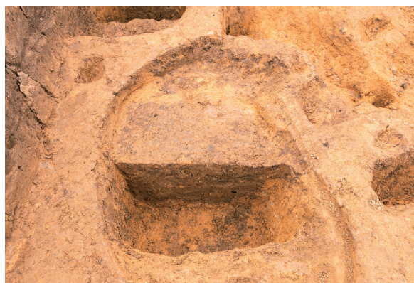
第5号竖穴建物跡 Pit10 土層断面 西から