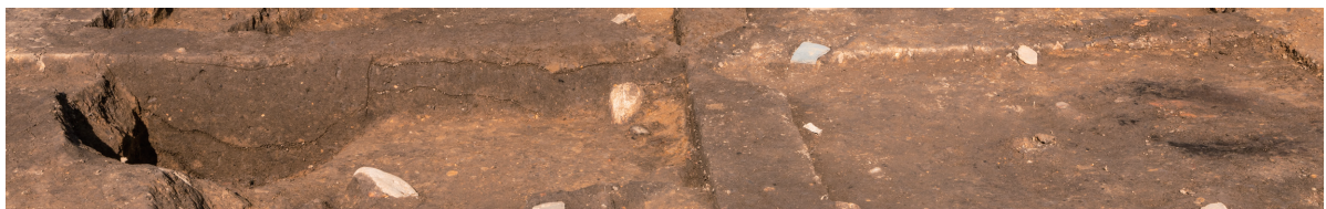
第8号竖穴建物跡 土層断面 西から