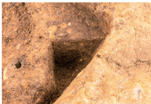
第8号竪穴建物跡 Pit01 土層断面 南西から