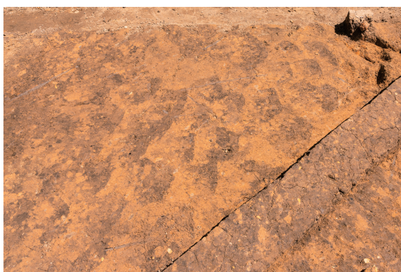
第4号竖穴建物跡 床下工具痕検出 西から