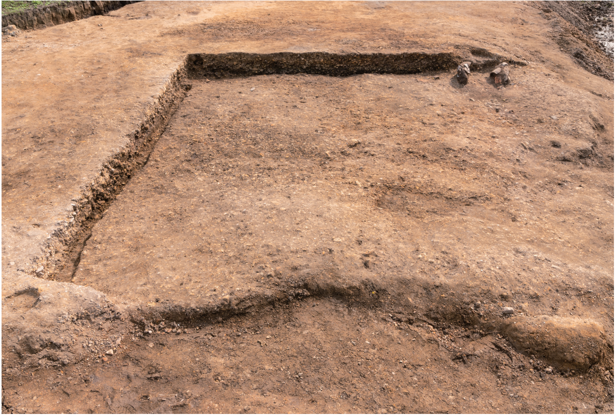
第10号竖穴建物跡 完掘 北から