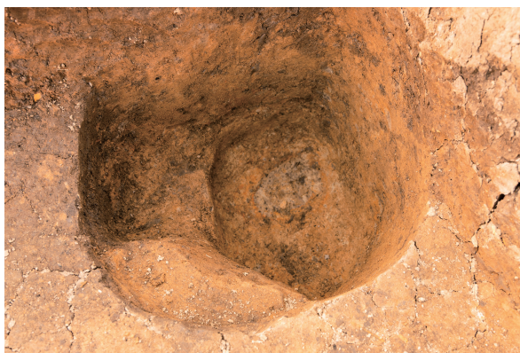
第5号竖穴建物跡 Pit08 完掘 南東から