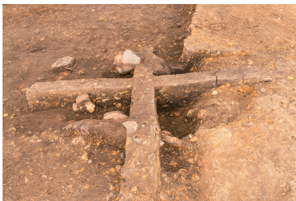
第10号竖穴建物跡カマド上部 土層断面 西から