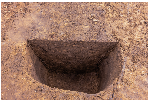
第7号竖穴建物跡(旧)Pit18 土層断面 南から