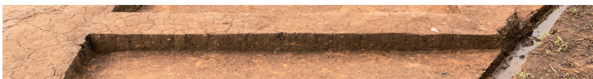
第4号・第5号竖穴建物跡 土層断面 南から