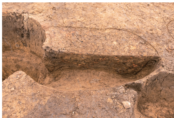
第7号竖穴建物跡(旧)Pit15 土層断面 南から