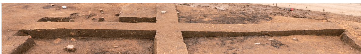
第7号竪穴建物跡 土層断面 北東から