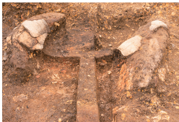
第10号竖穴建物跡カマド下部 土層断面 北から