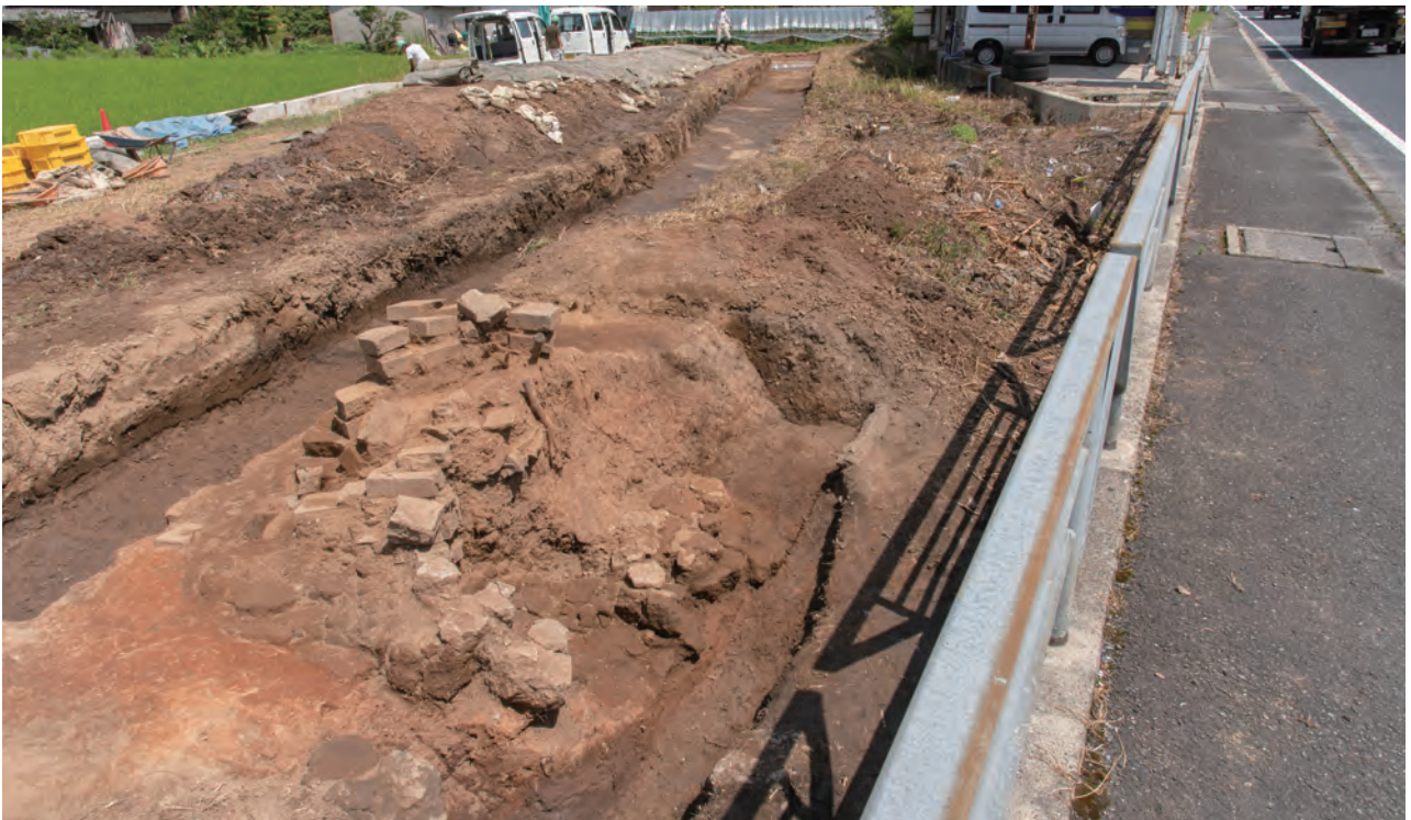
調査地全景（南から）

煙道は磚を積み上げて作る点が特徴です。7段分（高さ約0.5m）の磚積が確認出来、南北に平行する2条の磚積の間の約0.7mが煙道と考えられますが、未調査のため詳細な構造は不明です。