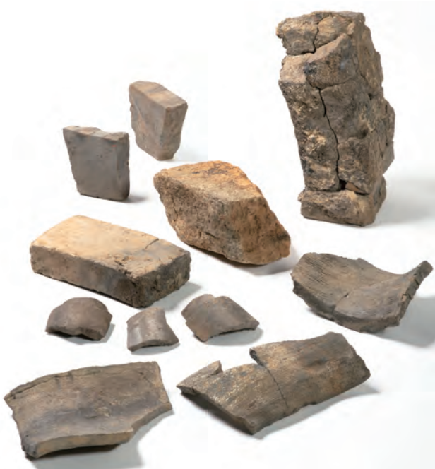
出土瓦類（手前は製品とみられる丸瓦・平瓦、それより奥は窯の構築部材である埴・日干煉瓦）

瓦窯の製品とみられる平瓦には、凹面に模骨痕の無い「一枚作り」と、模骨痕らしき浅い段差が残るものに分けることができます。後者は一見「桶巻き作り」とみられますが、凹面の側縁に沿って布端の圧痕あり、また隅部の破片には布端の圧痕がL字形に残っているものがあります。このような痕跡は布袋を使う「桶巻き作り」によるものと考え難く、短冊形の板をならべた成形台を使用し