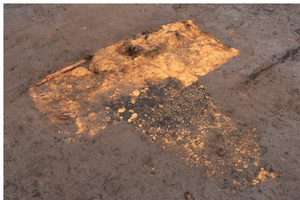
SD 1 検出状況 (北西より)