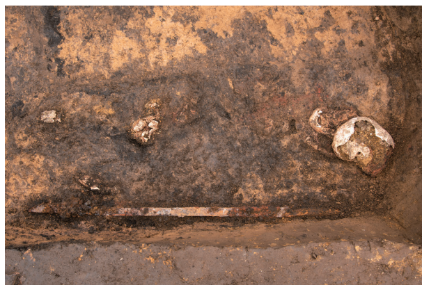
ST 1 人骨・遺物出土状況 [掲載番号5]