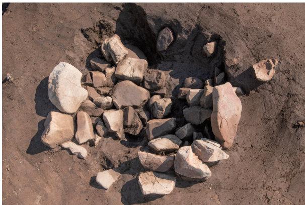
SI13 検出状況 (北西より)