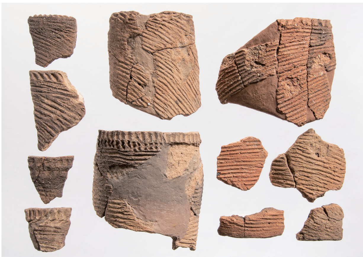
I 類土器 (3)