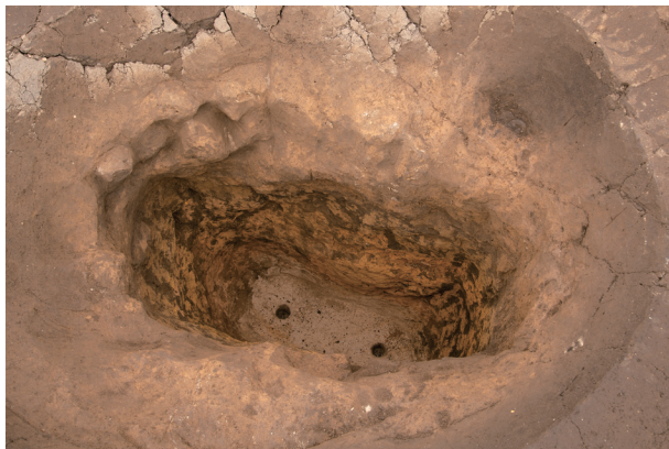
SS2 完掘状況 (西より)