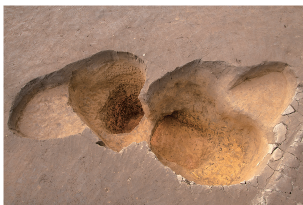
SP 4 完掘状況 (北東より)