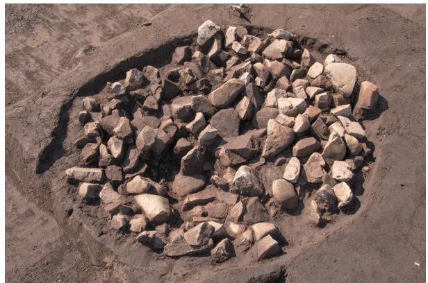
SI89 検出状況 (北東より)