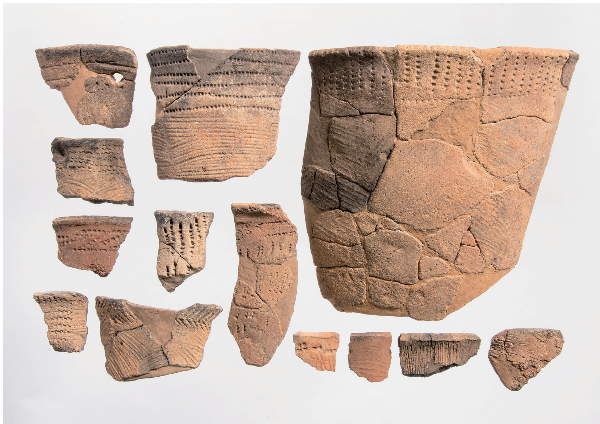
II 類土器 (4)