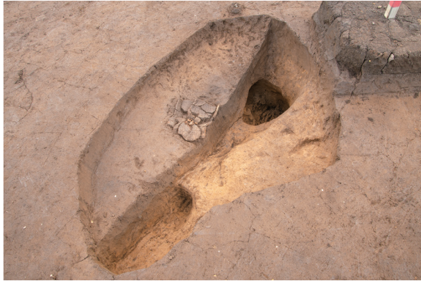
SC59 遺物出土状況 (北西より)