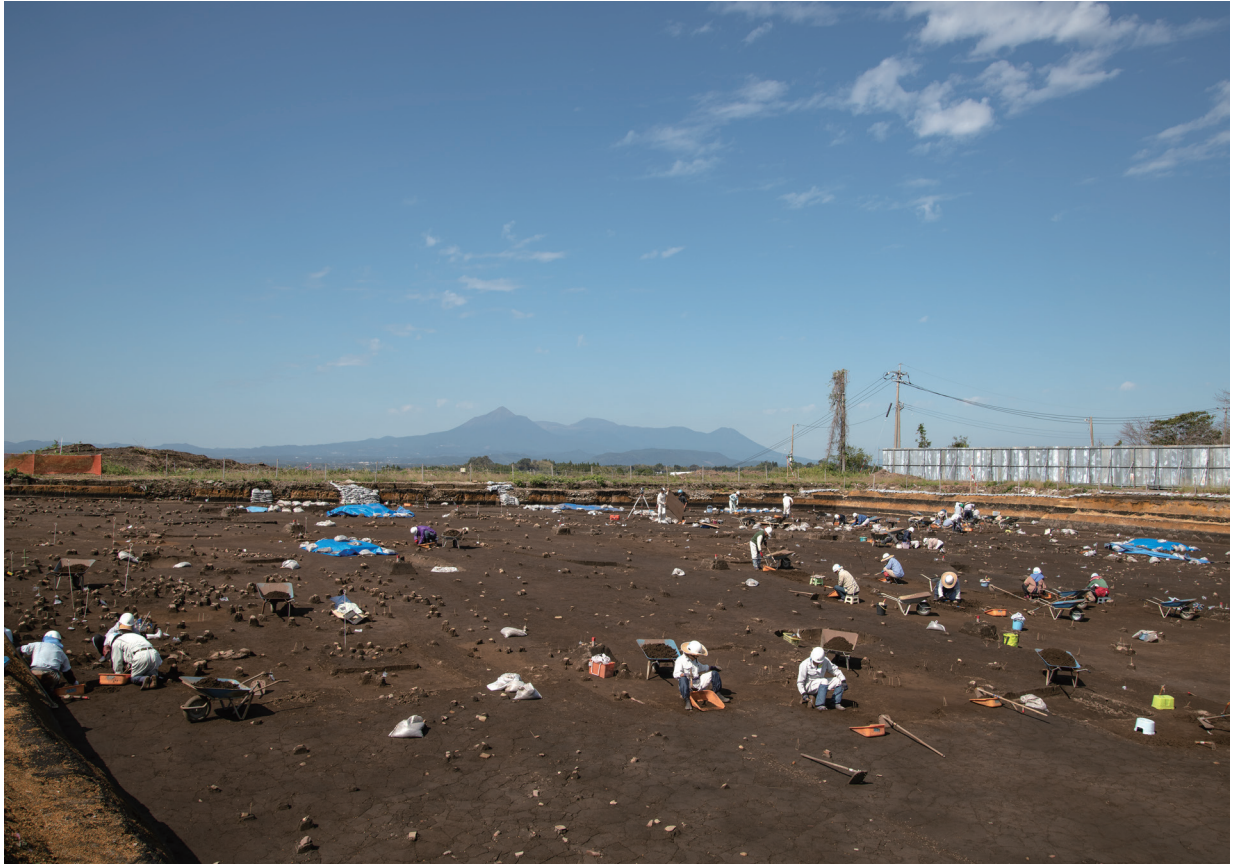
発掘調査風景（南東より）