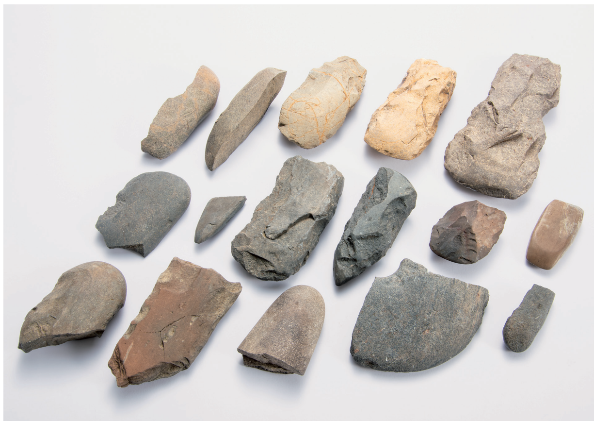
石斧·環狀石斧·棒狀石器