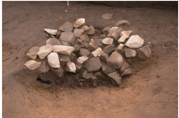
SI10 半截状況 (東より)