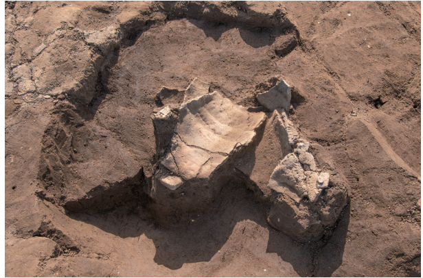
SC23 遺物出土状況 (北西より)