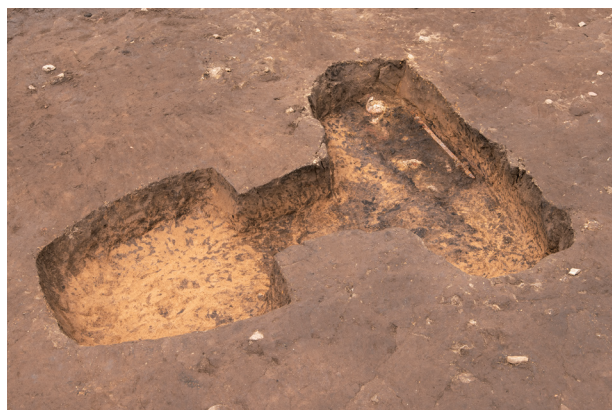
ST 1 完掘状況 (南西より)