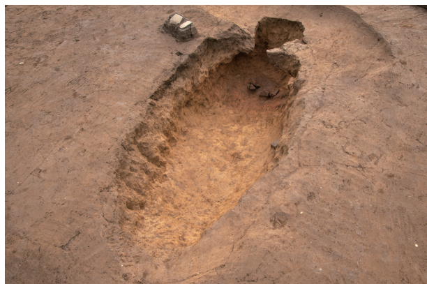
SP 1 完掘状況 (北西より)