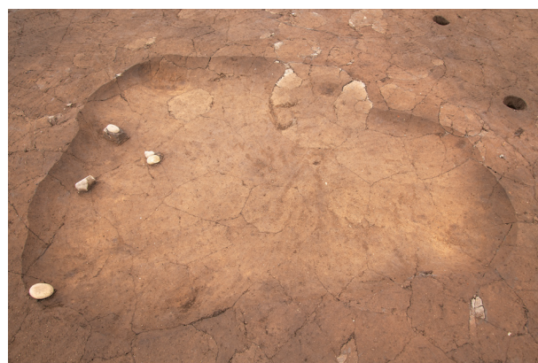
SJ 4 完掘状況 (南東より)