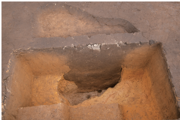
SS6 半截状況 (南西より)