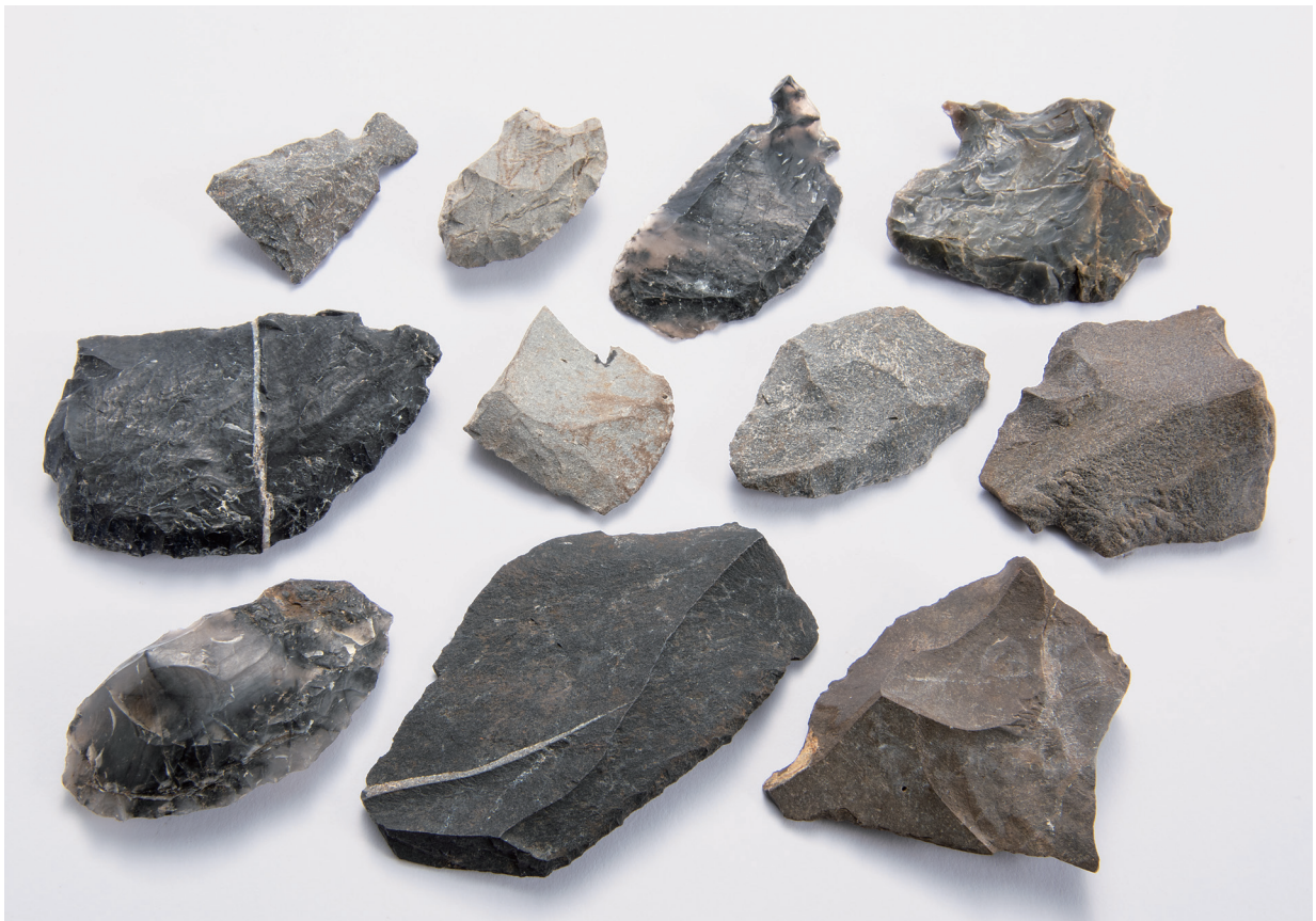
石匙・スクレイパー・微細剥離剥片