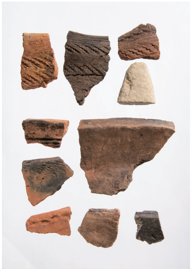
SA1・縄文時代後期～晩期包含層出土遺物