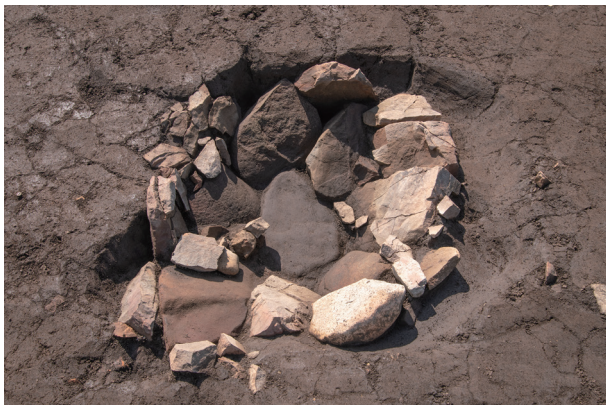
SI30 検出状況 (北より)