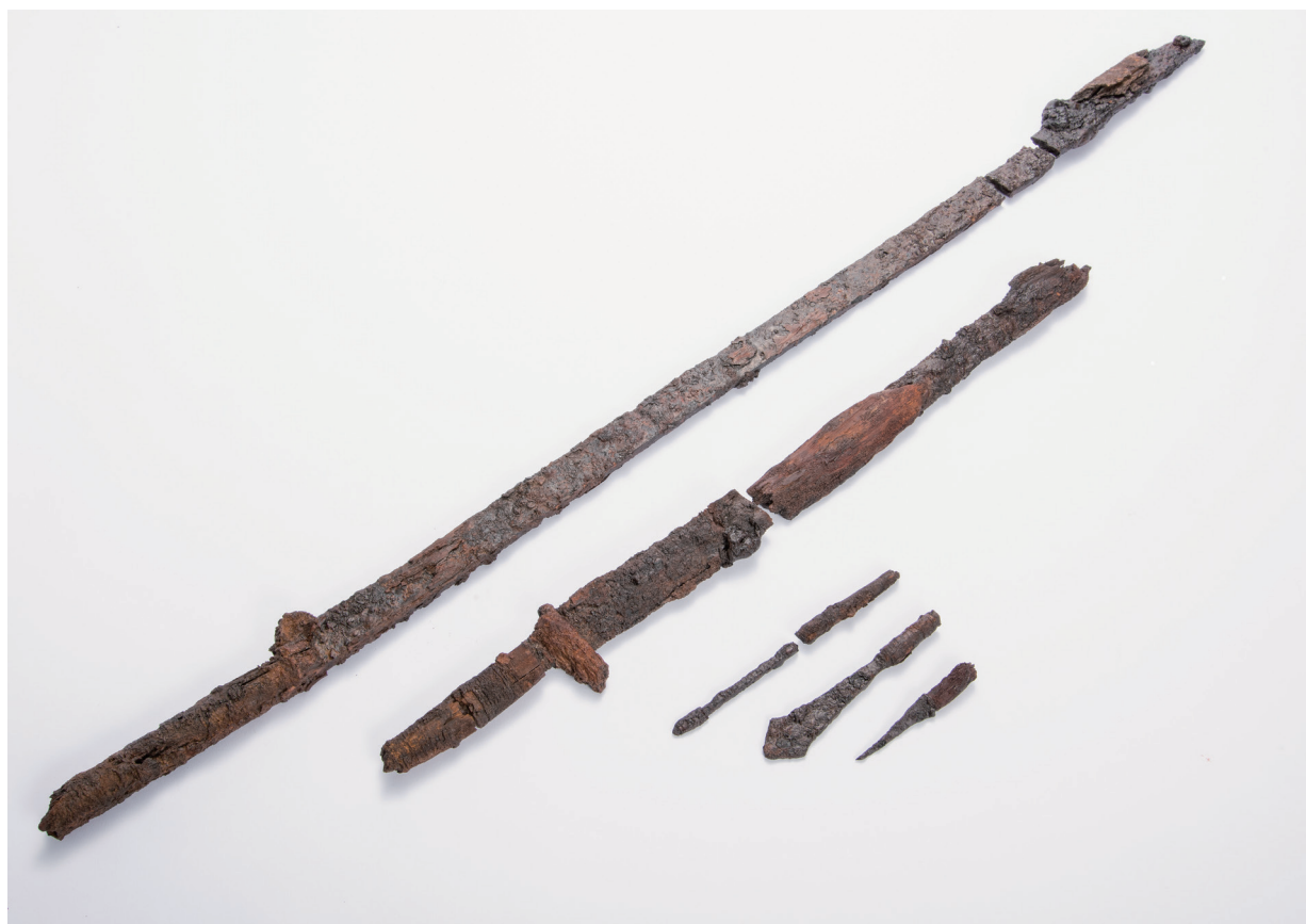
SD 1・ST 1出土鉄製品