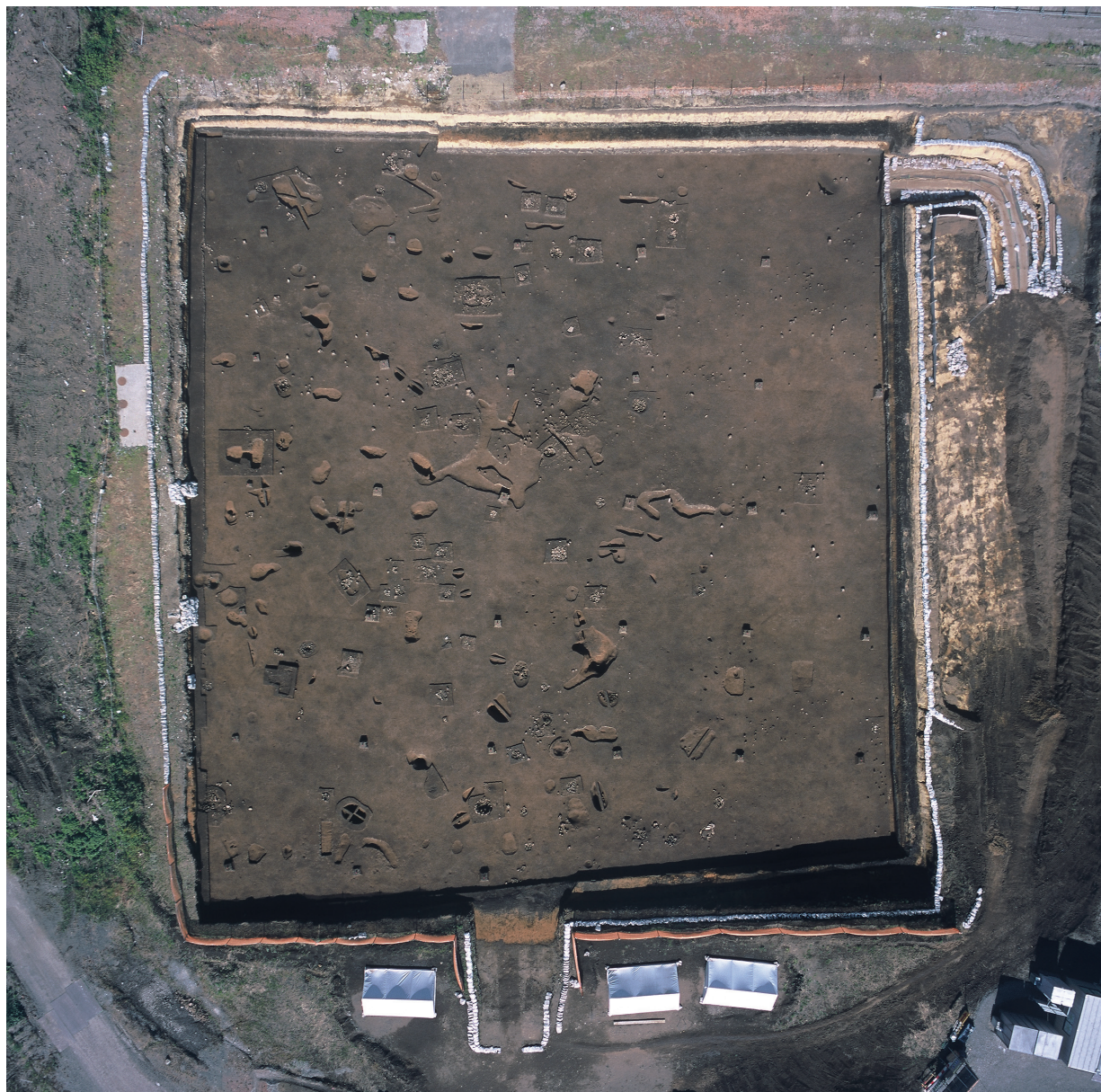
調査区全景 (2) [第Ⅳ層検出面・上が北]