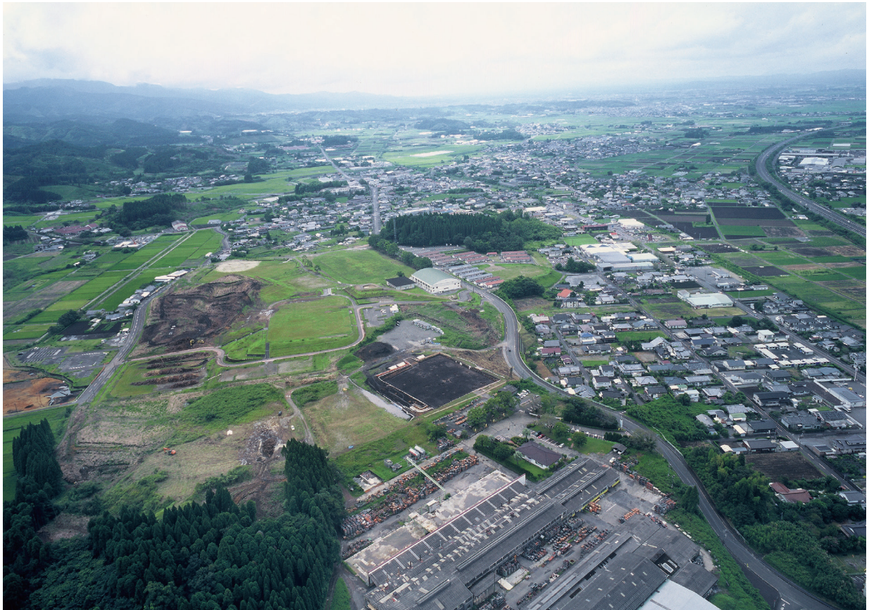
遺跡の立地(1) (北より)