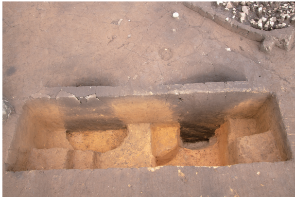
SC61(左)・SS8(右) 半截状況 (南西より)