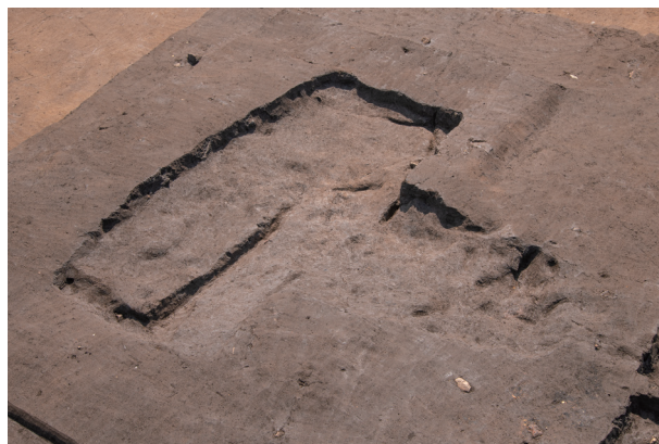
SD 1 完掘状況 (北西より)