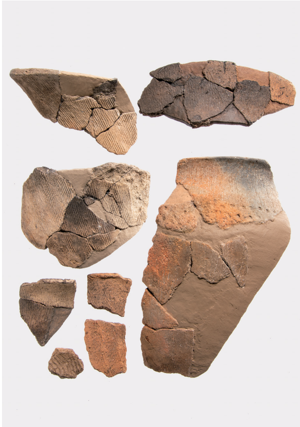
Ⅶ類土器 (6) 撚糸文