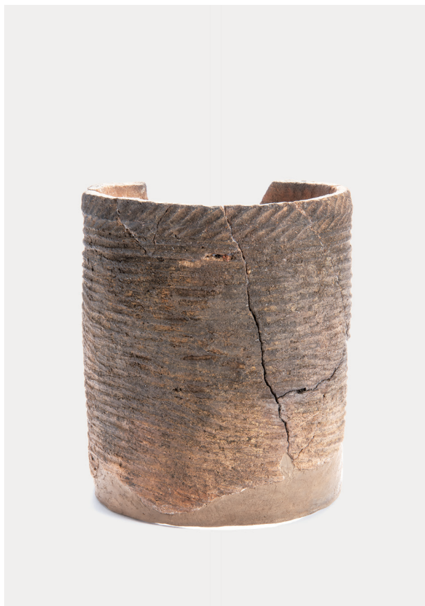
I 類土器 (2)