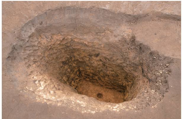
SS1 完掘状況 (北より)