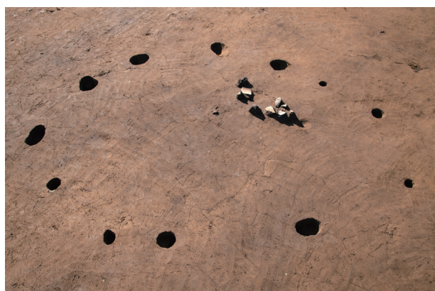
SB 3 柱穴完掘状況 (東より)