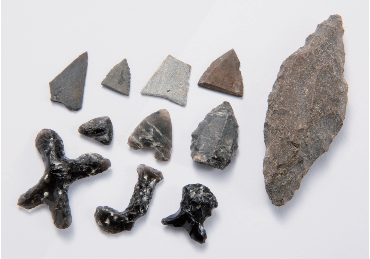
磨製石鏃・尖頭器・異形石器・尖頭状石器