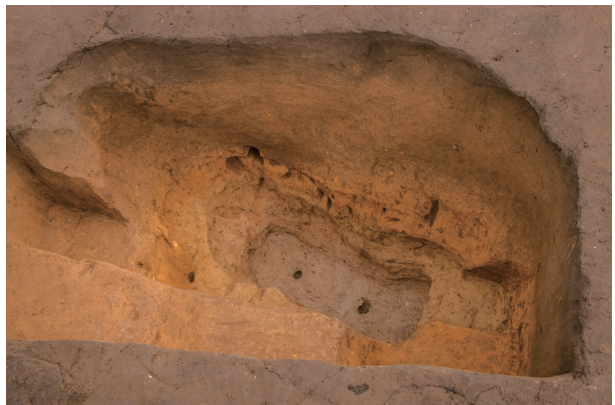
SS7 完掘状況 (西より)