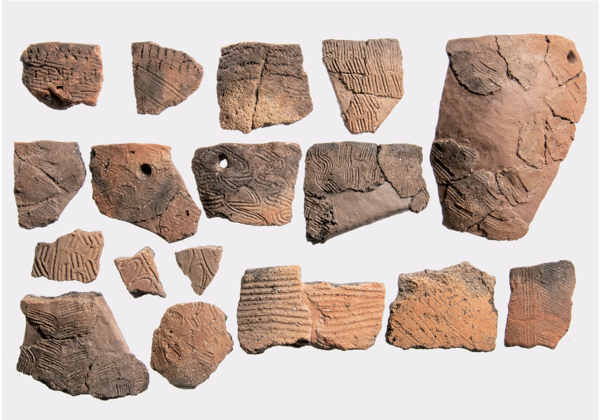
IV · V · VI類土器