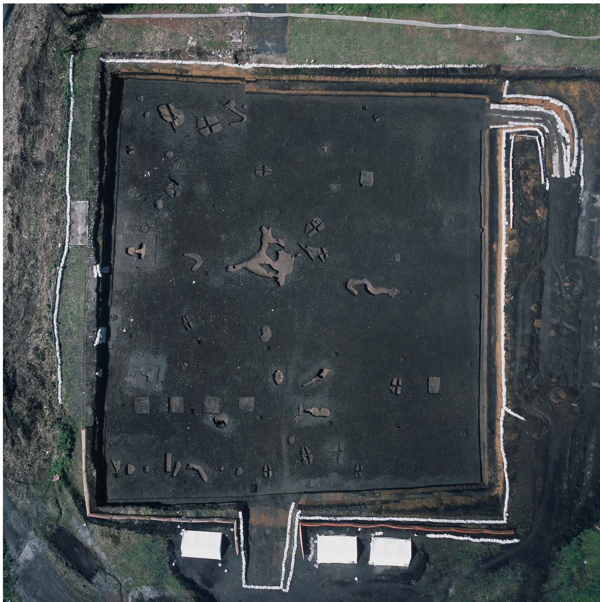
調査区全景 (1) [第XIV層検出面・上が北]