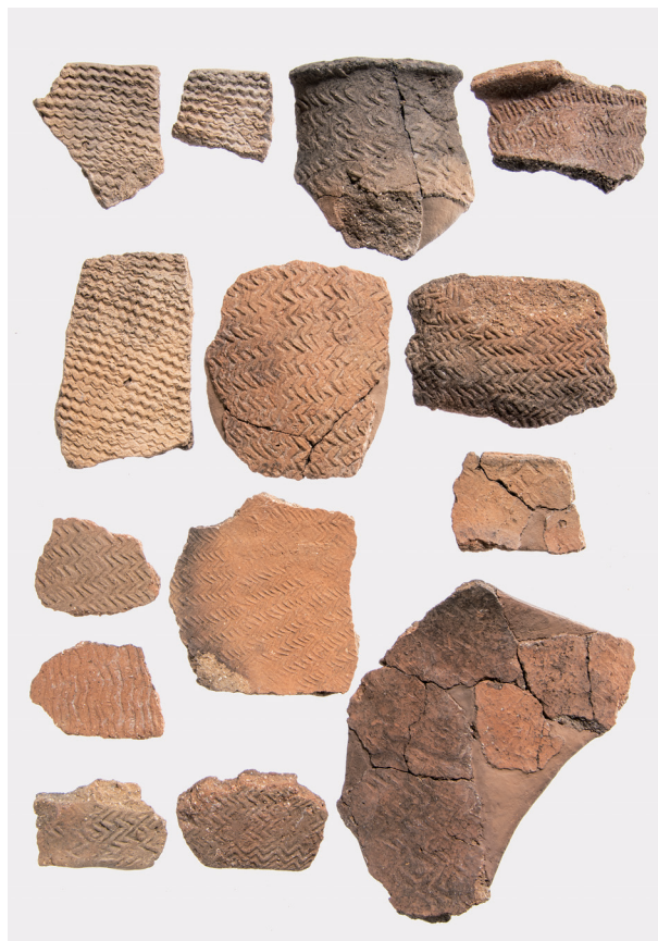
Ⅶ類土器 (3) 山形押型文