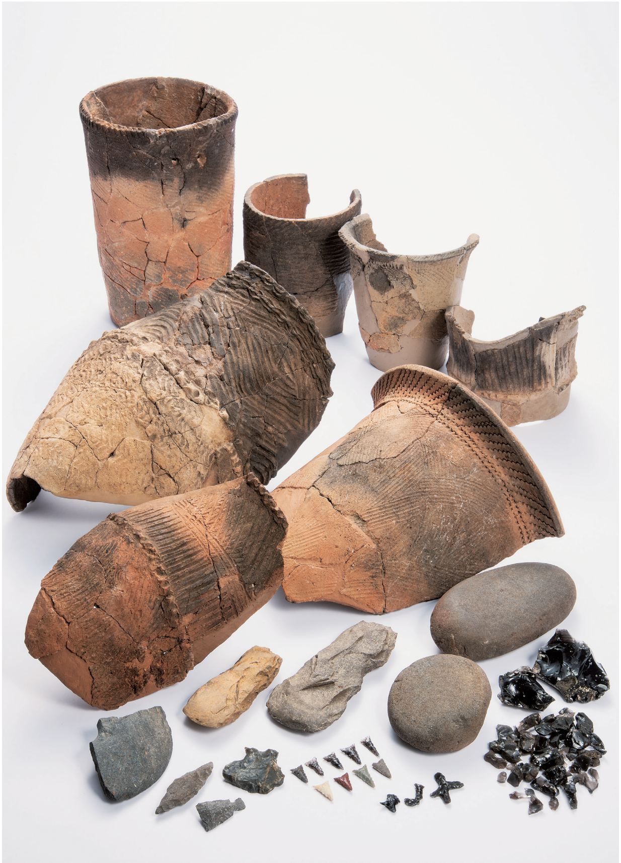
縄文時代早期の遺物