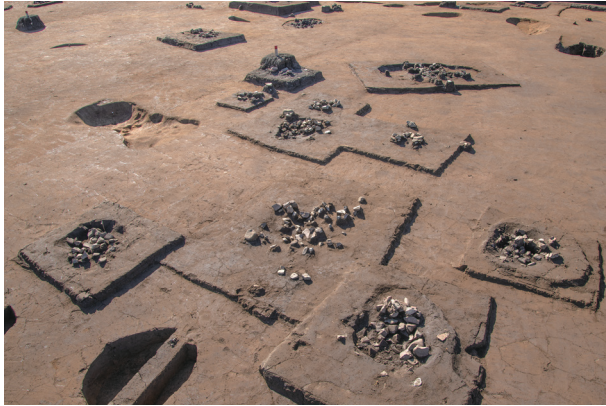
D5Gr. 周辺の集石遺構群 (北東より)