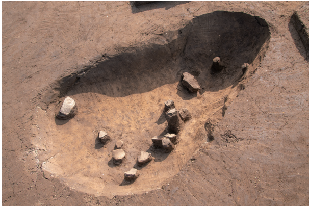
SC17 遺物出土状況 (西より)