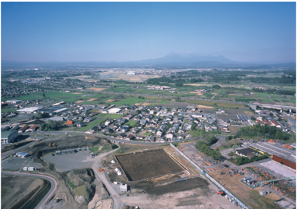
遺跡の立地(2) (東より)