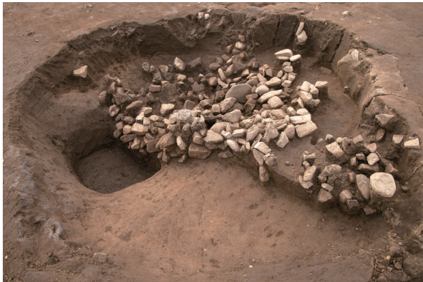
SI48 半截状況 (北東より)