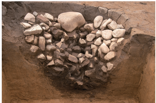
SI96 半截状況 (東より)