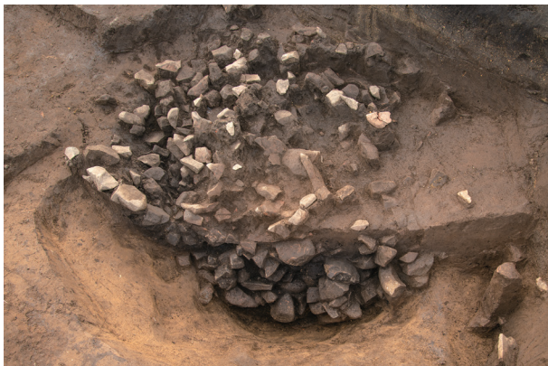
SI91 半截状況 (北東より)