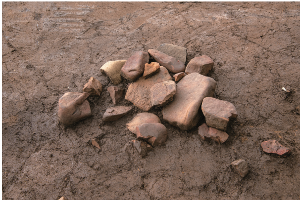
SI2 検出状況 (北より)