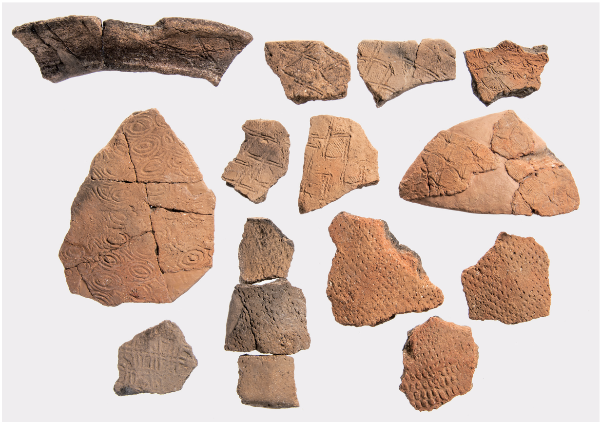
Ⅶ類土器 (8) 変形撚糸文・同心円押型文・格子状押型文・短枝回転文