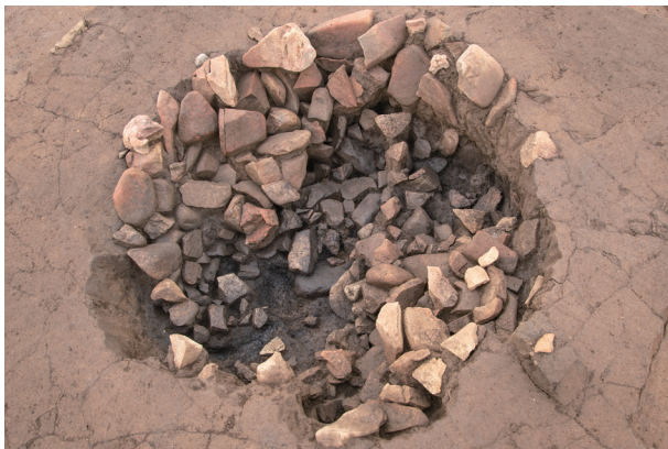
SI87 検出状況 (北より)