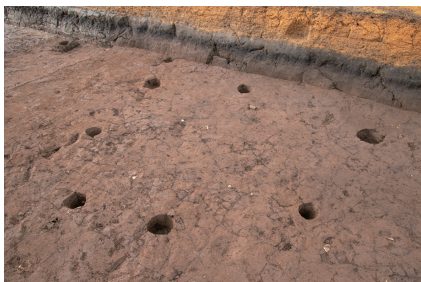
SB 1 完掘状況 (南より)