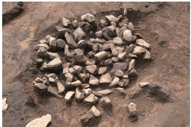
SI25 検出状況 (北より)