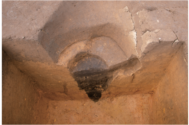
SC60 半截状況 (東より)