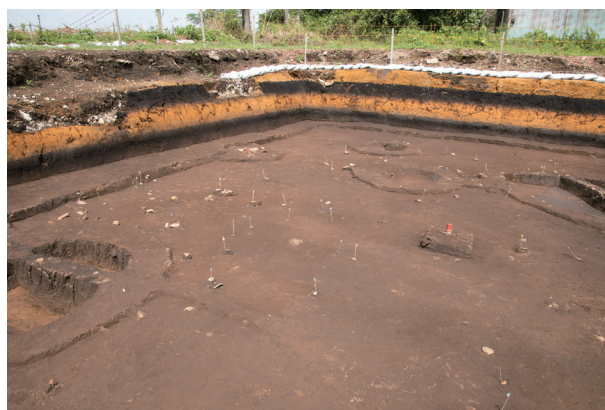
第XIV層遺物出土状況 (B2~C2Gr.・南東より)