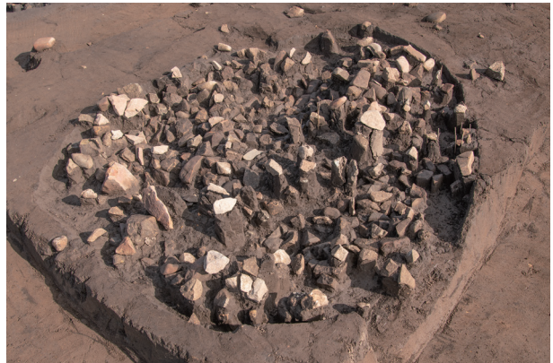
SI78 検出状況 (南西より)