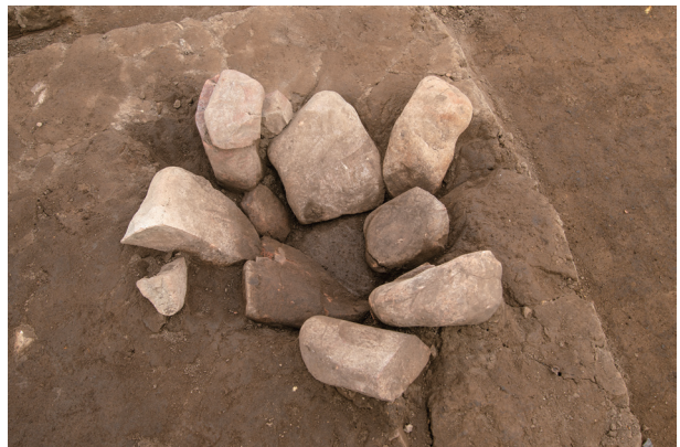
SI33 配石状況 (西より)