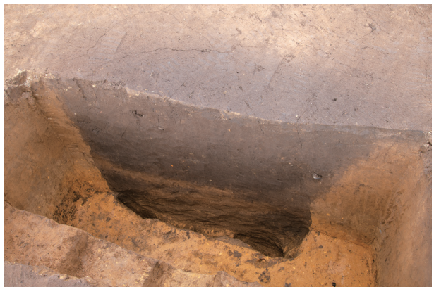
SS3 半截状況 (南西より)