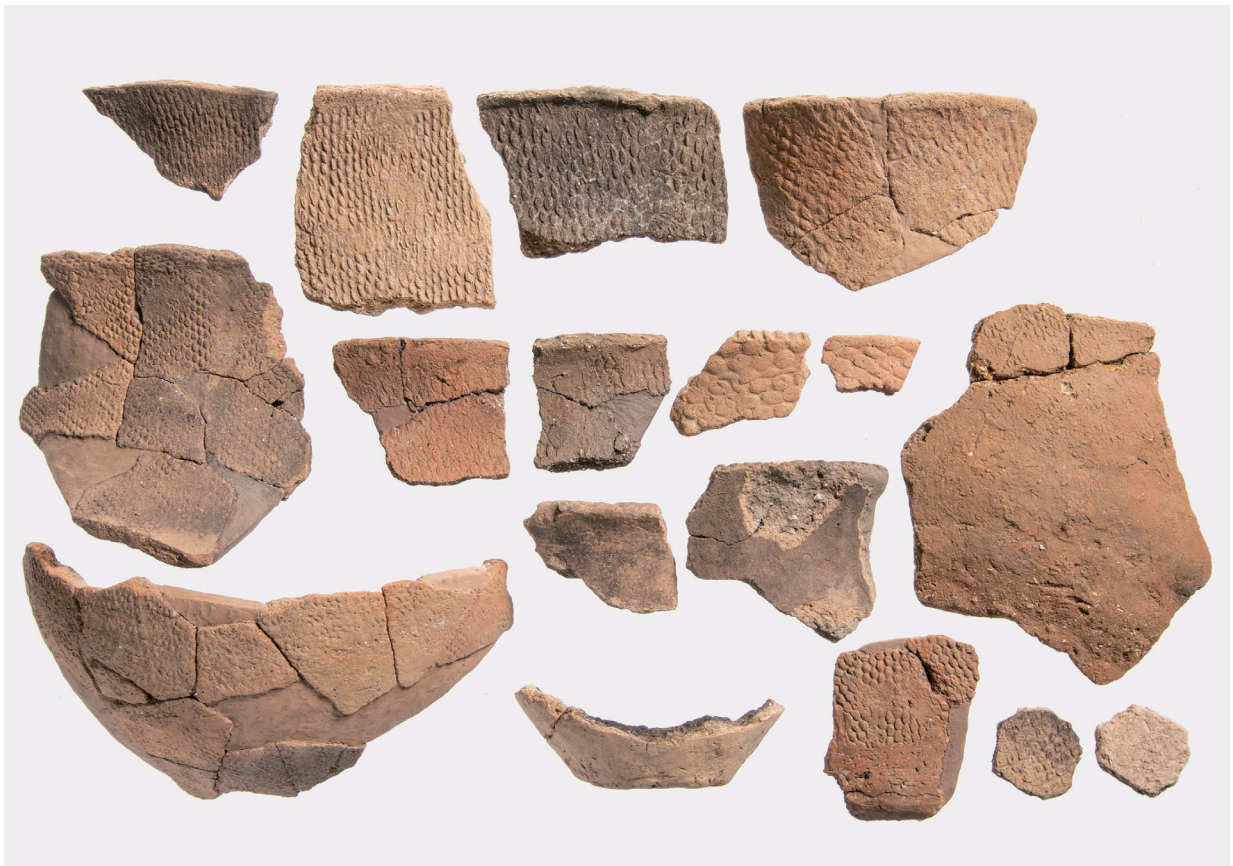
VII類土器(1) 橢圓押型文