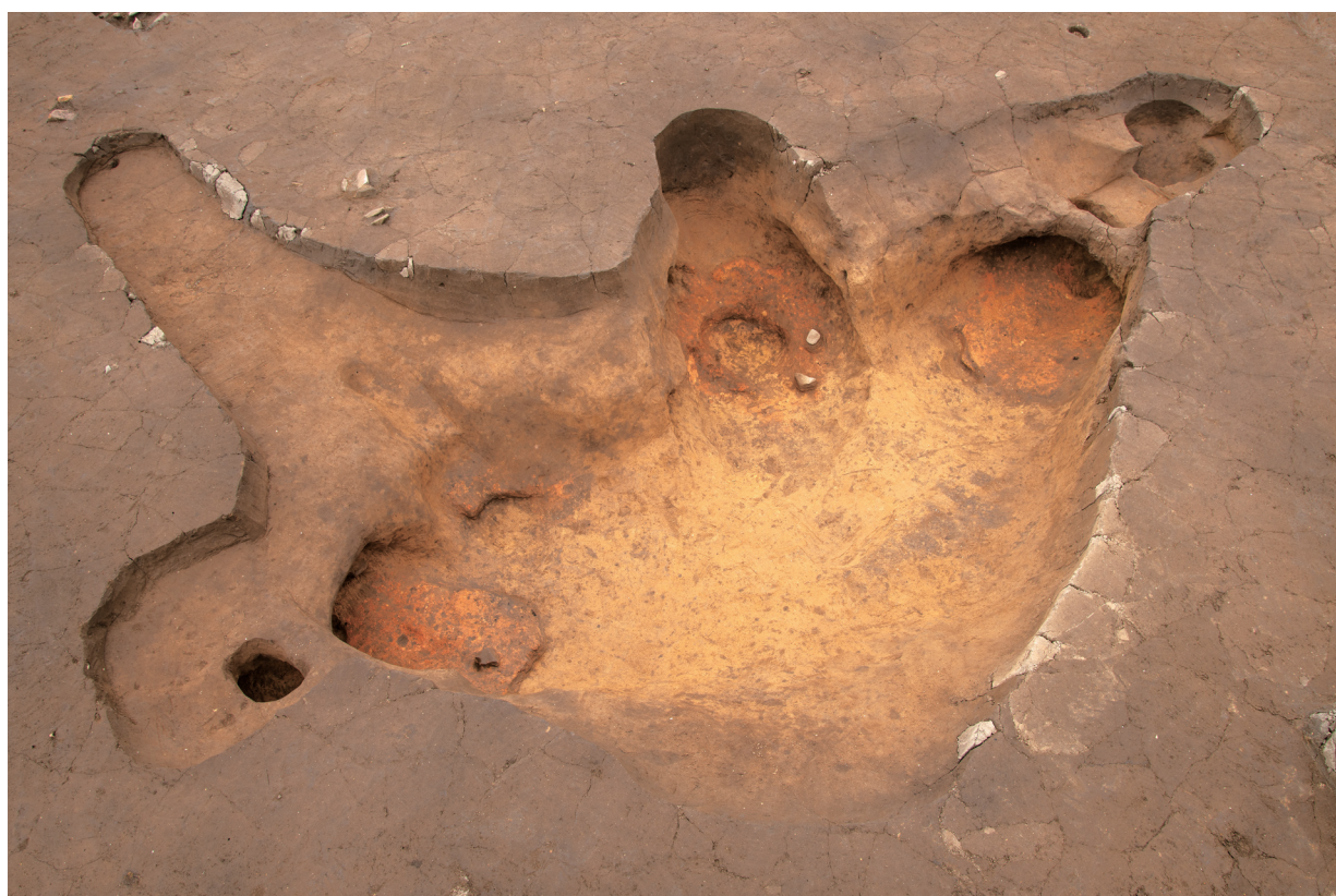
SP 3 完掘状況 (東より)