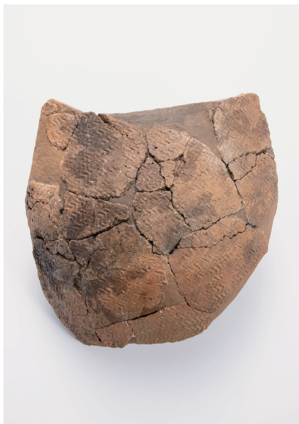
Ⅶ類土器 (4) 山形押型文