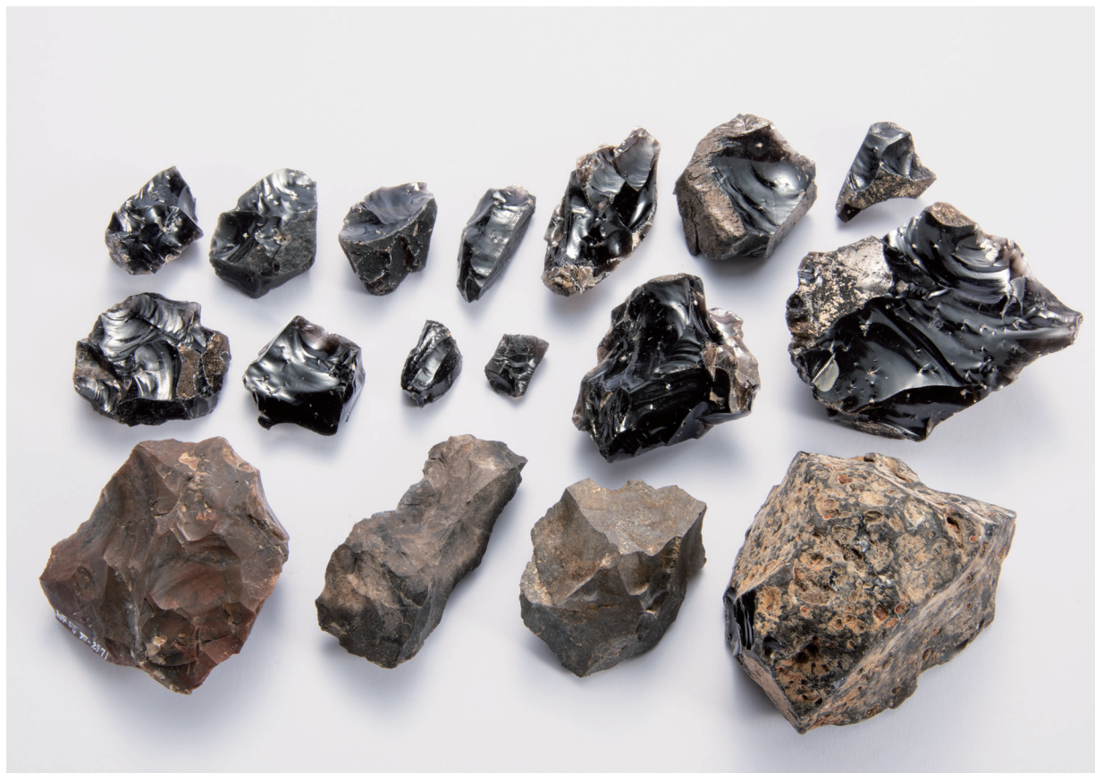
石核·細石刃核·原石