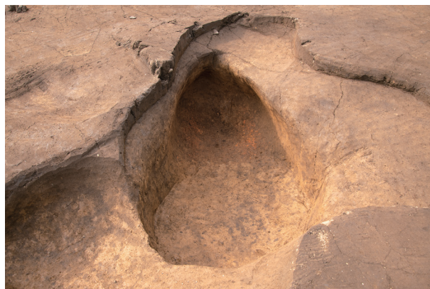
SP 2 完掘状況・燃烧部 (東より)