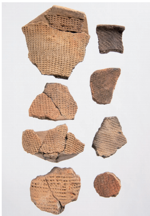
Ⅶ類土器 (5) 格子目押型文・縄文