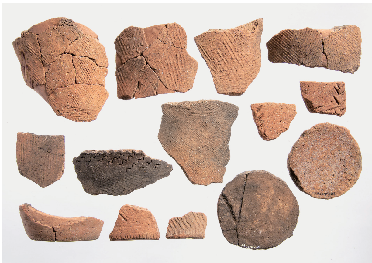
II 類土器 (5)