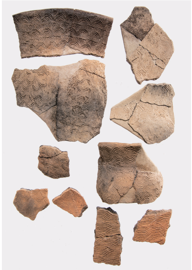
Ⅶ類土器 (7) 変形撚糸文