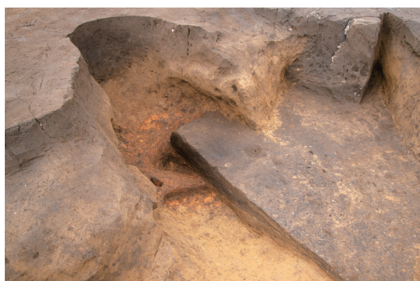
SP 3 第1煙道・燃烧部 (南東より)