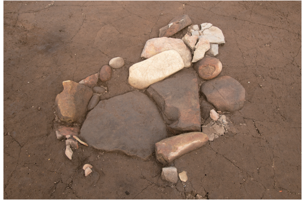
SU2 検出状況 (南より)