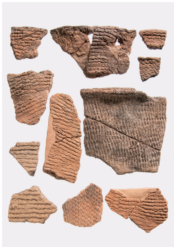
Ⅶ類土器 (2) 連珠押型文