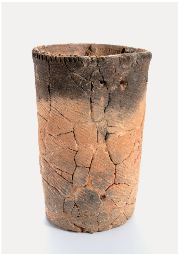
I 類土器 (1)