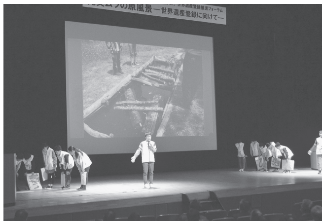
世界遺産登録推進フォーラム発表「遺跡ガイド」