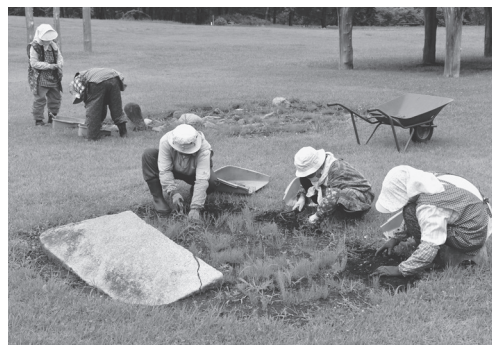
御所野発掘友の会 配石遺構の草取り