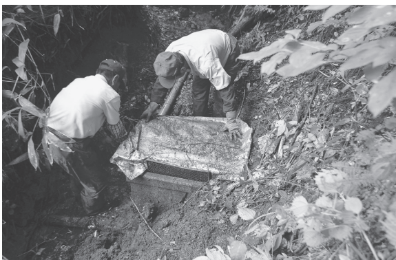
水場の設置「水路崩壊による修理作業」