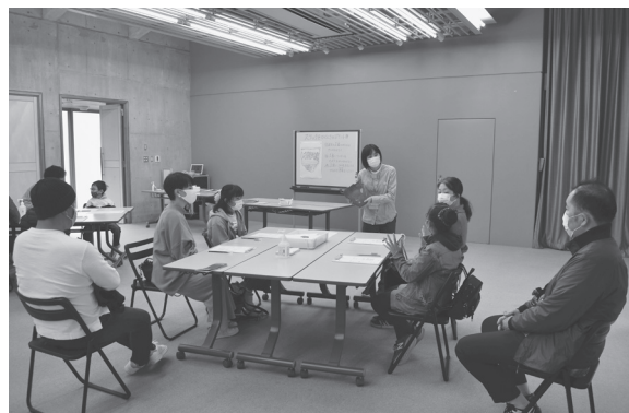
御所野縄文WEEK「ドキドキ考古学者体験」