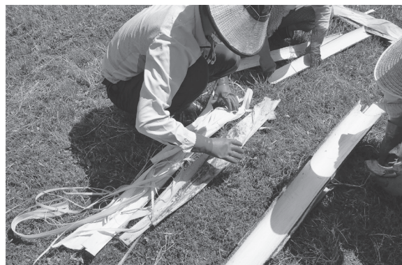
こだわりメニュー「シナノキまるごと体験」