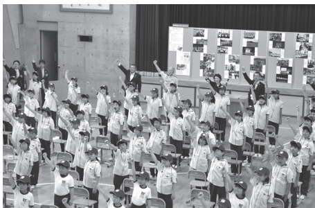
20周年記念品贈呈式・結団式