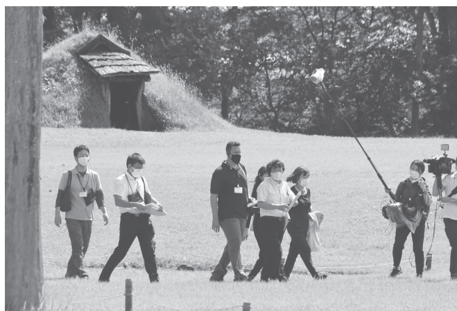
イコモス現地調査