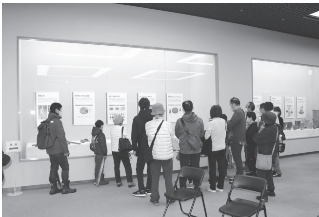
『縄文ムラの原風景』展 来場者見学風景