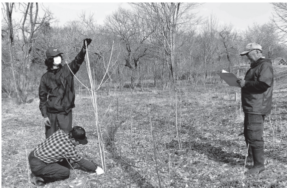
植生復元実験「ウルシの木の更新実験」