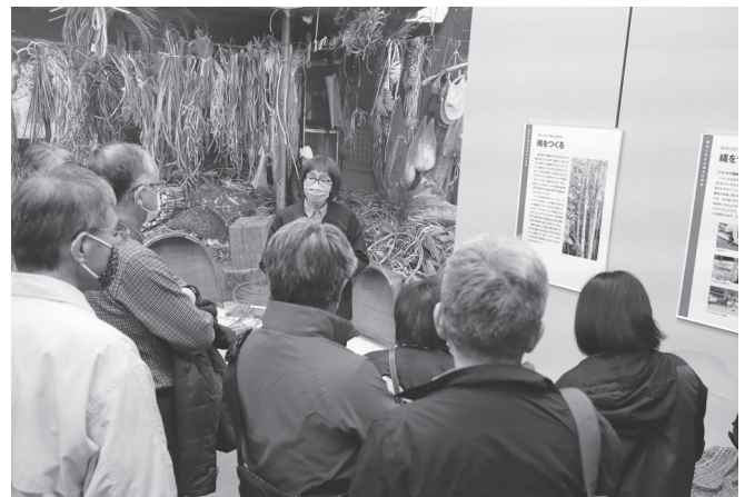
『縄文ムラの原風景』展 ギャラリートーク