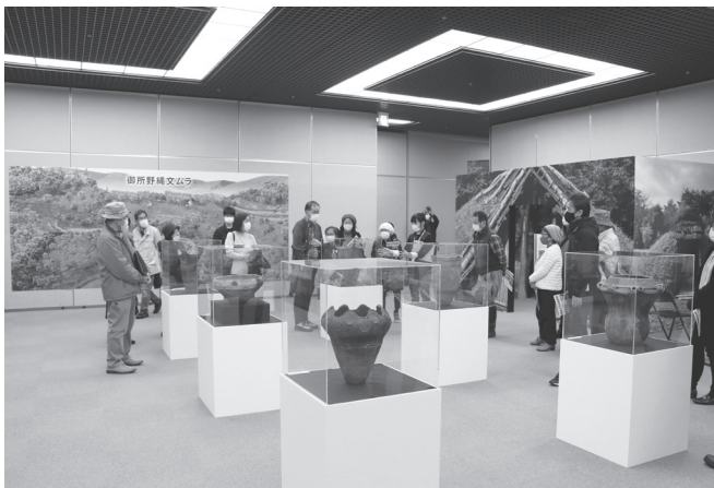
『縄文ムラの原風景』展 ギャラリートーク