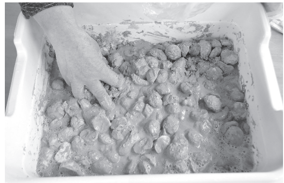
植物利用調査「トチのアク抜き作業」