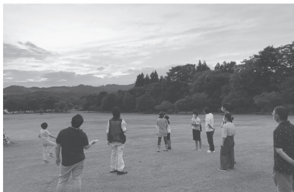
ごしょの自然体験「縄文星空体験」