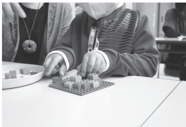
御所野遺跡世界遺産登録推進協議会主催ワークショップ 「レゴブロックで縄文時代を創ろう」