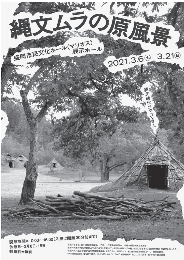
『縄文ムラの原風景』展チラシ (表)