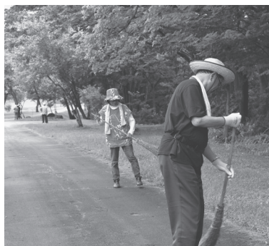
ボランティア連絡協議会 清掃活動