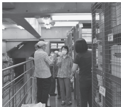
ボランティア連絡協議会 収蔵庫見学