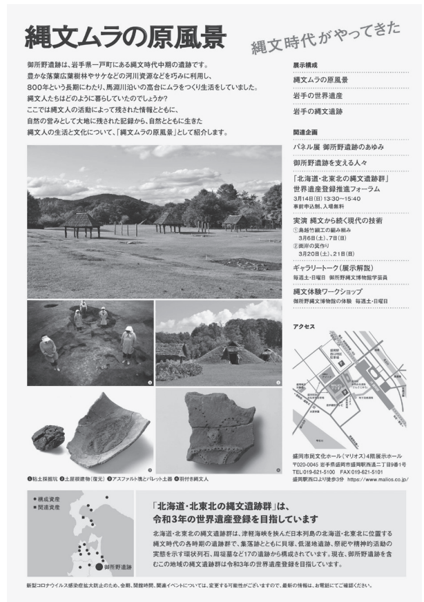
『縄文ムラの原風景』展チラシ (裏)