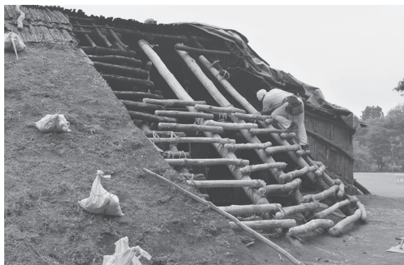
大型復元竪穴建物の修理作業