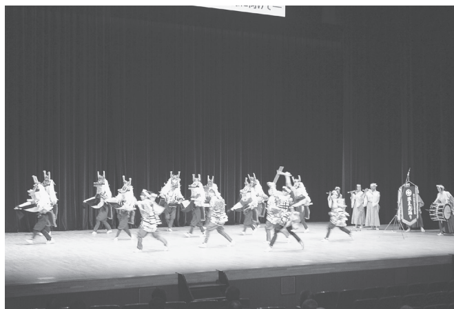
世界遺産登録推進フォーラムアトラクション「根反鹿踊り」