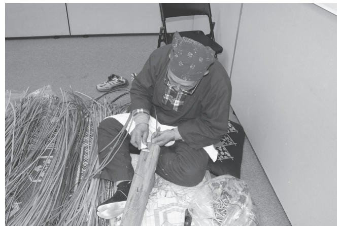
『縄文ムラの原風景』展 実演 面岸の箕づくり