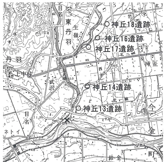
第1図 採集地点と周辺の遺跡

利別目名川は後志利別川の支流であり、全長約16kmで、メップ岳付近をその源とする。旧河川流路は今金町と北桧山町の町界となっている。遺跡が所在する神丘地区は、南に後志利別川、東に同支流のトマンケン川、西に目名川が流れ、これらに囲まれた三角形の地域に4段の段丘面が発達している。これらのうち、上位の3段は扇状地が段丘化したも