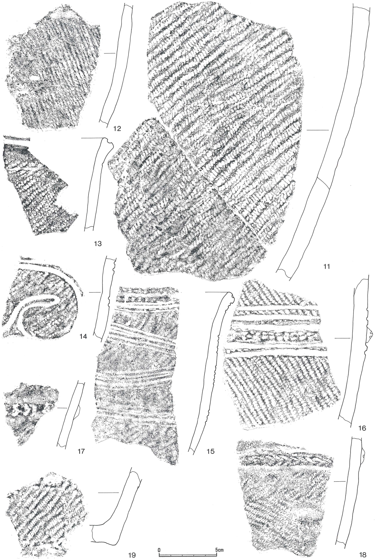
第3図 利別目名川採集の土器 (2)