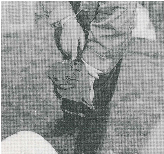
黒耀石の割れ方 (第1回)