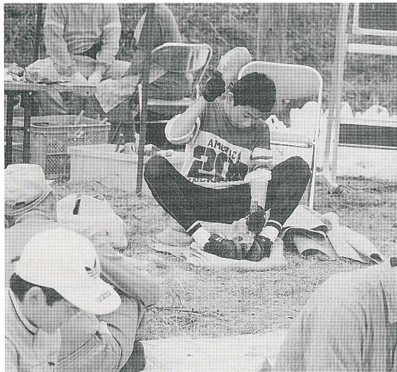
間接打撃による石刃技法 (第3回)