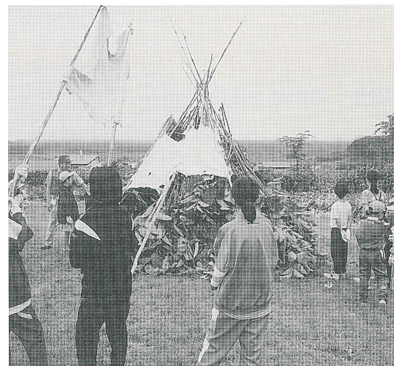
旧石器時代の住居推定復元 (第11回)