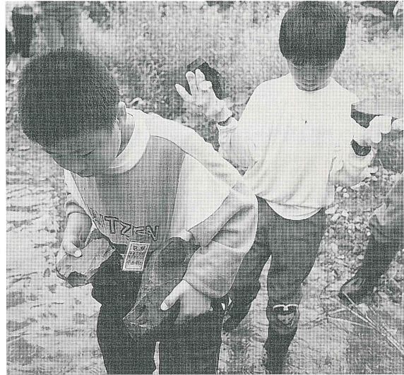
河原での頁岩採集 (第2回)