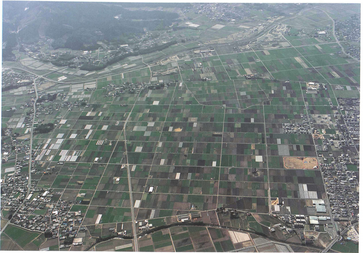
図版4 宮ノ原地区遠景（北から）