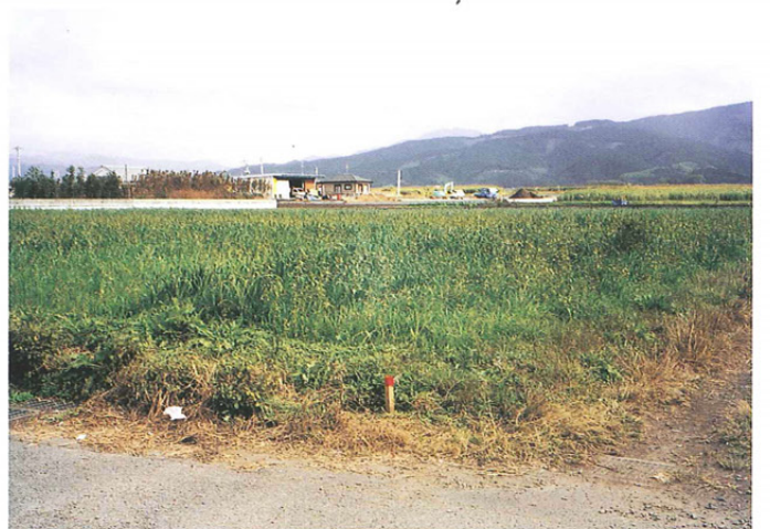
調査対象地（西から）