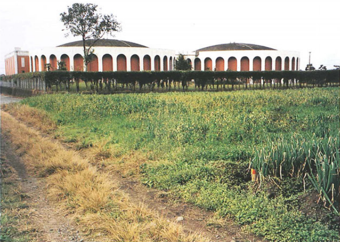
調査対象地（東から）