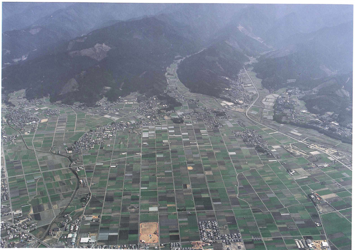
図版5 宮ノ原地区遠景（西から）