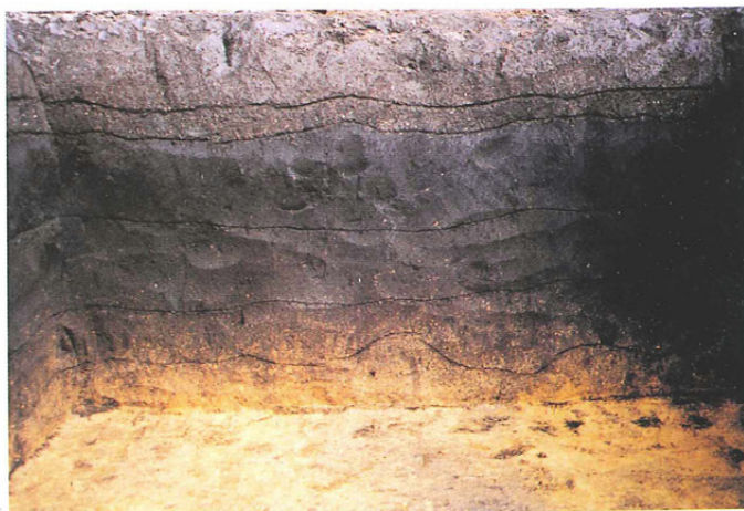
図版1 基本土層断面