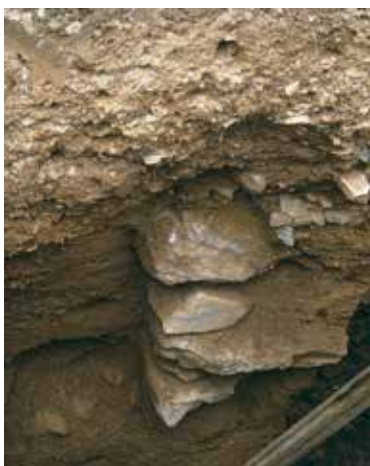
工事掘削面北壁の石積み（復元図-A）