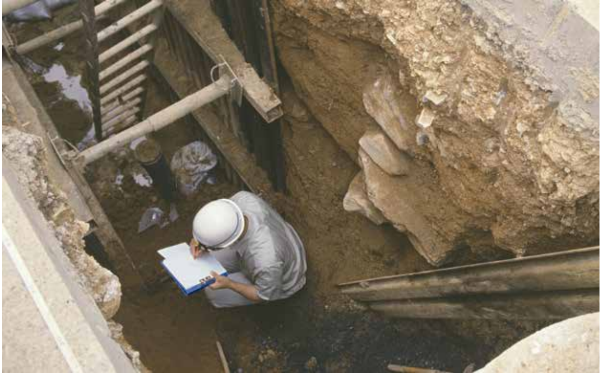
工事掘削面に現れた石積みの実測