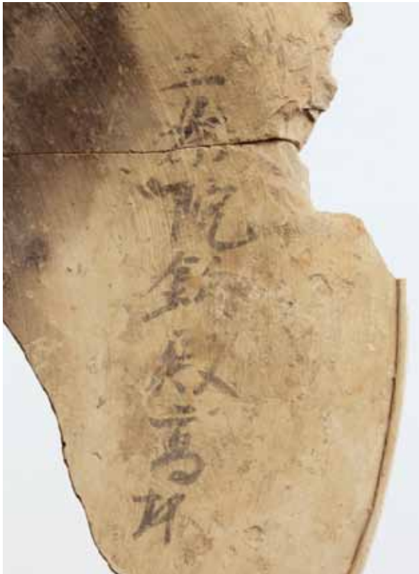
「三条院釣殿高坏」墨書高杯