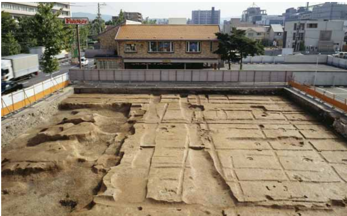
平安京右京六条二坊六町の調査（地点1 西から）

はじめに 平安京は、東西・南北の大路・小路によって区画された「条坊制」のもとで都づくりが行なわれました。朱雀大路によって、左京・右京に分けられ、大路に囲まれた区画「坊」が、それぞれ、東西4坊、南北9条ずつあり、坊の中は小路によって区画された一辺40丈（約120m）の正方形区画（一町）が基本となりました。