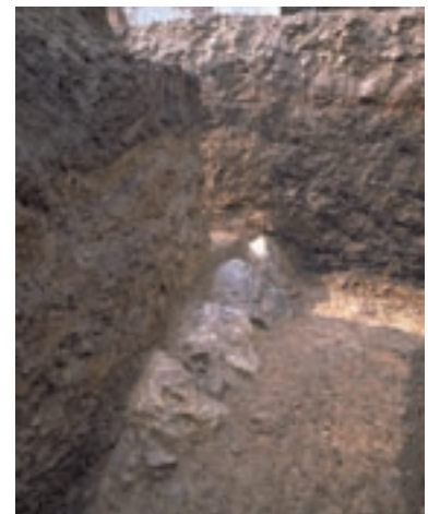
写真1 聚楽第の石垣(東から)

それでは、聚楽第はどのような姿をしていたのでしょうか。この城については、後陽成天皇の行幸の様子を記した『聚楽第行幸記』、豊臣秀次の側近であった駒井重勝により書かれた『駒井日記』、寛永元年(1624)頃に作成された