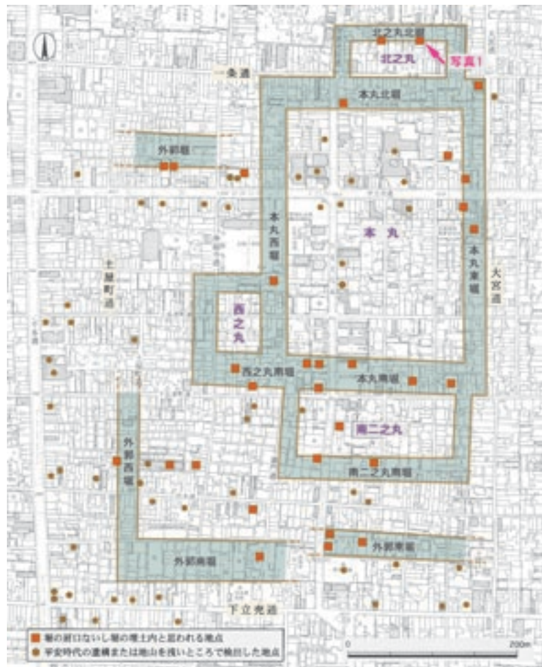
図2 聚楽第跡の推定範囲と調査位置

鏡石町の町境沿いに2.5m余りの段差が東西に連なっています。この段差から南に13m離れた場所で、石垣石を抜き取った穴と4個の石材が見つかりました。大きさは50cm~100cm程度で、自然石が用いられていました。