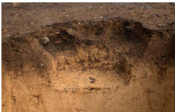
2016 年度調査区 陥し穴 141SK 断ち割り状況 (南西から)