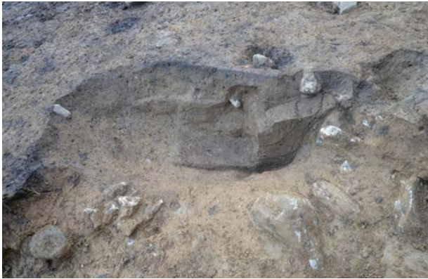
2016 年度調査区 煙道付炉穴 246SL 土層断面 A (南東から)