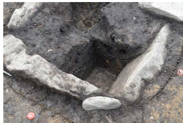
2016 年度調査区 竪穴建物跡 090SI 内 石囲炉 230SL 土層断面（北西から）