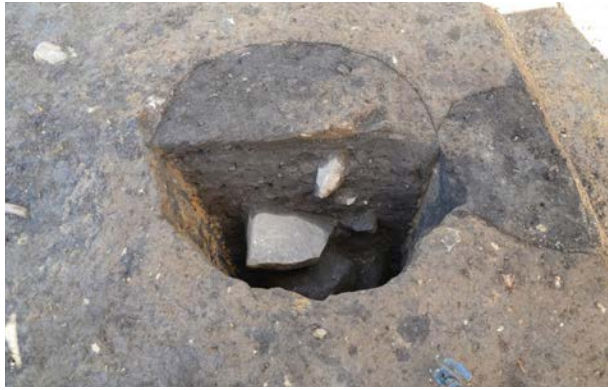
2016 年度調査区 柵列 070SA- 柱穴 038SP 土層断面（東から）