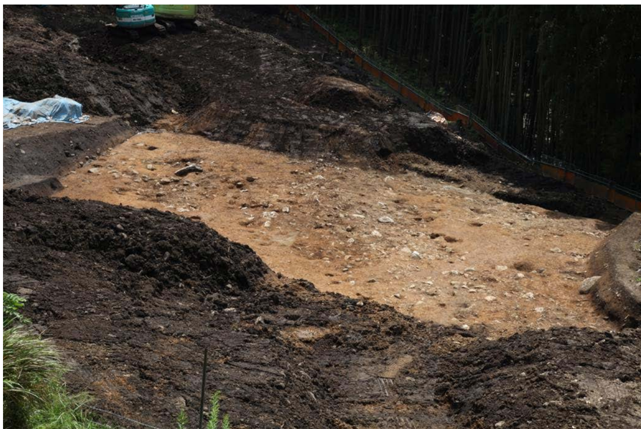
2015 年度調査区 全景その3 (北西から)