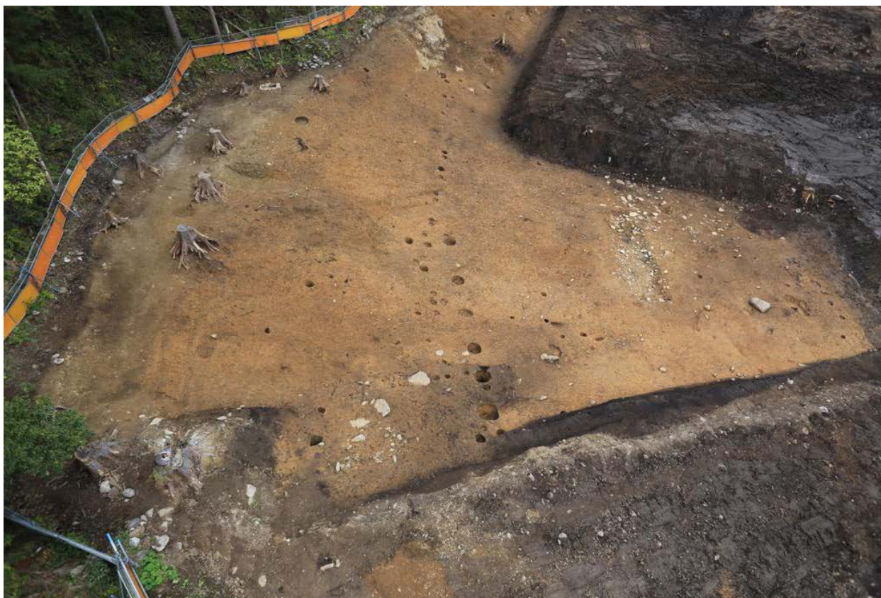
2016 年度調査区 全景その1 (上空西から)