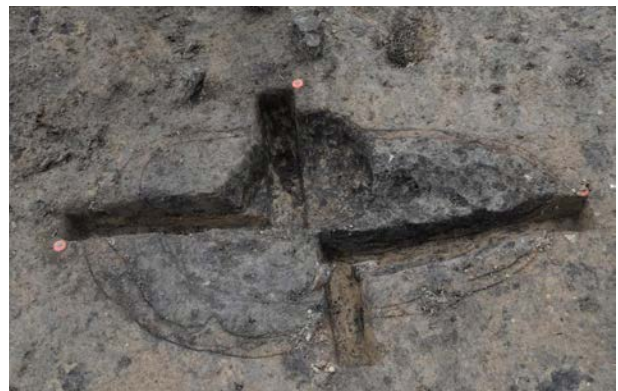
2016 年度調査区 屋外炉 088SL 完掘状況 (北東から)