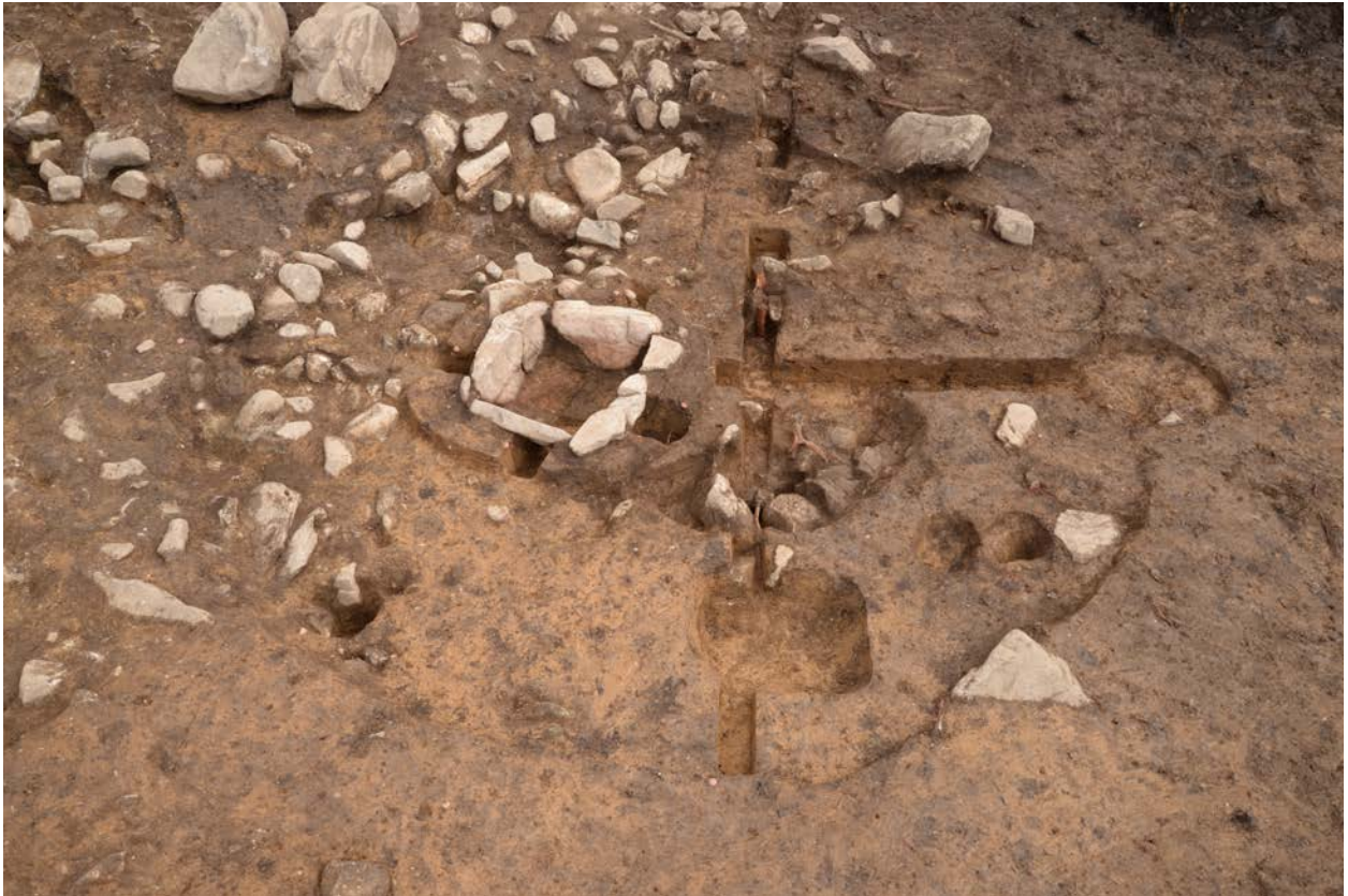
2016 年度調査区 090SI 全景（北西から）