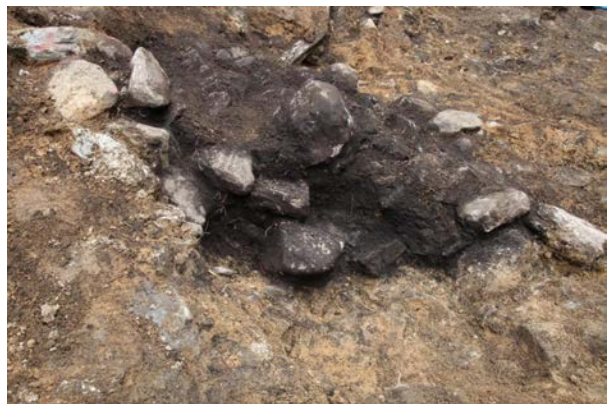
2015 年度調査区 003SK（西から）