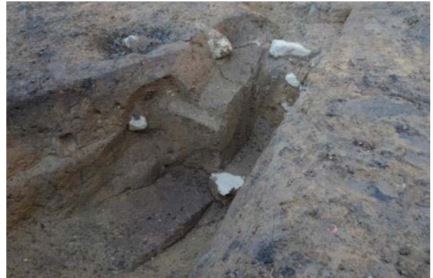
2016 年度調査区 煙道付炉穴 246SL 土層断面 A/D (南から)