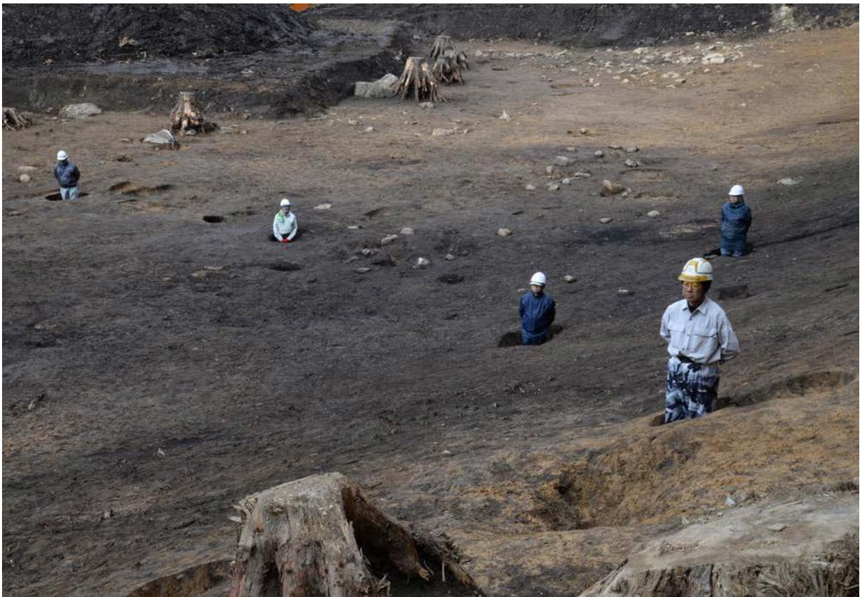
2016 年度調査区 陥し穴分布状況（東から）