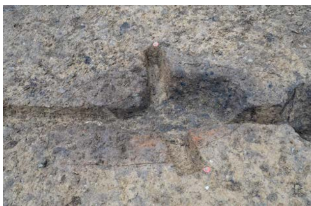
2016 年度調査区 煙道付炉穴 042SL 土層断面（東から）