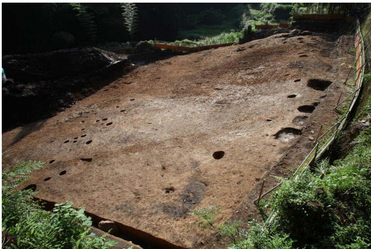
2015 年度調査区 全景その4 (北東から)