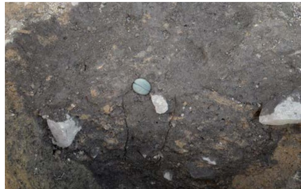
2016 年度調査区 柱穴 011SK 石錘 S-51 出土状況（南西から）