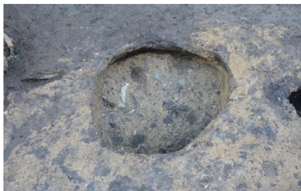
2016 年度調査区 陥し穴 139SK 完掘状況 (南西から)