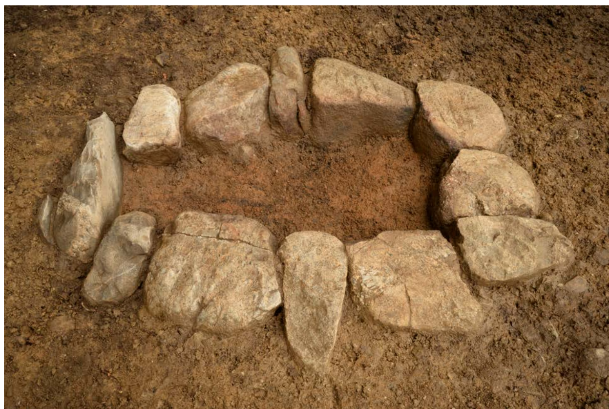
2016 年度調査区 火葬施設 001SX（西から）