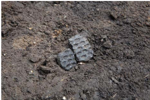
2015 年度調査区 深鉢 E-4 出土状況(西から)