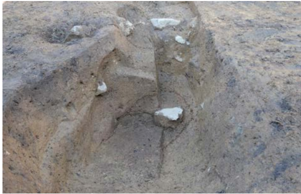
2016 年度調査区 煙道付炉穴 246SL 土層断面 D 南西から