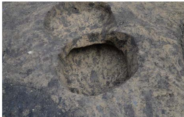
2016 年度調査区 陥し穴 154SK 完掘状況 (南西から)