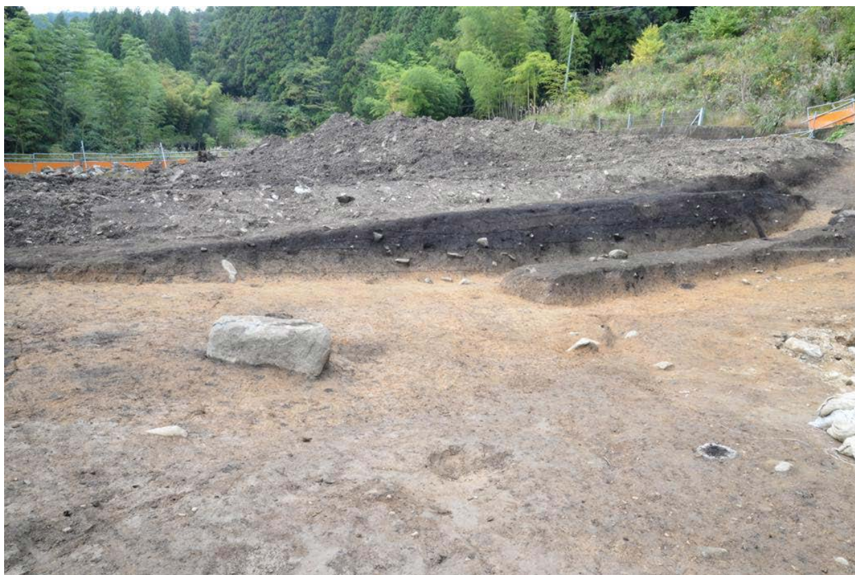
2016 年度調査区 西壁土層断面（東から）