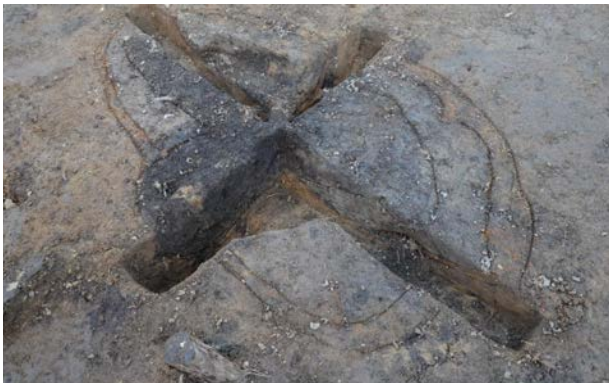
2016 年度調査区 屋外炉 088SL 土層断面 (南から)