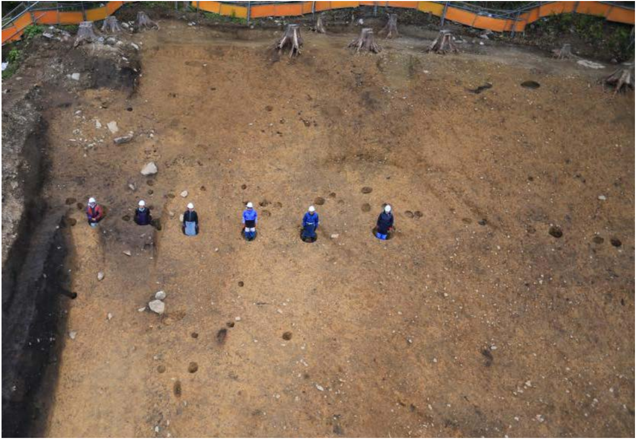
2016 年度調査区 柵列 070SA・071SA 完掘状況（上空南から）