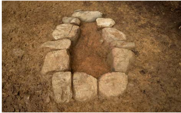
2016 年度調査区 火葬施設 001SX 焼土面検出状況（南から）