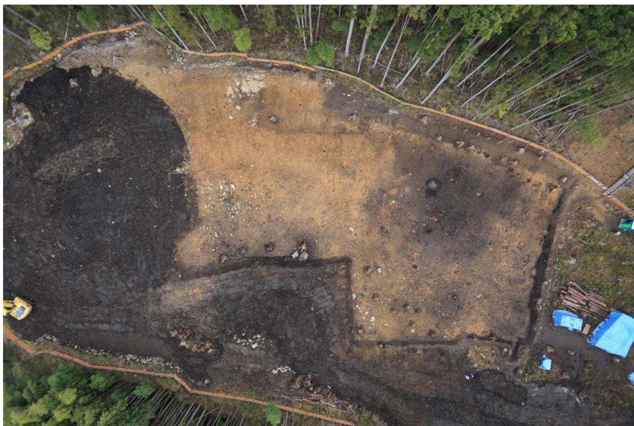
2016 年度調査区 全景その3 (真上から)