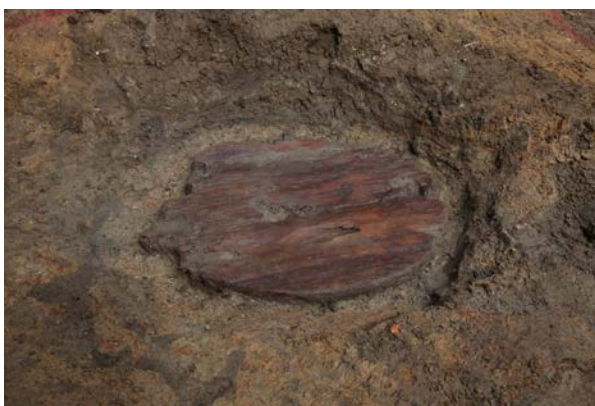
2015 年度調査区 051SK 桶底 (南東から)