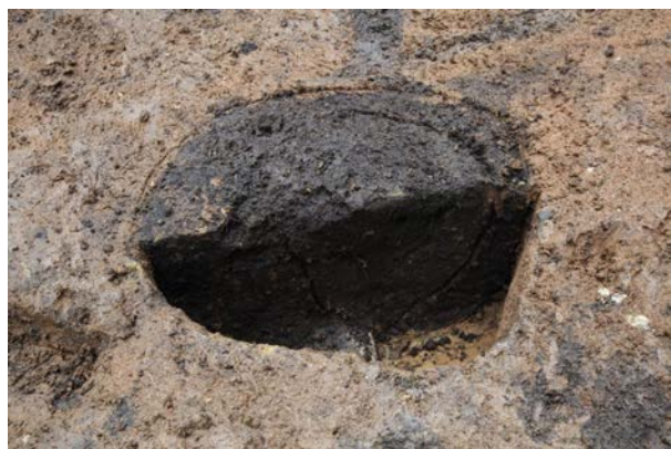
2015 年度調査区 032SK (南から)