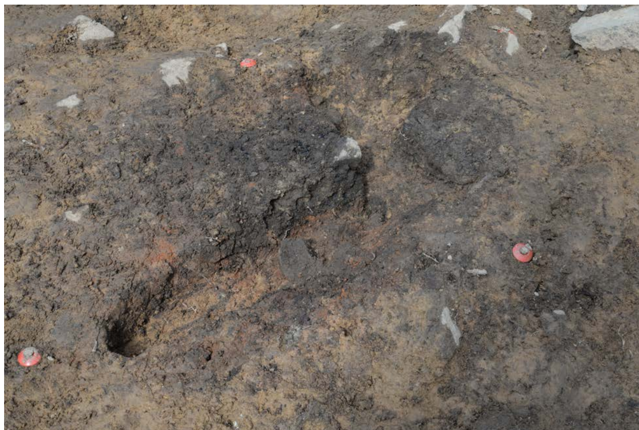
2016 年度調査区 煙道付炉穴 119SL 完掘状況（南東から）