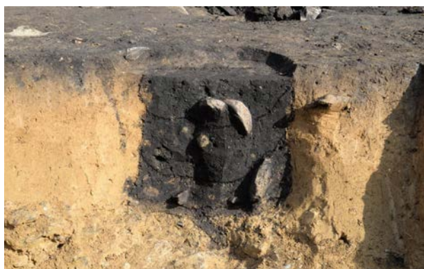
2016 年度調査区 陥し穴 164SK 断ち割り状況 (南西から)