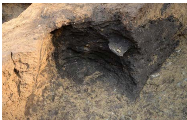
2016 年度調査区 陥し穴 137SK 土層断面 (南西から)