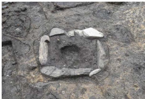
2016 年度調査区 竪穴建物跡 090SI 内 石囲炉 230SL 検出状況（北から）