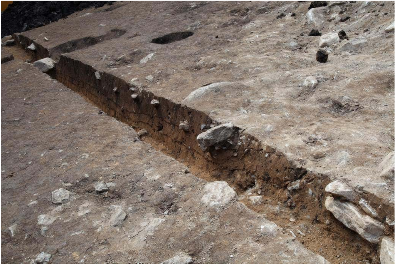
2015 年度調査区 中央トレンチ断面（東から）