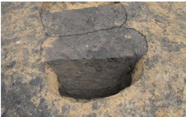
2016 年度調査区 陥し穴 154SK 土層断面 (南西から)