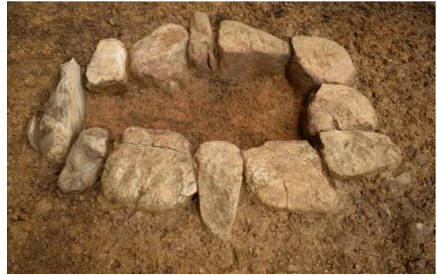
2016 年度調査区 火葬施設 001SX 焼土面検出状況（西から）