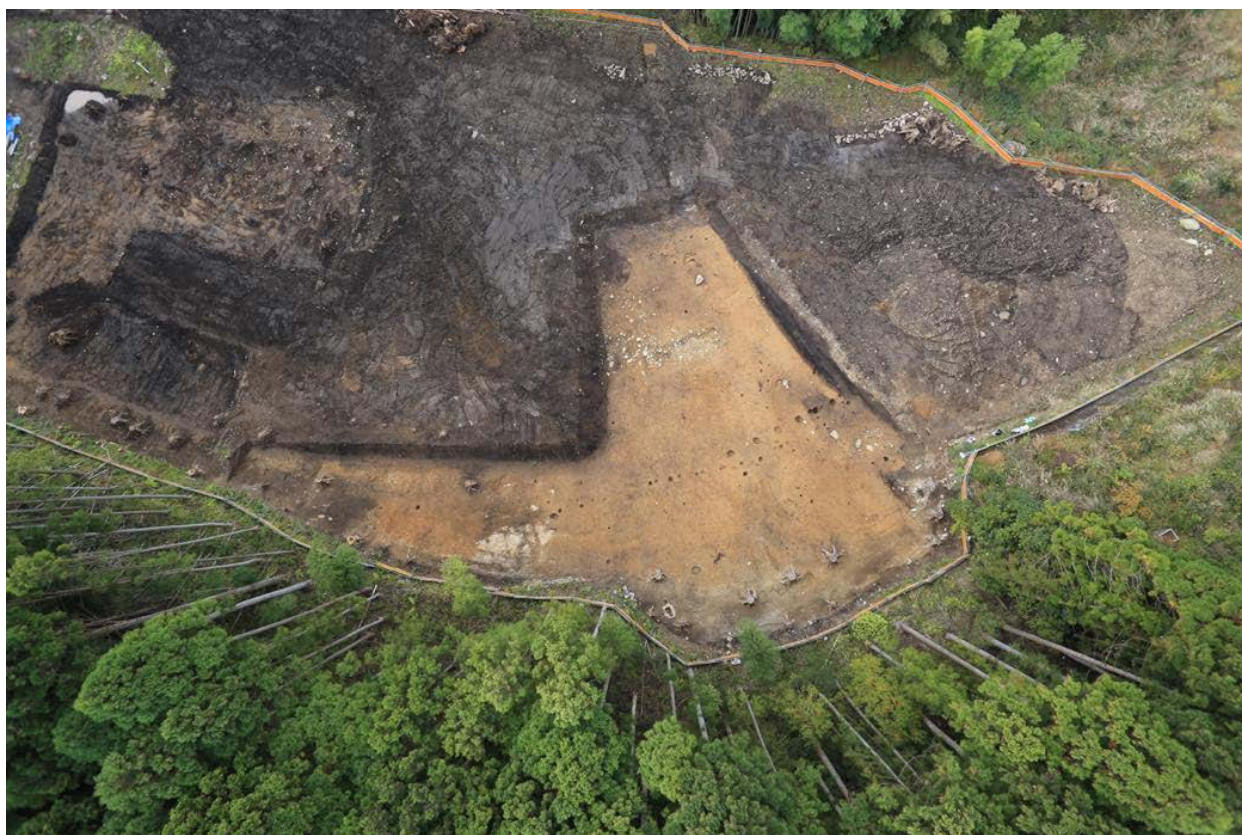
2016 年度調査区 全景その2 (真上から)