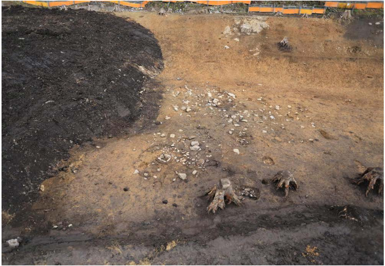
2016 年度調査区 竪穴建物跡 090SI 遠景（南から）