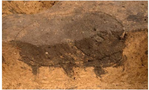
2016 年度調査区 陥し穴 289SK 土層断面（西から）