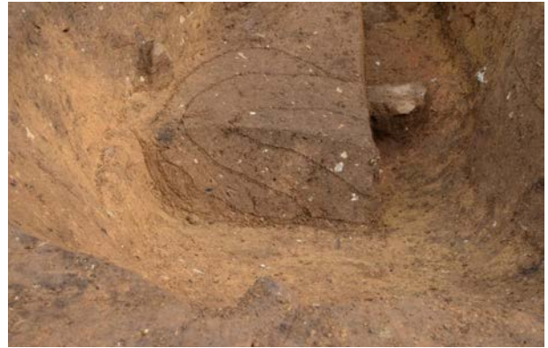
2016 年度調査区 煙道付炉穴 246SL 土層断面 B (南西から)