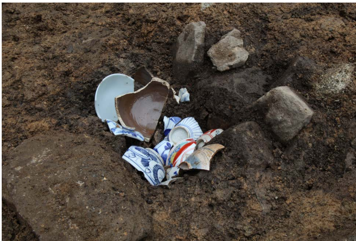
2015 年度調査区 046SK 陶磁器出土状況（南から）