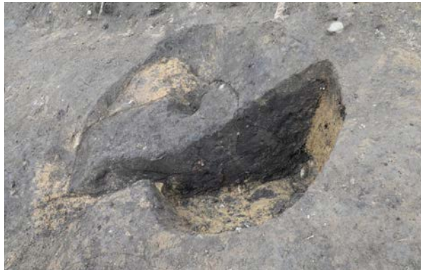
2016 年度調査区 陥し穴 290SK・294SK 土層断面（東から）