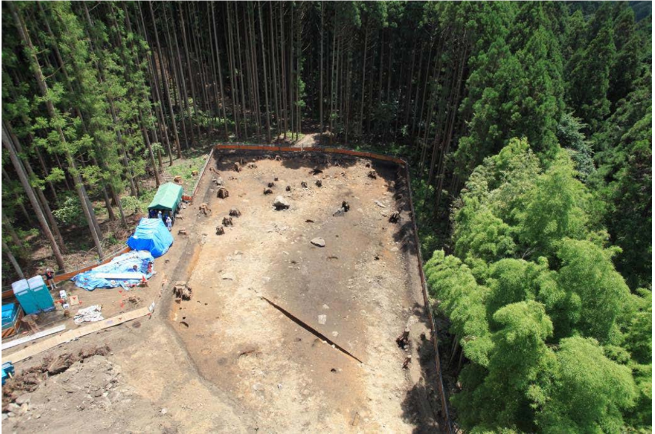
2015年度調査区 全景その1（北西から）