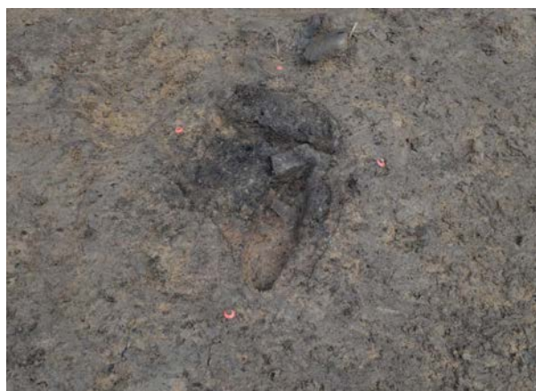
2016 年度調査区 煙道付炉穴 119SL 検出 状況 (南から)