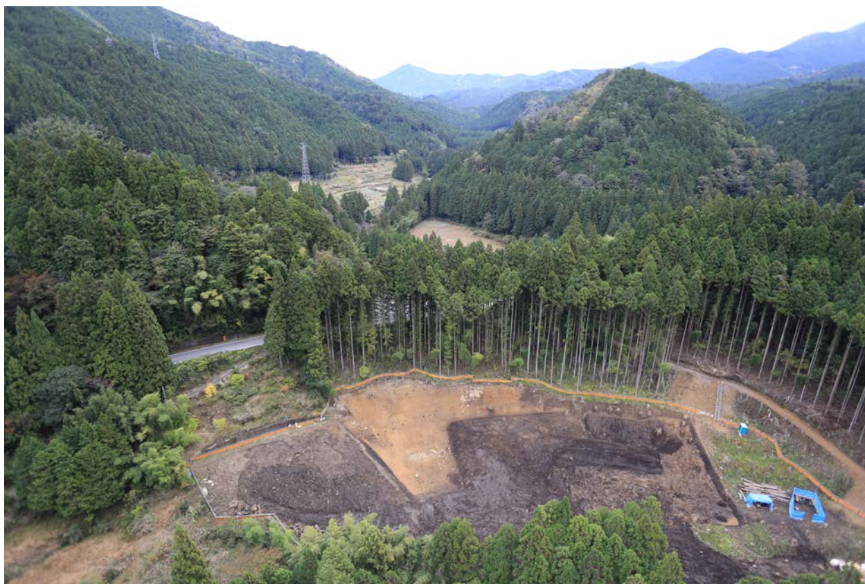
2016 年度調査区 遠景（南から）