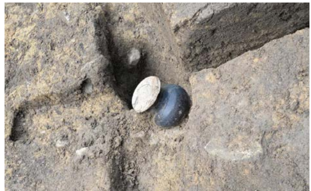
2016 年度調査区 006SX 花瓶 E-62 出土状況（東から）