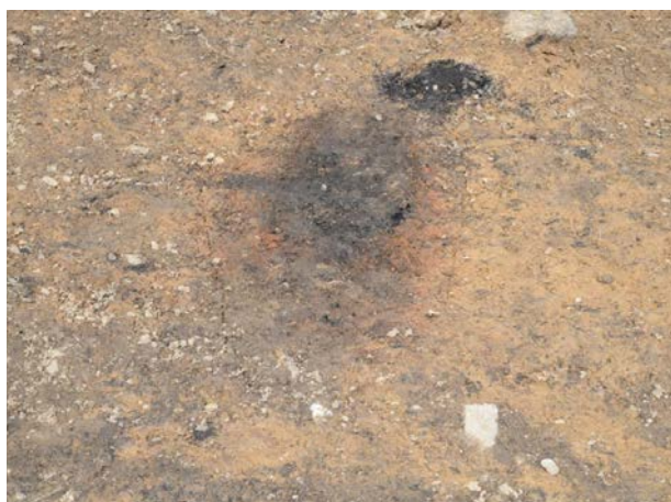
2016 年度調査区 煙道付炉穴 042SL 検出状況（南から）