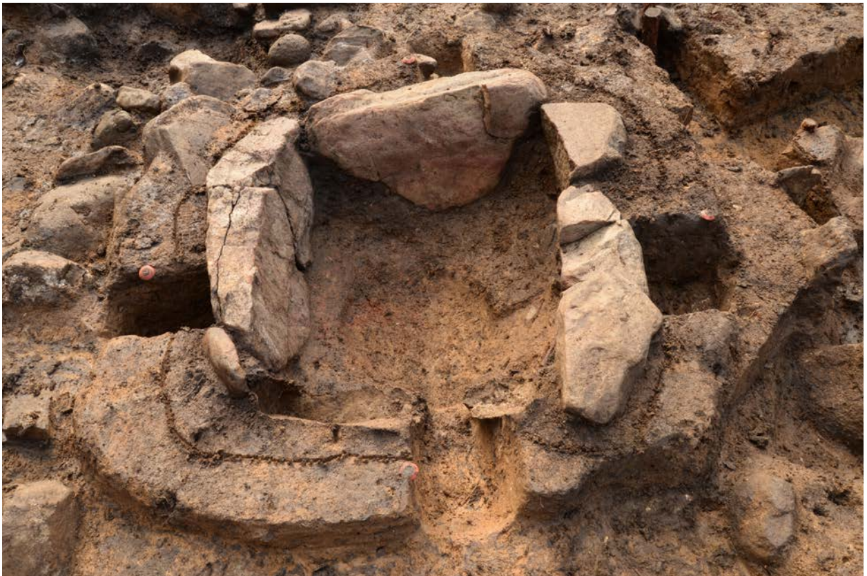
2016 年度調査区 090SI 石囲炉 230SL（西から）