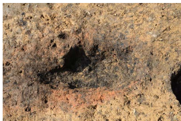
2016 年度調査区 煙道付炉穴 042SL 完掘状況（東から）