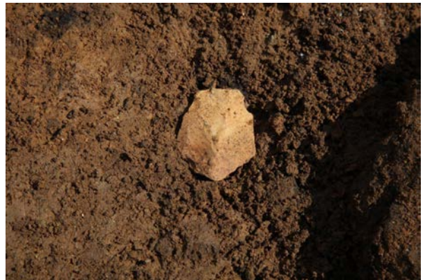
2015 年度調査区 剥片 S-47 出土状況（南から）