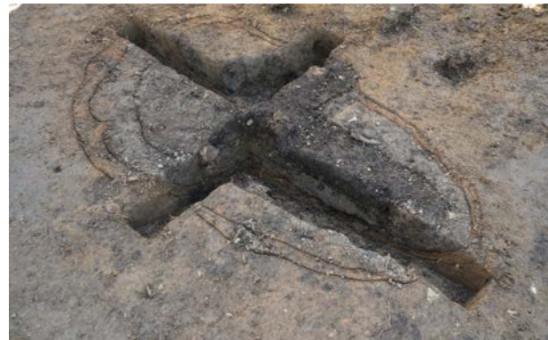
2016 年度調査区 屋外炉 088SL 土層断面 (北から)