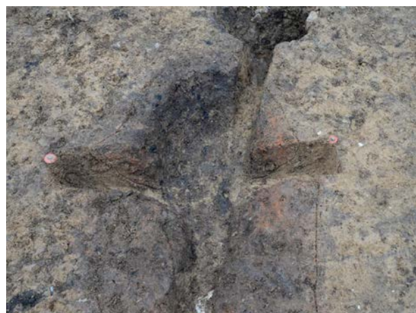
2016 年度調査区 煙道付炉穴 042SL 土層断面（西から）