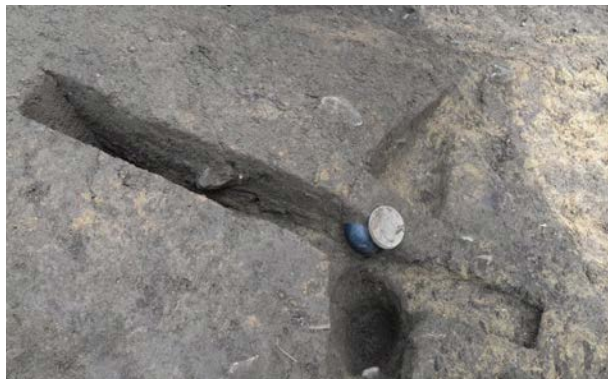
2016 年度調査区 006SX 花瓶 E-62 出土状況（西から）