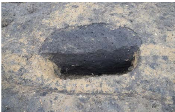
2016 年度調査区 陥し穴 165SK 土層断面 (南西から)