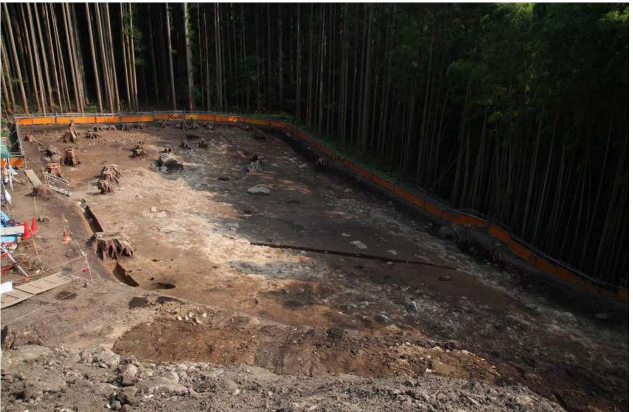
2015年度調査区 全景その2（西から）