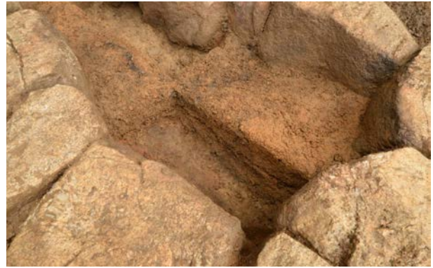
2016 年度調査区 火葬施設 001SX 土層断面（南西から）