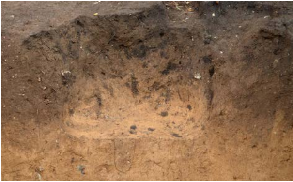
2016 年度調査区 陥し穴 210SK 土層断面（南西から）