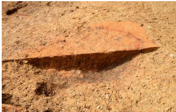
2016 年度調査区 火葬施設 002SX 土層断面（東から）