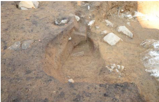
2016 年度調査区 煙道付炉穴 246SL 煙道完掘状況 (南西から)