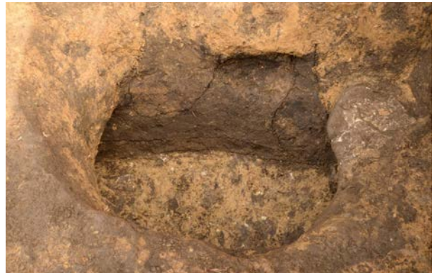
2016 年度調査区 陥し穴 291SK 土層断面（南西から）