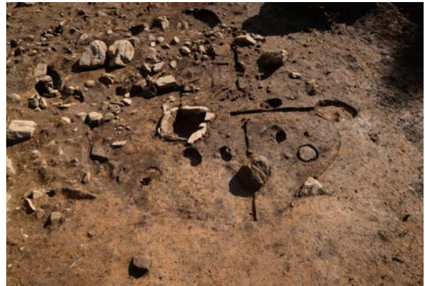
2016 年度調査区 竪穴建物跡 090SI 床面完掘状況（北西から）