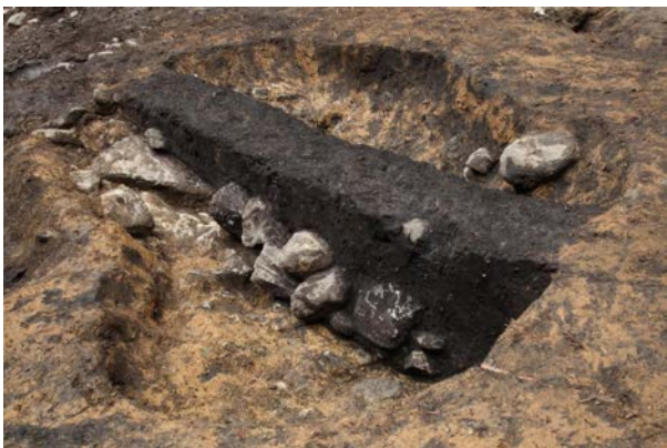
2015 年度調査区 002SK（南東から）