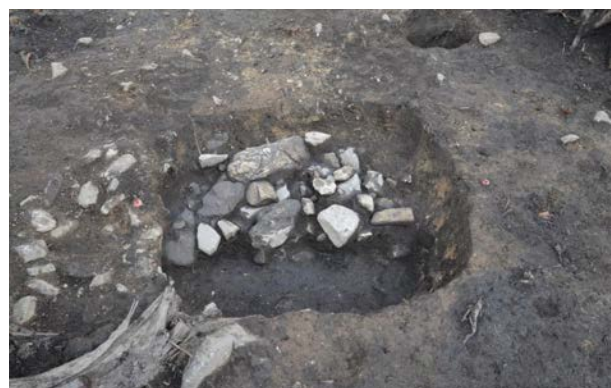
2016 年度調査区 屋外炉 266SL 土層断面 (南西から)