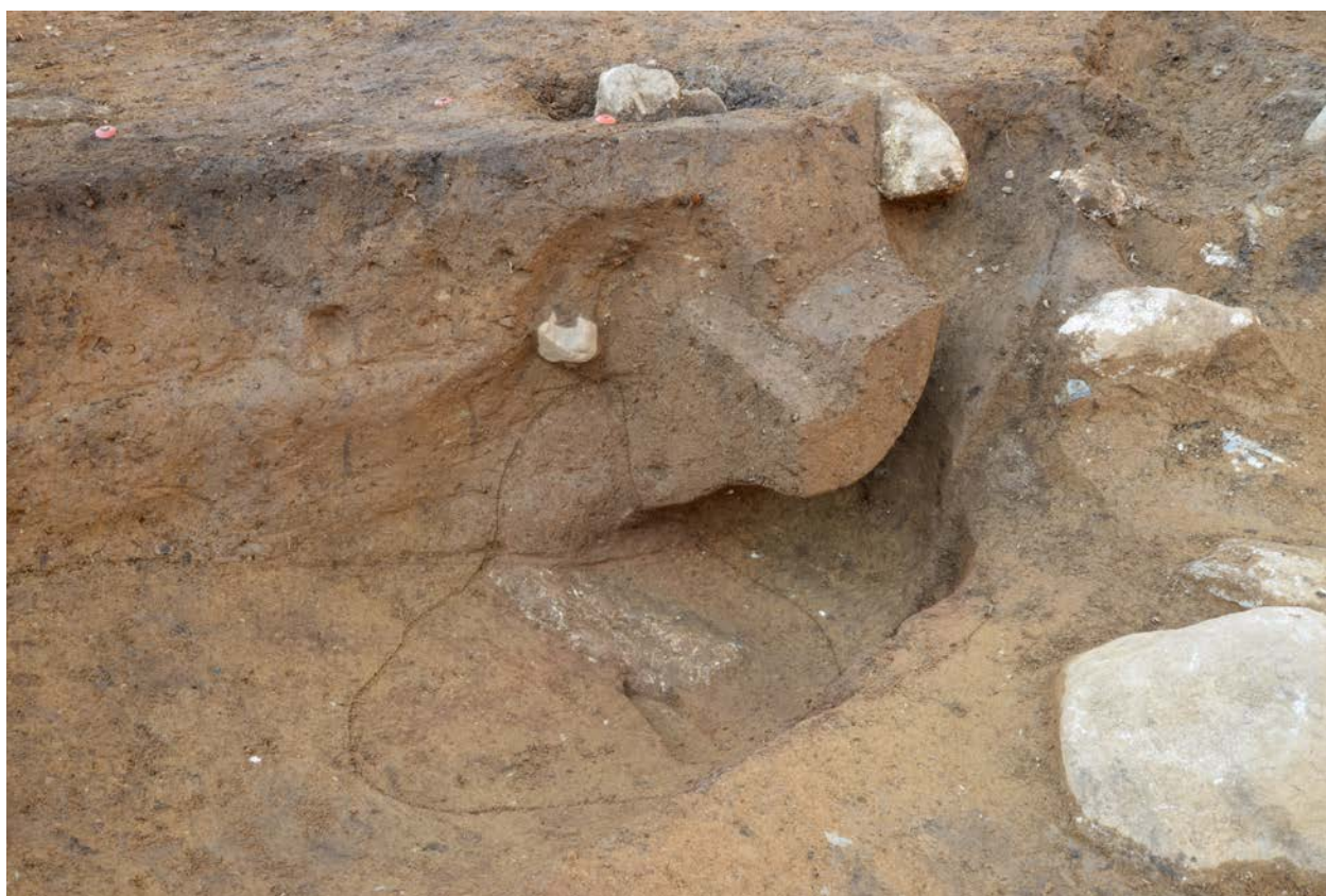
2016 年度調査区 煙道付炉穴 246SL 完掘状況（南東から）