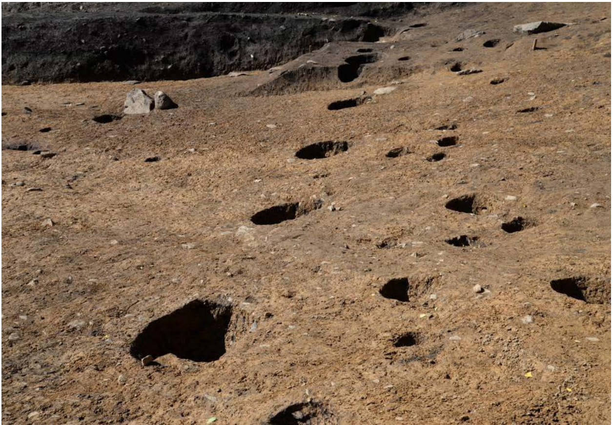
2016 年度調査区 柵列 070SA 完掘状況（東から）