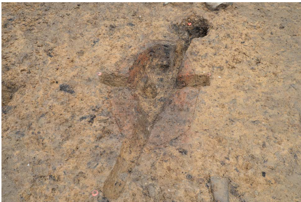
2016 年度調査区 煙道付炉穴 042SL 完掘状況（南から）