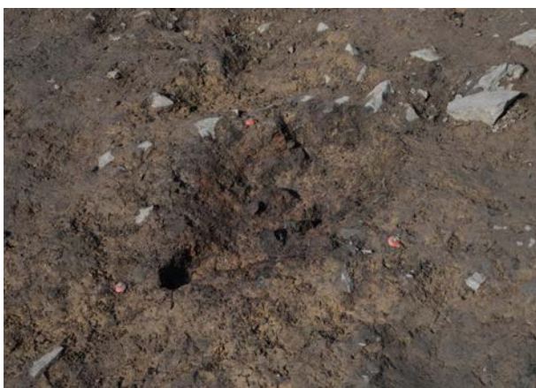
2016 年度調査区 煙道付炉穴 119SL 完掘 状況 (南東から)