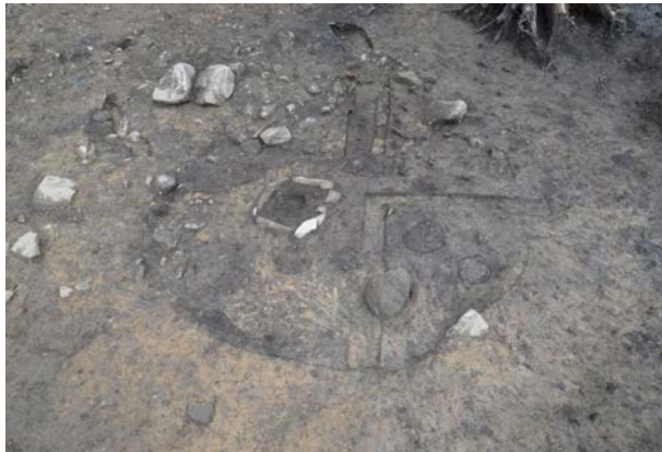
2016 年度調査区 竪穴建物跡 090SI 床面検出状況（北西から）