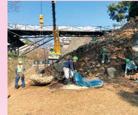
栗石回収の様子(令和4年1月)