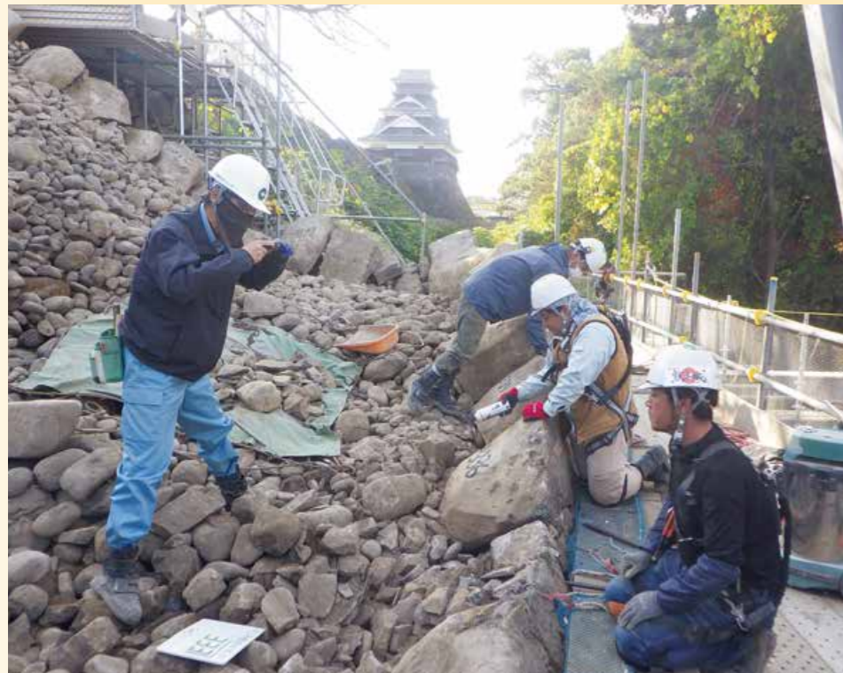
1石解体するごとに石同士の接点や積み方を記録します

解体調査の結果、出土遺物や石垣背面の状況から昭和29年(1954)の建物解体修理の際に、石垣の一部も修理されていることが明らかになりました。また、石垣背面の状況は一樣ではないことから、江戸時代にも複数回修理されていると考えられます。なお、最も古い江戸時代の石垣の背面には、大きめの栗石を列状に並べ、その間に小さい栗石を詰める状況が観察されました。これは天守閣や飯田丸五階櫓の石垣裏側でも見られた技法です。