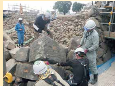
解体作業は慎重に進めました