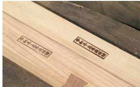
補修材に付けられた修補年の焼印(令和4年2月18日)