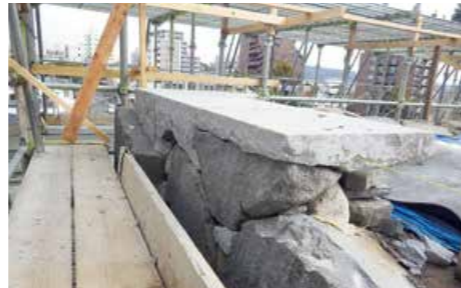
調整石の設置作業(令和4年2月14日)