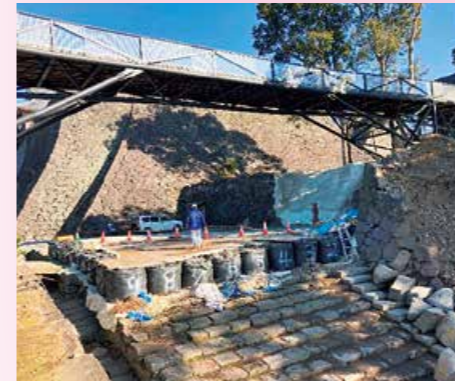
竹の丸五階櫓からみた特別見学通路(令和4年1月)