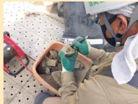
間詰石と呼ばれる小さな石にも番付を怠りません

解体調査の結果、出土遺物や石垣背面の状況から昭和29年(1954)の建物解体修理の際に、石垣の一部も修理されていることが明らかになりました。また、石垣背面の状況は一樣ではないことから、江戸時代にも複数回修理されていると考えられます。なお、最も古い江戸時代の石垣の背面には、大きめの栗石を列状に並べ、その間に小さい栗石を詰める状況が観察されました。これは天守閣や飯田丸五階櫓の石垣裏側でも見られた技法です。