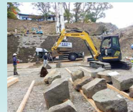
築石仮置き状況(令和3年11月)