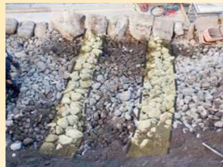
石垣の後ろの構造をよく観察すると、列状に並ぶのが見えます