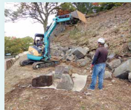
築石回収作業状況(令和3年11月)