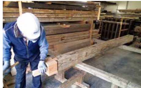
部材の補修作業(令和4年1月31日)

令和3年(2021)9月に石垣の復旧工事が完了した監物櫓では、続けて令和5年(2023)12月にかけて櫓の復旧工事を実施しています。令和4年度(2022年度)から始まる柱や梁の組立に向けて、部材の補修作業が進んでいます。櫓の土台となる石垣は今回の被災で一部沈下した部分もあるため、木土台と石垣の間で高さを調整するための石を設置する作業を行っています。