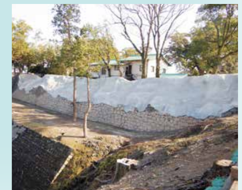
石材回収完了(令和4年3月)