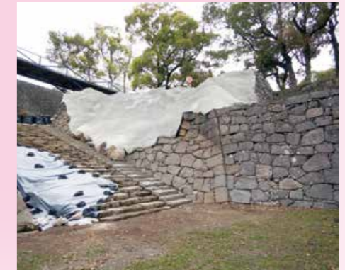
石材回収完了(令和4年3月)