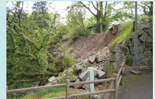
崩落状況(平成28年撮影)

令和3年(2021)10月から令和4年(2022)3月にかけて、棒庵坂周辺の石材回収工事を行いました。棒庵坂は熊本城の北側に位置し、北大手門への入り口です。平成28年熊本地震では、特に加藤神社北側の石垣面が変状・崩落しました。この石垣面は明治22年(1889)金峰山地震でも大規模に被災しており、今回の崩落範囲の大半が積み直した箇所であることが分かりました。石材回収後の崩落法面は被害拡大を防ぐためモルタルを吹き付けて養生しています。回収した石材は空堀内に仮置きしており、今後石材調査等を実施します。