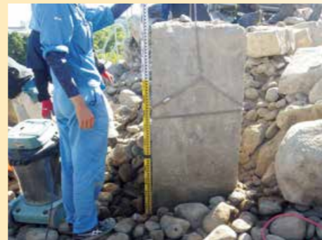
昭和29年に設置された1mを超える高さのコンクリート基礎