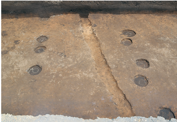
東区第3・4号掘立柱建物跡柱痕確認状況（南から）