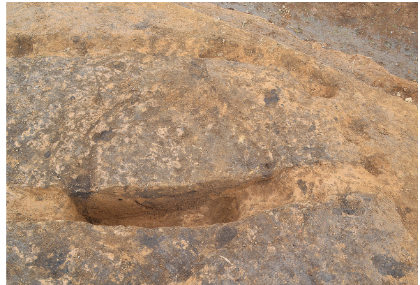
北区第8号竖穴建物跡皿状遺構土層（南から）