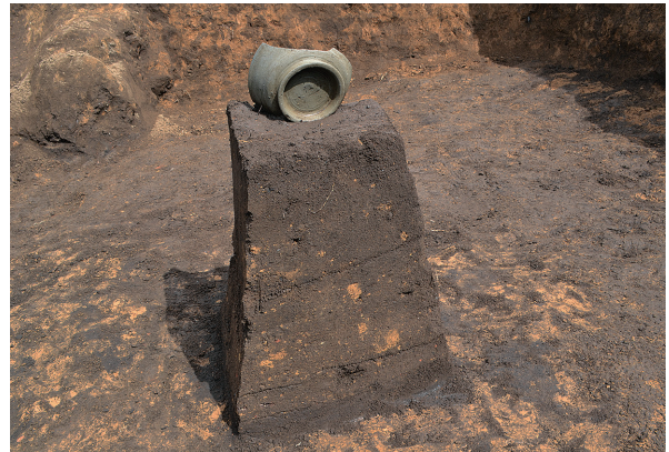
北区第7号竖穴建物跡遺物出土状況（南から）