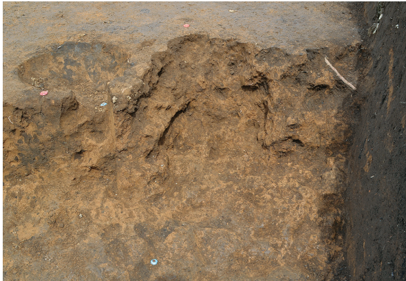
北区第9号竖穴建物跡竈掘方（南から）