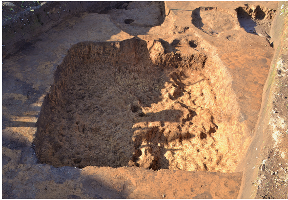
北区第7号竖穴建物跡掘方全景（南から）