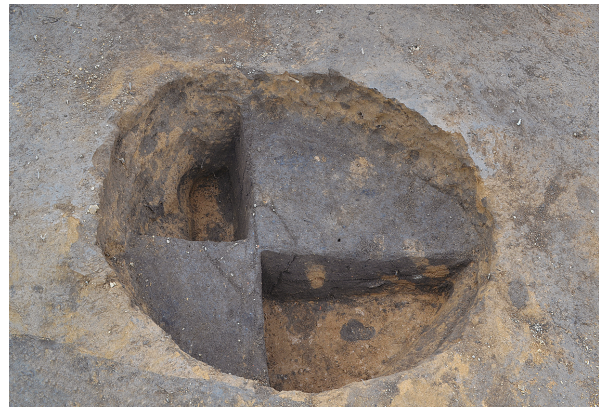
1B区第1号掘立柱建物跡 - P1土層（東から）