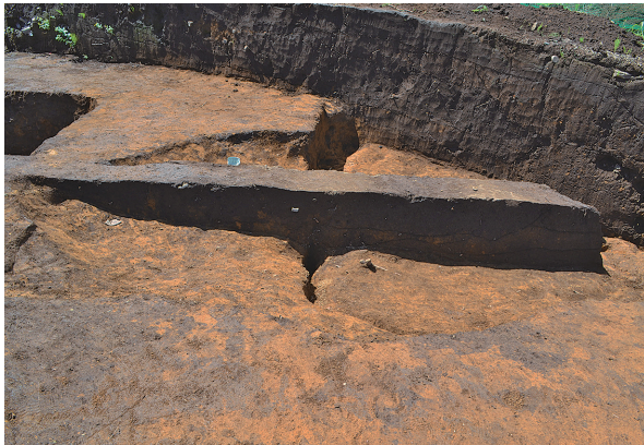
北区第12号竖穴建物跡・第41号土坑土層（東から）