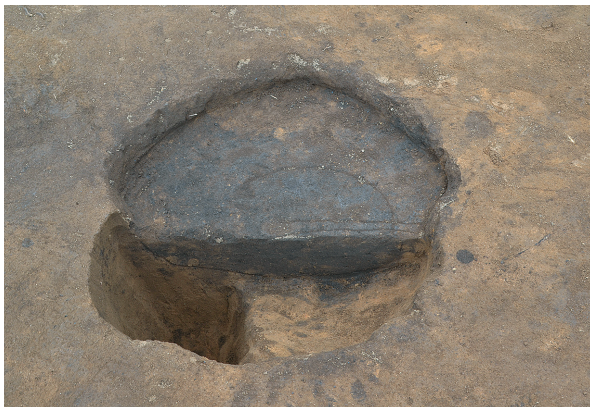
東区第3号掘立柱建物跡 - P6土層（東から）