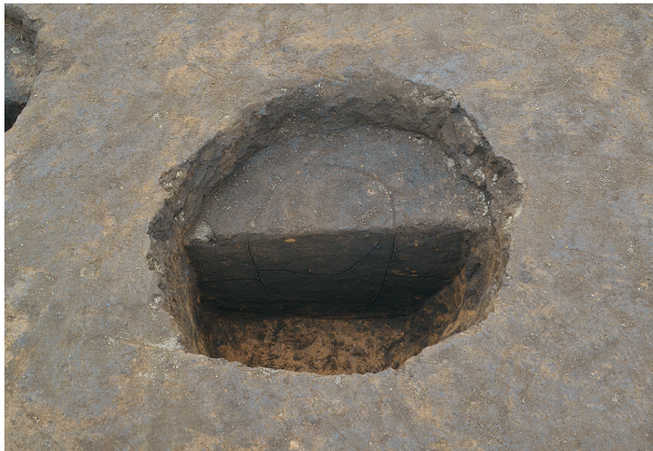
東区第3号掘立柱建物跡 - P2土層（東から）