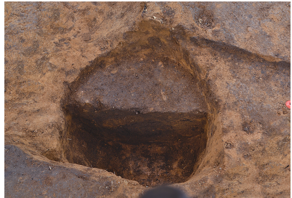
1B区第2号掘立柱建物跡 - P1土層 (南から)