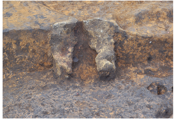
北区第7号竖穴建物跡竈全景（南から）