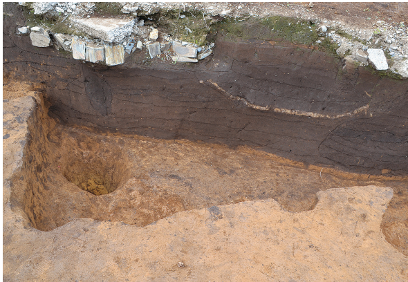
北区第10号竖穴建物跡全景（東から）