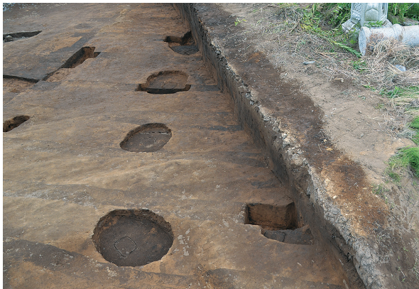
1B区第1号掘立柱建物跡柱痕確認状況（南東から）