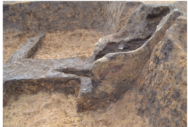
北区第7号竖穴建物跡竈東袖土層（東から）