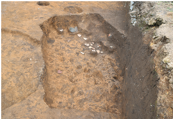
北区第9号竖穴建物跡全景（南から）