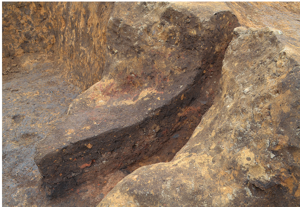
北区第7号竖穴建物跡竈土層（南東から）