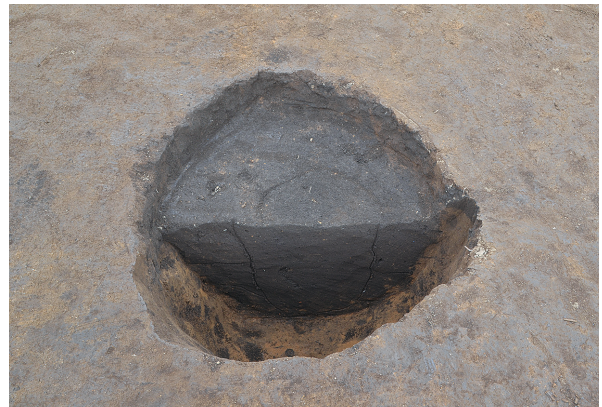
東区第3号掘立柱建物跡 - P5土層（東から）