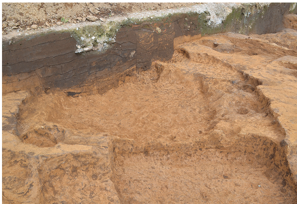
北区第11号竖穴建物跡掘方（南東から）