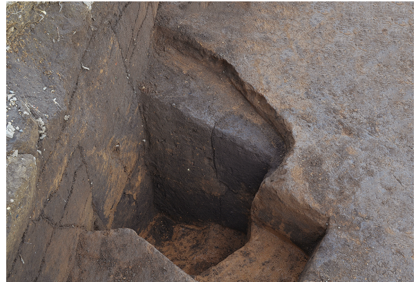
1B区第1号掘立柱建物跡 - P5土層 (西から)