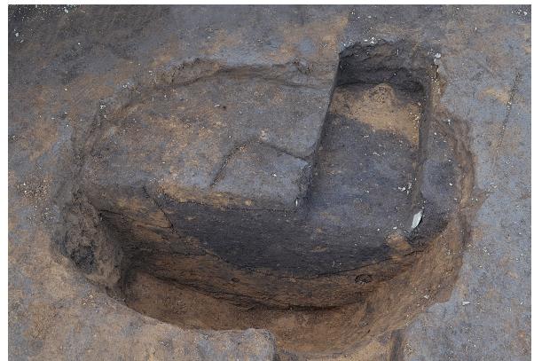
1B区第1号掘立柱建物跡跡 - P3土層（南から）