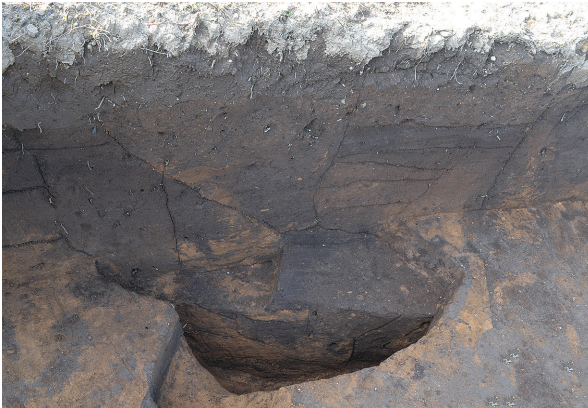
1B区第1号掘立柱建物跡 - P4土層 (南から)