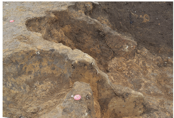
北区第9号竖穴建物跡竈袖土層（西から）