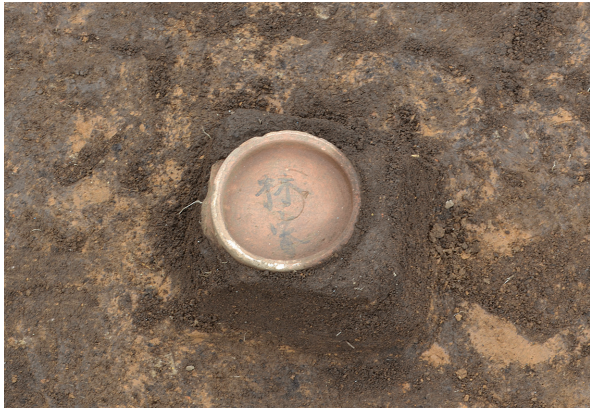
北区第11号竖穴建物跡遺物出土状況（南から）