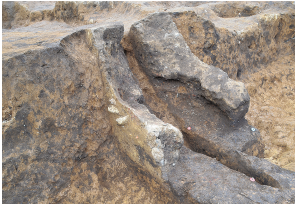
北区第7号竖穴建物跡竈西袖土層（西から）