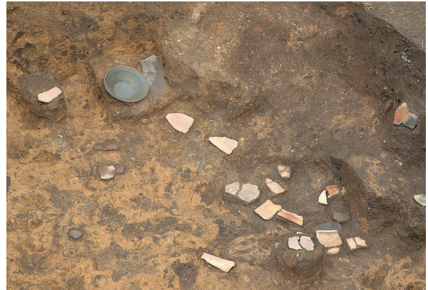
北区第9号竖穴建物跡遺物出土状況（南から）