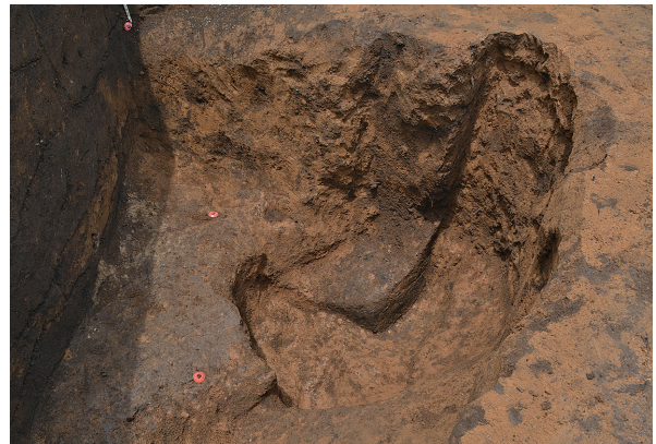
1B区第2号掘立柱建物跡 - P3土層 (南東から)