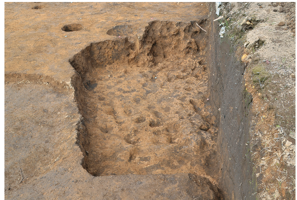
北区第9号掘方全景（南から）