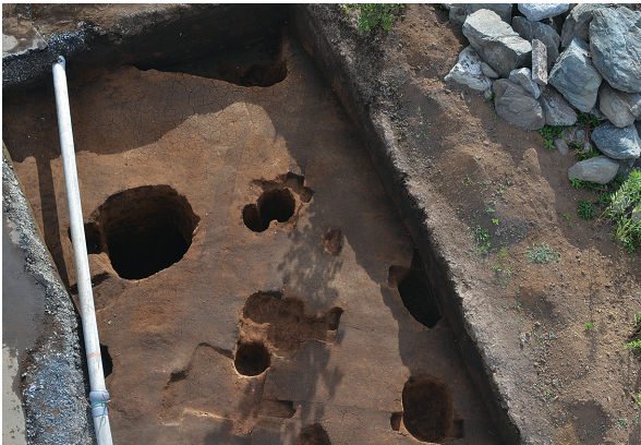
1B区第2号掘立柱建物跡全景 (南東から)