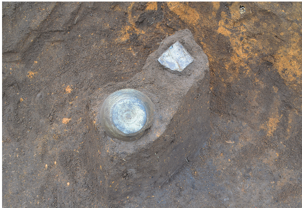
北区第7号竖穴建物跡遺物出土状況（南東から）