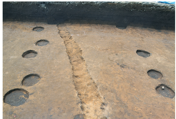
東区第3・4号掘立柱建物跡柱痕確認状況（北から）