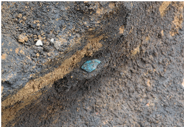
北区第10号竖穴建物跡遺物出土状況（北西から）