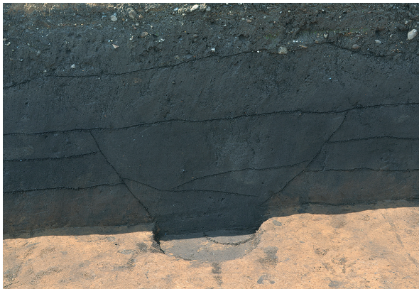
東区第3号掘立柱建物跡 - P4土層（北から）