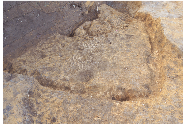
北区第12号竖穴建物跡全景（北東から）