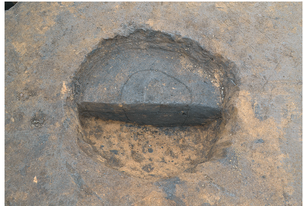
東区第3号掘立柱建物跡 - P3土層（東から）