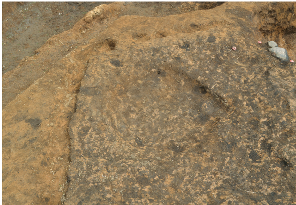
北区第8号竖穴建物跡皿状遺構（西から）