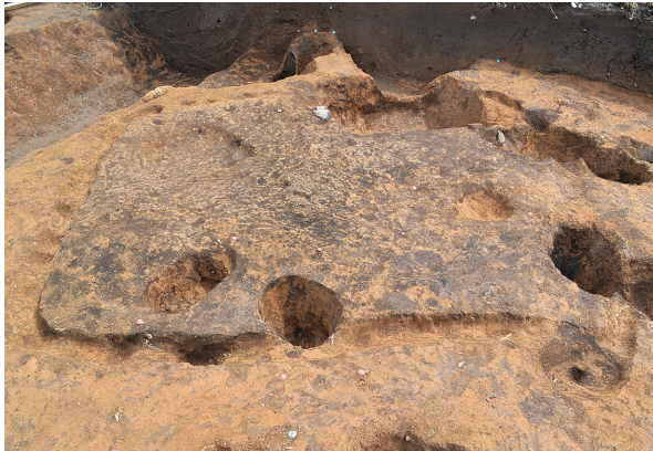
北区第8号竖穴建物跡全景（西から）