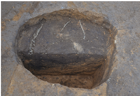
1B区第1号掘立柱建物跡 - P2土層（南から）