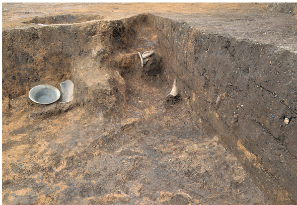
北区第9号竖穴建物跡竈全景（南から）