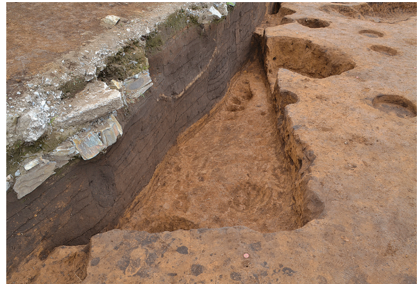
北区第10号竖穴建物跡掘方（南から）