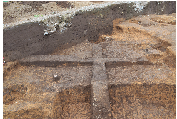
北区第11号竖穴建物跡土層（南東から）