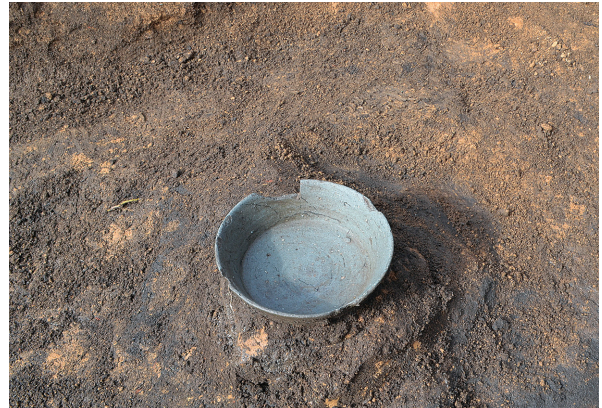
北区第7号竖穴建物跡遺物出土状況（南西から）