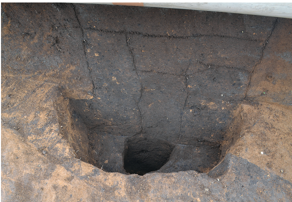
1B区第2号掘立柱建物跡 - P4土層 (北から)