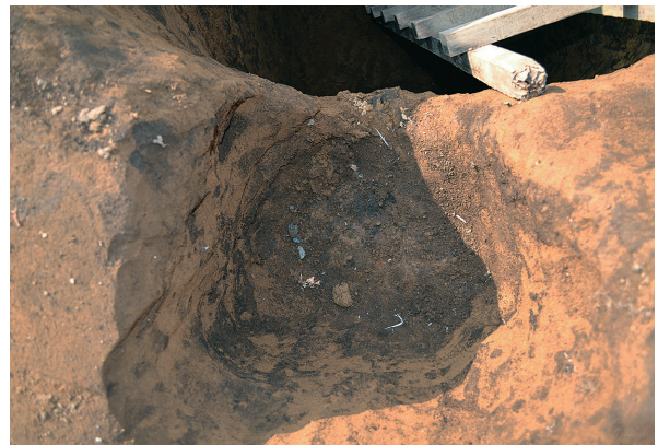
1B区第2号掘立柱建物跡 - P5土層 (南から)