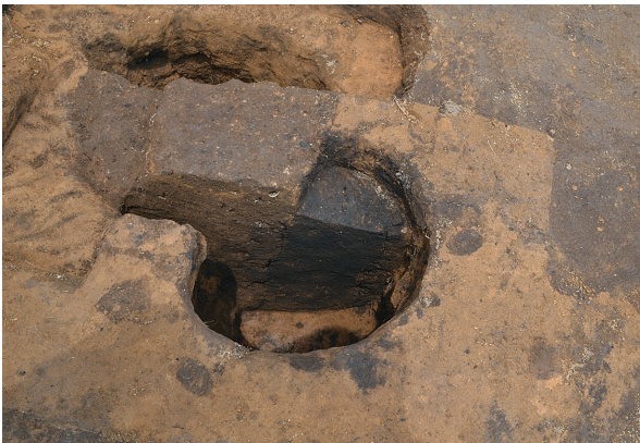
1B区第2号掘立柱建物跡 - P2土層 (南から)