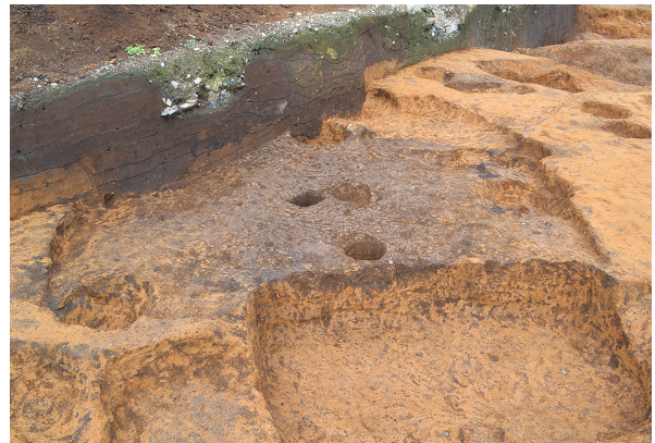
北区第11号竖穴建物跡全景（南東から）