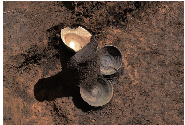
北区第12号竖穴建物跡遺物出土状況（西から）