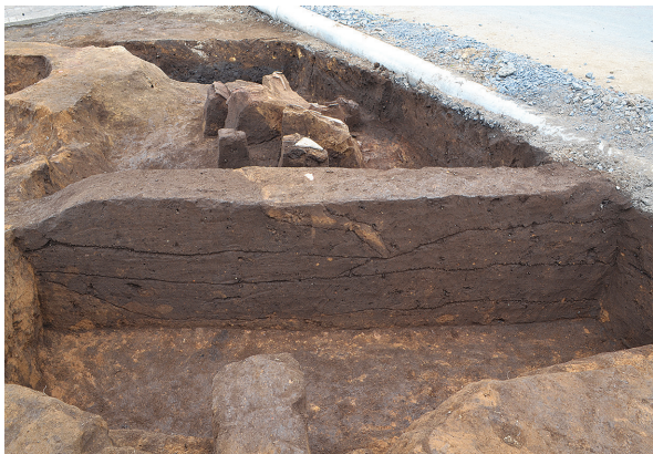
1B区第1号竖穴建物跡北側東土層（西から）