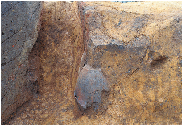
北区第4号竖穴建物跡竈袖芯材出土状況（南から）