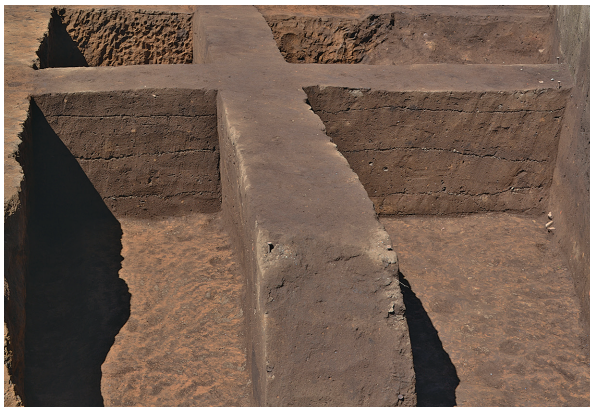
北区第3号竪穴建物跡東西土層（南から）