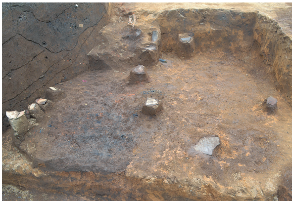
北区第4号竖穴建物跡遺物出土状況①（東から）