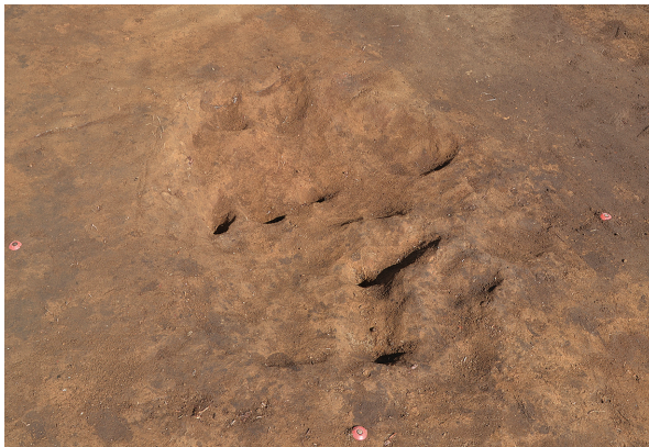
北区第6号竖穴建物跡竈完掘（西から）