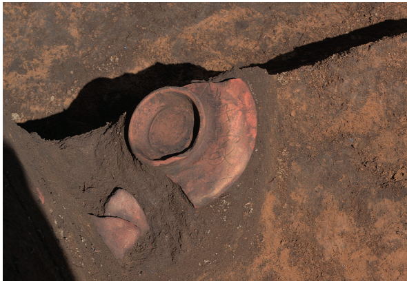
北区第4号竖穴建物跡遺物出土状況（西から）