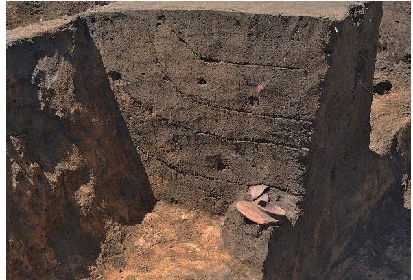
北区第4号竖穴建物跡遺物出土状況④（東から）