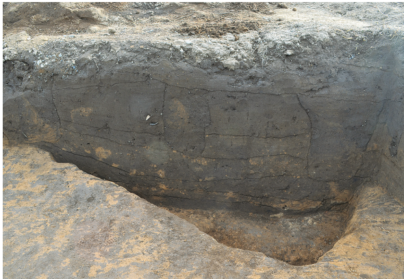
1B区第2号竪穴建物跡全景（東から）