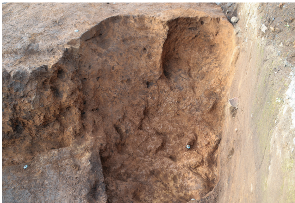
北区第3号竖穴建物跡旧・新竈掘方（南から）