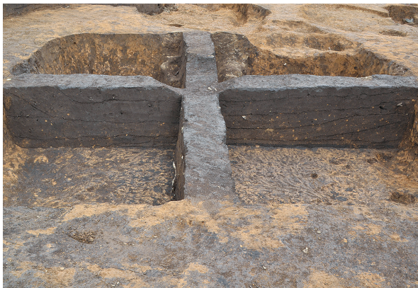
北区第7号竖穴建物跡土層（南から）