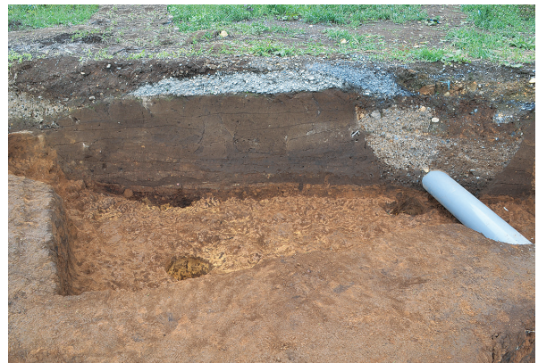
北区第3号竪穴建物跡東壁面土層（西から）