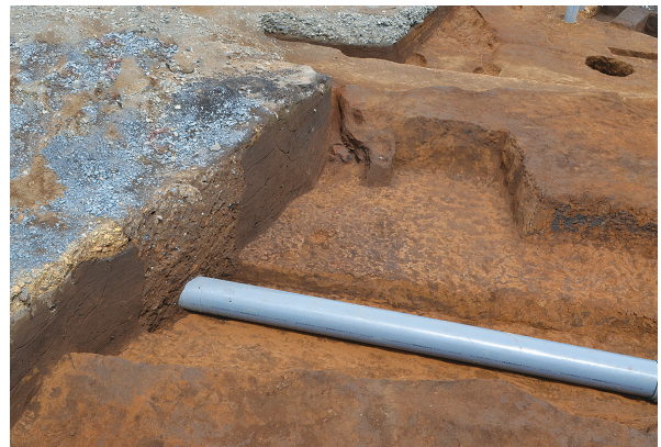
北区第4号竖穴建物跡全景（南から）