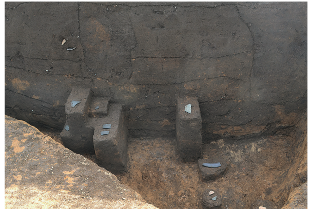
1B区第2号竪穴建物跡遺物出土状況（東から）