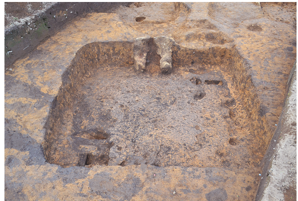
北区第7号竖穴建物跡全景（南から）