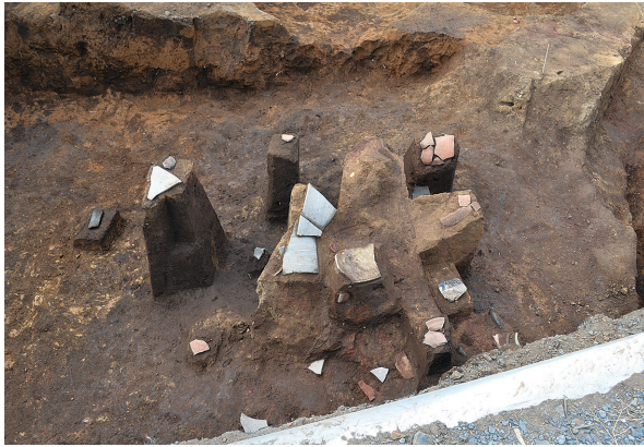
1B区第1号竪穴建物跡3号竈遺物出土状況（南から）