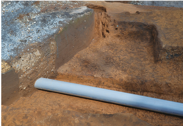
北区第4号竖穴建物跡完掘全景（南から）