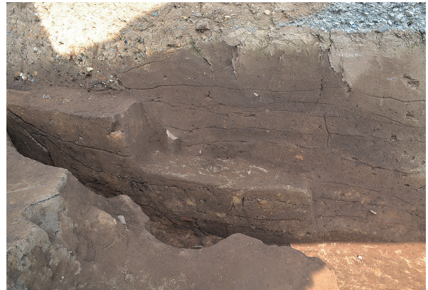
北区第3号竖穴建物跡新竈土層（西から）