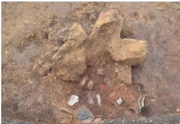
1B区第1号竖穴建物跡3号竈（南から）