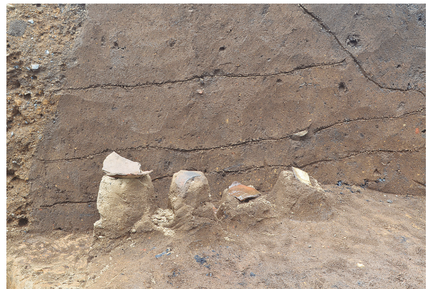
北区第4号竖穴建物跡遺物出土状況②（東から）