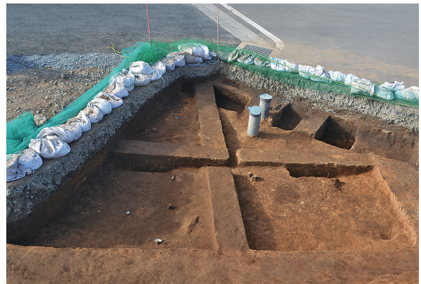
北区第1号竪穴建物跡南側全景（南から）