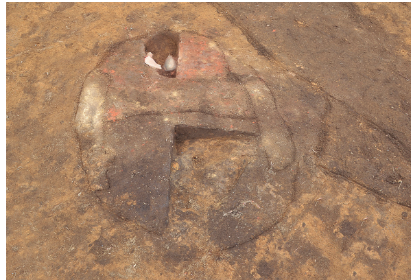
北区第6号竖穴建物跡竈（西から）