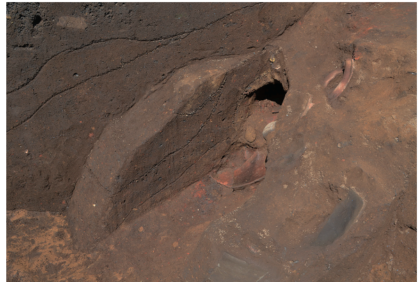
北区第4号竖穴建物跡竈土層（南東から）