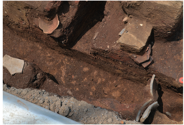
1B区第1号竪穴建物跡3号竈遺物出土状況（北から）