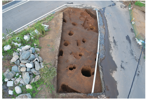
1B区全景（西上方から）