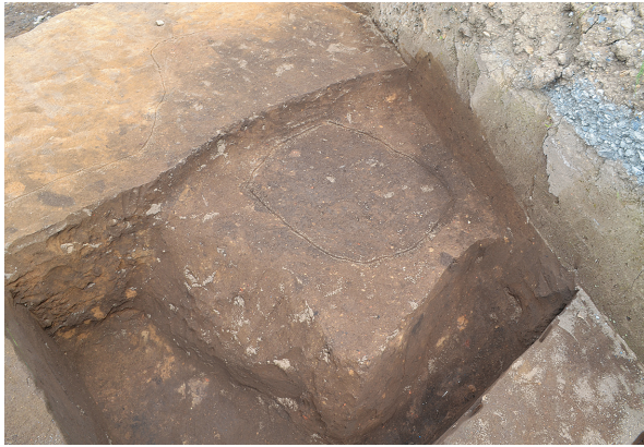
北区第3号竖穴建物跡新竈掛孔確認状況（南から）