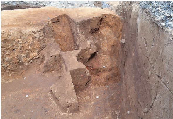
北区第3号竖穴建物跡新・旧竈（南から）