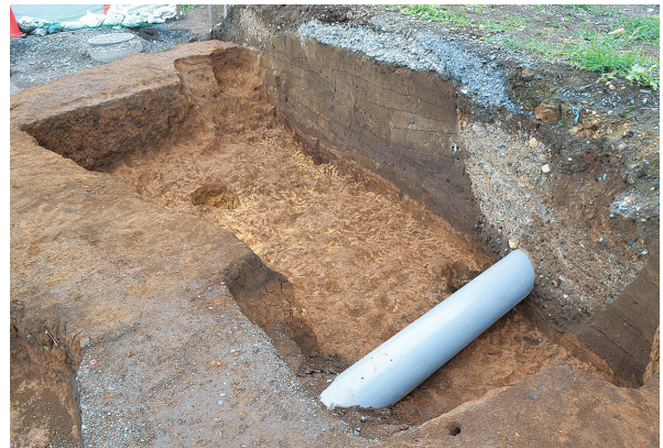
北区第3号竪穴建物跡掘方（南西から）