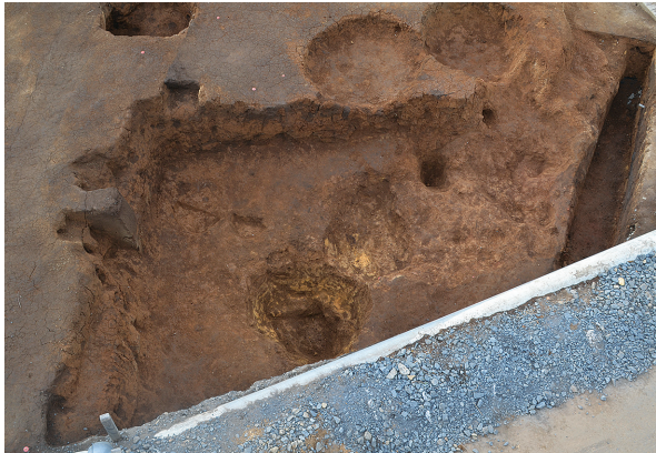
1B区第1号竖穴建物跡完掘全景（南から）