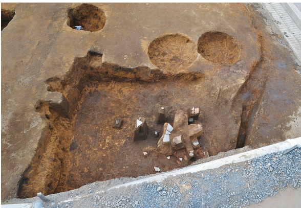
1B区第1号竪穴建物跡北側全景（南から）