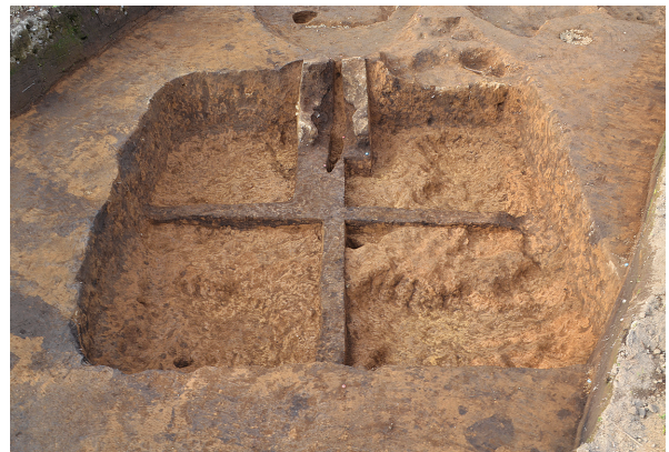
北区第7号竖穴建物跡掘方土層（南から）