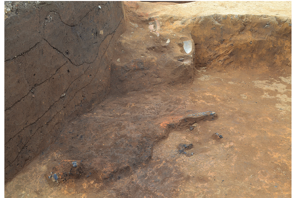
北区第4号竖穴建物跡炭化物確認状況（南から）