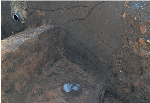
北区第4号竖穴建物跡遺物出土状況③（東から）