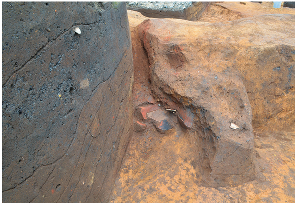
北区第4号竖穴建物跡竈遺物出土状況（南から）