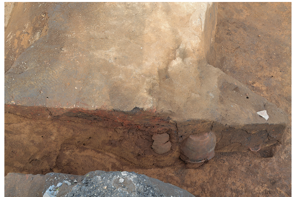
北区第4号竖穴建物跡竈東袖土層（西から）