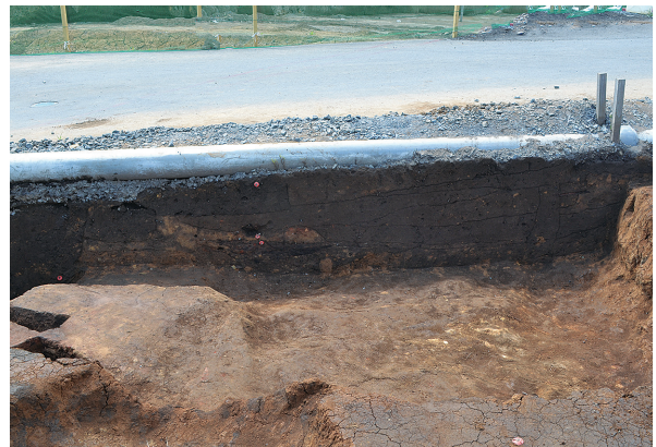
1B区第1号竖穴建物跡北側南壁面土層（北から）