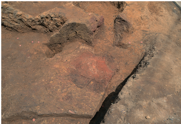
1B区第1号竖穴建物跡1・2号竈（南から）