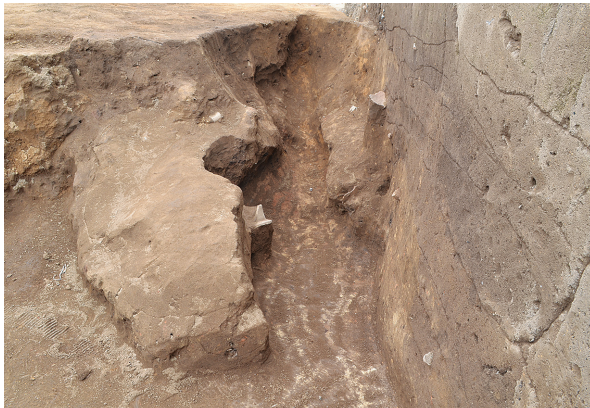
北区第3号竖穴建物跡新竈全景（南から）