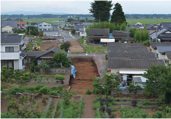
遺跡から那珂川低地を望む