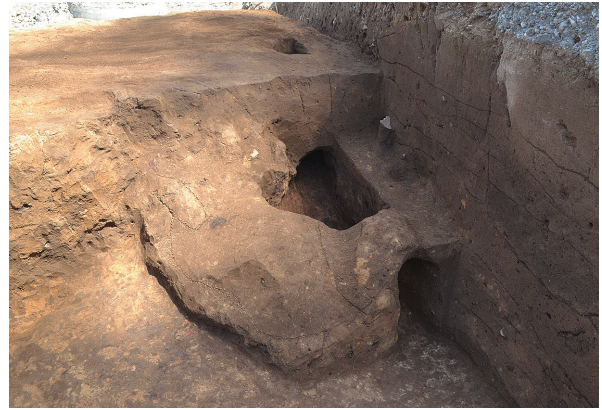
北区第3号竖穴建物跡新竈残存状況（南から）