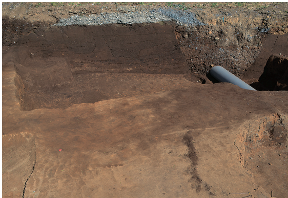
北区第3号竪穴建物跡全景（西から）