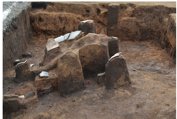
1B区第1号竖穴建物跡3号竈土層（東から）