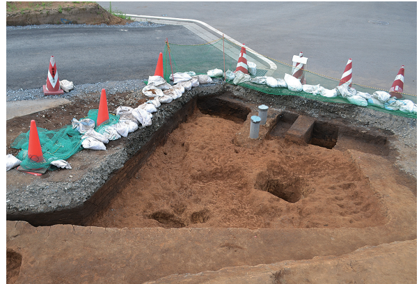
北区第5号竖穴建物跡南側掘方全景（南から）