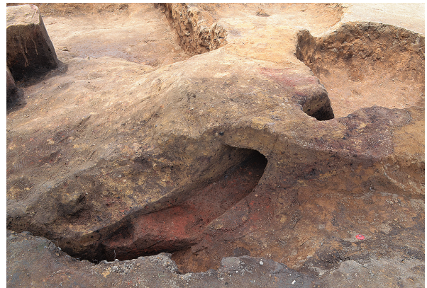
1B区第1号竖穴建物跡2号竈裁割（南東から）