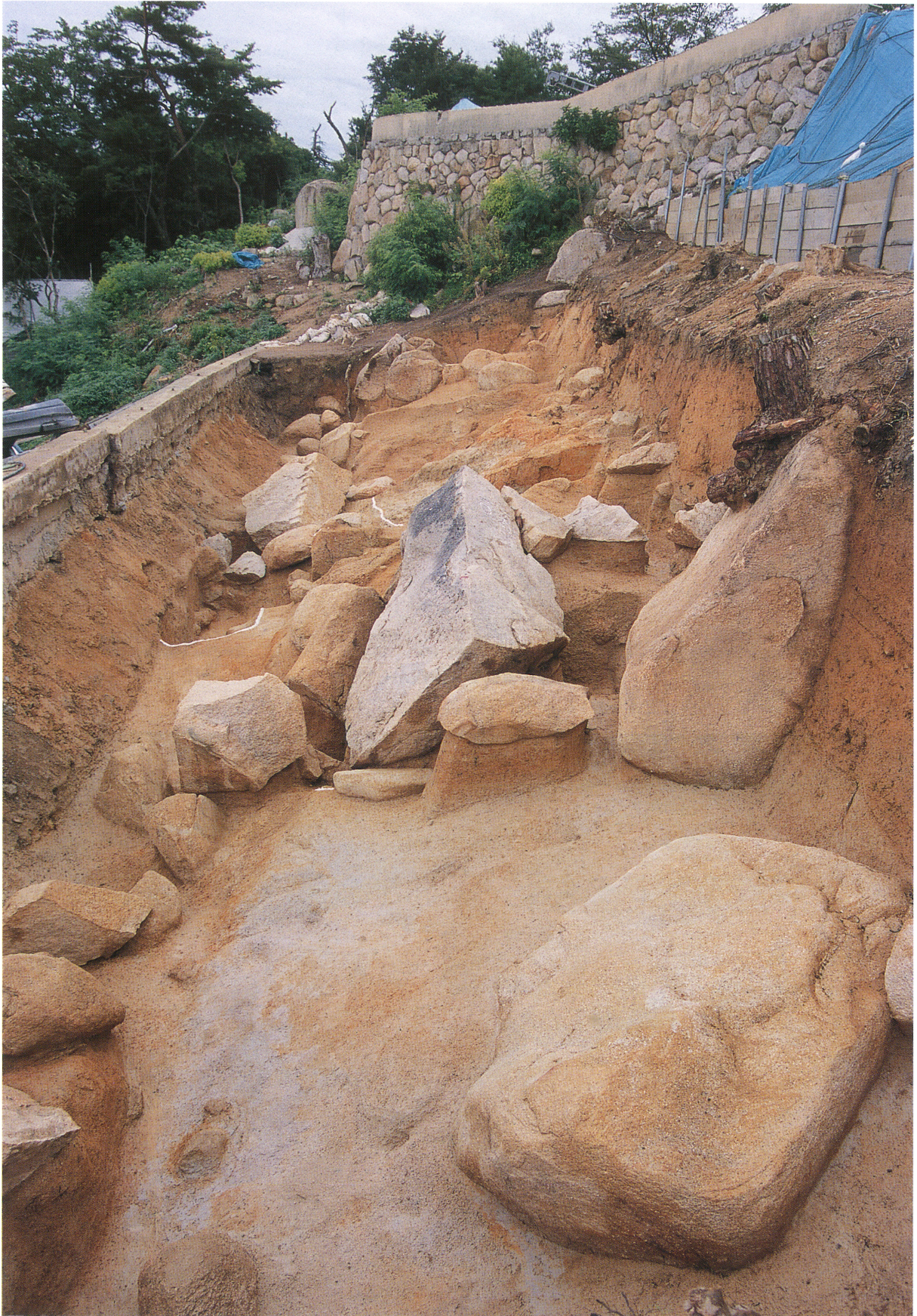
採石遺構 3・4 (北東から)