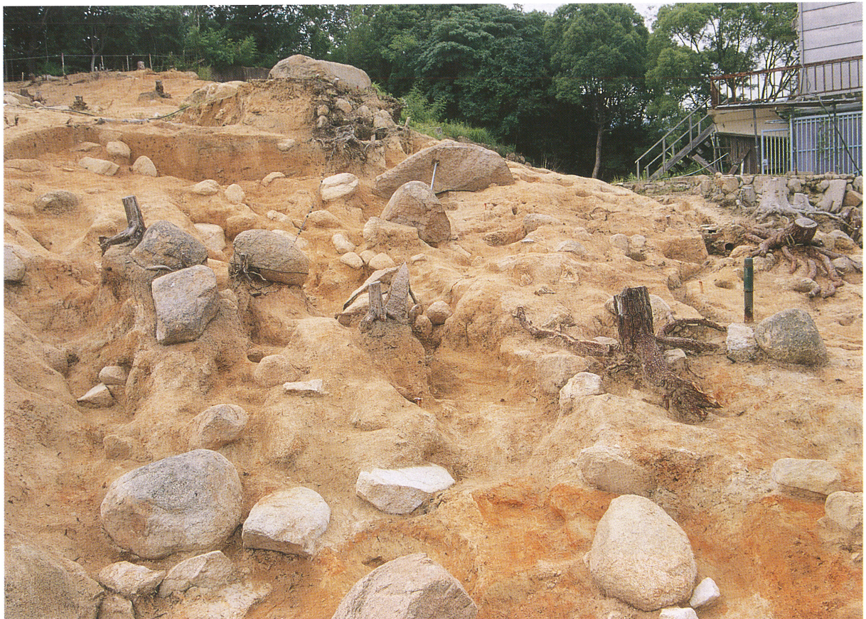
採石遺構 2 と谷 2 (南東から)