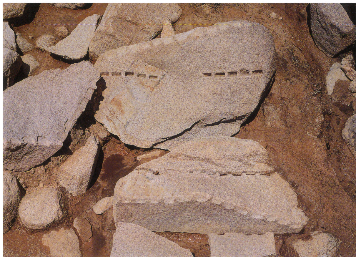
採石遺構 5 割石検出状況（南から）