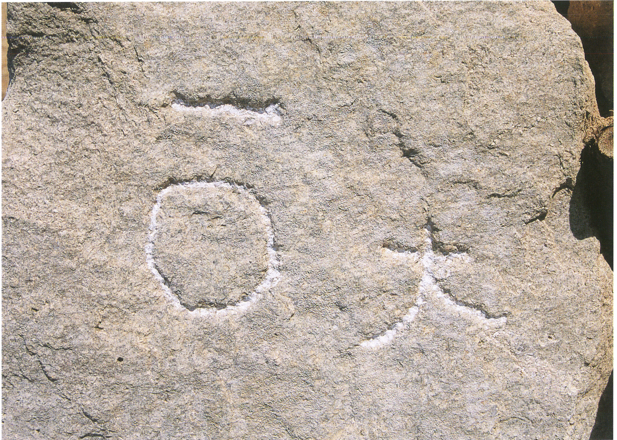
7号石材刻印A・B（北東から）