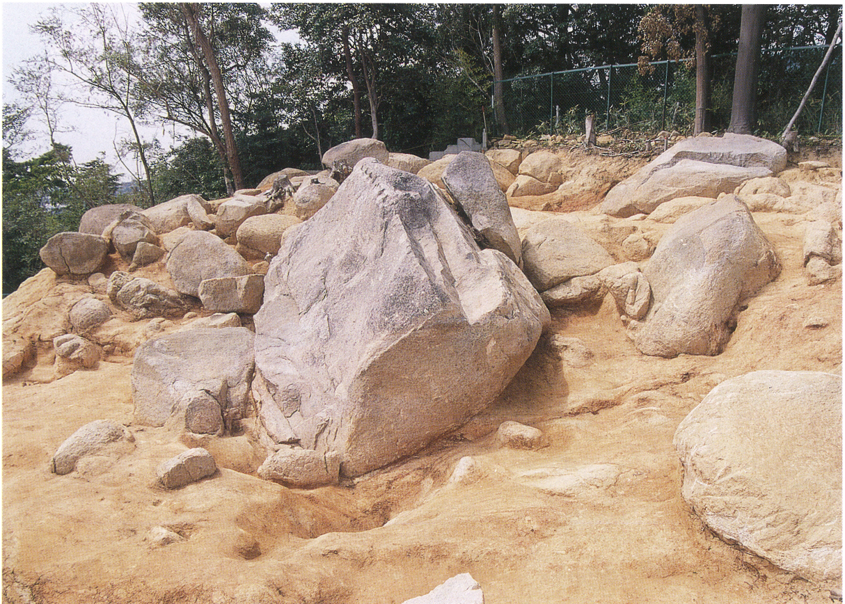
3号石材採石土坑 (東から)