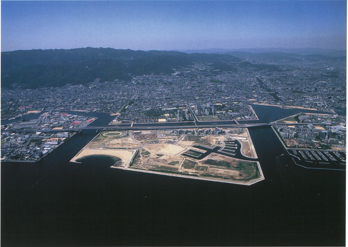
大阪湾上空から芦屋市と六甲山地東南麓を望む（南から、平成16年芦屋市広報課撮影・提供）