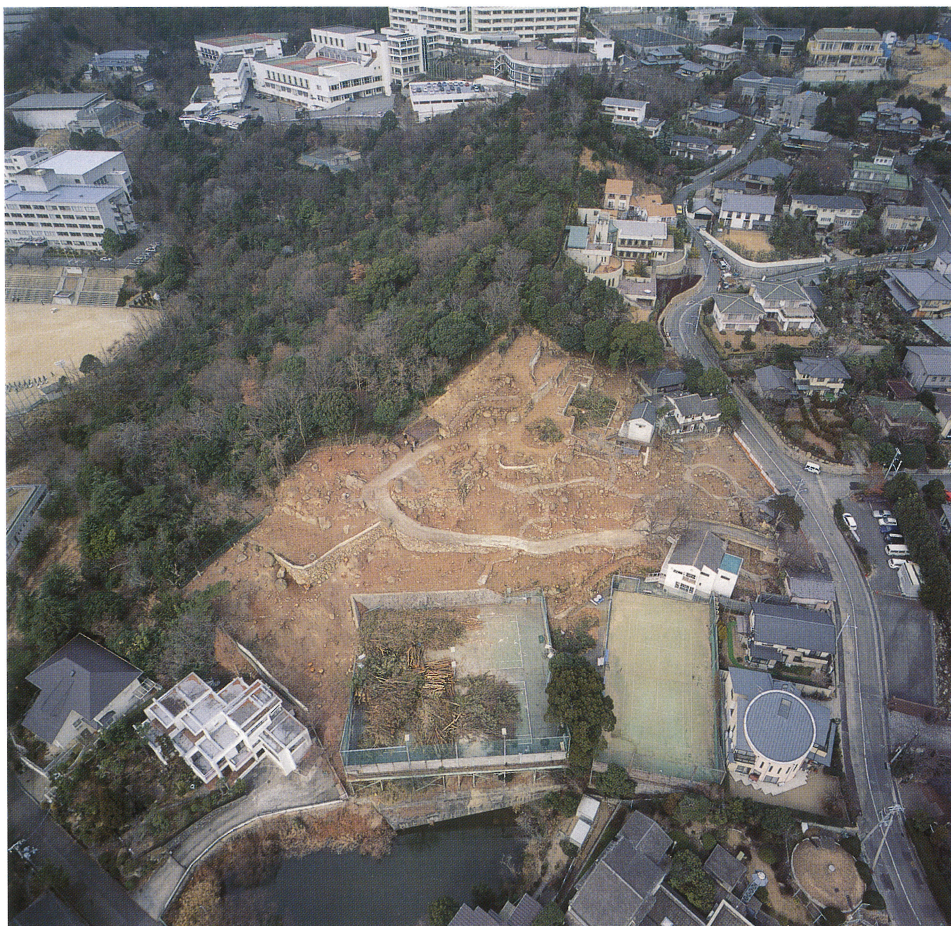
調査地現況 (樹木伐採後、南東から)