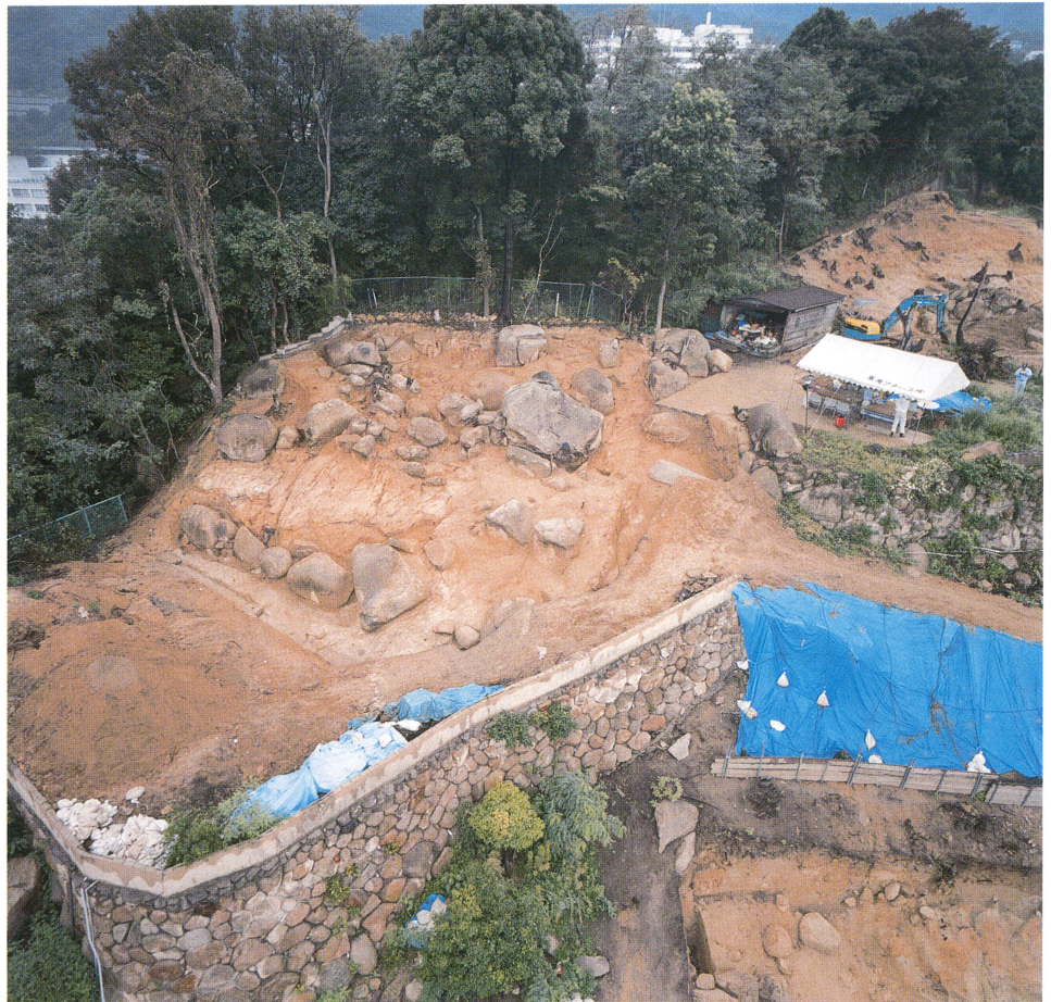
B 4区全景 (南東から)