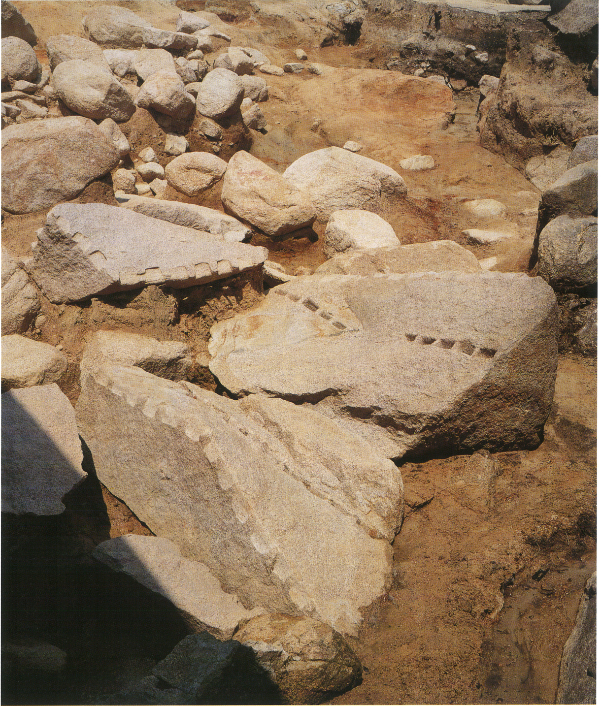
採石遺構 5 (南東から)