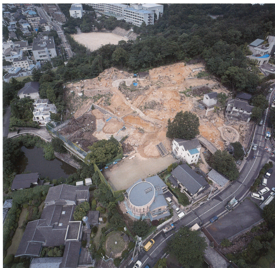
調査地全景 (東から)