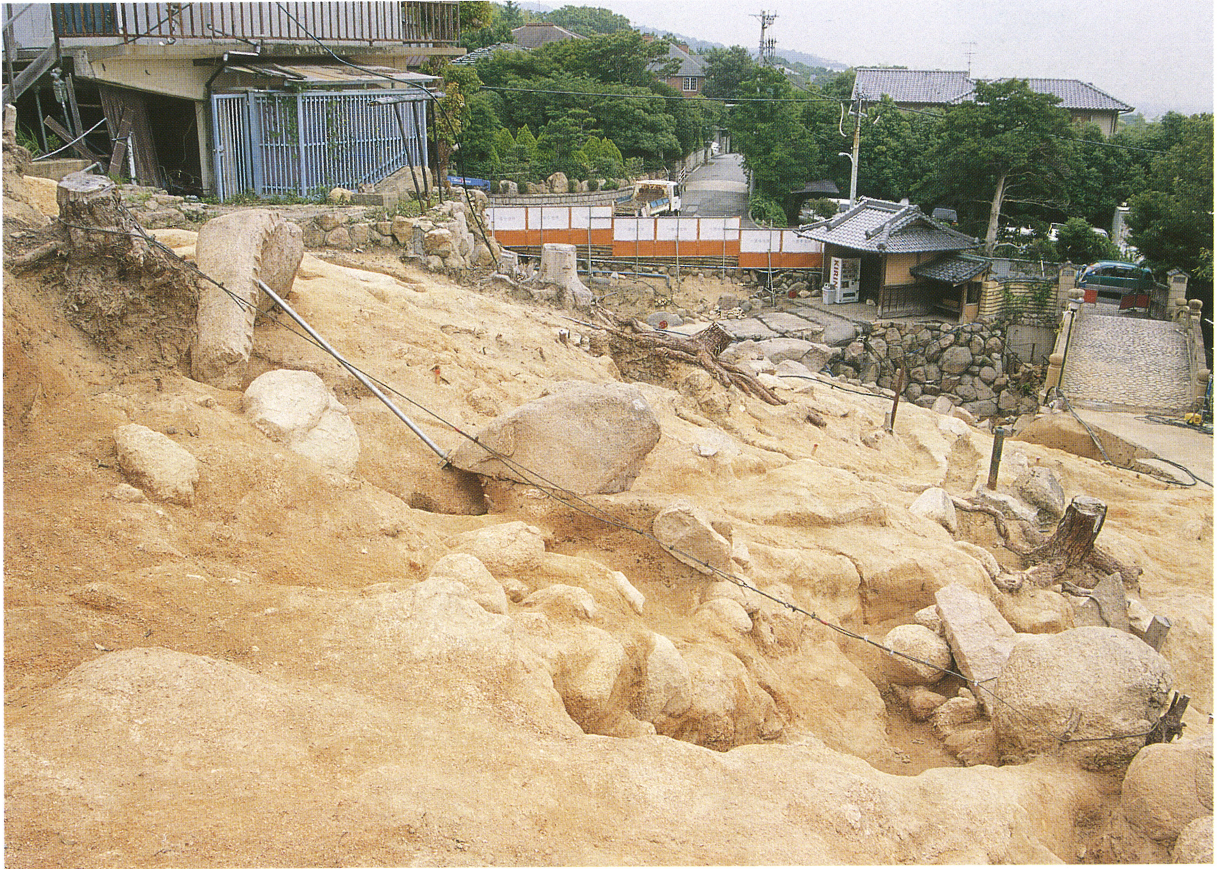
採石遺構 2 (南西から)