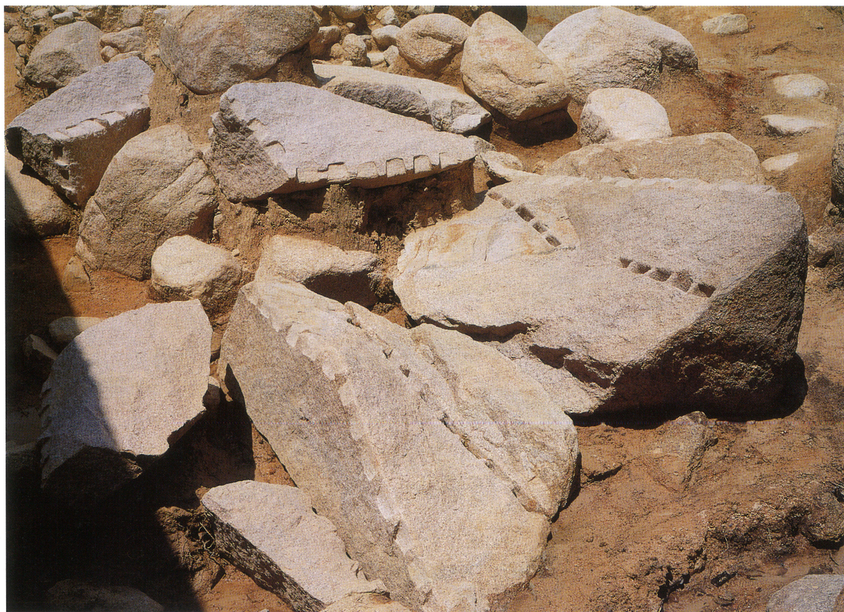
採石遺構 5 割石検出状況（南東から）