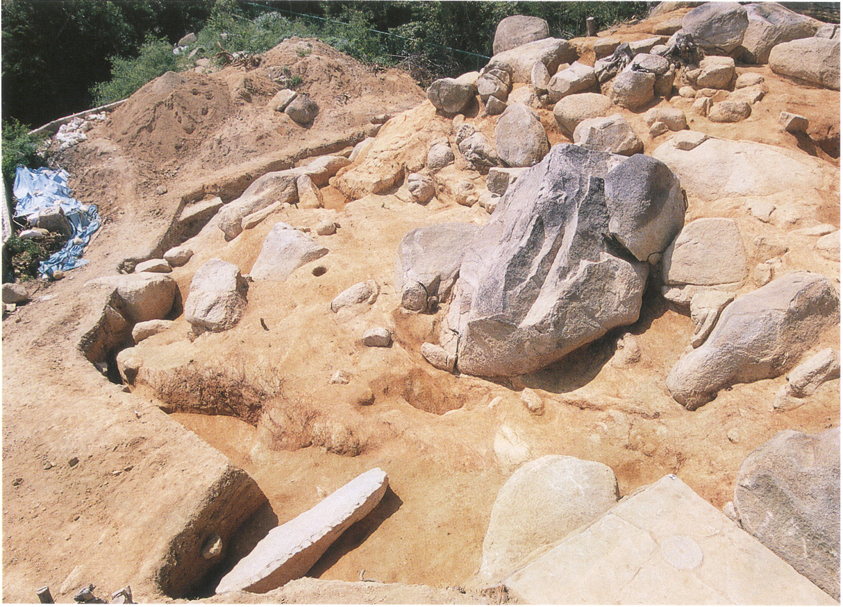
採石遺構 1 (北東から)