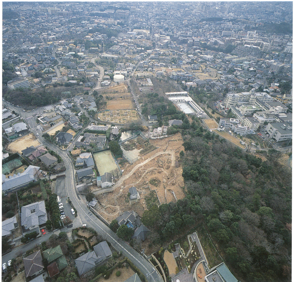
長背尾根東斜面に 立地する調査地 （北から）