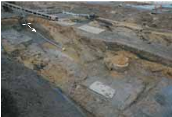
SD05土層断面 (南東から)