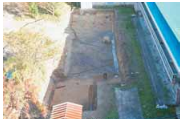
南側調査区完掘状況 (北西から)