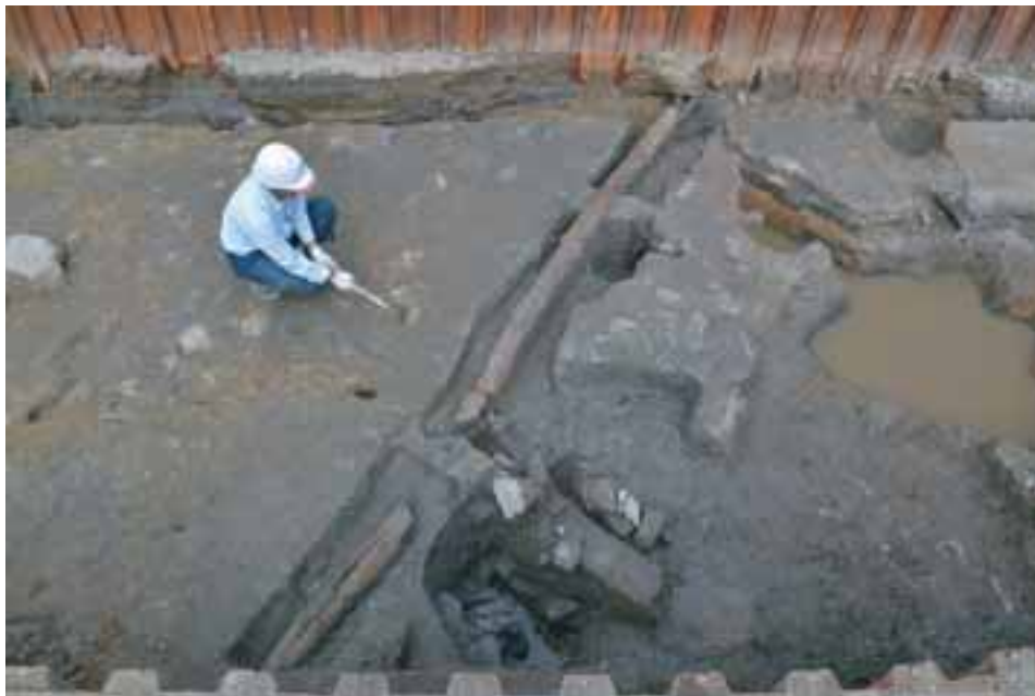
第1遺構面 木樋検出状況（南から）

木樋は、丸太材で作られたもので、江戸時代後期以降の導水施設と考えられ、県内では類例をみない貴重な資料である。また、調査区の東端で、城下町造成の初期段階に掘削されたと考えられる素掘りの大溝（南北溝）の一部を検出した。溝は現道路に沿う形で、約2mの深さまで急勾配に掘り込まれ、溝幅は2m以上になるものと推測される。さらに、城下町造成前の旧地表面（黒褐色粘質土）に踏み込まれた人の足跡が見つかった。城下町造成直前あるいは直後の様相を示すものである。（園山 薫）