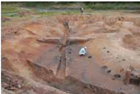
北側調査区完掘状況 (南西から)