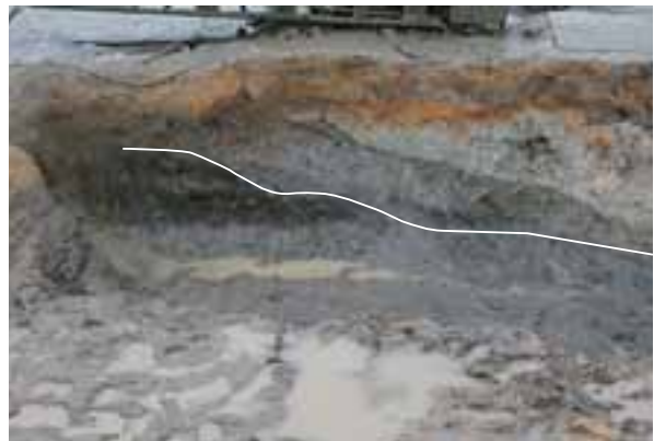
SD05土層断面西部 (南から)