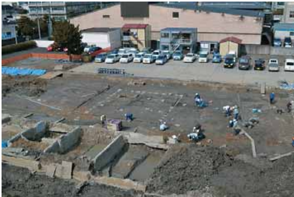
礎石建物跡検出状況

が立ち並んでいた場所であり、現存する古絵図から堀尾期(1607～1633年)には長谷川氏(400石)、窪田氏(350石)、武侯氏(300石)、岩崎氏(200石)の屋敷地であったことが知られている。今年度の調査では第1～2遺構面の調査を行い、平成24年度には第3～5遺構面の調査を行う予定である。本年度の調査では第2遺構面(掘削深70～80cm、標高1.5～1.6m)から礎石建物跡を検出した。礎石建物跡の規模は南側が近代建物の基礎によって消失していたことから明確にはできないが、東西9m、南北10.5m以上であったと想定される。礎石には松江城の石垣に多く見られる大海崎石が使用され、江戸時代の建物跡の特徴をもつものであったが、同遺構面の出土遺物から明治時代～幕末あたりの礎石建物跡と考えている。継続して行う平成24年度の調査では、これより下層の松江城下町形成時の遺構面まで掘り下げる予定である。江戸時代の松江城下町の姿を明らかにしていく上で、注目する調査地の一つである。(落合昭久)