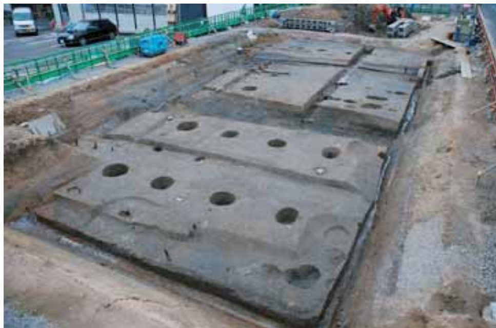
第4遺構面 松平期の掘立柱建物跡(北東から)