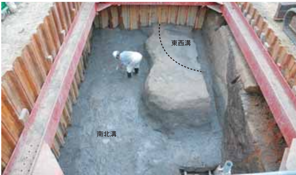
素掘りの大溝 (北から)

調査の結果、6面の遺構面を確認した。第1、2面は出土遺物から、近現代の遺構面であった。第3遺構面からはピットを、第4遺構面からは植栽痕やピット、礎石を検出した。植栽痕は10箇所確認でき、樹皮から松や桜の木と思われた。第5遺構面からは、土坑または溝と思われる大きな落ち込みを検出した。埋土は有機質を多く含む土層で、遺物は木製品が出土している。第6遺構面からは、素掘りの大溝を確認した。完掘状況から、東西溝の底部は、南北溝西側0.4～0.5m手前で終結し、底面標高から、南北溝は北側へ、東西溝は西側へ傾斜していることがわかった。溝の一部は第5遺構面の大きな落ち込みによって削平されていたため、全容を解明することはできなかったが、両溝の底面は繋がっていないことが確認された。今回の調査で、角地部分の大溝の在り方が少しは解明され、今後、周辺の調査成果も合わせて検討すれば、より一層松江城下町を知ることができると思われる。(廣濱貴子)