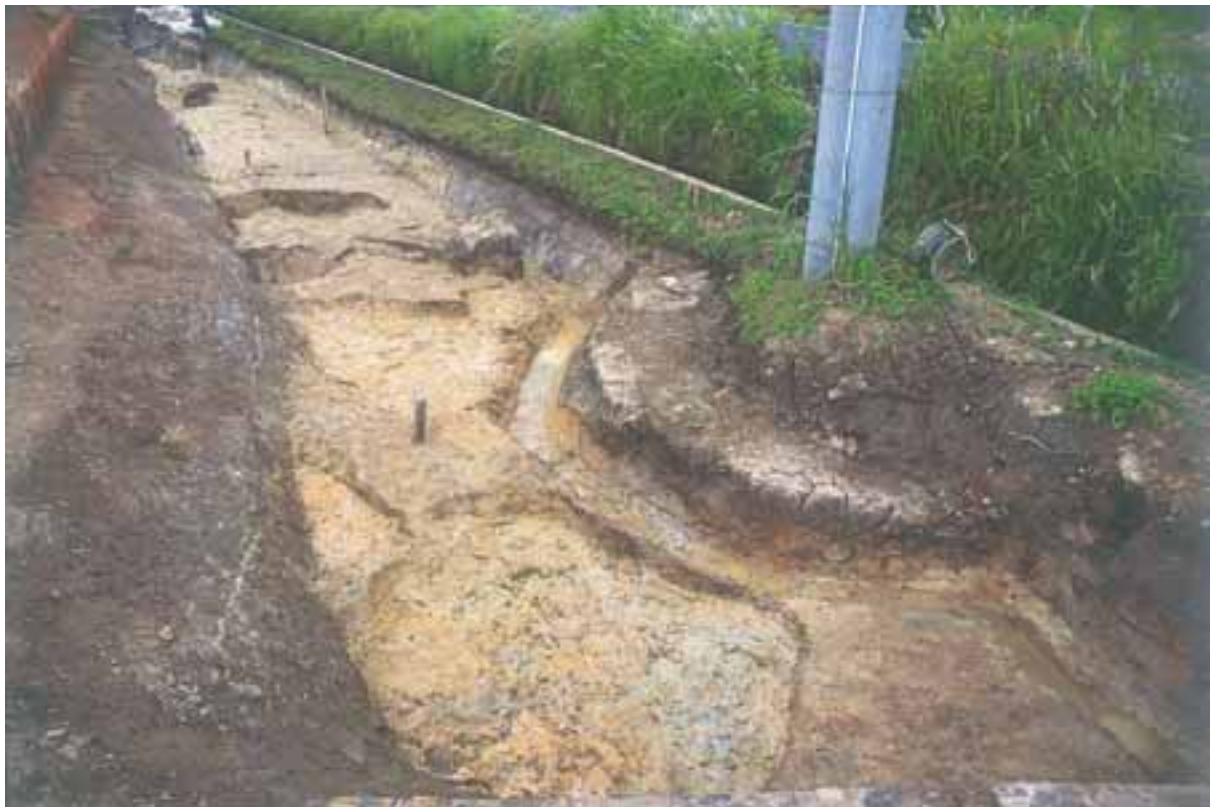
粘土採掘坑検出状況

200mの地点に所在する。最も国分寺に近い調査区の地山直上から弥生時代中期末の甕が炭を伴って出土し、その東方では弥生時代後期末の深く広い掘り込みが埋め立てられた遺構や、古墳時代後期を中心とする粘土の採掘跡が検出された。国分寺に関連する遺構は検出されず、奈良～平安時代の遺物は少量しか出土しなかったが、上層の遺物包含層から木簡破損品1点と墨書土器が出土した。このことから、地形的にやや高くなっている本遺跡の北方に国分寺の寺域が広がり、関連施設が存在する可能性が高いものと考えられる。(江川幸子)