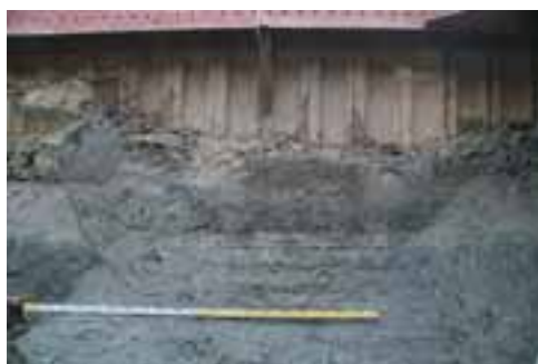
素掘りの大溝断面 (MJR240)