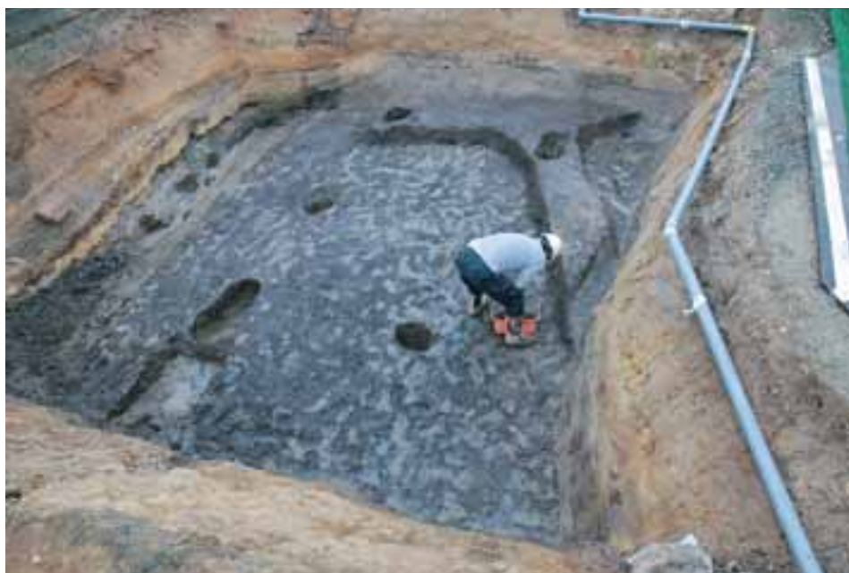
第6遺構面 城下町造成直前あるいは直後の水田跡(東から)