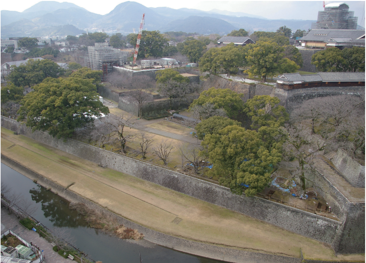
長堀 確認調査地東半部遠景(南東から)