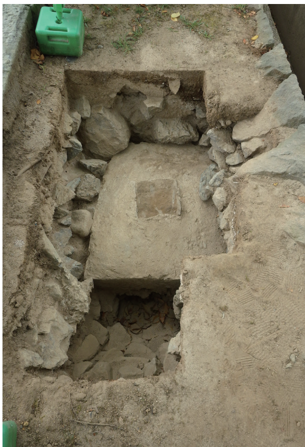
長堀トレンチ07 完掘状況(東から)