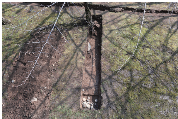
飯田丸トレンチ01-② 全景(西から)