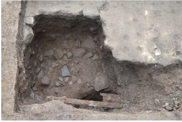
長塀トレンチ04 c区 整地土層検出状況(北から)