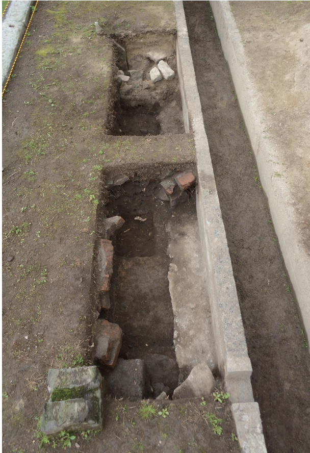
長堀トレンチ01-③ 全景(東から)