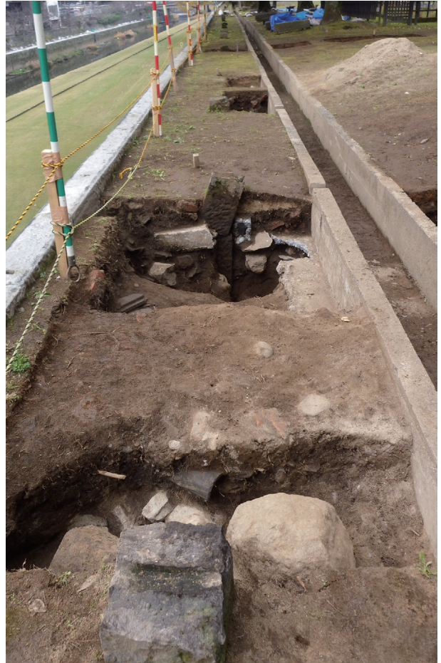
長堀トレンチ01-① 控石柱列(東から)