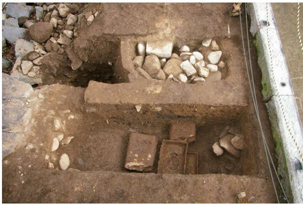
長塀トレンチ05 全景(西から)