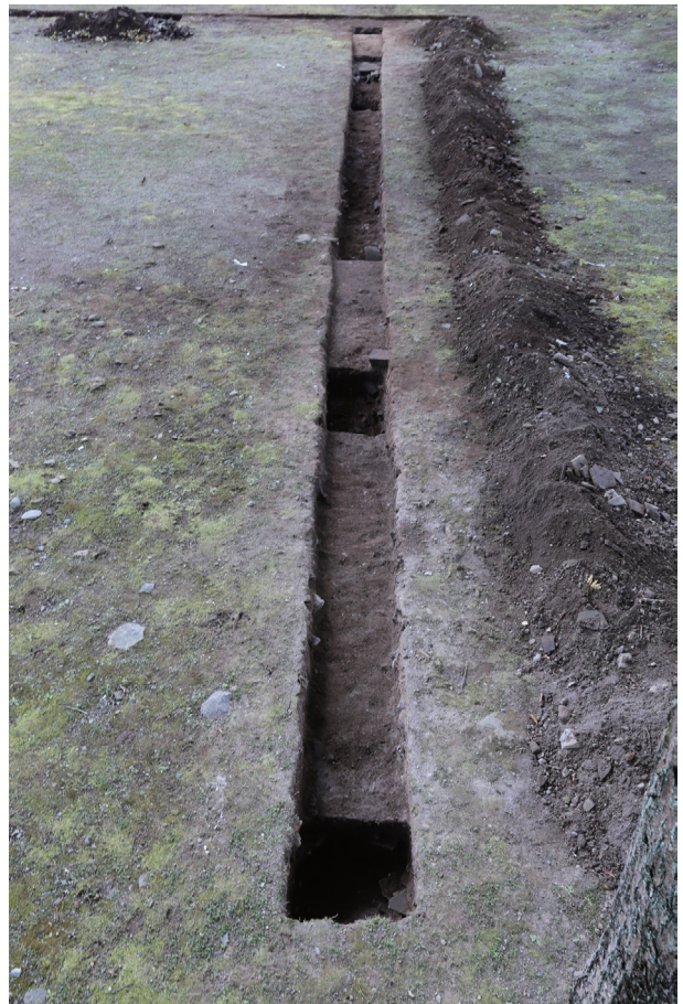
東竹の丸トレンチ06-② 完掘状況(北から)