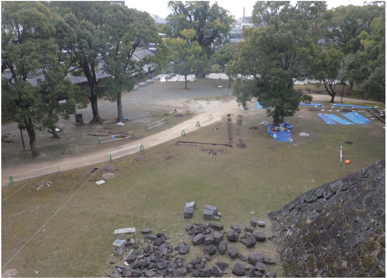
東竹の丸 全景(北から)