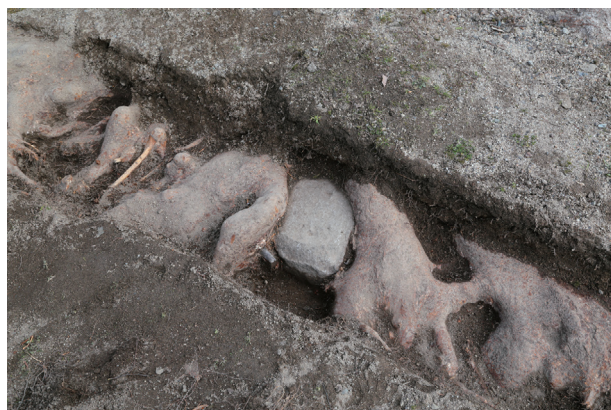
飯田丸トレンチ05 礎石 8 検出状況(西から)