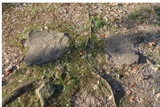
東竹の丸 露出石材 4 (南から)