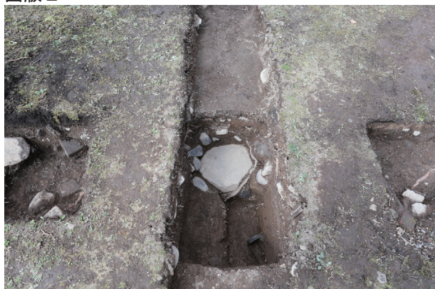
飯田丸トレンチ01-①ST02 礎石 2・瓦検出状況(南から)