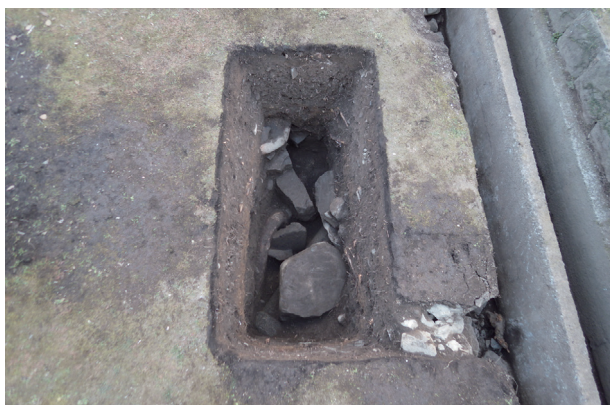
長堀トレンチ10 完掘状況(西から)