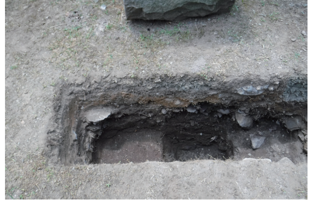
飯田丸トレンチ11 土層堆積状況(北から)