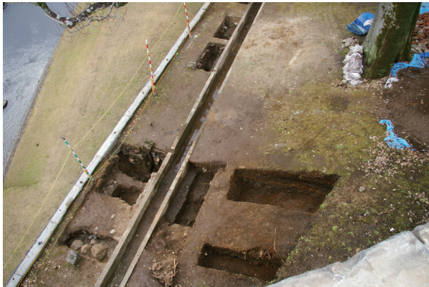
長堀トレンチ01-①・③ 全景(東から)