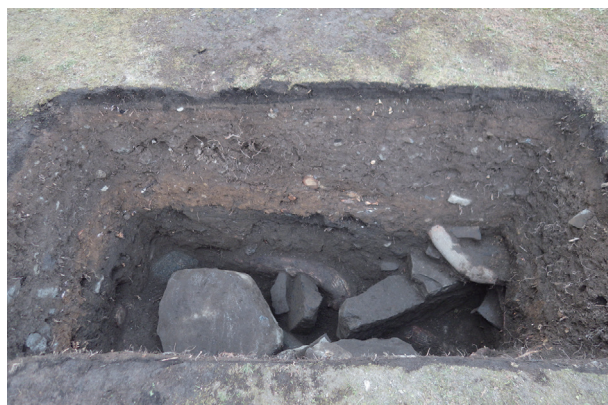
長堀トレンチ10 土層堆積状況(南から)