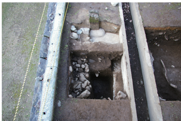
長堀トレンチ02-① a区 栗石層・控石柱No. 15検出状況(東から)