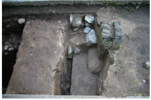
長塀トレンチ02-① a 区 控石柱No. 15 コンクリート基礎検出状況(北から)