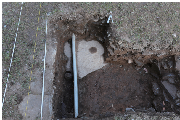
東竹の丸トレンチ07-①ST04 礎石検出状況(南から)