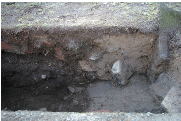
長堀トレンチ01-③ b 区 控石柱No. 5 設置坑断面状況(北から)