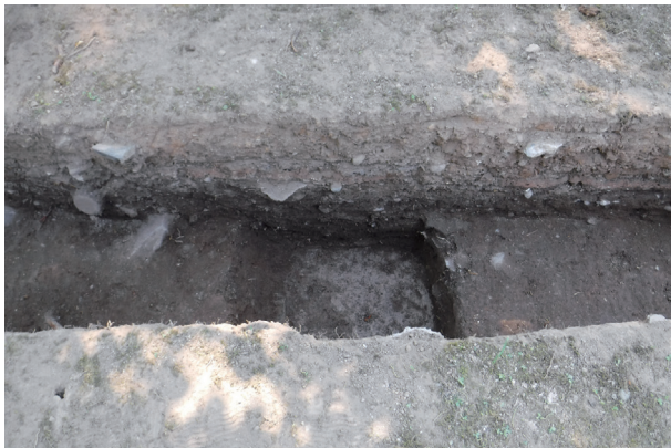
飯田丸トレンチ12 整地土層検出状況(東から)