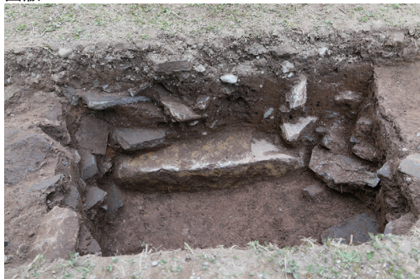
東竹の丸トレンチ07-②ST02 礎石検出状況(南から)