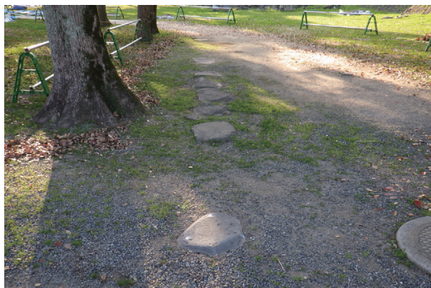
東竹の丸 露出石材 1 (東から)