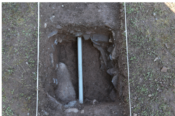
東竹の丸トレンチ07-①ST03 礎石検出状況(南から)