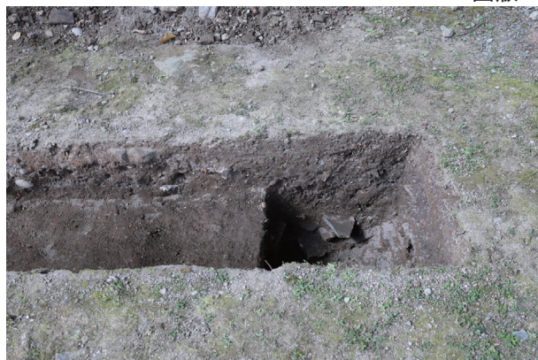
東竹の丸トレンチ06-②ST04 土層堆積状況(東から)