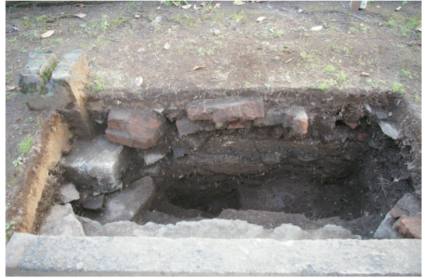
長堀トレンチ01-③ a 区 控石柱No. 4 設置坑断面状況(北から)