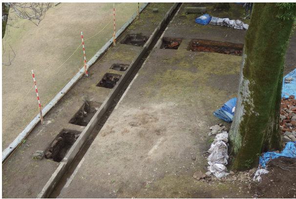
長堀トレンチ01-②～④ 全景(東から)