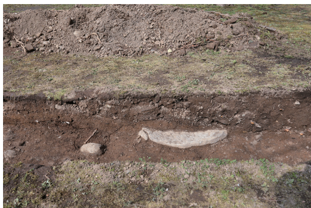
飯田丸トレンチ01-② 礎石 1 検出状況(南から)