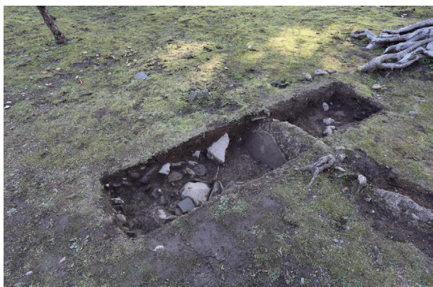
飯田丸トレンチ03 全景(北東から)