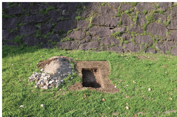
東竹の丸トレンチ09 全景(南から)