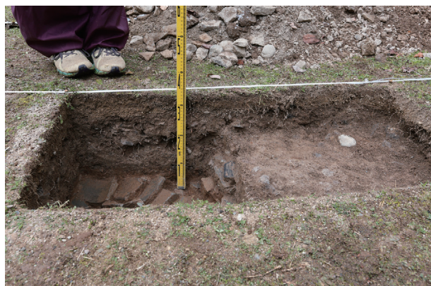
東竹の丸トレンチ09 土層堆積状況(東から)