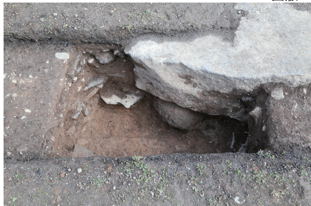
飯田丸トレンチ04-①ST01 土層堆積状況(西から)