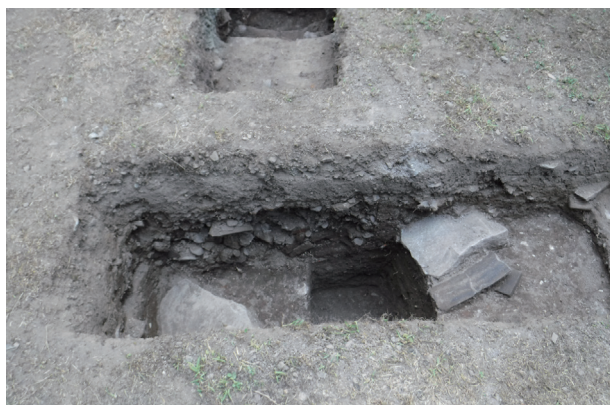
飯田丸トレンチ10 ST01 東壁土層堆積状況(西から)