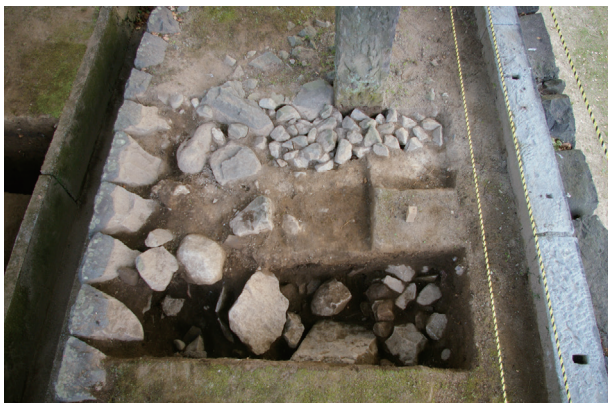
長塀トレンチ03 a 区 完掘状況(西から)