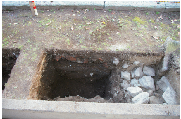
長堀トレンチ01-③ b 区 控石柱No. 5 設置坑基礎押え礫 検出状況(北から)