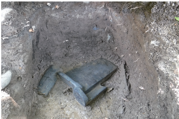
飯田丸トレンチ01-② 瓦出土状況(H30年度調査)