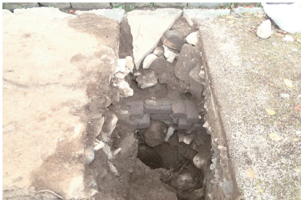
長堀トレンチ04 (H30年度調査) 建物⑬煉瓦基礎 検出状況(南から)