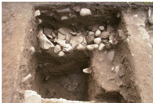
長堀トレンチ02-① a区 栗石層下整地土層断面状況(北から)