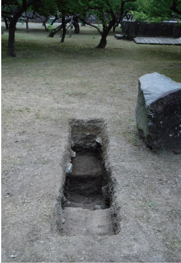
飯田丸トレンチ11 完掘状況(西から)