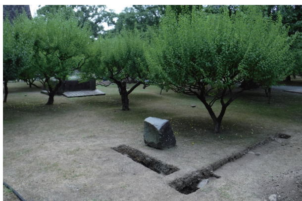
飯田丸トレンチ10・11 配置状況(北西から)