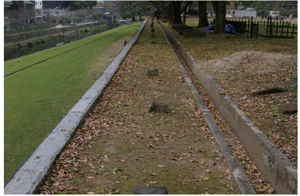
長堀トレンチ01 調査前の状況(東から)