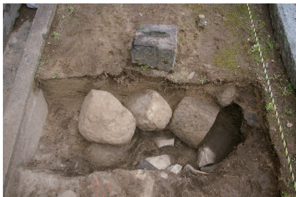
長塀トレンチ01-①a区 控石柱No. 2設置坑礫検出状況(西から)