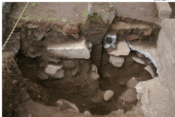
長塀トレンチ01-①a区 控石柱No. 3設置坑断面状況(東から)