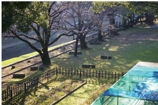
長堀トレンチ02 調査前の状況(東から)