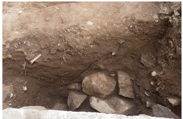
長堀トレンチ01-① a 区 江戸期栗石層 土層堆積状況