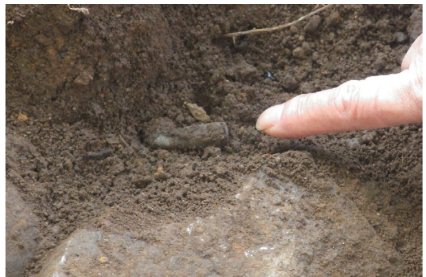
長塀トレンチ03 a 区 弾丸(遺物No. 136) 出土状況 (栗石層上面)