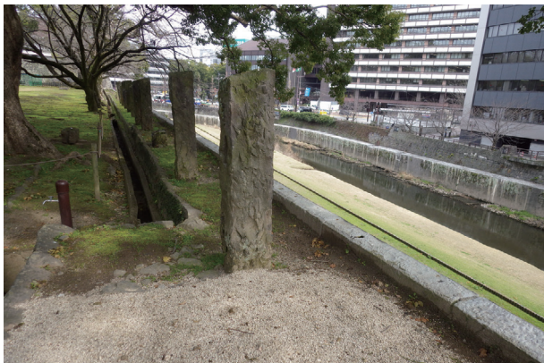
長塀トレンチ03 調査前の状況(西から)