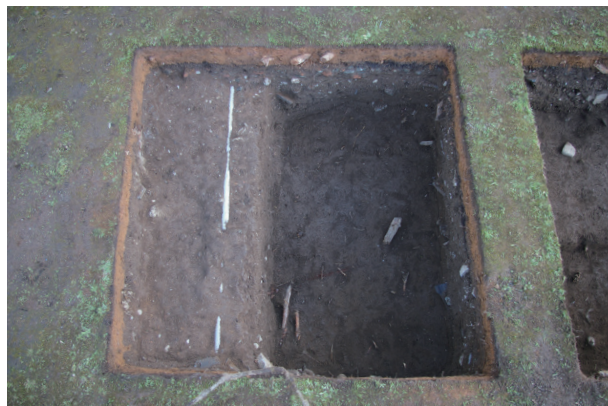
長堀トレンチ02-① c区 完掘状況(西から)