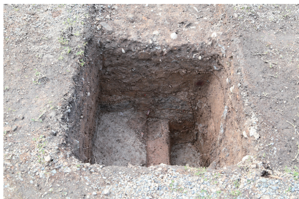
飯田丸トレンチ04-②ST01 土層堆積状況(東から)