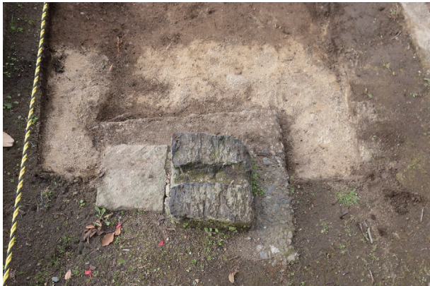
長塀トレンチ02-② 控石柱No. 14設置坑検出状況(東から)