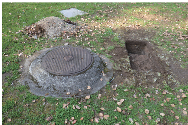
東竹の丸トレンチ08 全景(南から)