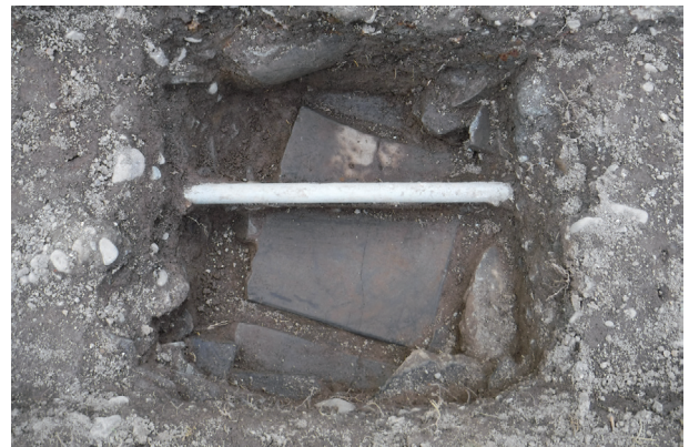
東竹の丸トレンチ07-① 瓦積み排水設備検出状況(H30年度調査)