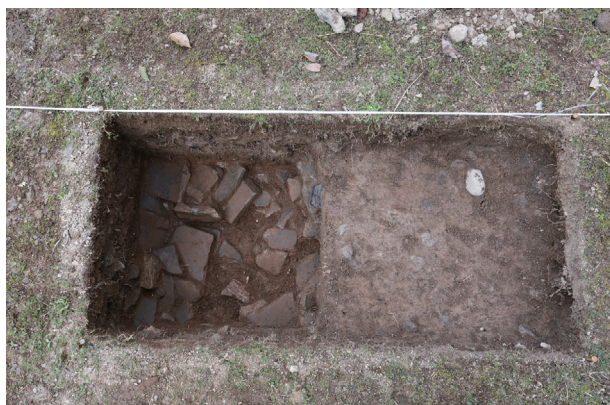
東竹の丸トレンチ09 完掘状況(東から)