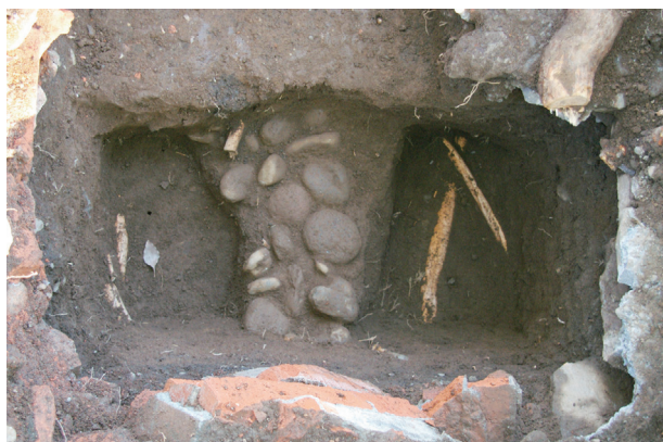
長塀トレンチ01-②b区 礫群1検出状況(西から)