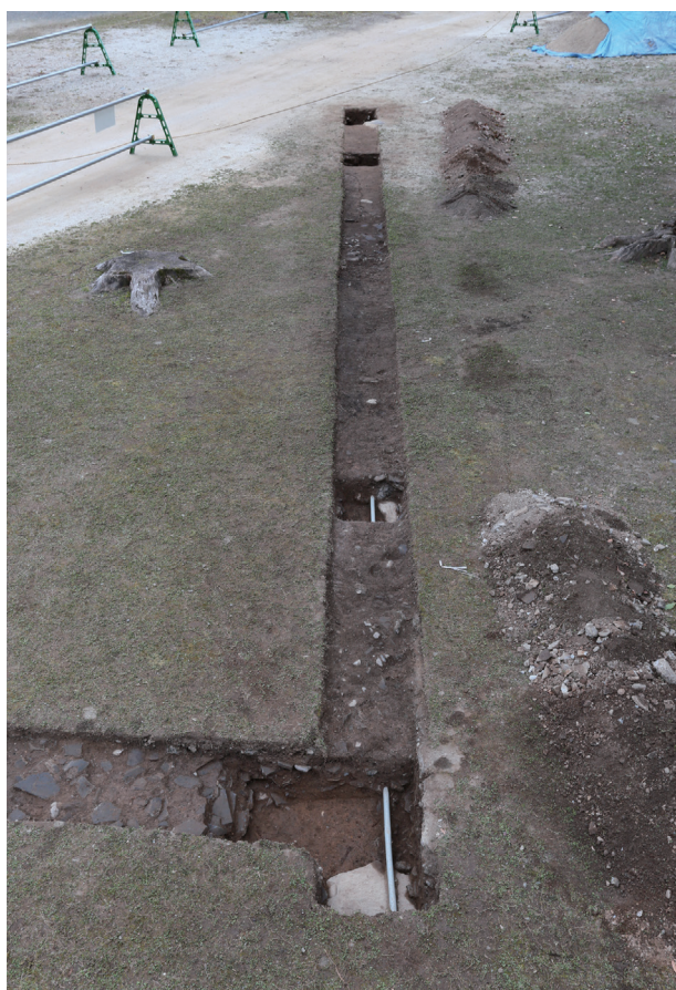
東竹の丸トレンチ07-① 全景(北から)