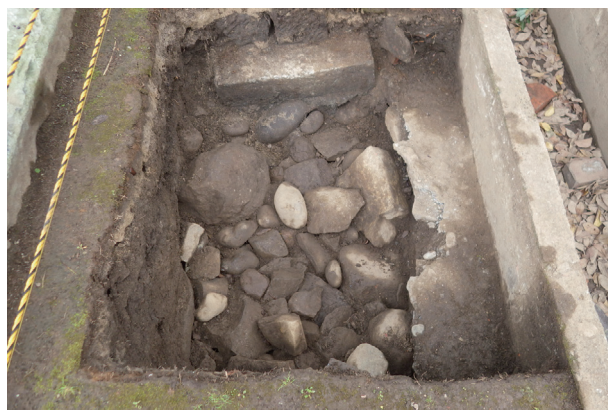
長塀トレンチ01-②a区 栗石層検出状況(東から)