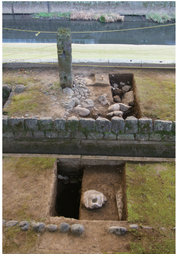
長塀トレンチ03 全景(北から)