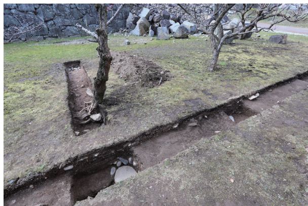
飯田丸トレンチ01 礎石検出状況(南東から)