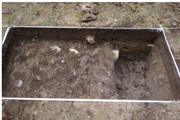
東竹の丸トレンチ08 完掘状況(東から)