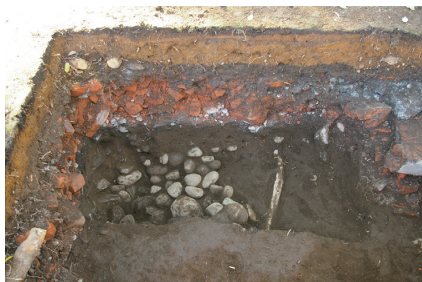
長塀トレンチ01-②c区 礫群2検出状況(東から)