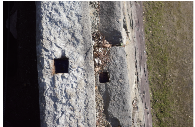
長塀トレンチ05付近 塀基礎石と石垣(H546)天端石の枅穴(西から)