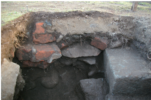
長堀トレンチ01-④ b 区 栗石検出状況(北から)