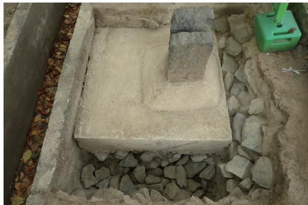
長堀トレンチ06 完掘状況(西から)