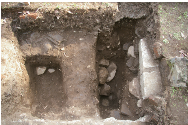
長堀トレンチ01-① a 区 江戸期栗石層検出状況(北から)