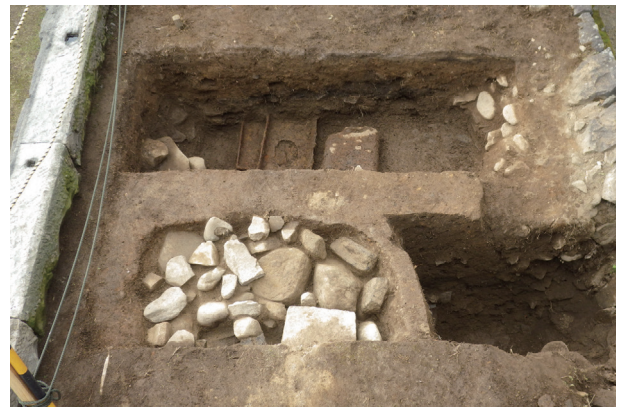
長塀トレンチ05 全景(東から)