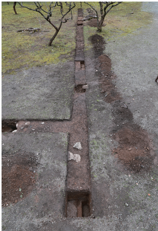
飯田丸トレンチ04-② 全景(東から)