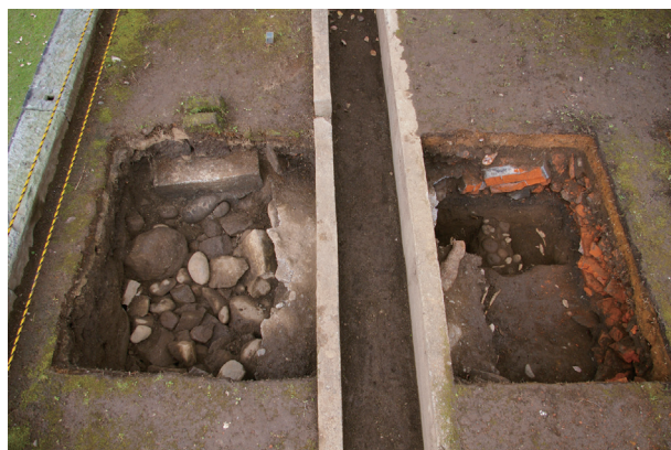
長塀トレンチ01-② a・b区 完掘状況(東から)