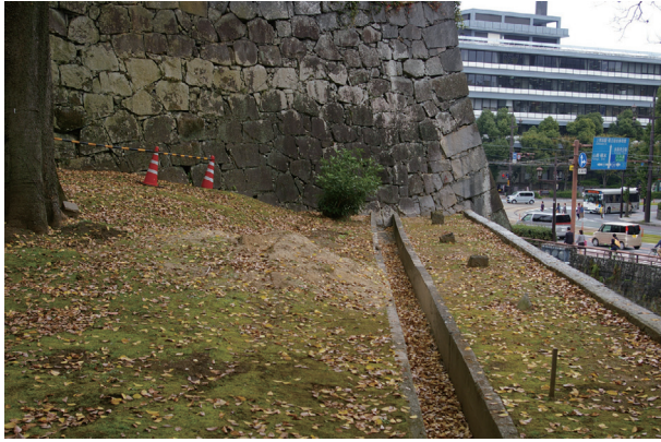
長堀トレンチ01 調査前の状況(西から)