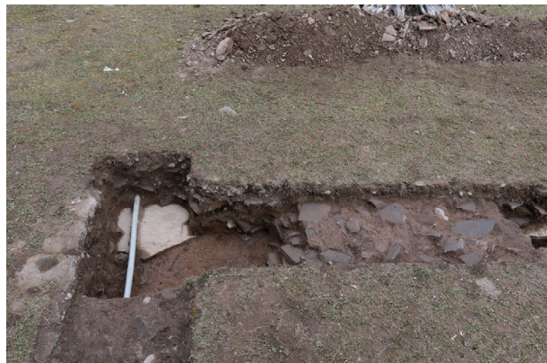
東竹の丸トレンチ07-② 礎石・瓦だまり検出状況(西から)