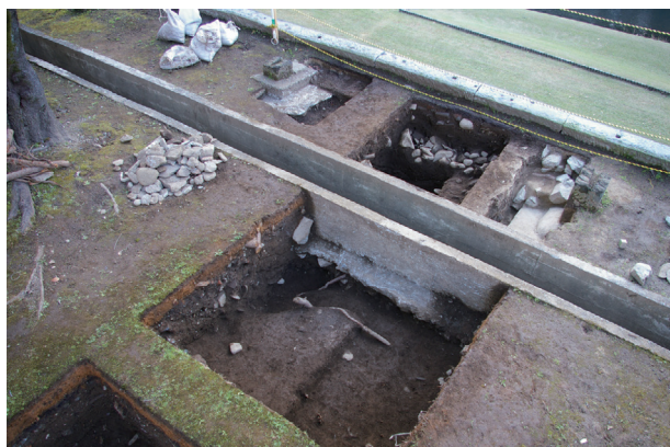
長堀トレンチ02-① a・b区 完掘状況(北西から)