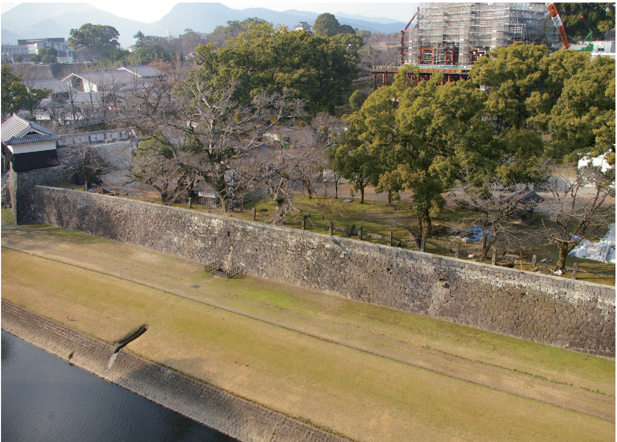
長堀 確認調査地西半部遠景(南東から)