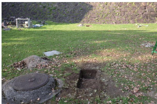
東竹の丸トレンチ08・09 配置状況(南から)