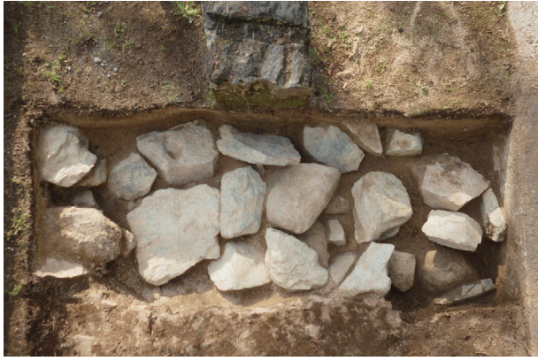
長塀トレンチ02 a 区 控石柱No. 15設置坑 基礎押え礫検出状況(東から)