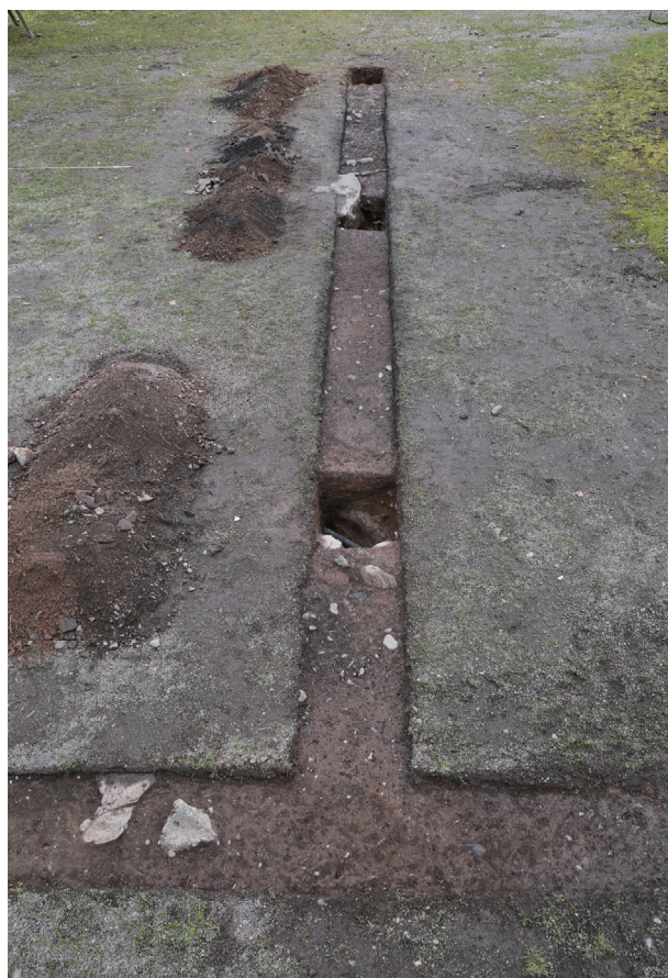
飯田丸トレンチ04-① 全景(北から)