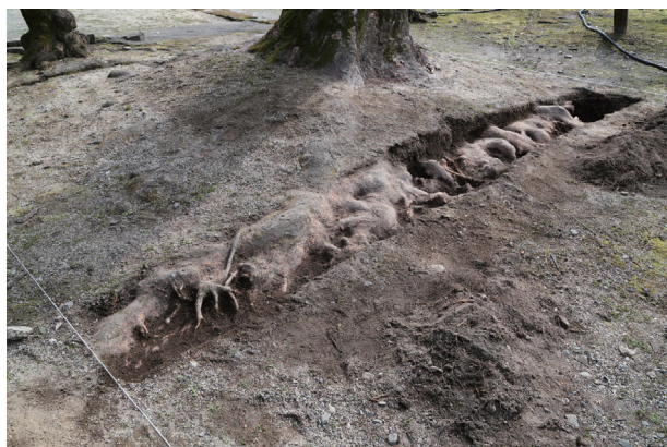
飯田丸トレンチ05 全景(北西から)