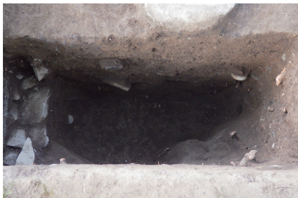
長塀トレンチ03b区 土坑1検出状況(東から)