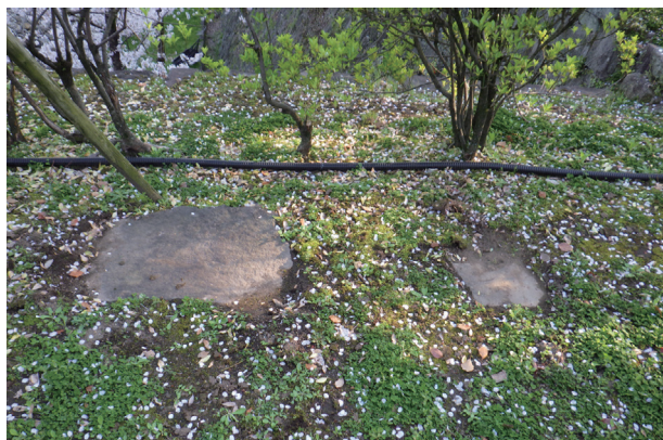
飯田丸 露出石材地点 1 (北から)