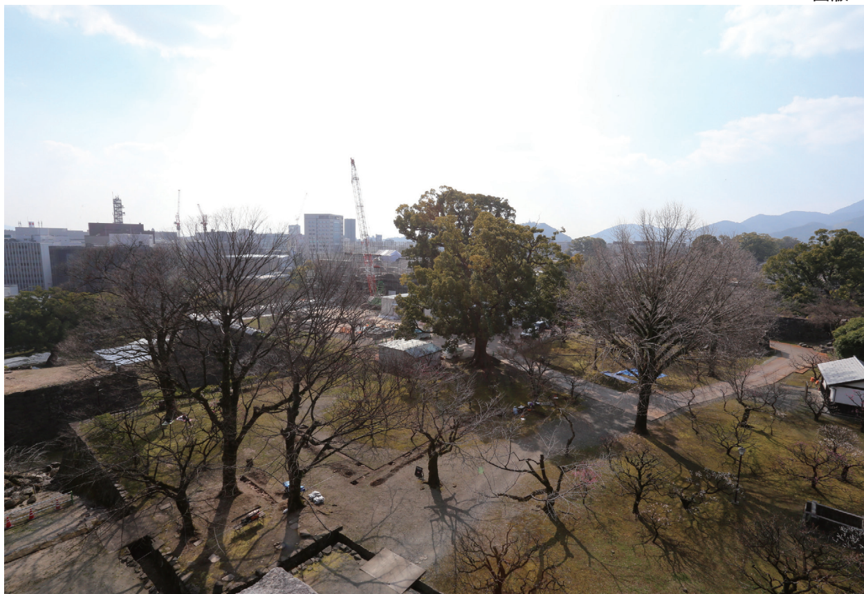
飯田丸 遠景(北東から)