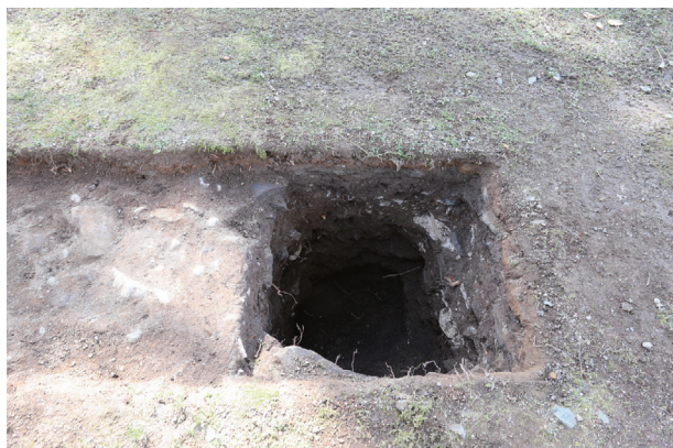
東竹の丸トレンチ06-①ST03 土層堆積状況(北から)