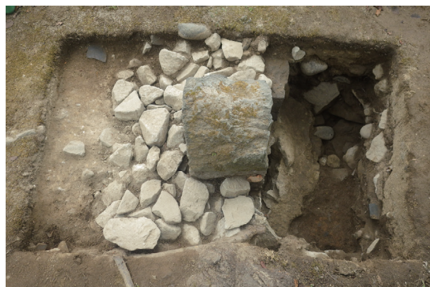
長堀トレンチ08 完掘状況(北から)