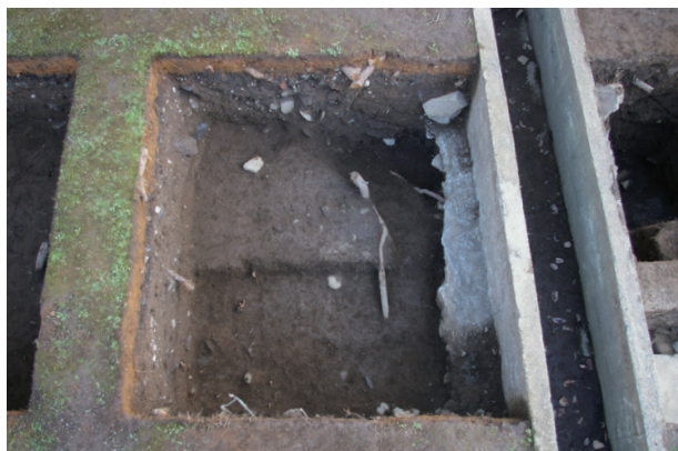
長堀トレンチ02-① b区 完掘状況(西から)