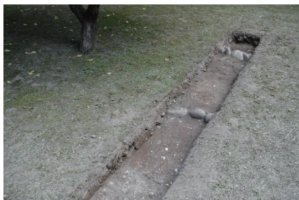
飯田丸トレンチ10 現代園路検出状況(北西から)