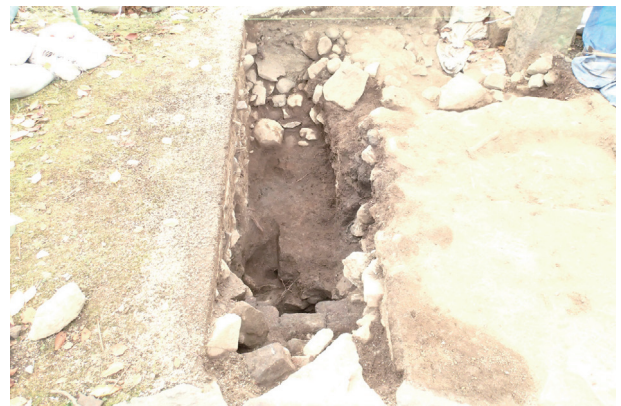
長塀トレンチ04 (H30年度調査)トレンチ完掘状況(北から)