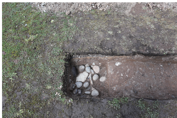
飯田丸トレンチ01-②ST01 礎石 抜取 1 検出状況(南から)