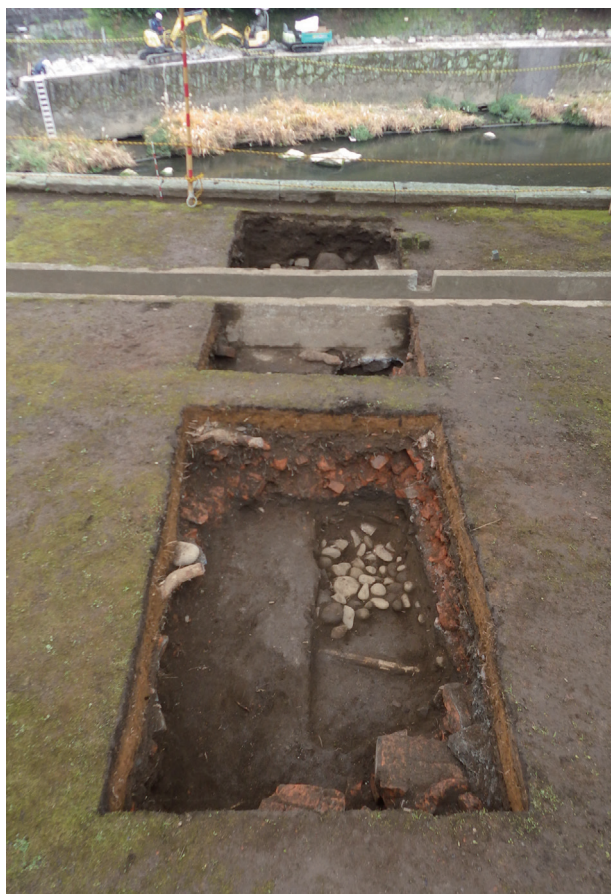
長塀トレンチ01-② 全景(北から)