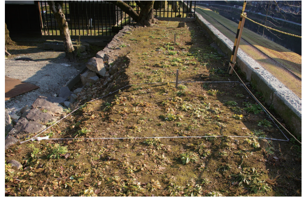
長塀トレンチ05 調査前の状況(西から)