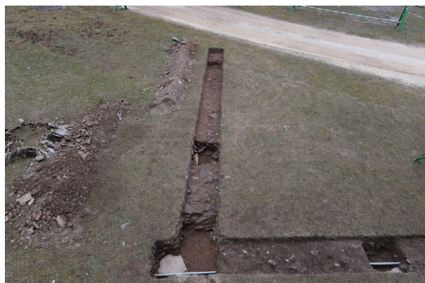
東竹の丸トレンチ07-②西側 全景(西から)