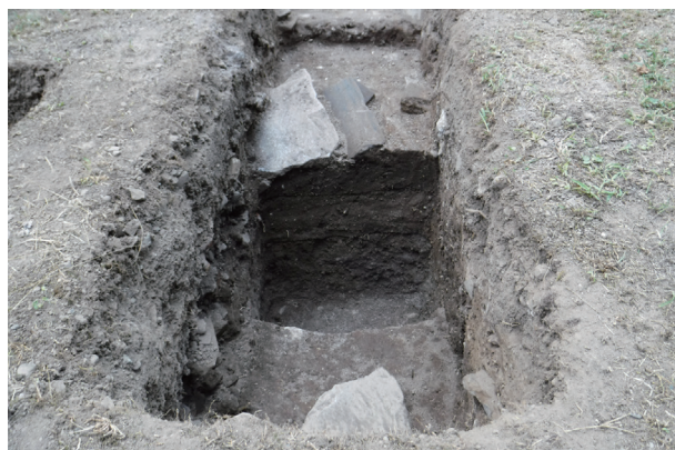
飯田丸トレンチ10 ST01 南壁土層堆積状況(北から)