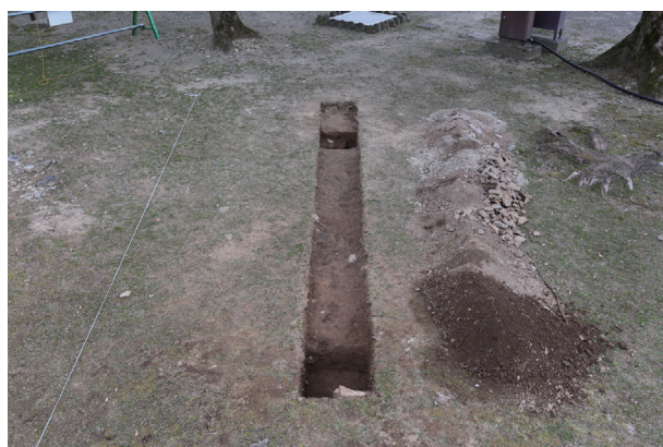
東竹の丸トレンチ07-②東側 全景(西から)