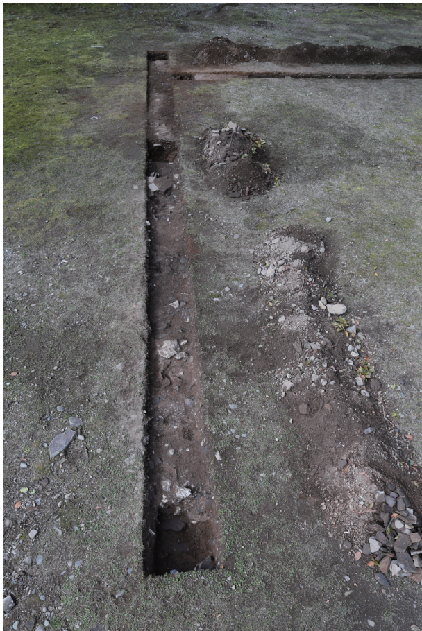
東竹の丸トレンチ06-① 完掘状況(東から)