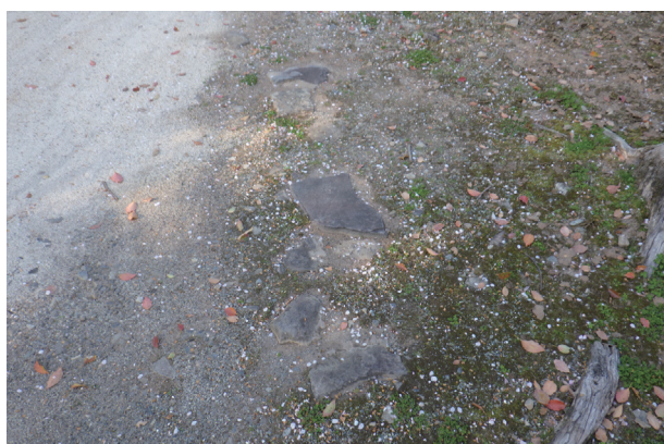
東竹の丸 露出石材 3 (南から)