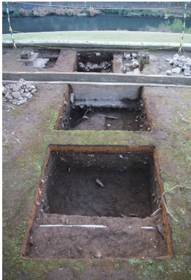
長堀トレンチ02 全景(北から)