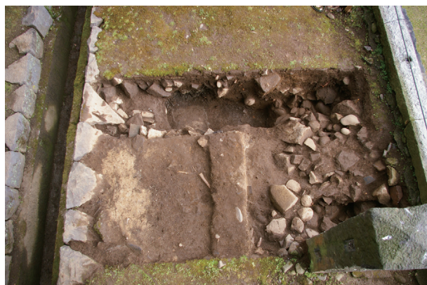
長塀トレンチ04a区 完掘状況(西から)