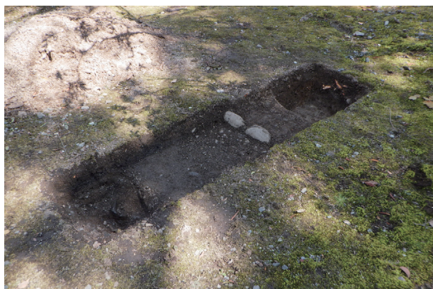
飯田丸トレンチ02 全景(西から)