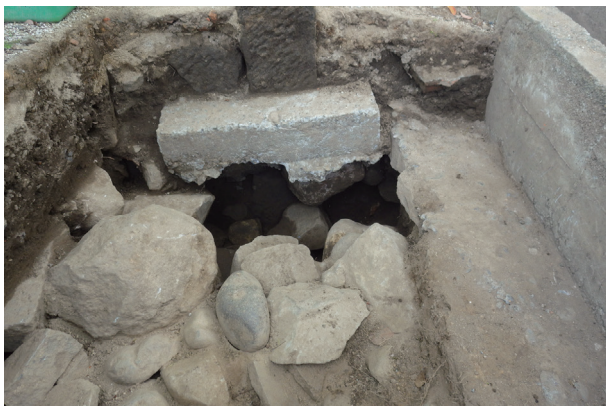
長塀トレンチ01-② (H30年度調査)トレンチ完掘状況(東から)