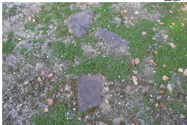
東竹の丸 露出石材 2 (南から)