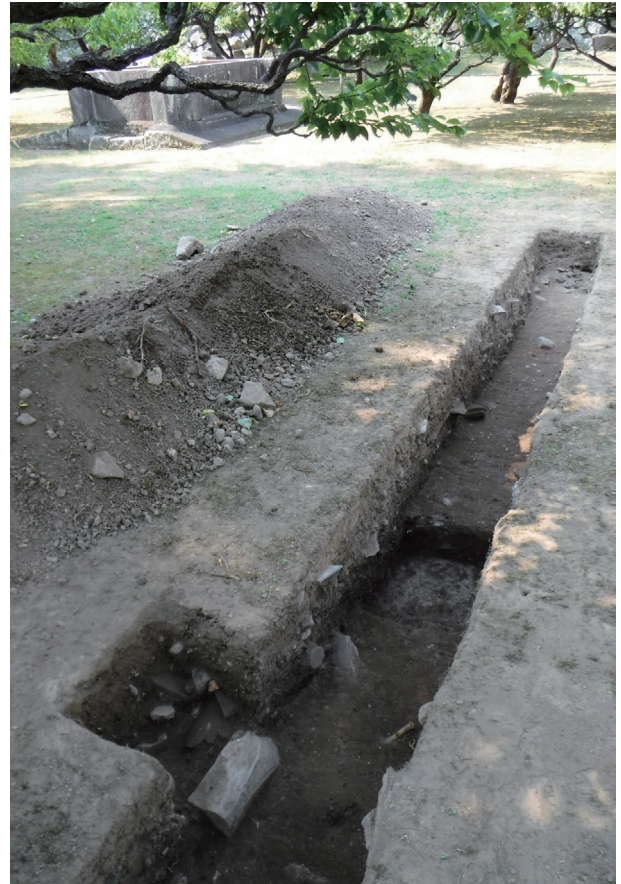
飯田丸トレンチ12 完掘状況(南東から)