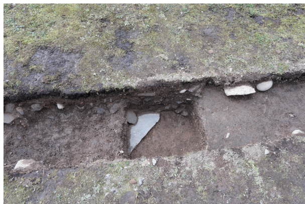
飯田丸トレンチ01-①ST03 礎石 3 検出状況(東から)