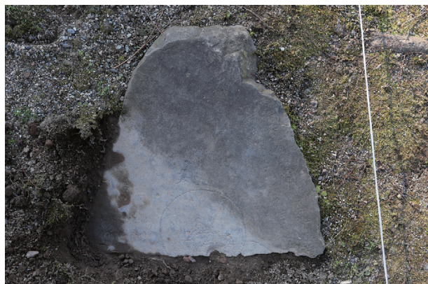
飯田丸 元塩蔵内北側礎石群 礎石 3 (板碑)