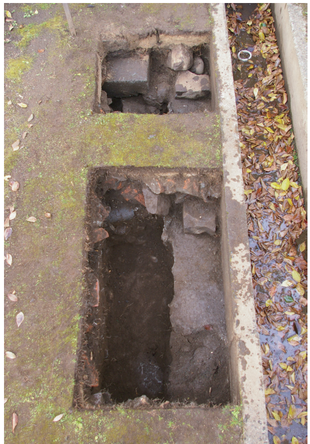
長堀トレンチ01-④ 全景(西から)