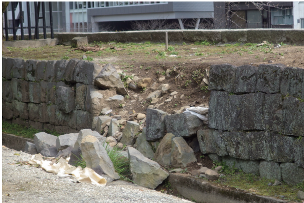
長塀トレンチ05 石垣(H561)崩落状況