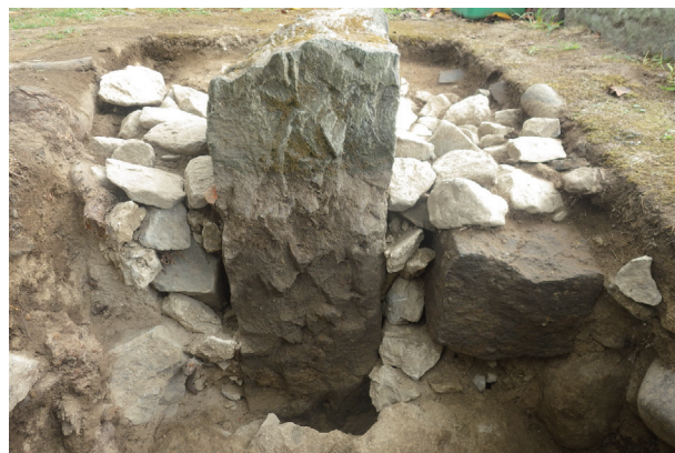
長堀トレンチ08 土層堆積状況(西から)