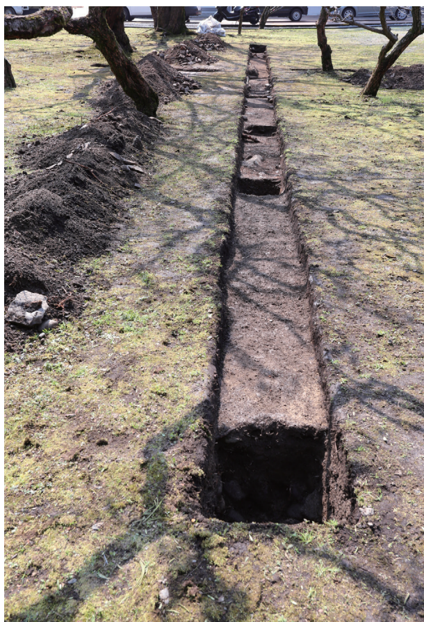
飯田丸トレンチ01-① 全景(北から)