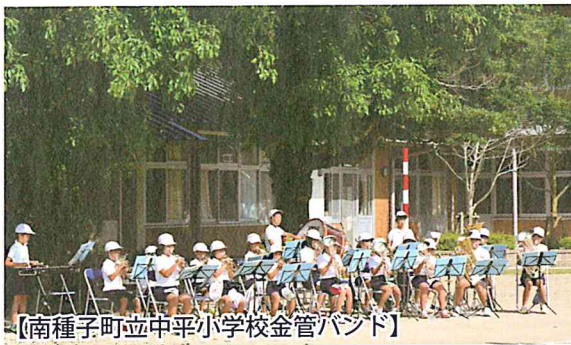
【南種子町立中平小学校金管バンド】