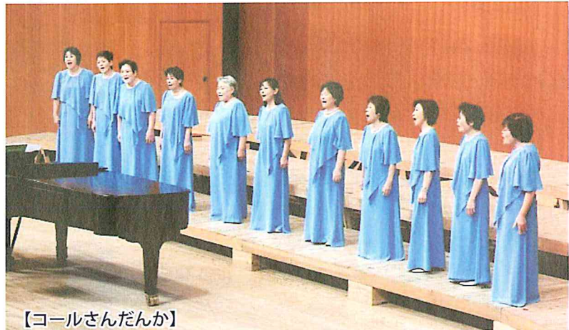
【コールさんだんか】

今回、国民文化祭のオープニングを務めるにあたり、南種子町のママさんコーラス、コールさんだんか、南種子町立南種子中学校吹奏楽部、南種子町立中平小学校金管バンドが合同公演することになりました。