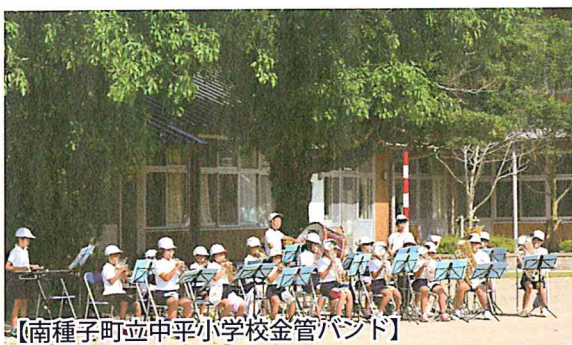
【南種子町立中平小学校金管バンド】