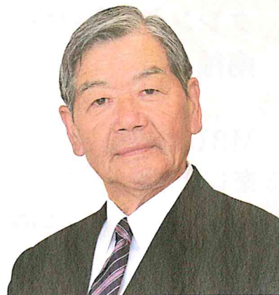
第30回国民文化祭 南種子町実行委員会会長

最後になりましたが、開催にあたり多くの方々にご支援、ご協力をいただきましたこと、心から感謝申し上げます。