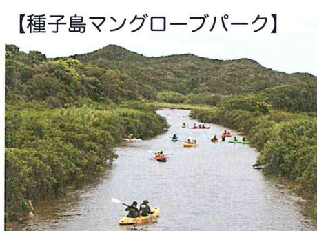
【種子島マングローブパーク】