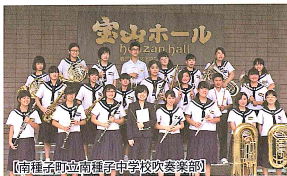
【南種子町立南種子中学校吹奏楽部】