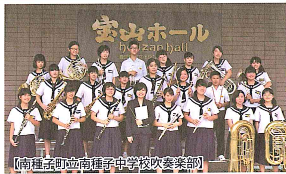
【南種子町立南種子中学校吹奏楽部】