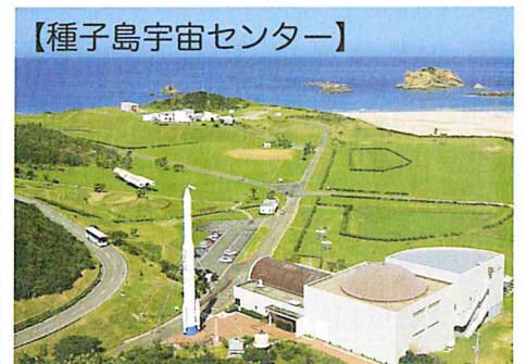
【種子島宇宙センター】