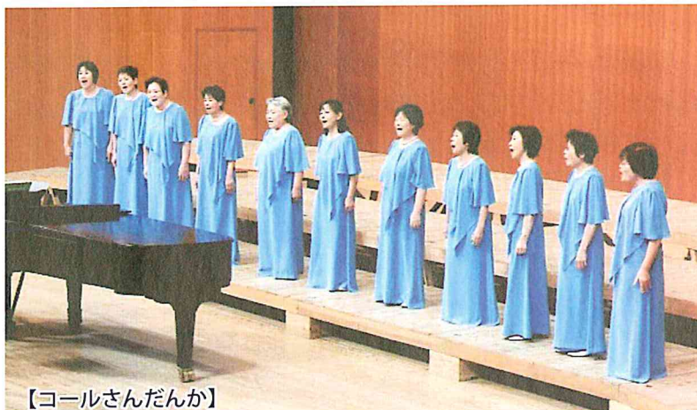
【コールさんだんか】

今回、国民文化祭のオープニングを務めるにあたり、南種子町のママさんコーラス、コールさんだんか、南種子町立南種子中学校吹奏楽部、南種子町立中平小学校金管バンドが合同公演することになりました。