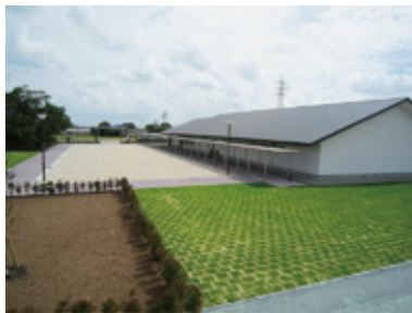
移動販売車の販売エリア