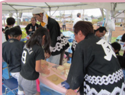
恐竜鬼瓦作りの様子