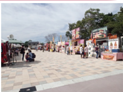
キッチンカーによる飲食品の販売