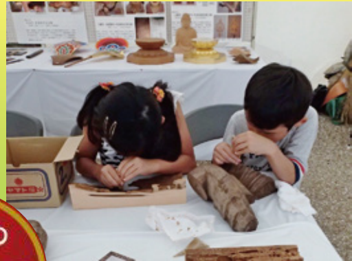
仏像の虫損修復体験