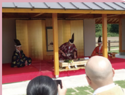
四條流庖丁儀式の実演

イベント当日は、(一社) 三重県技能士会主催の「みえ技能祭 ものづくり子どもフェスタ」が開催され、野菜の飾り切りの実演や恐竜鬼瓦作りなどが行われました。また、さいくうマルシェも開催され、手作りの雑貨やアクセサリなどの販売が行われました。