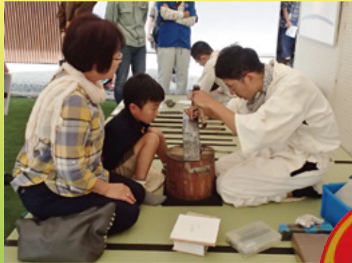
日本刀の作刀体験

イベントは文化庁の主催で、文化財の保存技術の大切さや、伝承者の養成、文化財の修理、原材料や道具などへの理解を深めることなどを目的に毎年全国を巡回して開催されています。