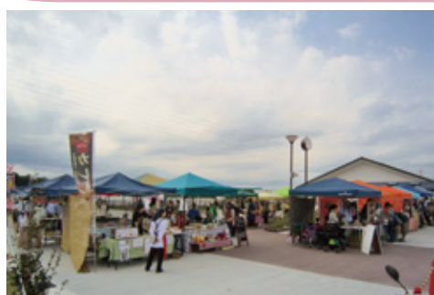
さいくうマルシェ

いつきのみや地域交流センターでは、一般の方でも、さまざまなイベントや物販などにご利用いただけます。利用の相談などお気軽にお問合せください。