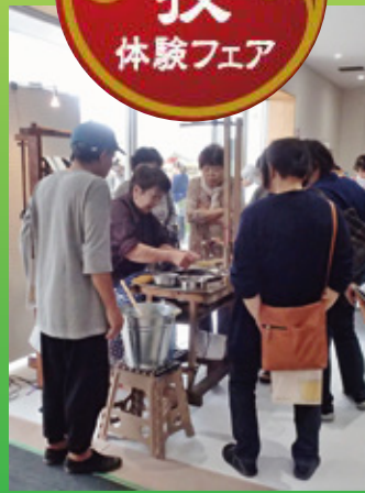
蕪玉からの製糸行程の説明