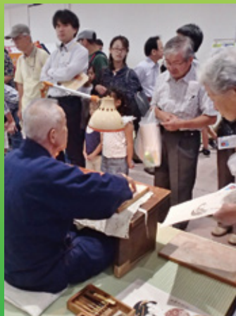
浮世絵木版画の製作説明