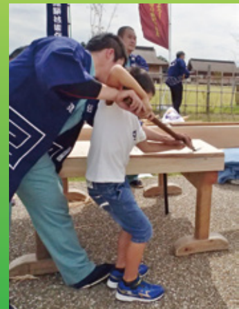
ヤリガンナの使用体験

会場では、浮世絵木版画彫摺技術保存協会による浮世絵木版画の彫り・摺りなど、熟練の技が披露されました。また、実際に「匠の技」を体験するコーナーでは、琉球藍製造技術保存会によるバンドナの藍染体験など、技術者から教わりながら多くの方に参加いただきました。その他、技の解説や保存団体の活動を紹介するパネルや原材料・道具等の展示も行われました。