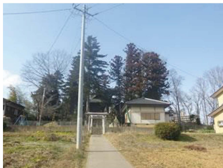
写真① 宮ノ下古墳の状況

この宮ノ下古墳で注目されるのは、社殿がのる高い墳丘の東側に一段低い前方部のような高まりがあることである。そこには石碑が建てられるなどして改変が大きく、確証はもてないものの、これが前方部だとすれば全長60mほどの前方後円墳か前方後方墳の可能性はある。