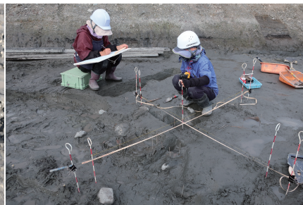
出土した土器を図面に描き込む