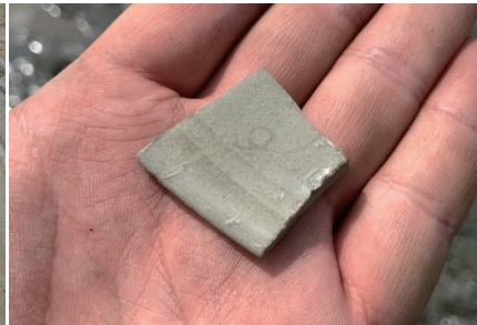
出土した中世の青磁