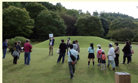
古墳にちなんだクイズは、親御さんはもちろんお子さんにも人気で、古墳に大コーンなイベントになりました。