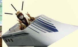
リニア速いな速いなリニア