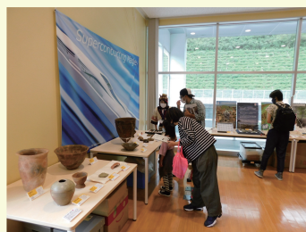
山梨県立リニア見学センターでは県内外の方々に埋蔵文化財は身近なものと感じてもらえました。