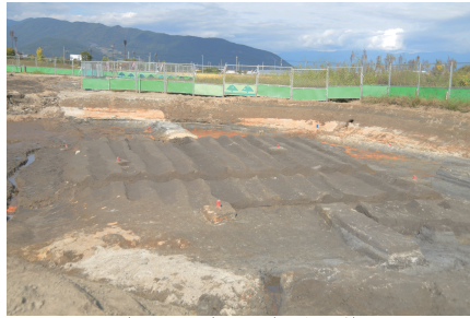
発掘された中世以降の畑の畝

山梨県小瀬スポーツ公園の南側、笛吹川と濁川の合流地点の西側にあり、昔から川の氾濫が多い地域にあります。この遺跡では、畦状の高まりの上で畝がいくつも作られている遺構が発見されました。