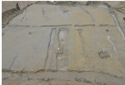
発掘された室町時代の畑の畝

遺跡は山梨県小瀬スポーツ公園の近くにあり、今の地面より約5m下から室町時代の畑の畝や炭をおこした跡といった遺構、北宋銭、かわらけ、なかでも当時の高級品である青磁や白磁が発掘されました。周辺には中世の土豪屋敷と伝わる場所が複数あり、青磁や白磁が出土していることから有力者との関係性がうかがえます。