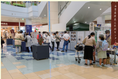
ラザウォーク甲斐双葉では買い物にいらした方々にも縄文の魅力伝える良い機会となりました。