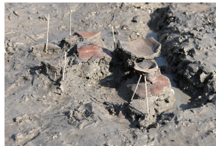
古墳時代後期・終末期の土器が出土した様子

中央市の JR 身延線小井川駅のすぐ西側で令和2年に新たに発見された遺跡です。遺跡は、水が湧く低湿地であり、ここから1,800点を超える古墳時代後期・終末期(6世紀~7世紀)の土器片や同時代のカマドの跡などが見つかりました。