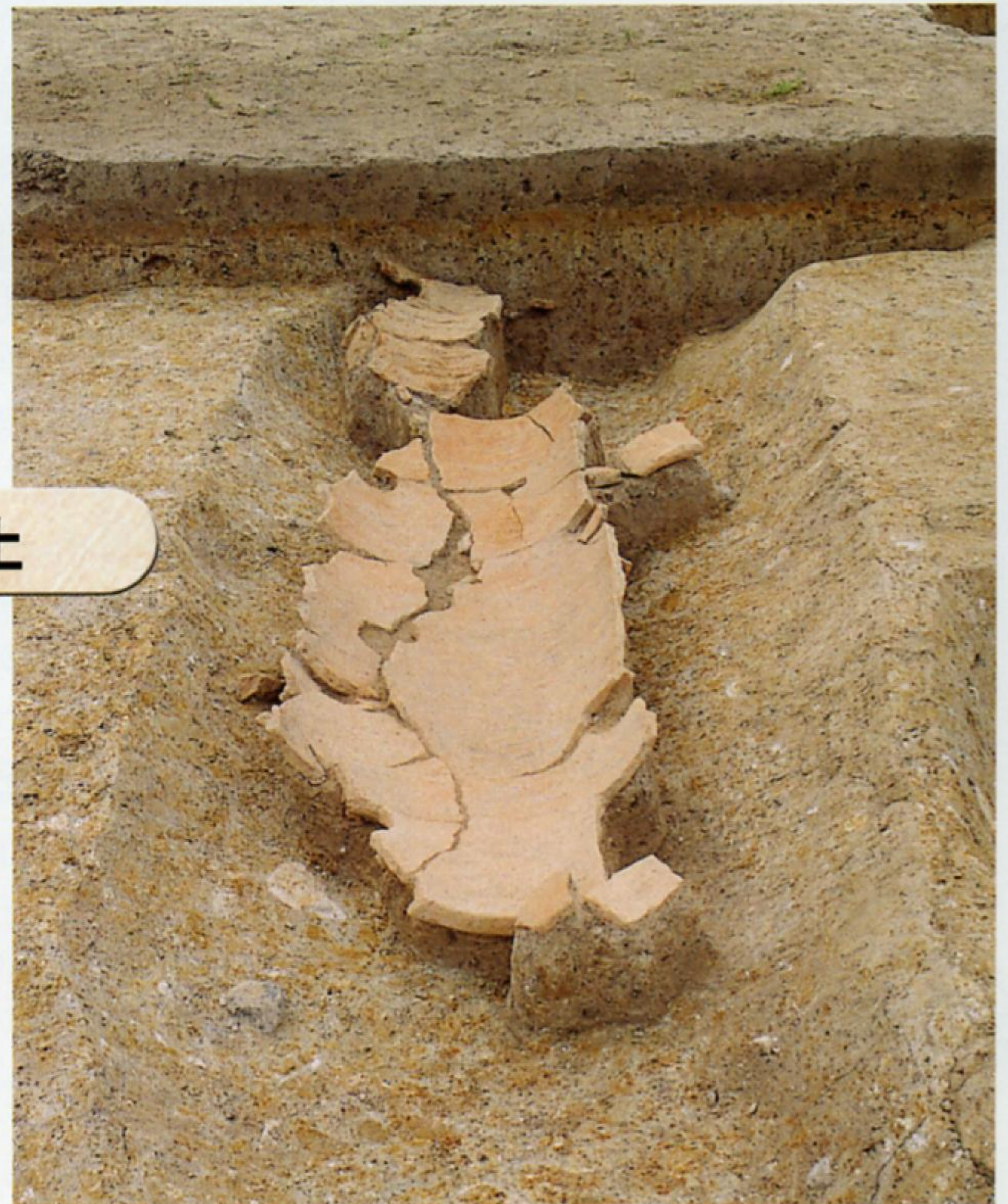
▲古道跡から出土した円筒埴輪