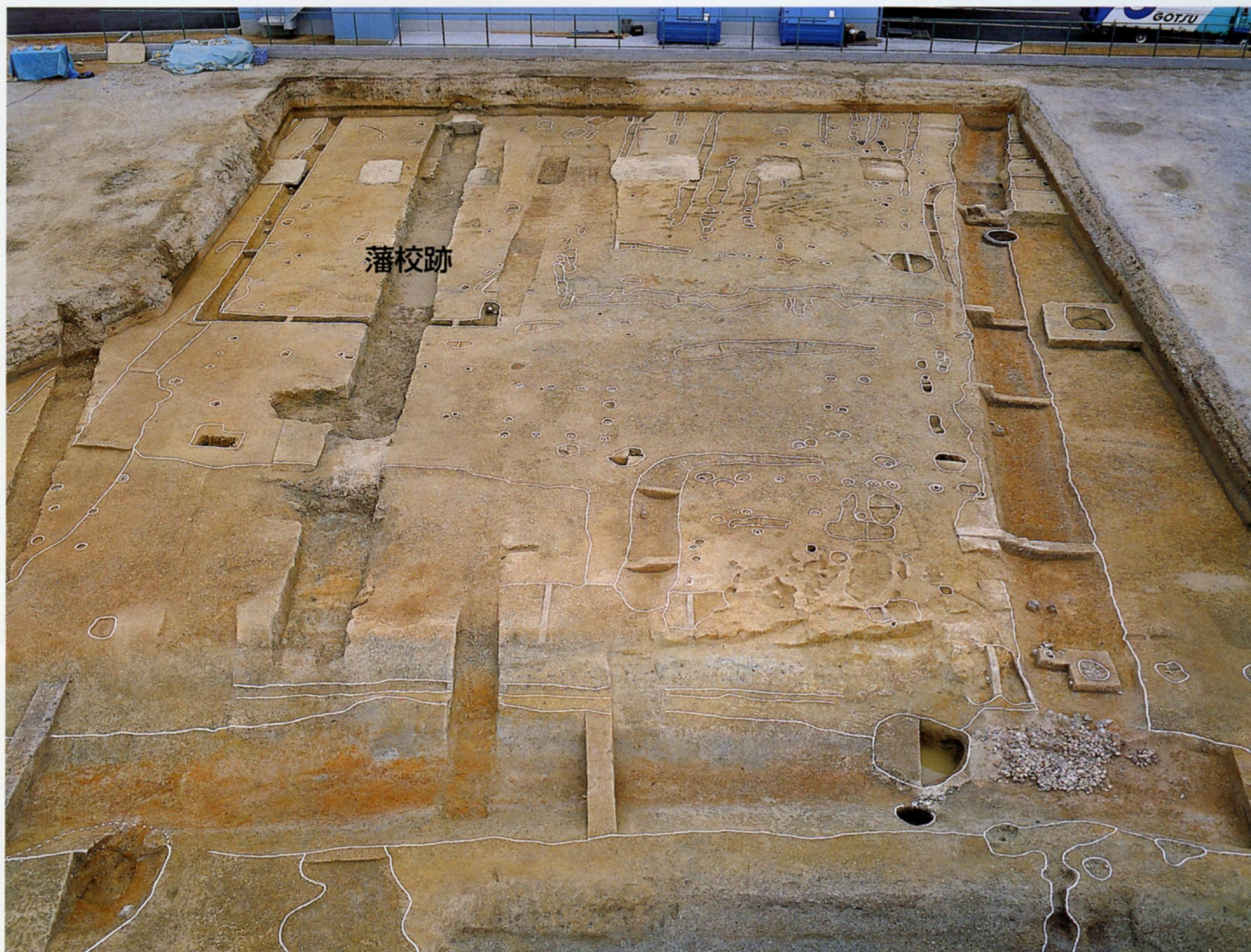
▲発掘調査地区全景