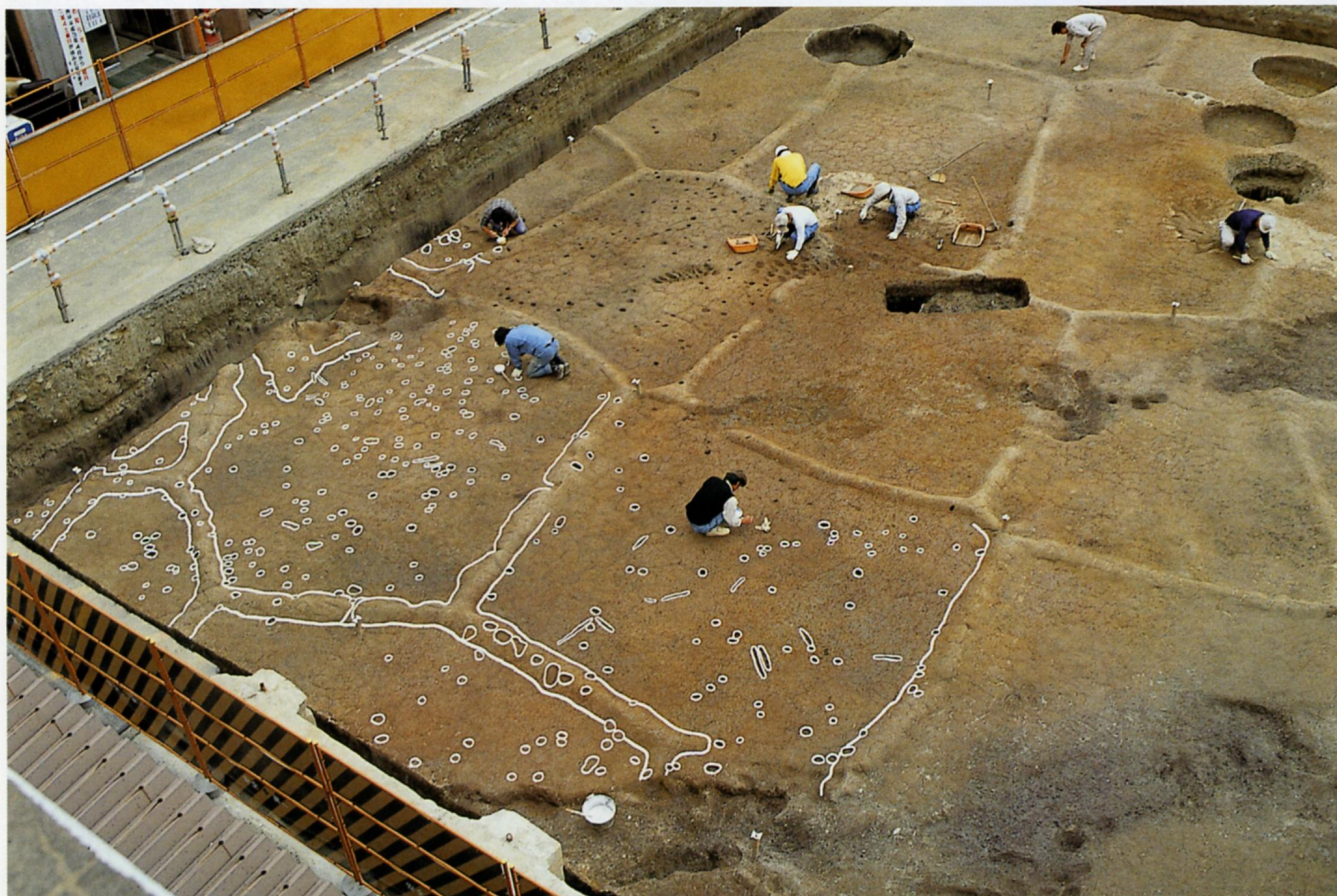
▲上田町遺跡で見つかった弥生時代後期の水田跡（約1800年前）