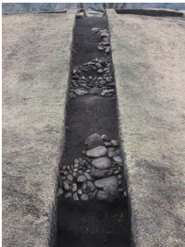
写真3 西都原115号墳 4トレンチ 葺石検出状況（東から）