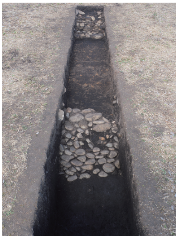
写真5 西都原115号墳 6トレンチ 葺石検出状況（南西から）