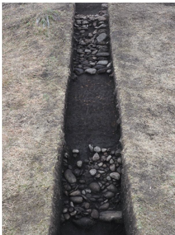
写真2 西都原115号墳 3トレンチ 葺石検出状況（北から）