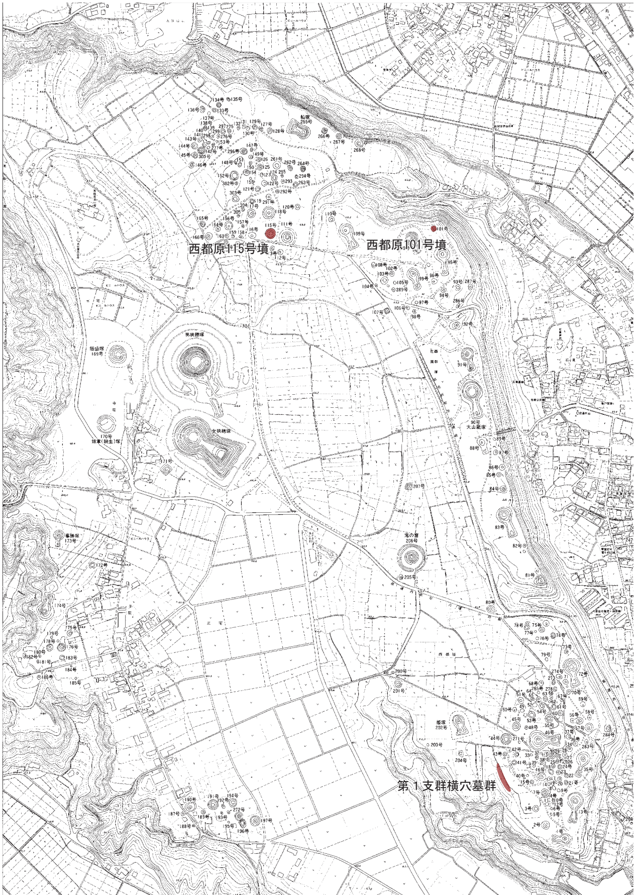
第1図 発掘調査・復元整備古墳の位置図