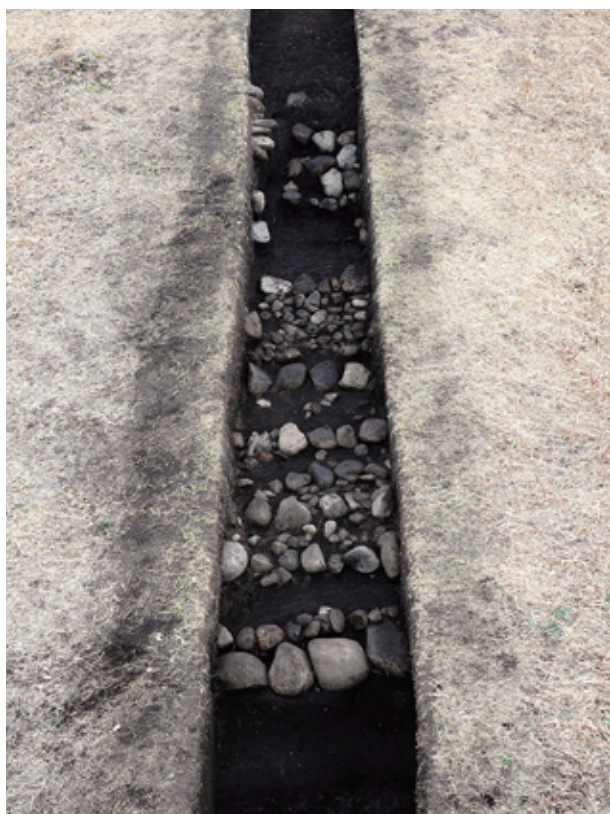
写真4 西都原115号墳 5トレンチ 葺石検出状況（南から）