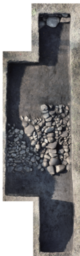
写真6 西都原115号墳 7トレンチ 葺石検出状況（オルソ画像）