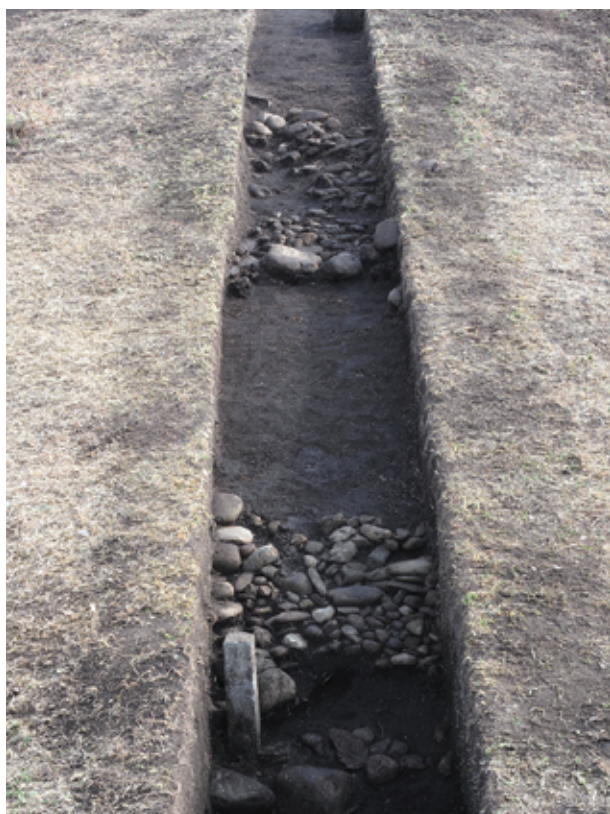
写真1 西都原115号墳 2トレンチ 葺石検出状況（西から）