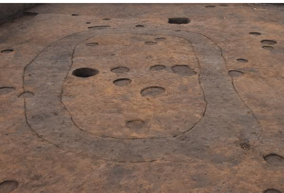
周溝状遺構検出状況

調査区西側では溝が円形に巡る周溝状 遺構が2基確認されました。1つは長軸7.4 m、短軸4.6mの大きさで「0」のような楕円形 をしています。もう1つは大きさは不明ですが、 調査区北端で遺構の一部を確認しました。