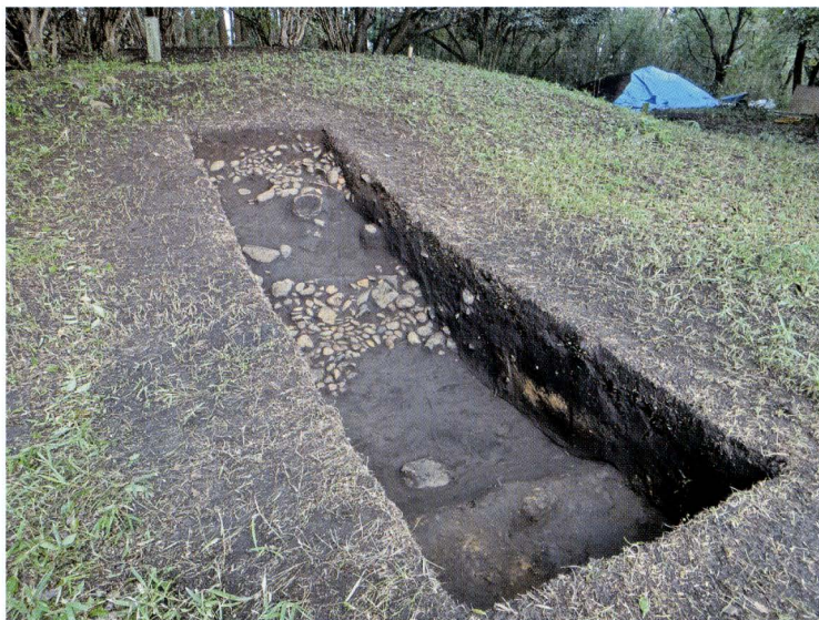
写真8 101号墳トレンチ2全景 (南東から)

墳丘南西面。台地の落ち際とは反対方向に当たる。葺石は小さく、配置も不規則である。基底石も明瞭ではない。テラス部で円筒埴輪が出土した。