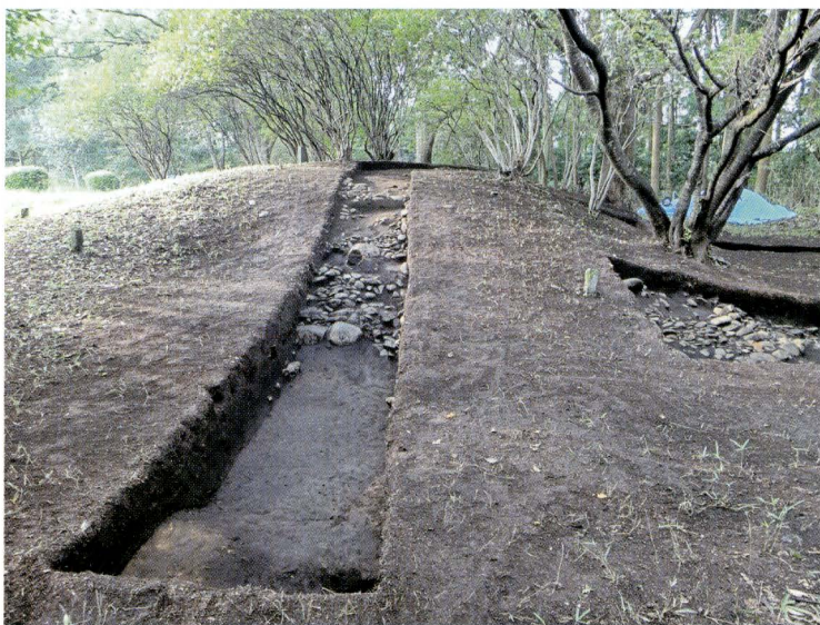
写真9 101号墳トレンチ3全景 (東から)

墳丘南東面。基底石には大ぶりの石材を用いているが、葺石の配置は不規則である。テラス部で円筒埴輪が出土した。