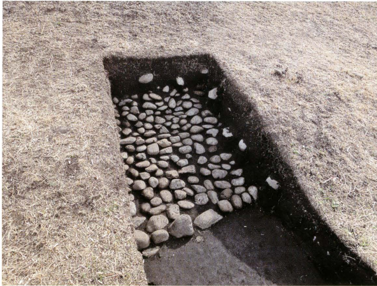
写真4 265号墳トレンチ13葺石検出 状況（北から）

現時点では、葺石の残存状態が最も良好な箇所である。基底石は縦向きに埋め込まれている。