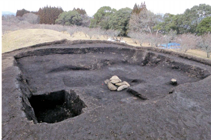
写真2 265号墳トレンチ12葺石検出 状況 (東から)

後円部墳頂で大正調査坑を検出した。再発掘の結果、後円部のほぼ中心で大正時代に埋設された碑石が出土した。碑石は大ぶりの円礫9点で被覆されていた。その他に埋土中から鉄製品の破片や玉類が見つかった。