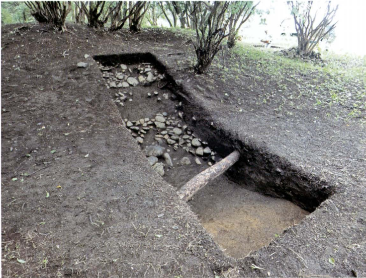
写真10 101号墳トレンチ4全景 (北から)

墳丘北西面。葺石の残存状態は良くないが、二段目の基底石は揃っている。基底石は石材の小口を揃えるようにして並べられる。テラス部で鍔付壺形埴輪が出土した。