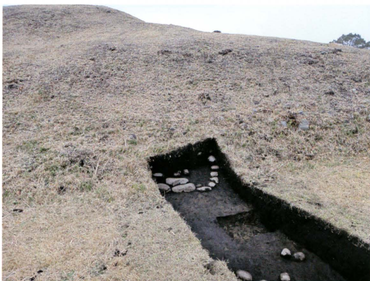
写真3 265号墳トレンチ13・15全景 (北西から)

前方部左側。墳裾に葺石が残存するが、状態は良くない。周溝は浅く、地表下約70cmで底面となる。周溝の外側にも緩やかな溝状の落ち込みがあり、二重目の周溝となる可能性がある。