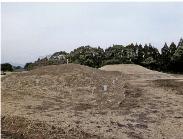
写真12 100号墳の工事状況

北東面、南東面間の隅角にあたる。大ぶりの石材の基底石がよく残り、隅角には区画列石も認められる。墳裾で短甲形埴輪が出土したほか、周溝内で小型丸底壺も複数見つかっている。短甲形埴輪や小型丸底壺の一部には、純層に近い鬼界アカホヤ火山灰が被っていた。