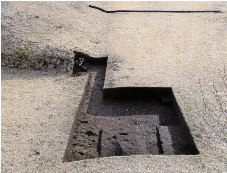
写真5 265号墳トレンチ14全景 （北東から）

現時点では、葺石の残存状態が最も良好な箇所である。基底石は縦向きに埋め込まれている。