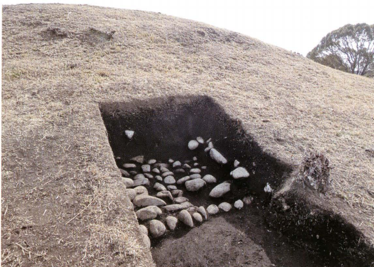
写真6 265号墳トレンチ15葺石検出 状況（北から）

前方部左隅角は、後世の畑地化により完全に失われている。周溝底面には多量の焼礫が顔を出しており、縄文時代早期の集石遺構が存在することが分かる。