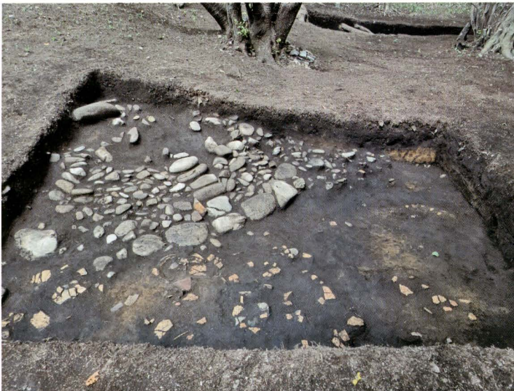
写真11 101号墳トレンチ5全景 (南東から)

墳丘北西面。葺石の残存状態は良くないが、二段目の基底石は揃っている。基底石は石材の小口を揃えるようにして並べられる。テラス部で鍔付壺形埴輪が出土した。