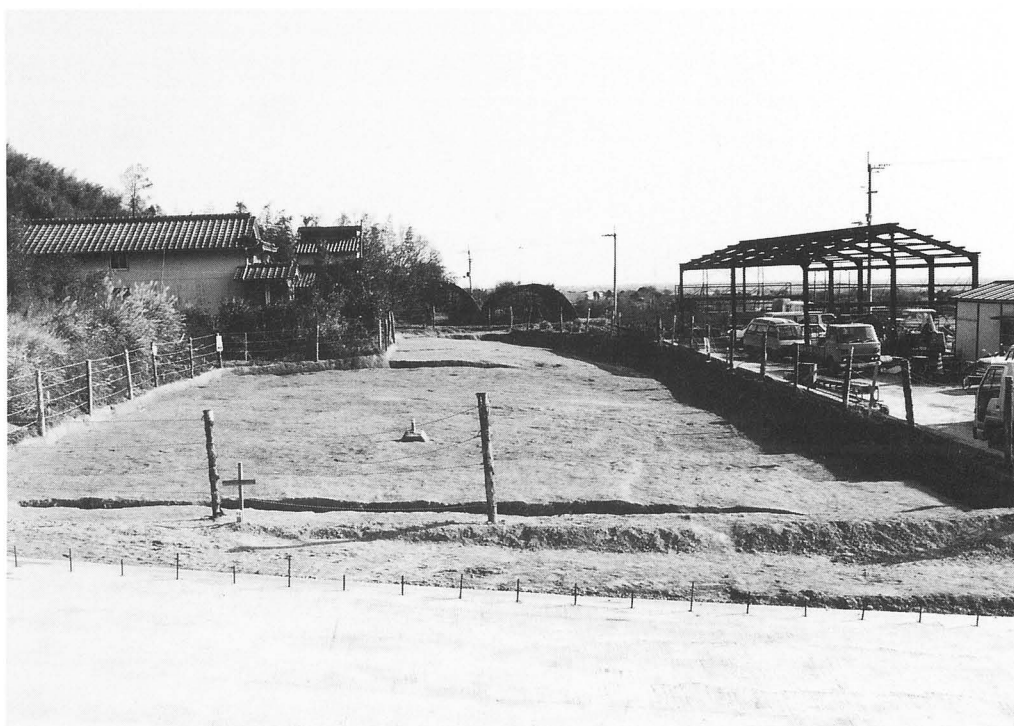
青谷遺跡 第8調査区完掘状況（西より）