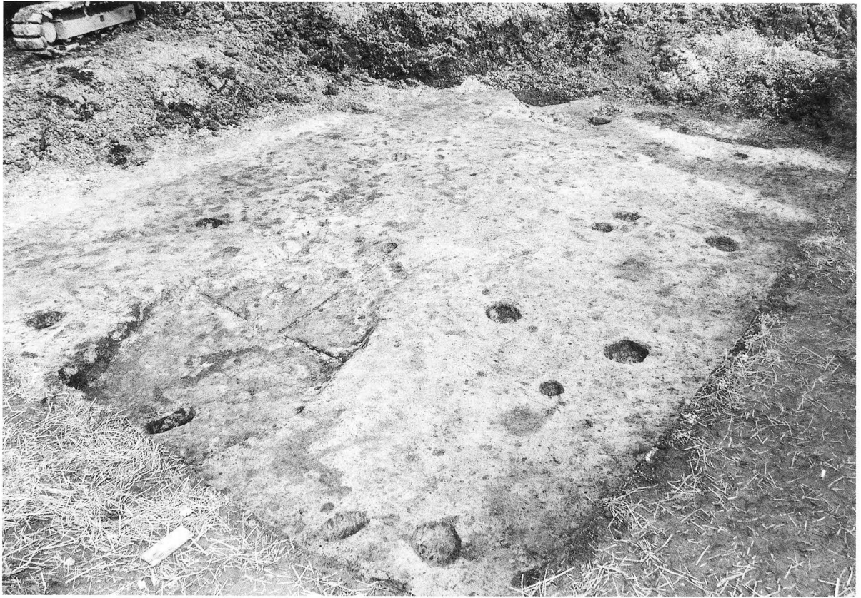
1. D地区完掘状況（南西より）