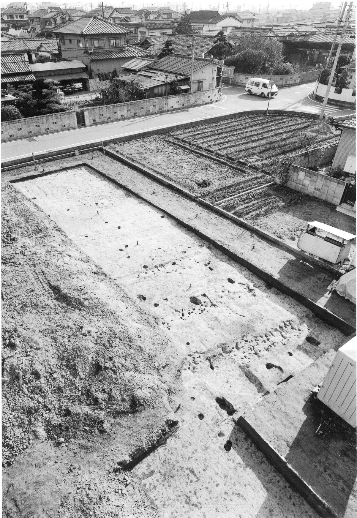
1. B・D地区完掘状況（北西より）