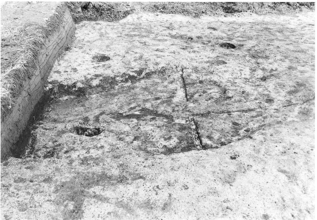
2. SK 1完掘状況（南より）