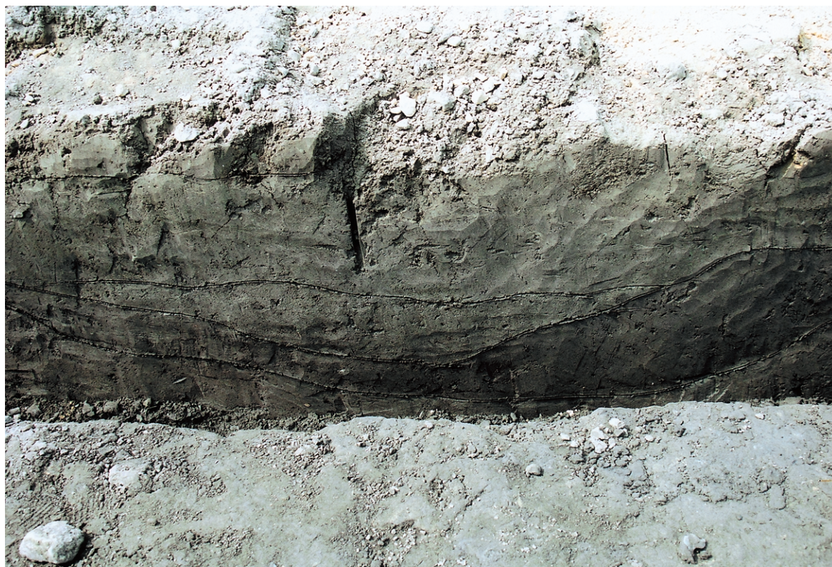
南区南壁セクション