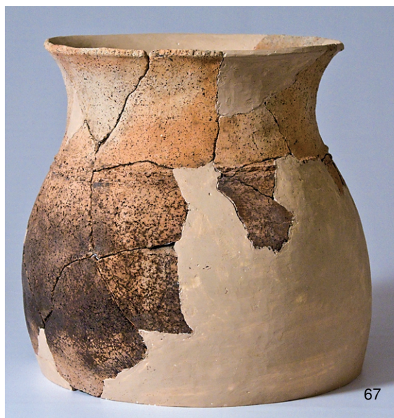
北区SK2 (2)、SK6 (14,18,23)、SD1 (44,48)、包含层 (67) 出土弥生土器