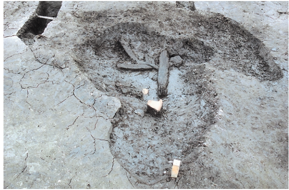
南区SK15 遺物出土状况