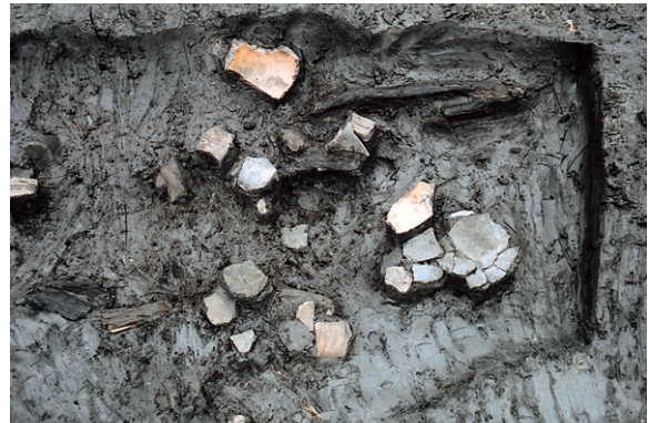
南区SD3 遺物出土狀況