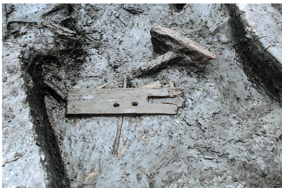
南区SX3 遺物出土狀況