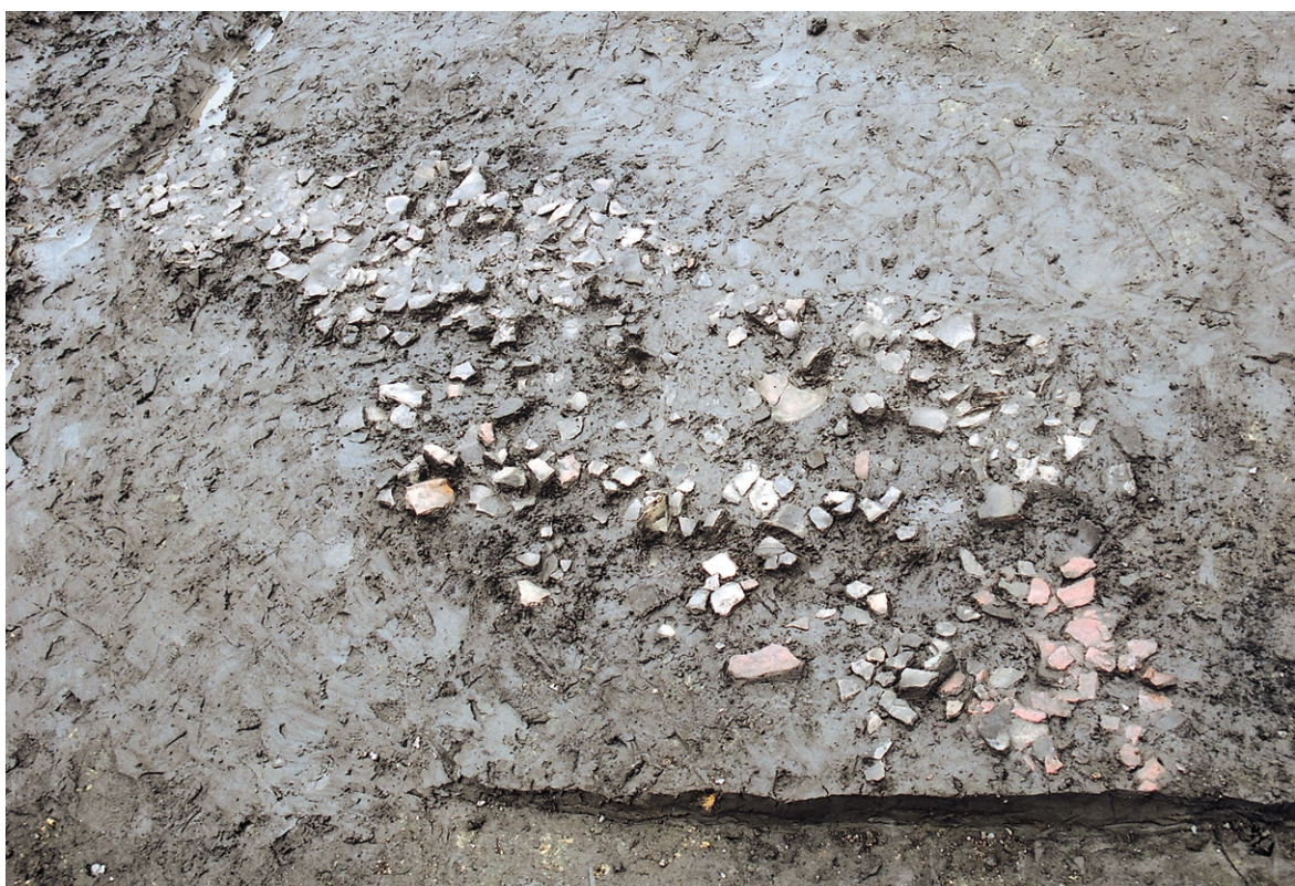
南区SK19 土器集中状况