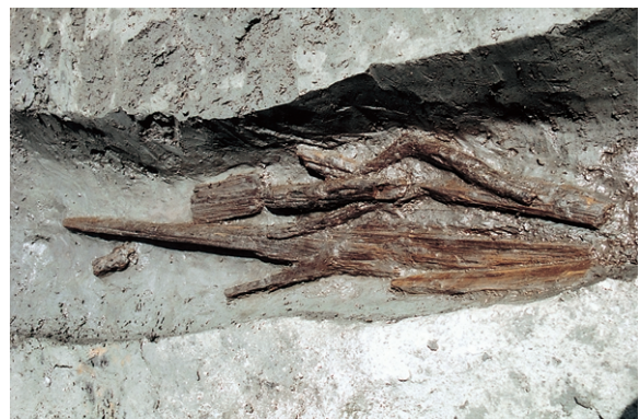
南区東斜面 遺物出土狀況