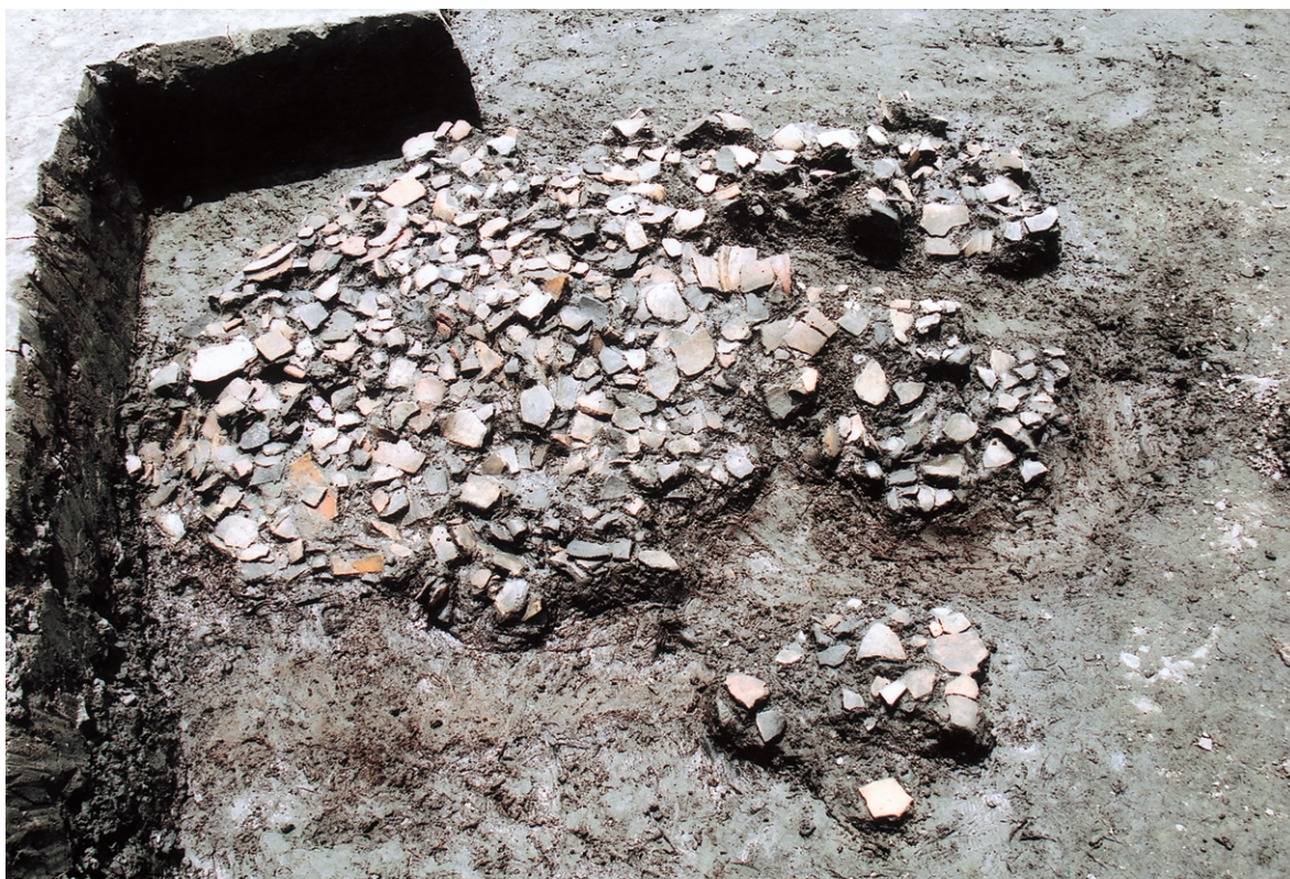
南区SK14 土器集中状况