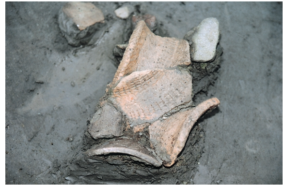
南区SK33 遺物出土狀況