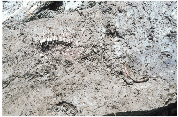
南区SK31 遺物出土狀況