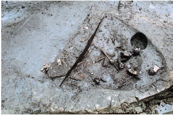
南区SK31 遺物出土狀況