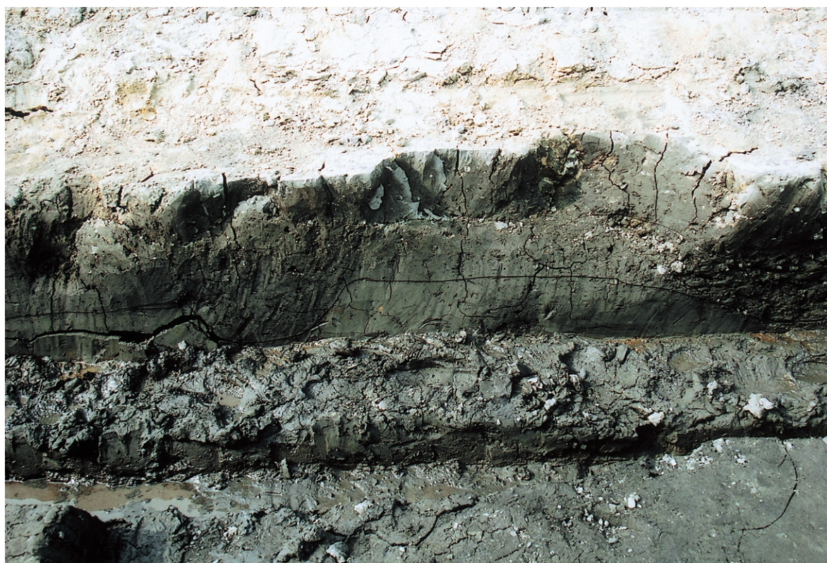
南区北壁セクション