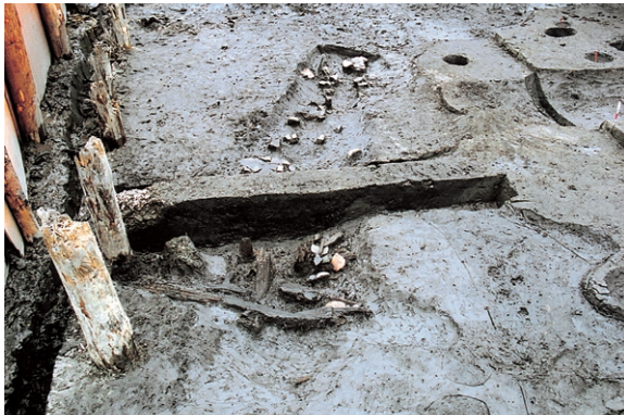
南区SD3 遺物出土狀況