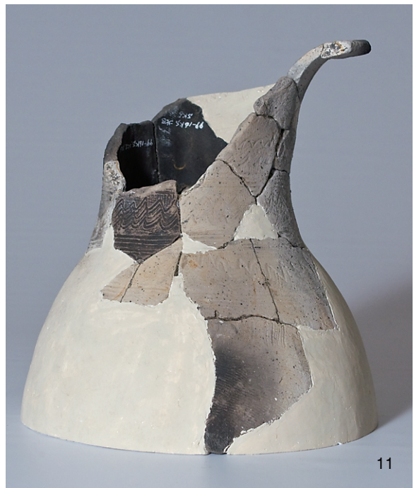
北区SK1 (1)、SK4 (10)、SK6 (11,12,15) 出土弥生土器