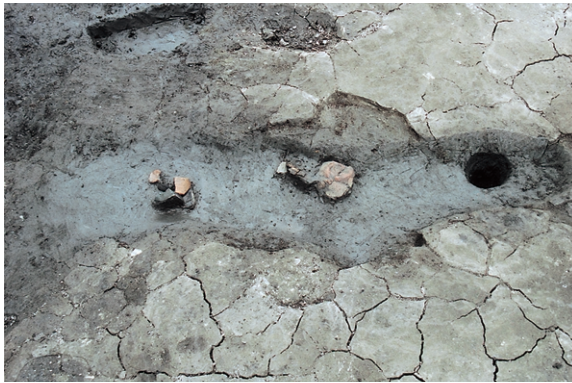
南区SK17 遺物出土状况