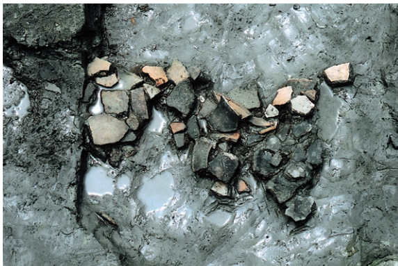
南区SK29 遺物出土状况