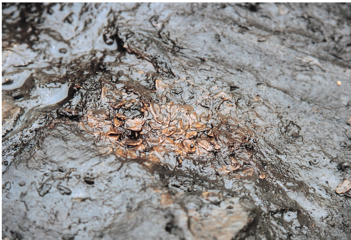
南区SK31 ウリ種子出土状況