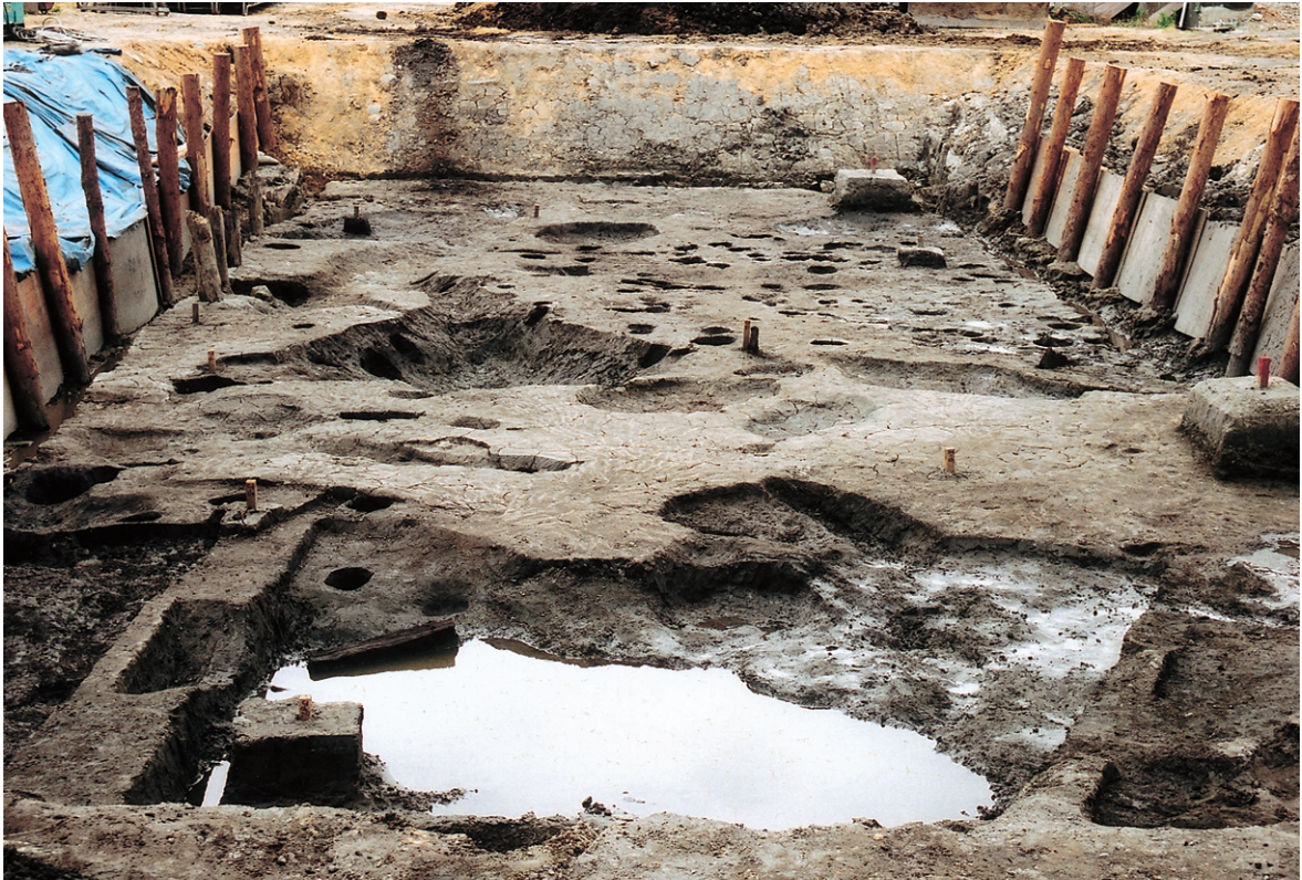
南区完掘状況（東から）