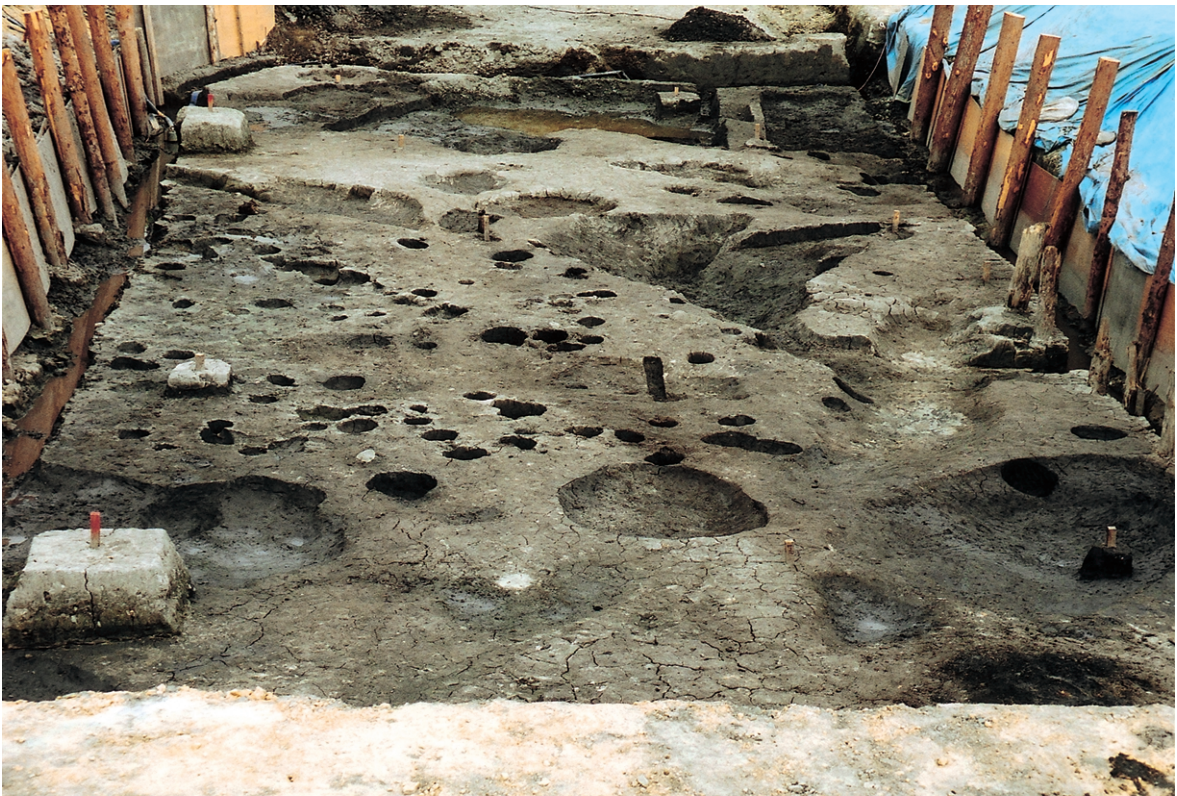
南区完掘状況（西から）