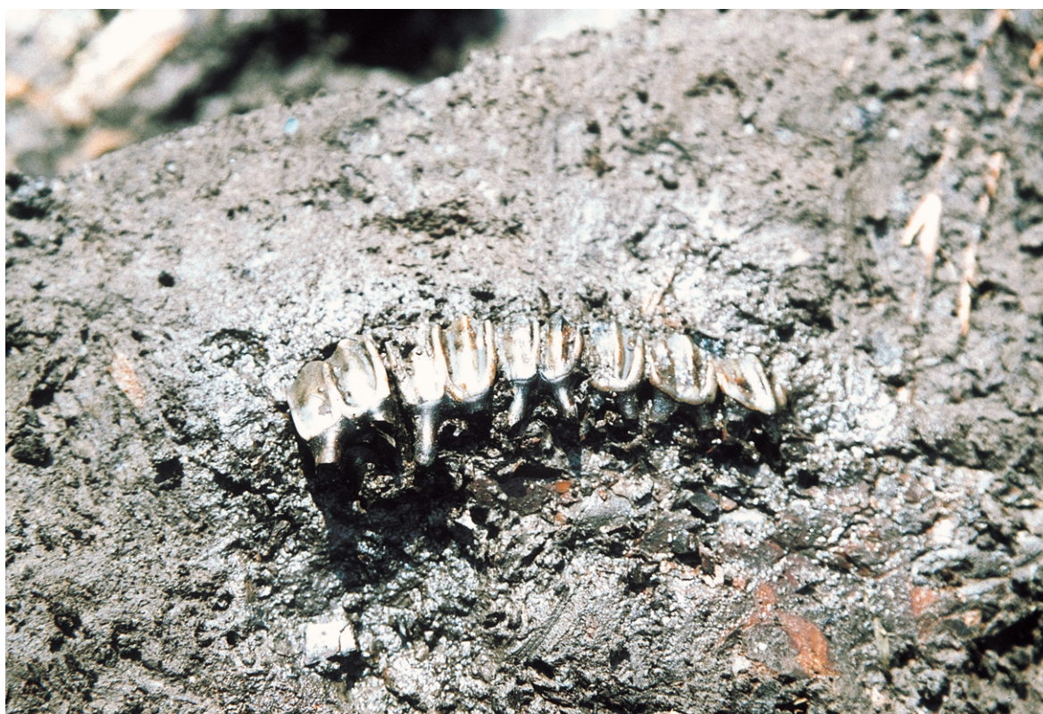
南区SK31 ニホンジカ臼歯出土状況