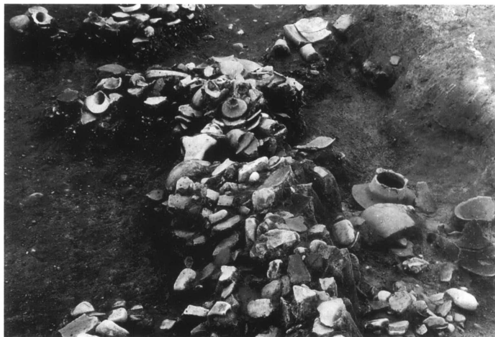
SD56 遺物出土状態 2