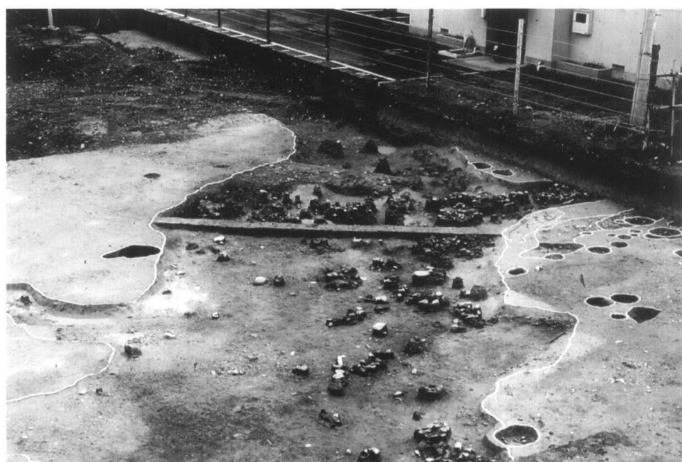
SD56 土器溜り 1