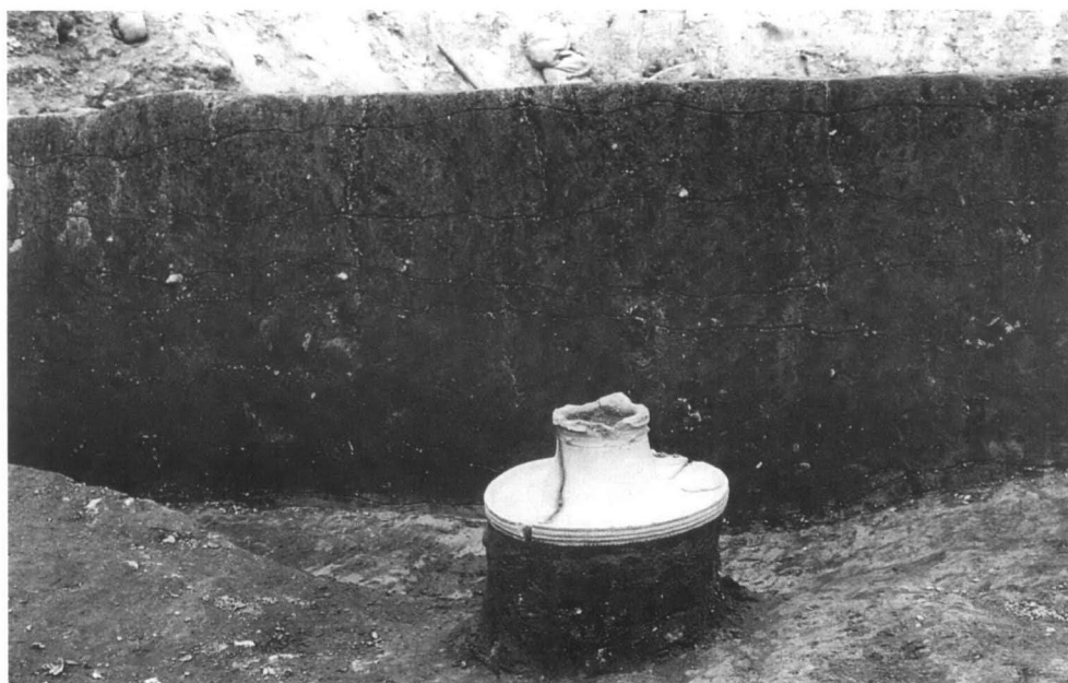
X区 SRx02 下層中位土器検出状態