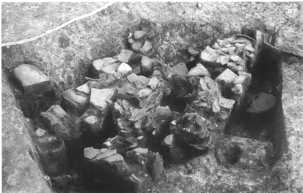
X区 SRx01 遺物出土状態