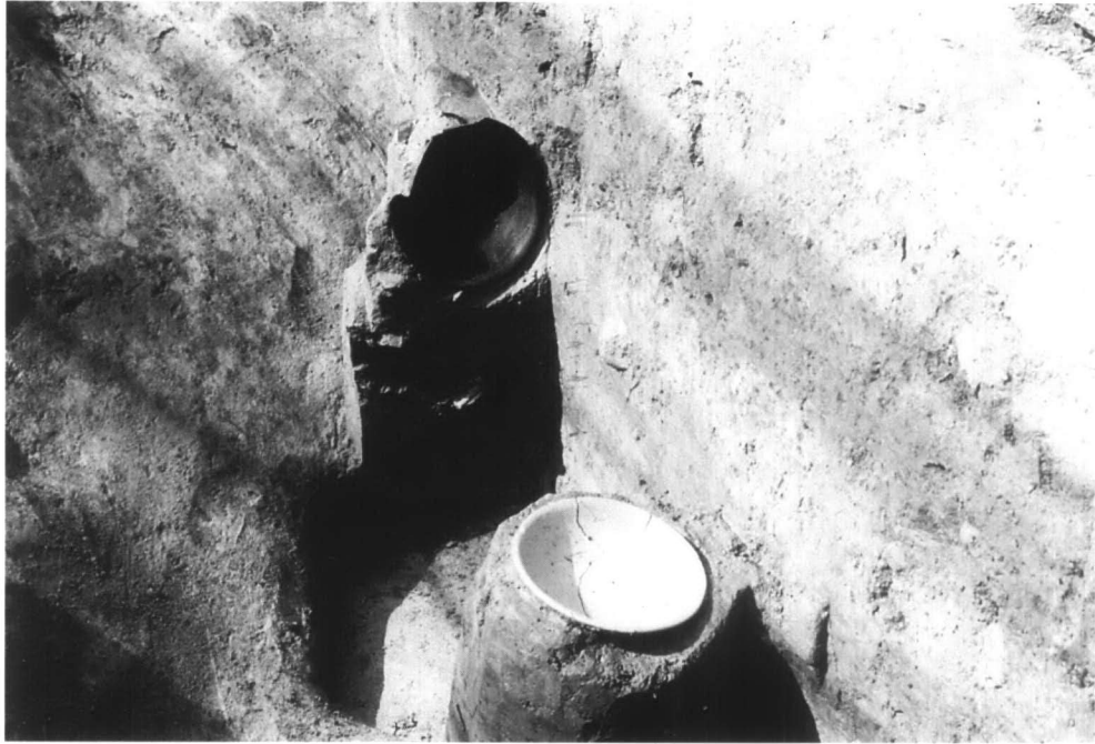
SD79 遺物出土状態 2