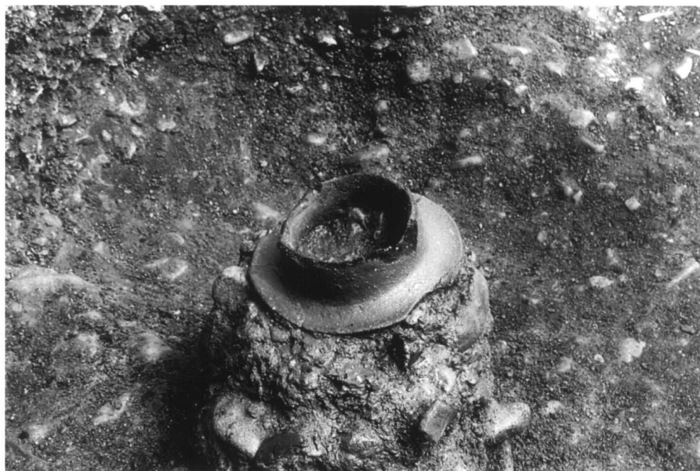
SD56 遺物出土状態 3