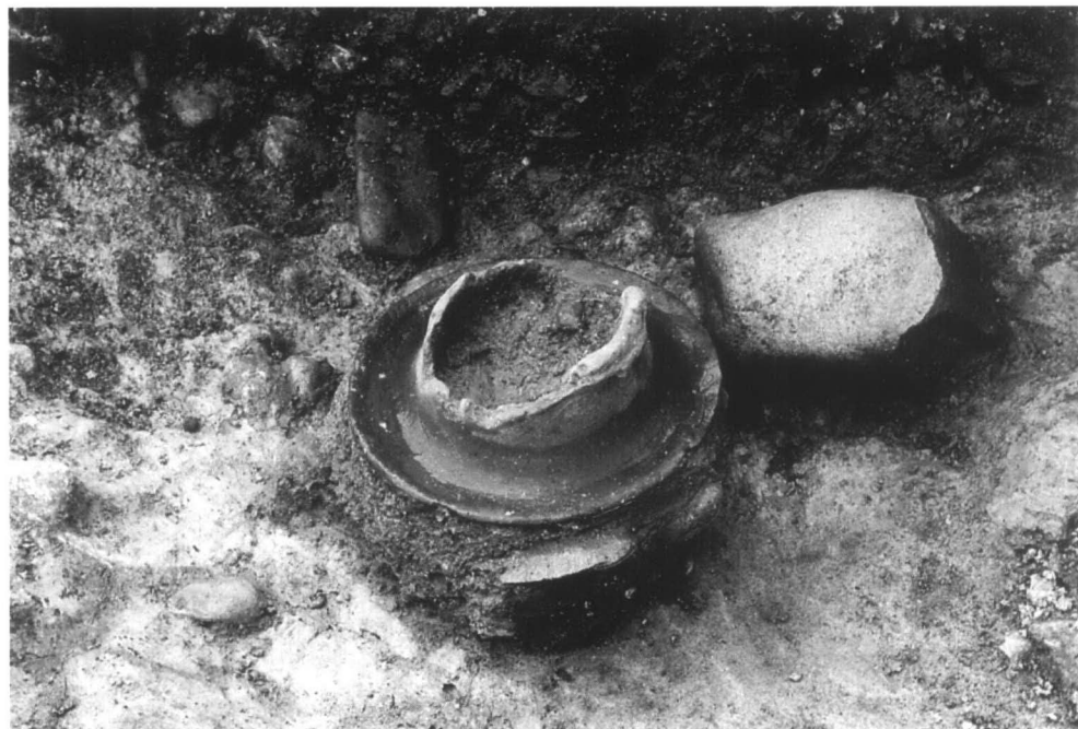
SR01 遺物出土状態 2