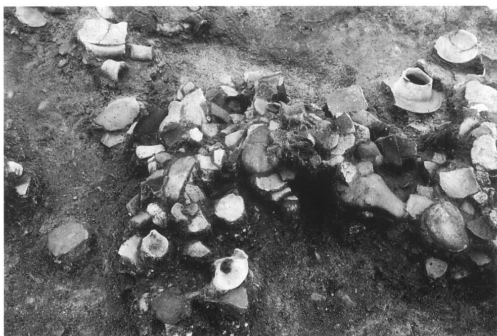
SD56 遺物出土状態 1