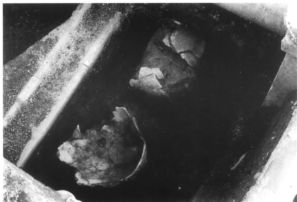
ST01 · 02