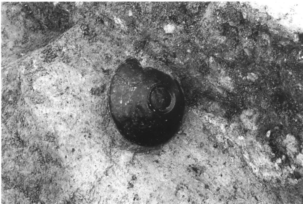
SD79 遺物出土状態 1