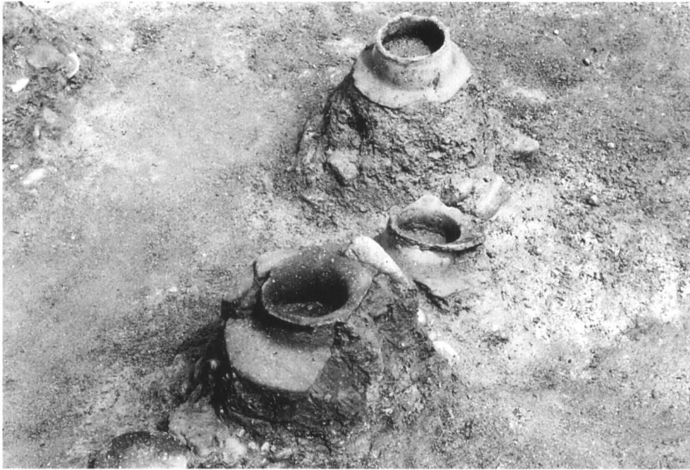
SD56 遺物出土狀態 4