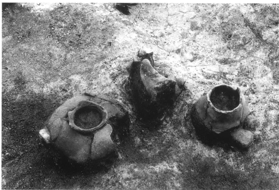
SR01 遺物出土状態 1