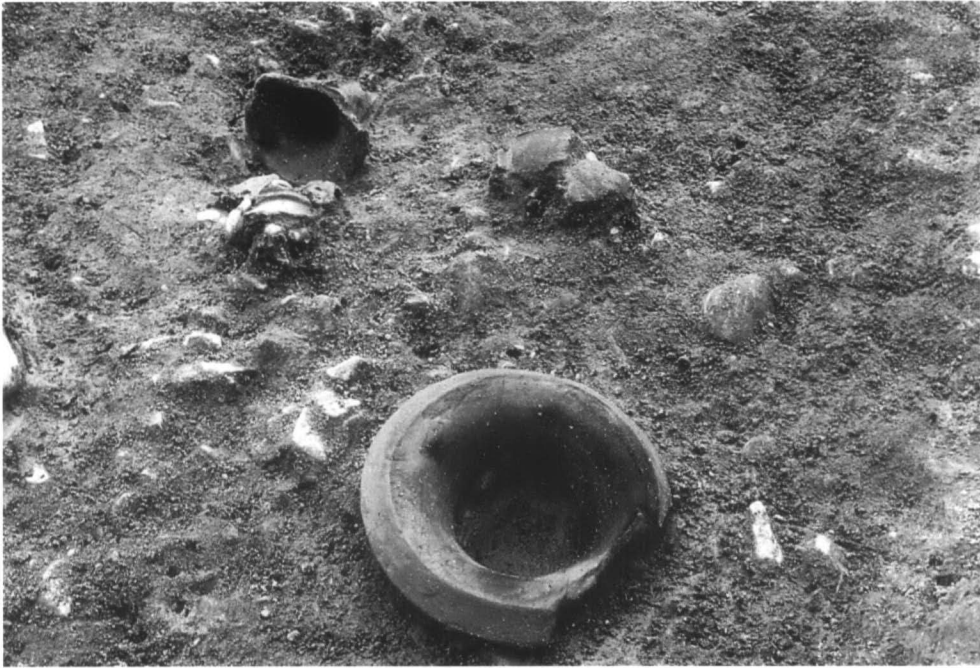
SD56 土器溜り 2