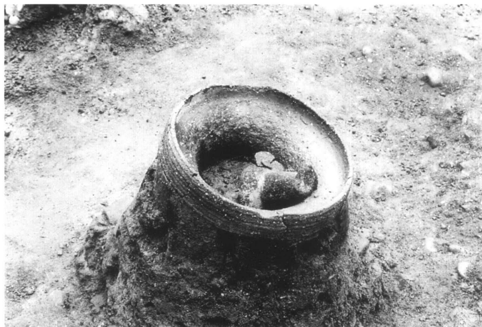
SD56 遺物出土状態 6