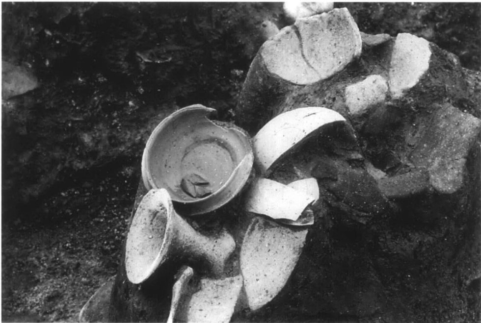
SD56 遺物出土狀態 5