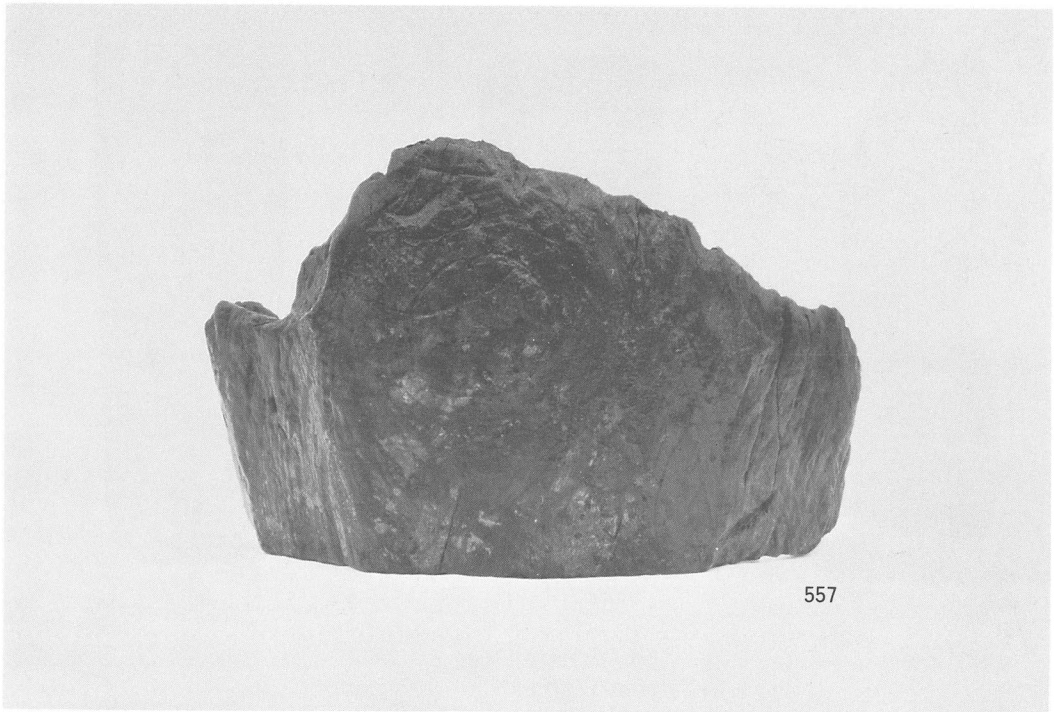
SE 3 井筒